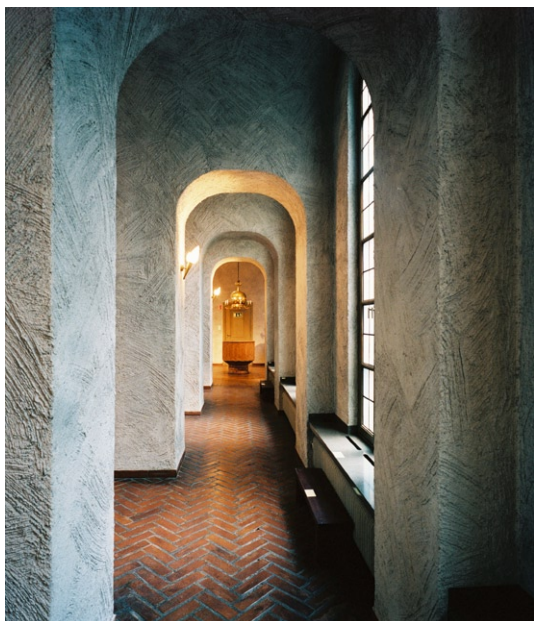
Det östra sidoskeppet med dopfunten i fonden.

Sidoskeppen är uppdelade i sektioner med ett fönster i varje. En bågformig öppning mellan