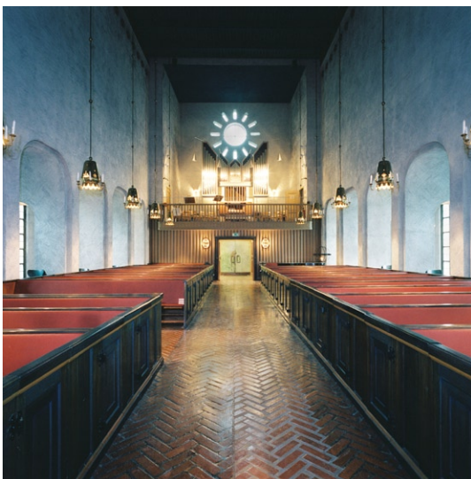
Kyrkorummet mot orgelläktaren.

(1892–1988) var ursprungligen avsedd för Karolinska sjukhusets kapell och är deponerad i Essinge kyrka sedan 1988. Cyrillus Johansson ville ha en enkel målning bakom altaret och de