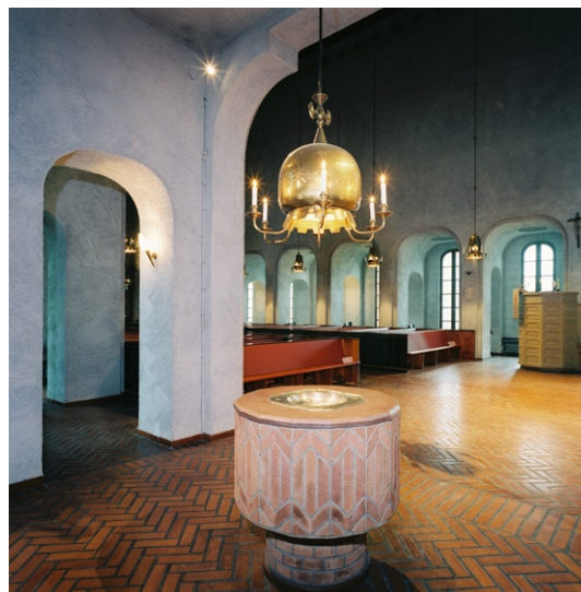
Dopfunten i doprummet. Till höger syns predik- stolen i kyrkorummet.

varje sektion binder dem samman och bildar i väster Meditationsgången och i öster Dopgång- en. I Dopgångens norra ände står dopfun- ten i doprummet, som är öppet mot mittskep- pet närmast koret genom en stor valvbåge. Dopfunten är mönstermurad av handsågat tegel med en kalkstensskiva på där dopskålen av silver placeras. Över dopfunten hänger en takkrona snarlik de i mittskeppet. I doprummet står även en kororgel byggd av Åkerman & Lund 1976.