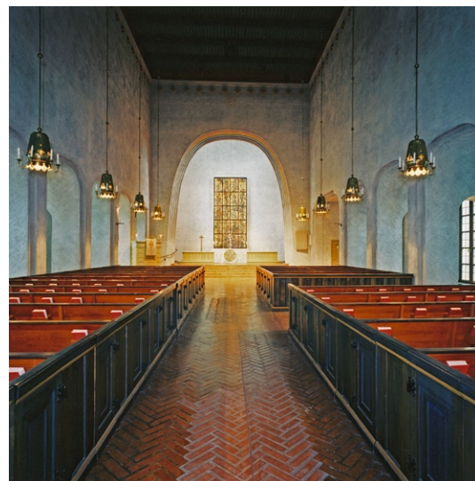
Kyrkorummet mot koret .

Vapenhuset , som är smalare än kyrkans mittskepp, är flankerat av ett trapphus i väster och en hall med utgång åt öster. Golvet är av kalksten och väggarna är av rött tegel. Dörrarna är liksom i övriga kyrkan av trä, laserade och har fyllningar. Kyrkorummet består av ett högt mittskepp och två lägre sidoskepp. Mittskeppet ger ett relativt mörkt intryck med indirekt ljus från sidoskeppens fönster och från korfönstren . Golvet är belagt med fiskbenslagt tegel. Mitt-