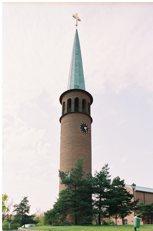
Exteriör med klocktornet från sydost.

den, vilken i söder avgränsas av en låg stenmur. Anläggningen är småskalig och ger en intim karaktär. På den gräsbevuxna gården växer tallar och på sina håll ligger kala klippor. Gångarna som leder över gården och den plan framför stentrappan som leder till kyrkporten är asfalterade. Enligt Cyrillus Johanssons tävlingsförslag var gårdsplanen tänkt bl a för friluftsgudstjänster och som lekplats. På den södra delen av gården står det fristående runda klocktornet av tegel som kröns av en kopparklädd spira med ett förgyllt kors på toppen. Muren närmast spiran är uppbruten i rundbågiga öppningar med tolv murpelare emellan, vilka symboliserar de tolv apostlarna.