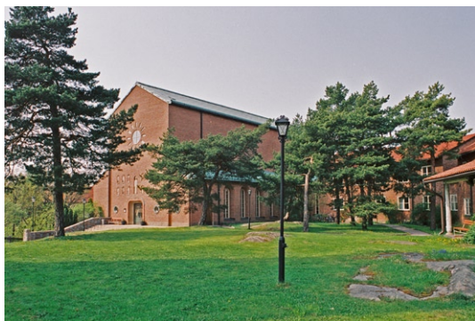
Exteriör från sydost med församlingsbyggnaden i öster.

I direkt anslutning till kyrkan ligger församlingsbyggnaden. Den 1–2-vånga byggnadens olika delar skiljer sig åt genom olika typer av takfall och fönstersättningar. En omgärdad gård bildas mellan kyrkan och församlingsbyggnaden,