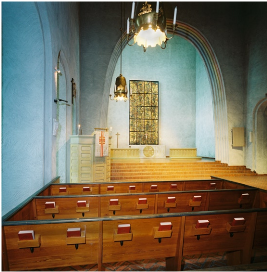
Kyrkorummet mot koret med predikstolen till vänster.

(1892–1988) var ursprungligen avsedd för Karolinska sjukhusets kapell och är deponerad i Essinge kyrka sedan 1988. Cyrillus Johansson ville ha en enkel målning bakom altaret och de