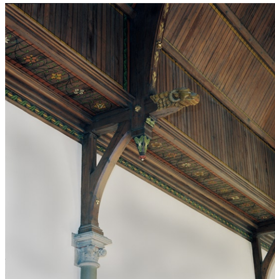
Detalj av delvis bemålat trätak.

Väggarna är putsade och numera vitmålade. Liksom taket var de ursprungligen försedda med dekorativt måleri av konstnären Agi Lindgren (1858–1927). De stora rosettfönstren med sina glasmålningar i kraftfulla färger är ut-