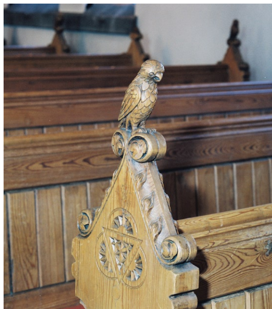
Detalj av skuren dekor på bänkgavel.

Altaruppsatsen, också i furu med delvis förgylld dekor, har en utformning i nygotik med bl a ett centralt sakramentskåp . Detta är sekundärt försett med ett litet förgyllt kors med mörkbet sad ek som bakgrund. Den lätt rundade altarringen är av furu och utformad i samklang med den stora altaruppsatsen vilket även predikstolen är, placerad norr om triumfbågen . Högt upp på korets norra vägg finns en liten läktare med balustrad, delvis dekormålade i klara färger. Möjligen var läktaren ursprungligen avsedd för sekundchefen och/eller kungen.