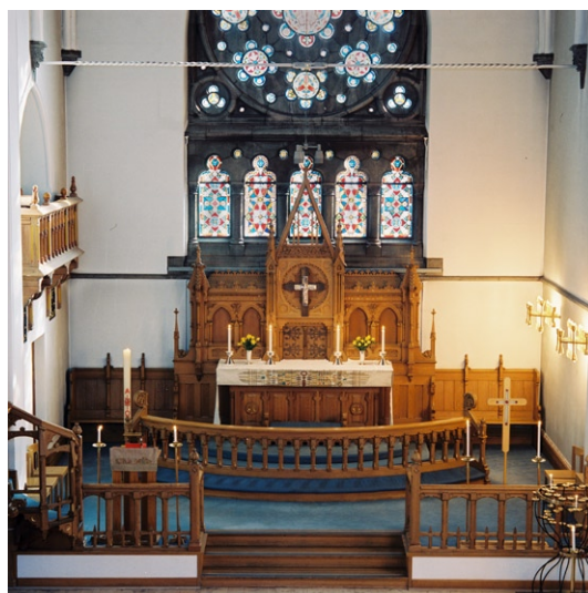
Koret med liten läktare till vänster.

I sidoskeppet finns längst i öster ett sekundärt träaltare med förgylld dekor. Som altartavla fungerar här Joakim Skovgaards målning från