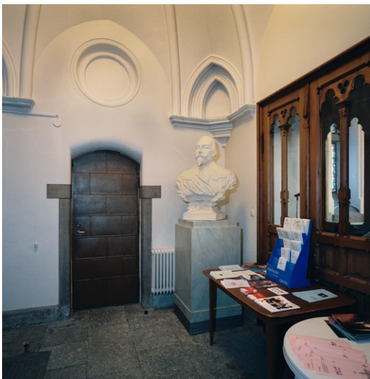
Vapenhuset med bl a Gustaf II Adolfs byst.

Vapenhuset i väster har vitmålat valv och kalkstensgolv och är försett med en byst av Gustaf II Adolf. Glasade pardörrar leder in till sidoskeppet respektive huvudskeppet. Kyrkorummet domineras av det mörka trätaget, som reser sig över huvudskeppet. Det har enstaka delar av den ursprungliga dekormålningen bevarad och dekorativt utformade konsolstöd av trä med avslutning i form av skulpterade huvuden i sten.