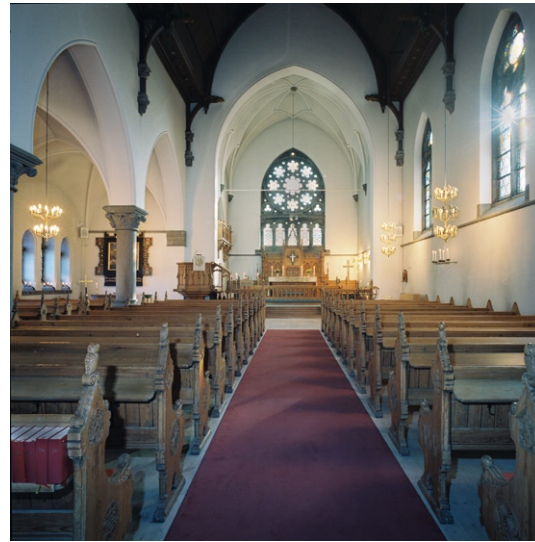
Kyrkorummet mot koret i öster.

Väggarna är putsade och numera vitmålade. Liksom taket var de ursprungligen försedda med dekorativt måleri av konstnären Agi Lindgren (1858–1927). De stora rosettfönstren med sina glasmålningar i kraftfulla färger är ut-