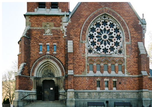
Exteriör från väster med huvudentrén.

Det lilla vapenhuset i söder är uppfört i en svarttjärad träkonstruktion, försedd med dekorativa textband. Här finns, vid sidan om granittrappan, en sekundär handikappramp av granit. De två stora rosettfönstren , som dominerar väst- och östfasaderna, har kraftigt masverk av kalksten och är försedda med glasmålningar. Under det västra finns fem små blinderingar