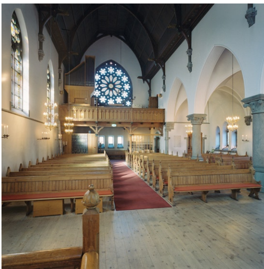
Kyrkorummet mot orgelläktaren i väster.

Flertalet inventarier är av yngre datum som t ex den stora kormattan i blått med nonfigurativt