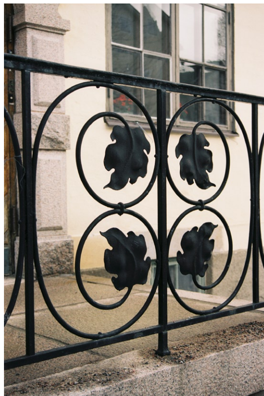
Trappräcke i smide vid entré.

Västerifrån leder trappor med massiva räcken av sten upp till den terrass som kyrkan står på och till en rikt utformad granitportal med förgylld dekor, bl a ett Kristusmonogram. Kyrkporten är av lackat trä med överljusfönster och smidesgaller i form av blad och druvklasar. Entrén till komministerbostaden är också placerad på nordfasaden men har en något enklare ut-