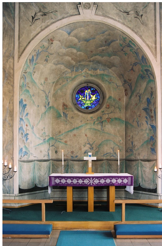
Korabsiden i söder.

Predikstolen består av fyra träskivor ställda direkt på golvet, utformade som gallerverk. Stolarna är klädda med blått ylleytyg, placerade i två bänkkvarter. Orgeln, som är ställd mot rum-