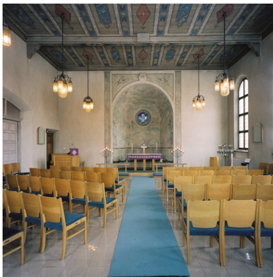
Kyrkorummet mot koret i söder.

plattor. Det platta trätaket med tvärgående bjälkar är dekormålade av Filip Månsson (1864–1933) med illusionsmålade längsgående bjälkar och kassetter med fåglar, blommor, stjärnor etc. Färgskalan går i grått, blått och rött. Rummet ger ett ljust intryck med höga smala rundbågade och blyspröjsade fönster av mörkbetsat trä i norr och väster.