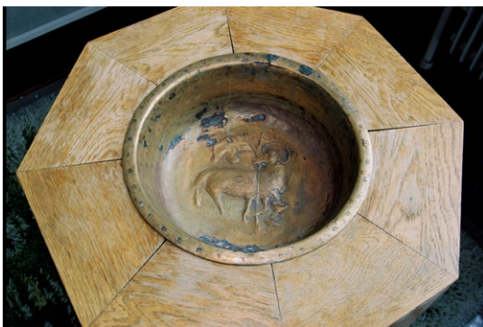
Dopfunten med dopskål av mässing.

gen hänger en modern Mariabild med titeln Ad lumen, en träskulptur monterad mot en blå textil, signerad ME.