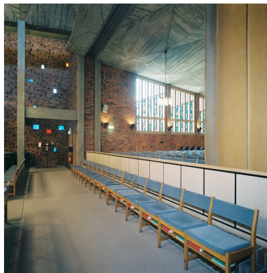
Kyrkorummet med färgade glasblock i den östra väggen. Till höger syns en vikvägg.

Väggarna är av rött tegel i munkförband. I den östra och södra väggen finns öppningar för akustikens skull, påminnande om bomhål. Kopparplåtar är monterade sekundärt i dessa på den östra väggen närmast orgeln för att förbättra akustiken. I den västra väggen finns rörtegel inmurat för ventilation och akustik. Bjälkar av betong finns synliga i väggarna varav ett par är gråmålade. I den östra väggen finns färgade glasblock inmurade, utformade av glaskonstnären Sven Palmqvist (1906–84).