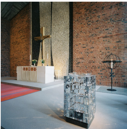
Koret med dopfunten i förgrunden.

Söder om kyrkorummets mittparti, avskilt med en barriär indelad i fält av ek, fortsätter rummet på en något högre golvnivå och med ett lägre tak. Denna del kan avskiljas till en särskild samlingsal genom en vikkvägg av trä, delvis klädd med väv. Den östra väggen har fönster likt ko-rets , men med färgat bränt glas av konstnären Lars Aijmer och en hög bröstning av ett större mönstermurat tegel. I övrigt har kyrkorummet