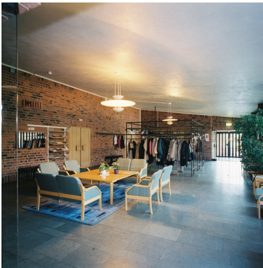
Kapphall med ursprungliga klädhängare.

Kyrkobyggnadens bottenvåning rymde ursprungligen pastorsexpedition, ungdomslokaler med en egen ingång från gångstråket i öster och en vaktmästarbostad i söder. Bostaden rymmer nu församlingens diakoniverksamhet. Ung-