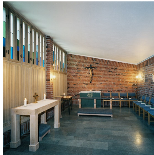
Kapellet med ursprungligt altare i fonden.