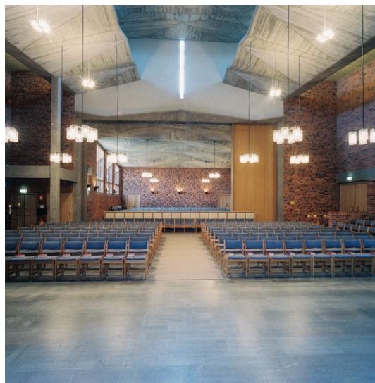
Kyrkorummet mot den avskiljbara delen av rummet i söder.

bara fönster mellan den övre och undre taknivån, vilka inte syns från golvet och ger ett indirekt ljus. Kyrkorummets takarmaturer är sekundära och utförda i glas. I södra delen finns ursprungliga väggarmaturer i kopparplåt. Dörarna är liksom övrig träinredning av kalkad ek.