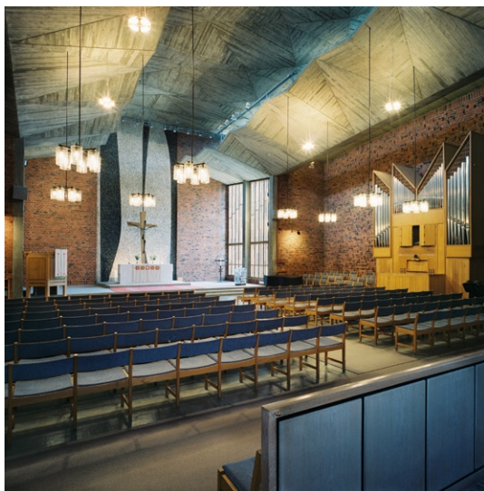
Kyrkorummet mot koret. Till höger står orgeln från 1960, vilken byttes mot en ny 2006.