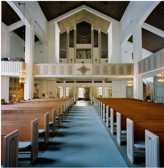
Kyrkorummet mot väster och orgelläktaren.