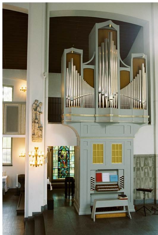
Kororgeln i öppningen till det ursprungliga dopkapellet.

Det f d dopkapellet ligger i norra sidoskeppets östligaste del. Dess grå kalkstensgolv är mönsterlagt med ett vitt kors i mitten, på vilket dopfunten är placerad. Dess underrede av smide är ritat av arkitekten Langendal medan överdelen är tillverkad av en gammal kyrkklocka. På