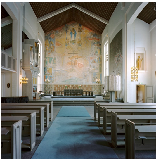
Kyrkorummet mot öster och koret med kororgeln t v och dörren ned till sakristian t h.