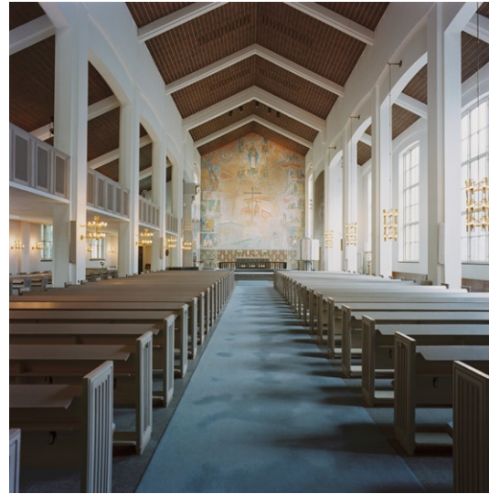
Kyrkorummet mot öster och koret .

Genom en tung ytterport och glasade dubbel-dörrar leds man in i vapenhuset som har kalkstensgolv, vita väggar och brunlaserat tak, utformat som ett kassetak. Till höger finns utrymme för vaktmästare, toalett m m och till vänster brudkammare med kalkstensgolv, träpanelklädda väggar och en ursprunglig men ej längre ut-