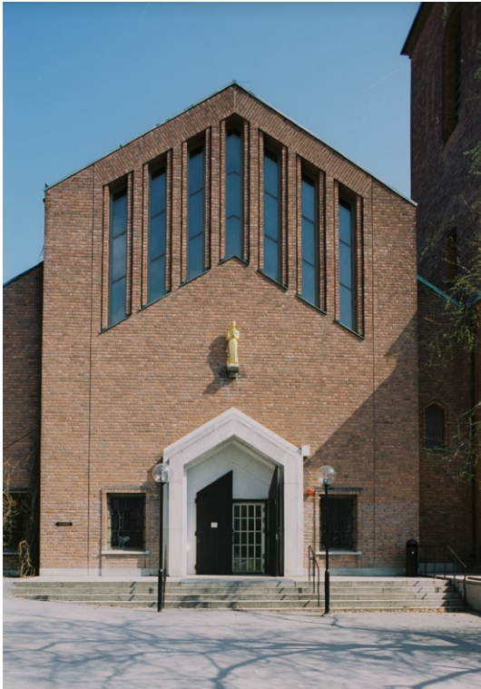
Västfasaden med huvudentrén och det äldre kyrktornet t h

kopparspira med förgyllt kors och urtavlor i samtliga väderstreck. De två kyrkklockorna är från det ursprungliga kapellet, båda gjutna i K G Bergholtz' klockgjuteri i Stockholm, den mindre 1909 och den större 1927.