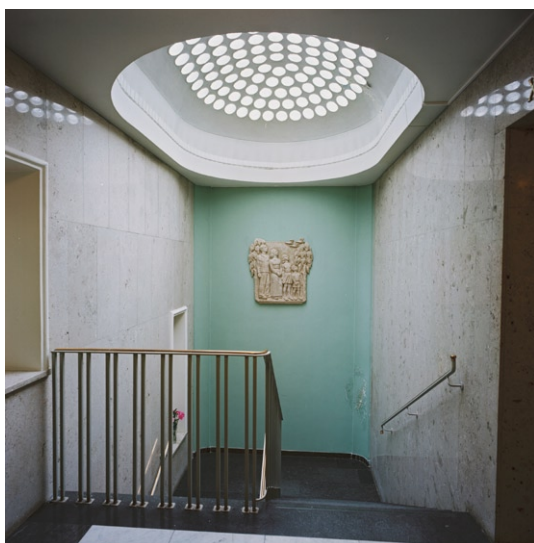
Trappan ned till den yngre delen av kolumbariet.

och tretton små rum. Öster därom ligger den något nyare delen i två våningsplan med sina nio rum samt ett andaktsrum. Trapphuset har en liten kupol av glasbetong, som ger ett visst ljus åt de i övrigt fönsterlösa utrymmena. Entré-