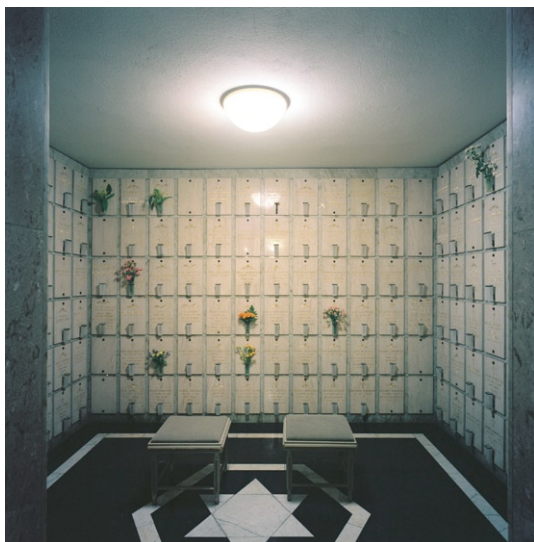
Litet rum i den äldsta delen av kolumbariet..

och tretton små rum. Öster därom ligger den något nyare delen i två våningsplan med sina nio rum samt ett andaktsrum. Trapphuset har en liten kupol av glasbetong, som ger ett visst ljus åt de i övrigt fönsterlösa utrymmena. Entré-