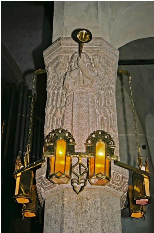
Granitpelare med skulptural dekor och armatur på orgelläktaren.

rummet i övrigt, ligger koret som har en halvrund absidlik avslutning vars valv och väggar är täckta med dekorativa målningar av Filip Månsson. Kapellet har i övrigt vitputsade väggar och kalkstensgolv samt rödmålat trätak. Även stolar och altare är målade i rött. I kapellet finns en liten orgel samt en skulptur, Madonnan med barnet, utförd i lera av Lena Lervik. Belysningen utgörs av ursprungliga ljuskronor i smide.