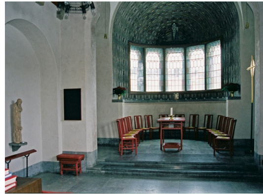
Interiören mot orgelläktaren.

Utöver ovan nämnda inventarier kan bl a nämnas det originella nattvardssilvret (kalk, patén ,