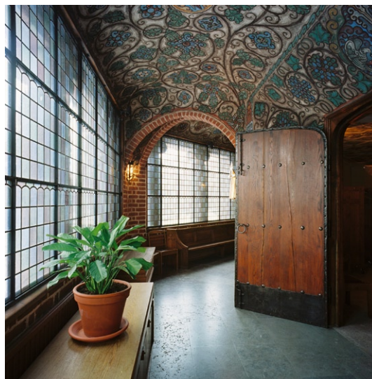
Omgången i väster med Filip Månssons valvmålningar.

Golvet är av granit, i bänkkvarteren linoleumklätt. Alla dörrar är av ek med dekorativa smidda svarta beslag. Kyrkorummets fyra ljuskronor, vägglampetter och övriga armaturer är av mäsing och ritade av Wahlman. Den i väster belägna omgången har oputsade tegelväggar, kalkstensgolv och valv försedda med dekorativa alsecomålningar utförda av Filip Månsson (1864–1933).