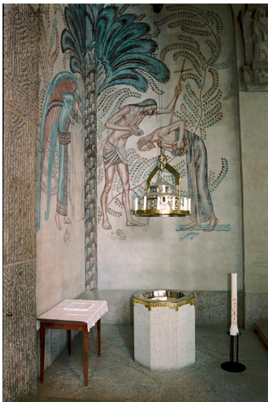
Det lilla dopkapellet med upphissat dopfuntslock och ljusring. Al secco-målning © OLLE HJORTZBERG/BUS 2008

silver, mässing och ädla stenar. Över denna hänger i ett spel ett dopfuntslock utformat som ett baptisterium (den klassiska italienska dopkyrkan) i miniatyr, även det av silver, ädla stenar samt pärlemor. I det originella arrangemanget, skapat av L I Wahlman, ingår även en ljuskrona som kan hissas upp och ned. Ingångarna till kapellet bevakas av änglar i granit, skulpterade av Arhtur Gerle.