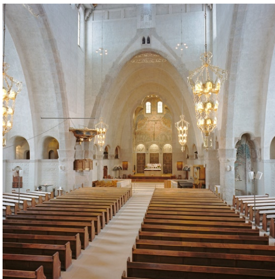
Interiören mot koret.

bågarna är de utförda av Arthur Gerle i samarbete med arkitekten Wahlman.