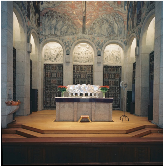
Koret med altaret och de sju silversköldarna.

uppfattas de nerifrån kyrkorummet som att de verkligen står på altaret.