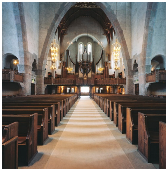
Interiören mot orgelläktaren.

Orgelläktaren i den västra korsarmen har en barriär av rökt ek med snidad dekor. Mittpartiet skjuter ut något i rummet. Granitpelarna uppe på läktaren har skulptural dekor i form av trumpetande änglar. Orgelfasaden, också av rökt ek,