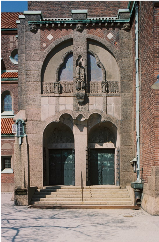
Exteriören med huvudportalen i söder.

Huvudportalen i söder är tydligt markerad genom sin skulpturala utsmyckning i stucc, en nästintill fristående Jesusgestalt och övriga motiv i relief. Ett på putsen målat nonfigurativt motiv i blått, gult och rött omger Jesusskulptu-