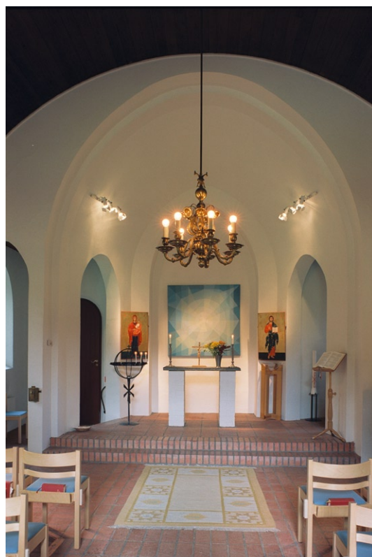
Kyrkorummet mot koret i nordväst.

Koret , som ligger två trappsteg högre än långhuset, är välvt. Det fristående altaret består av en tunn skifferhäll, som bärs upp av två fundament av vitmålat tegel. En abstrakt altarmålning, signerad Harriet Ebeling, hänger på väggen bakom altaret och utgör fondmotiv i kyrkorummet. Den flankeras av två moderna ikoner . I koret står även en enkelt utformad dopfont av furu och en ljusbärare av standard-