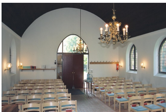
Kyrkorummet mot huvudentrén i sydost.

Genom kyrkporten kommer besökaren direkt in i det lilla rektangulära kyrkorummet över vilket ett tunnvalv av brunlaserad slät panel vilar. Väggarna är slätputsade i vitt, golvet är av rött tegel. På vardera långsida finns fyra spets-