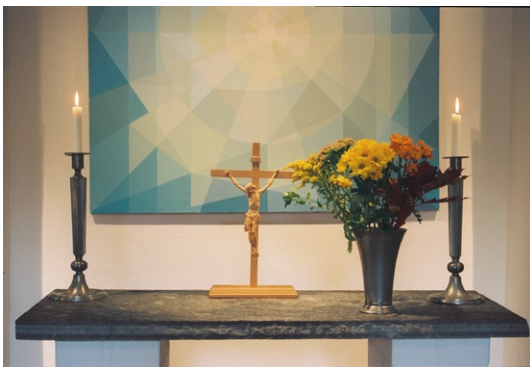
Altaret med ljusstakar och vas som lär ha hört till det ursprungliga gravkapellet.

Den sekundära tillbyggnaden i nordväst rymmer hiss och trappa som leder ned till kapellets källarlokal. Här finns ett rum som fungerar både som sakristia och för samlingar av olika slag samt pentry, wc m m.