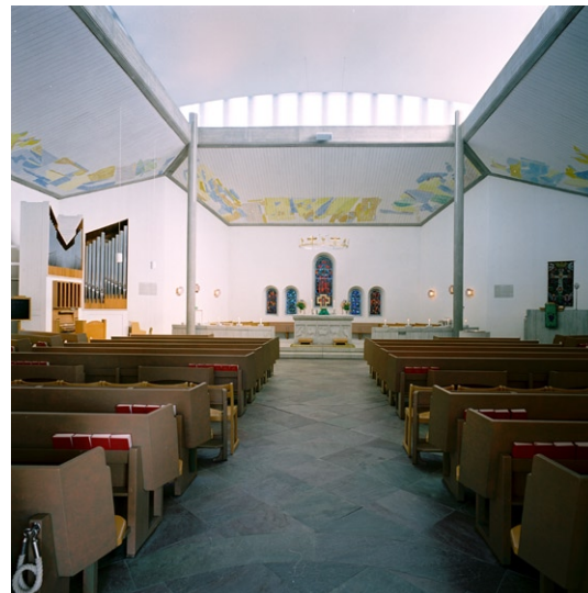
Kyrkorummet mot koret och öster.

Vapenhuset i väster utgörs av ett litet, rektangulärt och delvis glasat rum. Golvet är stenlagt, taket av slät vitmålad träpanel. Originalarmaturerna är av glas och smide. Genom pardörrarna av ek kommer man rakt in i kyrkorummet där altaret har en mycket dominerande placering,