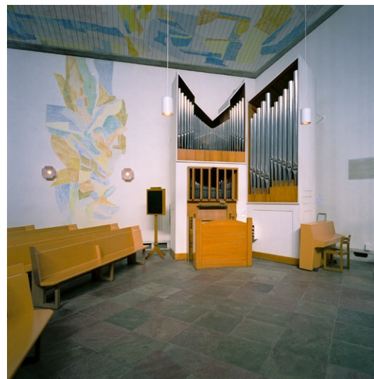
Kyrkorummet mot orgeln. Tak- och väggmålning © LARS ANDRÉASSON/BUS 2008

Sakristian , som är belägen i den södra korsarmen, har stenlagt golv, putsade väggar och vit-