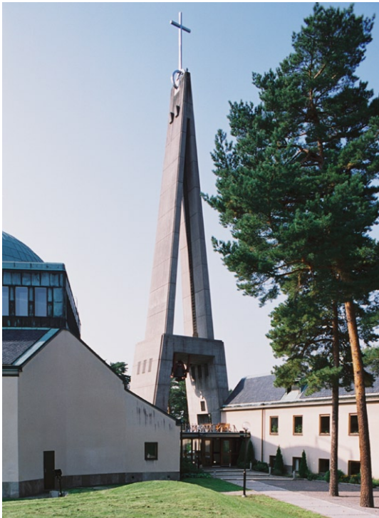
Klocktornet med kyrkan t v och församlingsbyggnaden t h.

nerad Birgittasymbol, ett hjärta med kors. Korsarmarnas tak är skiffertäckta. Portarna är utvändigt kopparklädda och fönstren är av teak. Enligt uppgift önskade arkitekten att kyrkan i färg och form skulle "samtala med" Drottningholms slott och slottskapellet med sin kupol på andra sidan Mälaren. Det nästan 40 meter höga klocktornet reser sig som en kampanil på fyra bastanta "ben", strax norr om huvudentrén. Det kröns av ett åtta meter högt kors i rostfritt stål. Tornet byggdes egentligen för fyra klockor men har bara två, gjutna vid Bergholtz klockgjuteri i Sigtuna. Upphångningsanordningarna för klockorna är liksom kläpparna rödmålade.