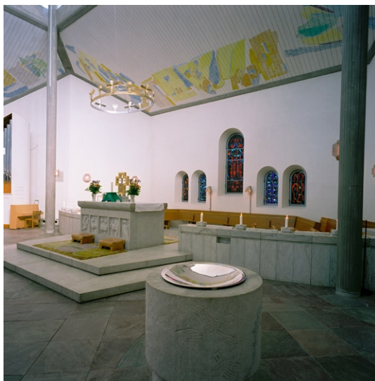
Dopfunten, altaret och bakom detta den nedsänkta "lillkyrkan". Takmålning © LARS ANDRÉASSON/BUS 2008

centralt och fristående. Arkitekten har här utgått från den liturgiska idén att församlingen ska kunna samlas omkring altaret, "circumstantes", och skapa ett samspel mellan präst och församling. Mellan altaret och östväggen ligger "lillkyrkan", vars golv ligger nedsänkt två trappsteg (ursprungligen sex steg) varigenom ett mindre rum i rummet bildas. Altaret skulle således vara möjligt att användas från båda sidor, både som traditionellt högaltare i det stora kyrkorummet och som altare för "lillkyrkan" för en mindre grupp. En mur av marmor avgränsar "lillkyrkan" ytterligare från huvudrummet. Östväggens fem glasmålningar med bl a De fyra elementen som motiv, komponerade och utförda av konstnären Uno Lindberg, har fått funktionen av altartavla i och med att de bildar en bakgrund till altaret när detta nyttjas från det stora rummet.