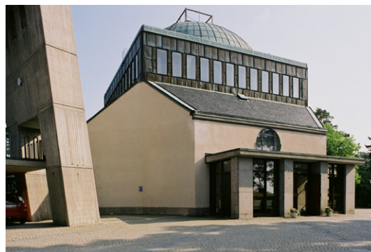
Exteriör med huvudentrén i väster med klocktornet t v.

Kyrkans nästan helt slutna fasader är terrasitputsade i ljust gult och sockeln är klädd med skifferplattor liksom delar av det glasade vapenhusets väggar. Över själva kyrkorummet reser sig en kvadratisk, ganska hög fönsterförsedd och kopparklädd lanternin med en mäktig kupol, också den klädd med koppar. Kupolen kröns av krona av förtennad koppar med en inkompo-