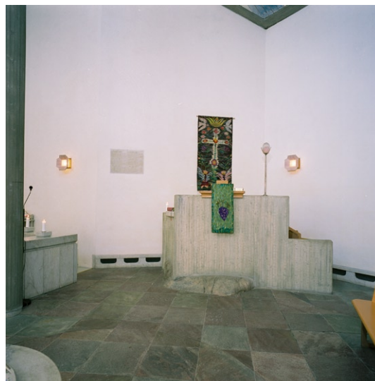
Predikstolen med klippblocket som tagits från kyrkotomten.

Altaret är av vit polerad Ekebergsmarmor med dekor i form av djupreliefer på båda långsidorna eftersom altaret ska kunna betraktas