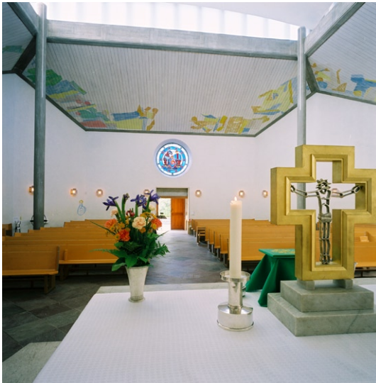
Kyrkorummet mot entrén i väster från koret med altarets krucifix. Krucifix © SIGURD PERSSON/BUS 2008

även från "lillkyrkan" i öster. Relieferna, med bl a evangelistsymbolerna som motiv, är utförda av bildhuggaren Knut Erik Lindberg. Muren som avskärmar "lillkyrkan" från huvudrummet är av samma marmorsort och försett med fasta ljusbärare, också i marmor, med stora ljusmanschetter av silver ritade av ädelsmeden Sigurd Persson (1914–2003).