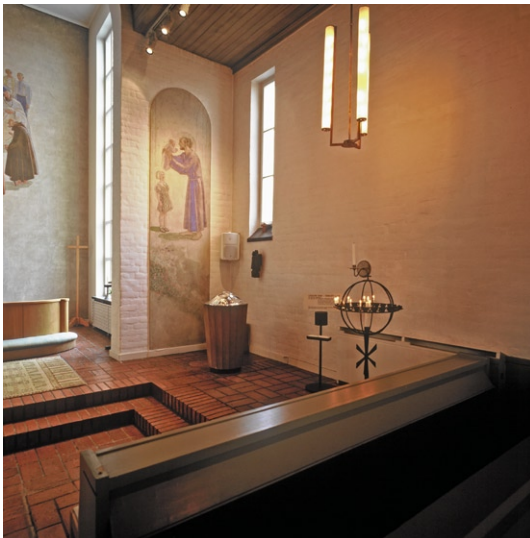
Kyrkorummet med dopfunten och al secco målning av Olle Hjortzberg. © OLLE HJORTZBERG/BUS 2008

altaret av slammat tegel med en slipad kalkstensskiva, är ängsblommor målade på väggen. Altarringen är av almfanér. Det är även läktarbarriären i söder, förutom ett sekundärt räcke