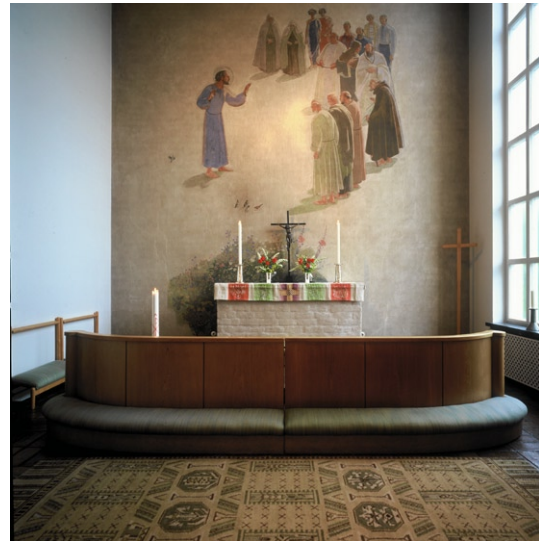
Koret med en al secco målning av Olle Hjortzberg. © OLLE HJORTZBERG/BUS 2008

Innanför ett korgbågigt valv i norr ligger ko ret med plant, putsat tak. Kor väggen pryds av en al secco målning av Olle Hjortzberg. Motivet är Kristus som predikar för människor. Närmast