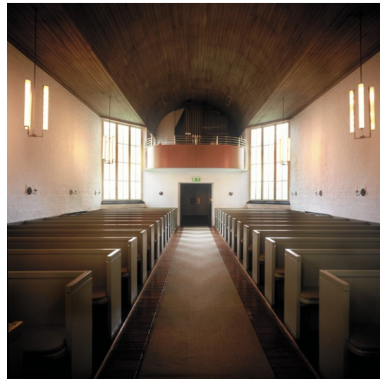
Kyrkorummet mot orgelläktaren.