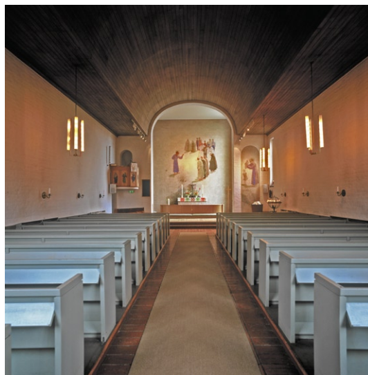
Kyrkorummet mot koret .

Det lilla vapenhuset , som får indirekt dagsljus från intilliggande kapprum, har golv och väggar av rött tegel. Kyrkorummet ger ett desto ljusare intryck med sina vitputsade väggar, sitt tunt gråmålade trätak, vars mittparti är tunnvälvt och sina bänkar målade i ljust grått. Ljuset kommer från de snedställda fönstren i söder samt från ett stort korfönster i öster. Spröjsarna är av mässing och fönsterglasen är vattrade . Inget fönster är direkt synligt när besökaren är vänd mot altaret.