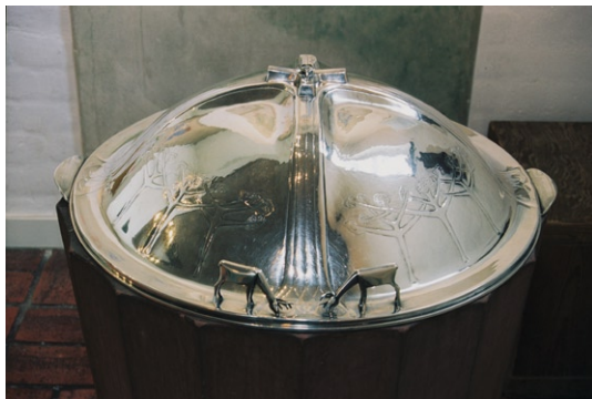
Dopfund med lock av silver av Arnold Karlström.

Speciellt för Hässelby Villastads kyrktoft är att den, med gräset, de höga tallarna, plantering-