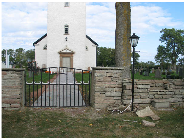
Kyrkogårdens ingång i söder med smidesgrindarna från 1946 och klivstättan. (KI Alböke kyrkog 001)