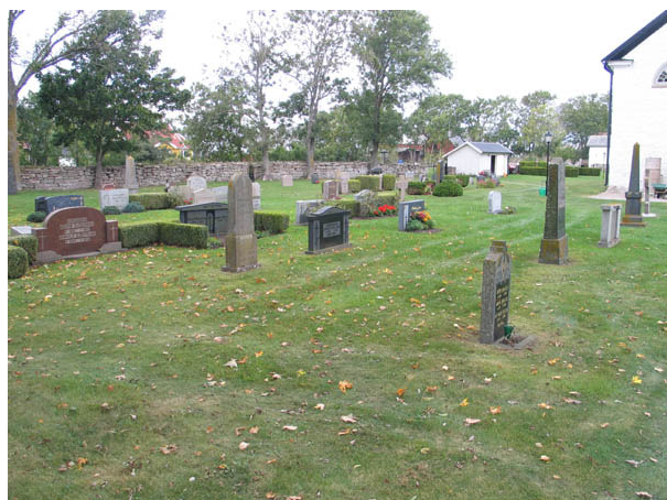
Kvarter B från sydväst. (KI Alböke kyrkog 013)

Kvarteren B till E ligger runt kyrkan från sydväst till nordost. Flest gravvårdar finns i kvarter B och minst antal i kvarter D. Gravvårdarna är i samtliga kvarter placerade i rader. Raderna är antingen vända mot öster eller ryggställda och vända mot öster eller väster. I kvarteren C och E finns platser avsatta för urngravar. I båda dessa kvarter finns också flera gravplatser som inte är i bruk. Hela området är insått med gräs.