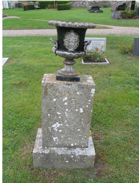
Urnan är en av antikens symboler för sorg. Den här typen av gjutjärnsurnor blev vanliga sekelskiftet 1900. Just det här exemplaret som finns i kvarter E har detaljer målade i silver. (KI Alböke kyrkog 026)