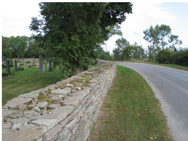
Kyrkogårdsmuren i öster. (KI Alböke kyrkog 003)