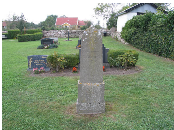
Kvarter D från öster. (KI Alböke kyrkog 023)