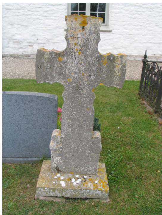
Kalkstenskors med kraftig påväxt av mossa och lavar. Texten är idag svårläst men dateringen är troligen 1879. (KI Alböke kyrkog 035)