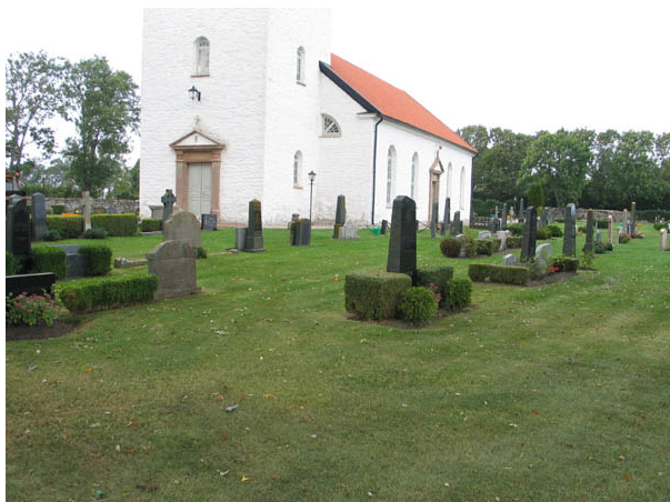
Kvarter A från sydväst. (KI Alböke kyrkog 043)