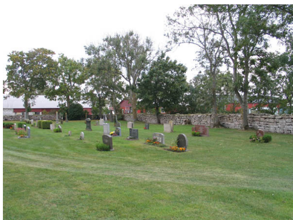
Kvarter C från norr. (KI Alböke kyrkog 022)