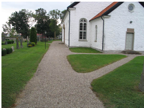
Grusbelagd gång från kyrkogårdens ingång i norr mot söder. (KI Alböke kyrkog 024)