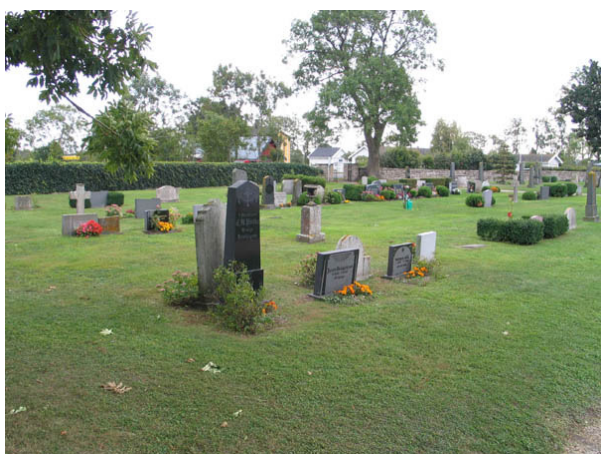
Kvarter E från nordväst. (KI Alböke kyrkog 025)