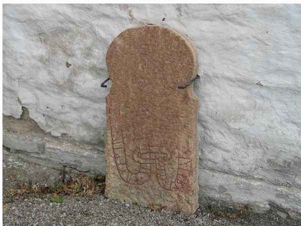
Runstenen som står i nischen mellan långhuset och koret på kyrkans östra sida. (KI Alböke kyrkog 044)