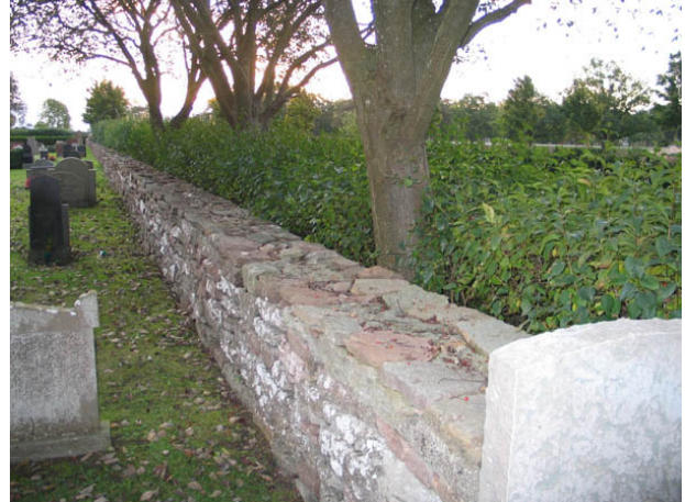
Gränsen mellan kvarter G och den del av kyrkogården som tillkom på 1990 markeras av den gamla kyrkogårdsmuren, syrenhäck och en rad av oxlar och lönnar. (KI Böda kyrkog 010)