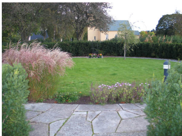
Minneslunden från söder. (KI Böda kyrkog 007)