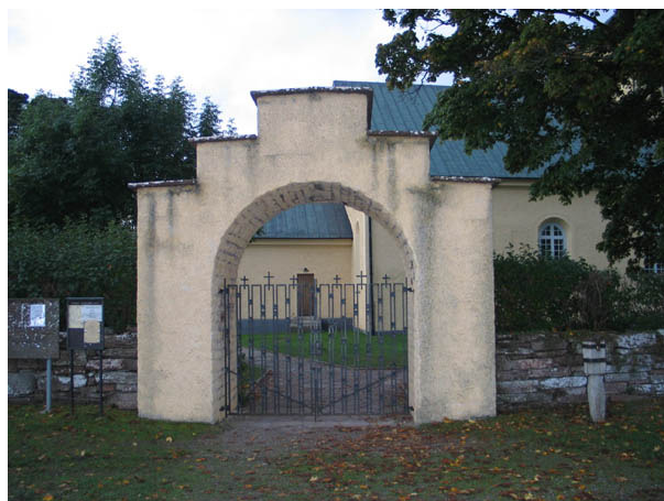
Stigluckan vid kyrkogårdens norra ingång som återuppfördes 1950. Till höger om stigluckan står fattigbössan. (KI Böda kyrkog 001)