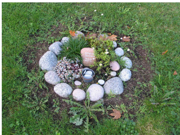
I kvarter C finns också exempel på hur man idag kan utforma en gravvård. På en liten natursten har den dödes namn skrivit och planteringen med perenner omgärdas av stenar. (KI Böda kyrkog 031)