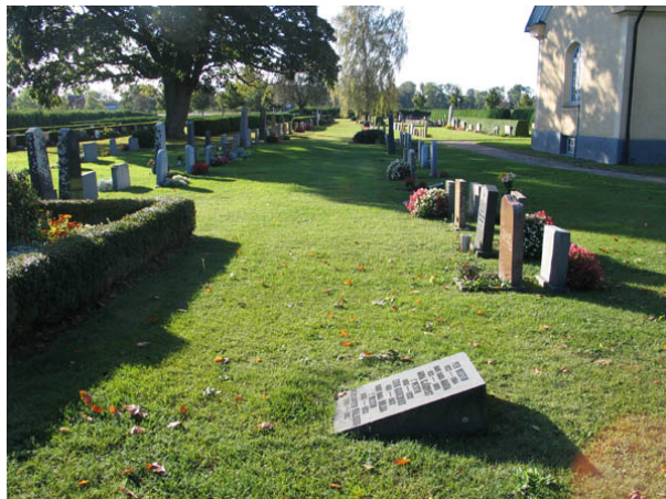
Kvarter C från norr. Till vänster i bilden skymtar kyrkogårdens enda gravplats som har kvar sin omgärdning i form av en buxbomshäck. (KI Böda kyrkog 027)

De flesta gravvårdarna är placerade i rader som antingen är fristående eller ryggställda. Mellan majoriteten av de ryggställda raderna är häckar av buxbom eller tuja planterade. Raderna sträcker sig i nord-sydlig riktning och gravvårdarna är vända mot öster eller väster. I norra delen av kvarter C finns ett uppmurat vattenkar. Det användes ursprungligen för att hålla vatten så att kyrkogårdens besökare kunde vattna sina planteringar. I norra delen av kvarter C och i östra delen av kvarter A växer lönnar.