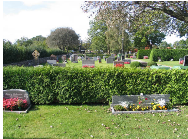
Kvarter G från öster. (KI Böda kyrkog 045)