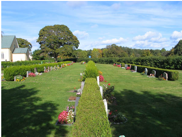
Kvarter F från söder. (KI Böda kyrkog 044)

Kvarter F och G utgör de två delar av kyrkogården som tillkom 1959 respektive 1924. Kvarter F omfattar 230 gravplatser och kvarter G 209. En del av gravplatserna i kvarter F är avsatta för urngravar. I kvarter F är gravvårdarna ordnade i ryggställda rader med häckar av tuja eller buxbom emellan. Även i kvarter G är de flesta gravvårdar ryggställda men det är bara mellan några få rader som häckar av tuja eller buxbom är planterade. I båda kvartererna är raderna ordnade i nord-sydlig riktning. Hela kvarteret är insått med gräs.