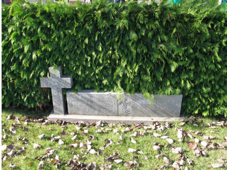
Ett exempel på en ovanligare typ av gravvård från 1978. På Böda kyrkogård finns ett mindre antal vårdar från denna tid med liknande utformning. (KI Böda kyrkog 046)