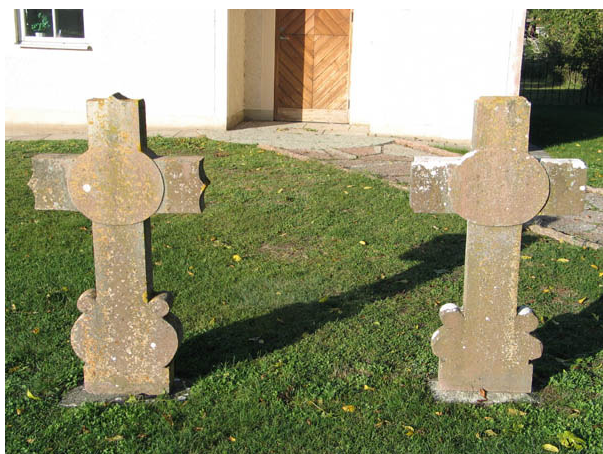
Två av de äldre kalkstenskors som finns kvar på Böda kyrkogård står framför vaktmästeriet. Båda är från 1870-talet. (KI Böda kyrkog 020)