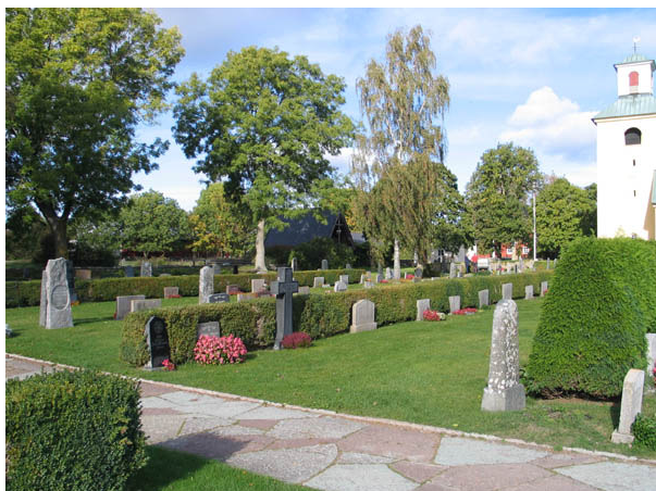
Kvarter D från sydost. (KI Böda kyrkog 041)