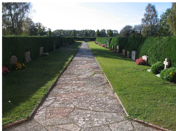
Gång belagda med kalkstensflis från kyrkans södra ingång mot söder. (KI Böda kyrkog 025)

sydöstra hörn går samman fram till kyrkogårdens ingång i sydost. Från denna ingång går också en gång västerut genom kyrkogårdsdelen som anlades 1990.