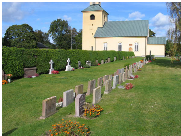
Kvarter E från sydost. Närmast i bild syns två ryggställda rader med enkla vårdar, de flesta av kalksten, från 1960-talet. (KI Böda kyrkog 037)