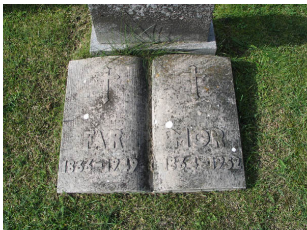
Livets bok ligger uppslagen. Denna typ av gravvård förekommer sparsamt på våra kyrkogårdar. Att bara skriva far, mor eller ett förnamn blev vanligt under en period i mitten av 1900-talet. (KI Böda kyrkog 042)