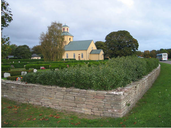
Kyrkogårdens mur i öster. Innanför muren växer en syrenhäck. (KI Böda kyrkog 004)

I väster: Halvmur av kallmurad kalksten. Rad av äldre askar.