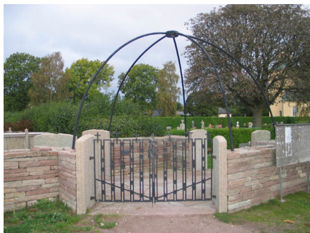
Kyrkogårdens ingång i sydost med den enrébågen som sattes upp 1996. (KI Böda kyrkog 005)