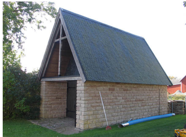
Bårhuset som byggdes i slutet av 1950-talet. (KI Böda kyrkog 054)