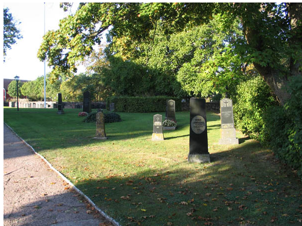
Kvarter A från öster. (KI Böda kyrkog 018)

De tre kvartererna utgör de äldsta delarna av kyrkogården. Kvarter A ligger norr om kyrkan, kvarter B söder om och kvarter C öster och söder om kyrkan. Störst är kvarter C med 395 gravplatser. Kvarter B har 86 platser och kvarter A 33. I söder utgör en gång delvis insådd med gräs och delvis belagd med kalkstensflis gräns mot kvarter D, E och F.