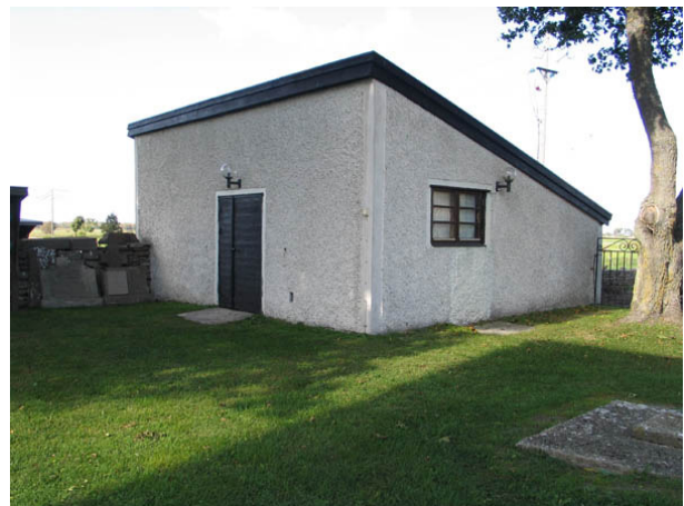
Förråd och verkstad. (KI Egby kyrkog 023)