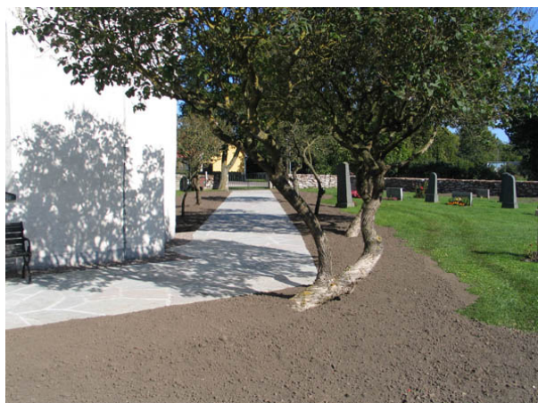
Gången från kyrkogården ingång i nordost. Den kantas av stamsyrener och har nyligen belagts med kalkstensflis. (KI Egby kyrkog 010)