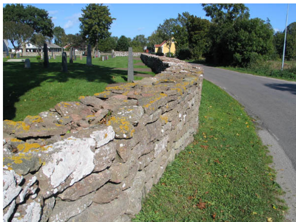
Den nyligen omlagda kyrkogårdsmuren i öster. (KI Egby kyrkog 003)