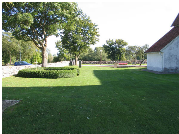
Kvarter C norr om kyrkan från väster. Till vänster minneslundan. (KI Egby kyrkog 019)