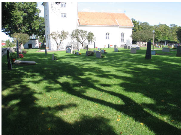
Kvarter B från sydväst. (KI Egby kyrkog 011)