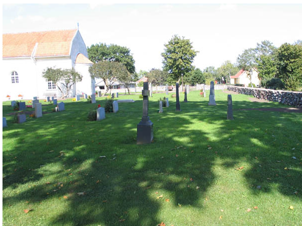
Kvarter A från söder. (KI Egby kyrkog 014)