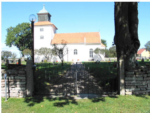
Kyrkogårdens södra ingång. (KI Egby kyrkog 001)