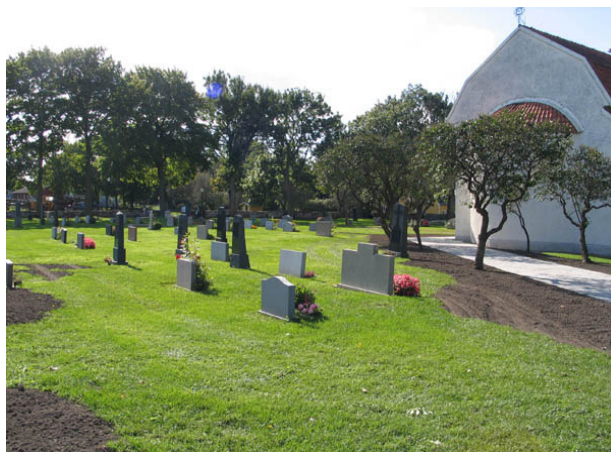
Kvarter A från nordost. (KI Egby kyrkog 018)