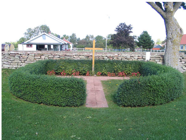
Minneslundan från söder. (KI Egby kyrkog 022)

I kyrkogårdens nordvästra hörn står en byggnad som idag rymmer förråd och verkstad. Byggnaden har en spritputsad fasad med släta omfattningar. Pulpettaket är belagt med tegel och snickerier är svartmålade. Byggnaden är troligen den bod som byggdes av Olof Olofsson 1774 och som användes som bårhus. År 1800 togs beslut om att utvidga byggnaden men det är inte känt om det beslutet verkställdes. .