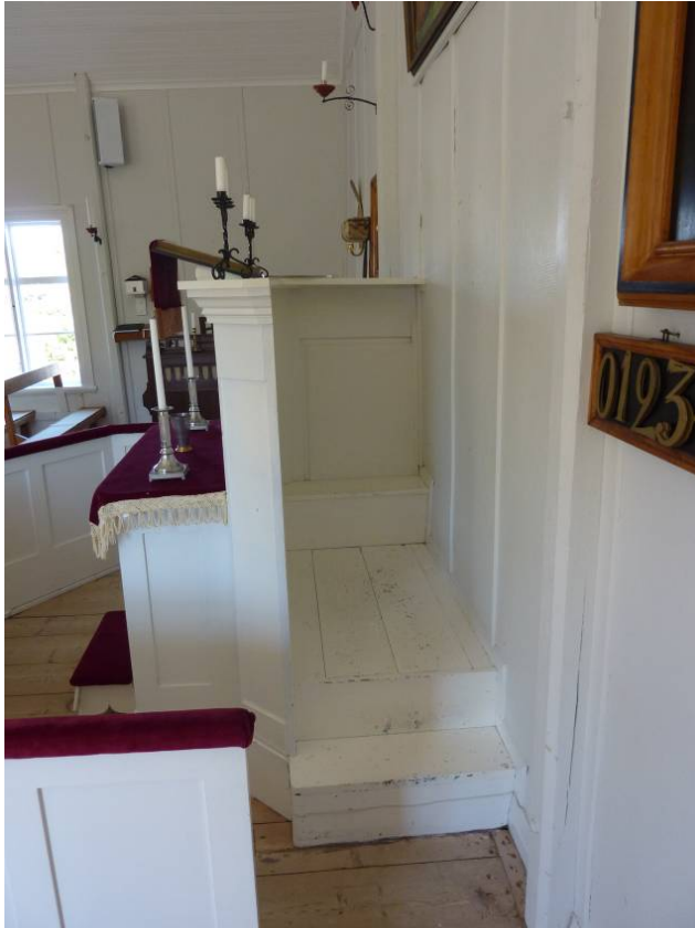
Altarpredikstolen är ursprunglig och den enda av sitt slag i länet.