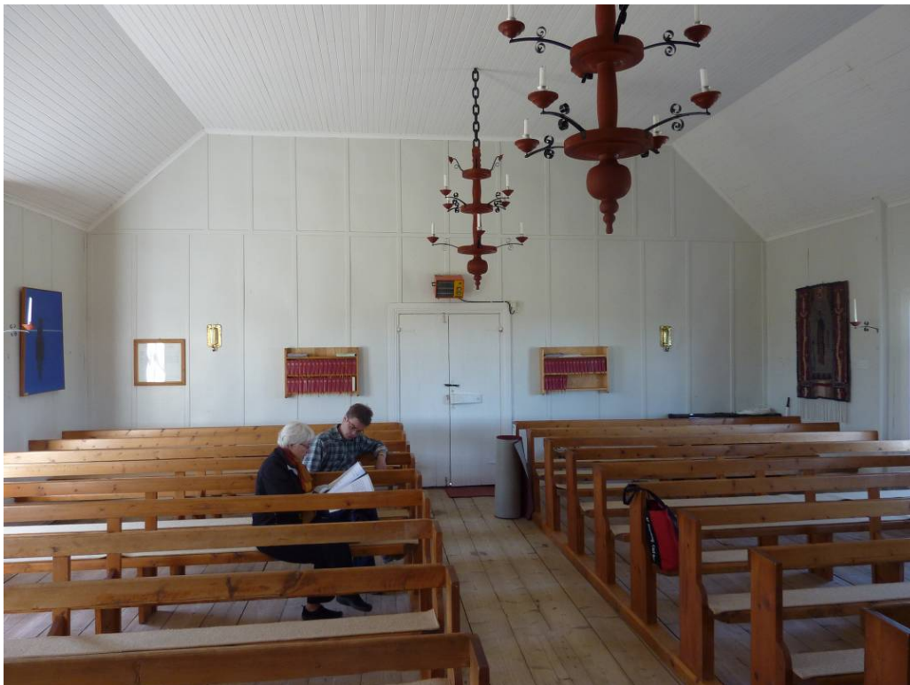
Den spartanska karaktären är viktig att värna om. Överflödiga utsmyckningar, sentida färgstarka och alltför framträdande konstverk samt tekniska installationer med begränsad användning kan med fördel tas bort. De såpskurade golven och enkla öppna bänkarna är viktiga för kapellets karaktär.