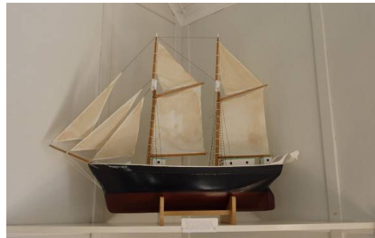
Votivskeppet och de två kollektståvarna av sälskinn anknyter ytterligare till platsens kulturhistoria.