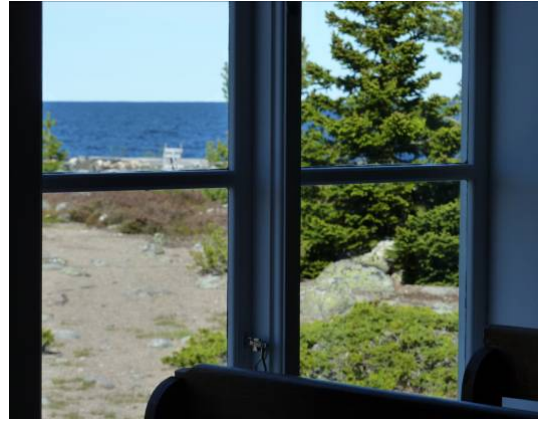
Havet är allestädes närvarande och bör så förbli.