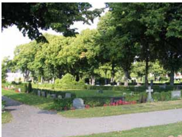
Kvarter 3, Norra kyrkogården, från sydväst. På bilden syns också en av de vackra lindalléer som markerar huvudgången från kyrkogårdens ingång i söder fram till kapellet. (KI Norra kyrkog 024)

ett äldre linjegravsområde för barn i kvarter 12. Hela kyrkogårdsområdet ger ett lummigt intryck med de höga äldre träden och häckarna som ramar in kvarteren.