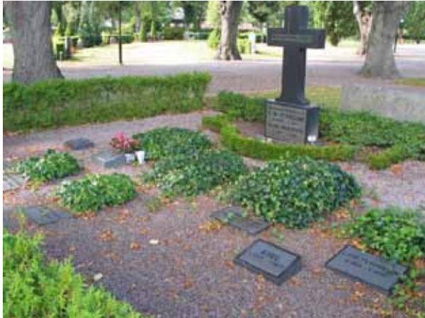
Gravplats belagd med grus, omgärdad av hagtornshäck och med ett antal gravkullar beväxta med murgröna. Det påkostade kontra.....(KI Norra kyrkog 007)