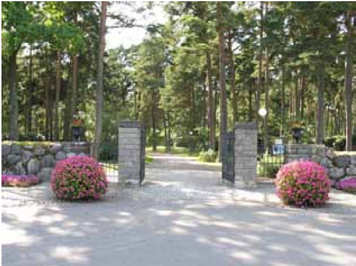
KI Norra kyrkog 094

Kulturhistorisk inventering av kyrkogårdar/ begravningsplatser i Växjö stift 2005