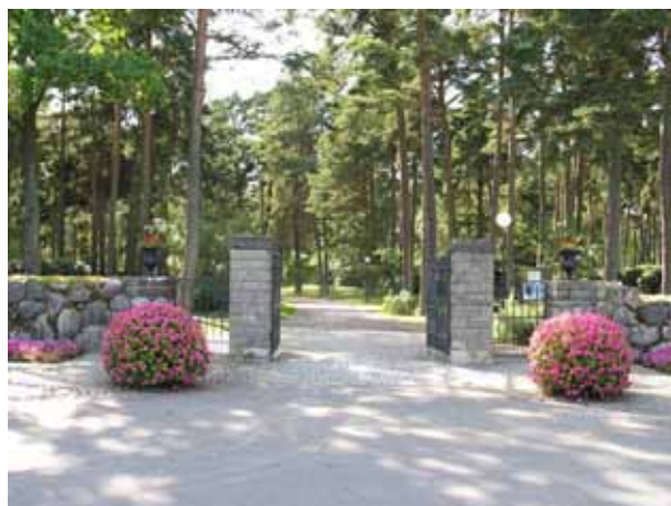
Ingång till Skogskyrkogården i öster. (KI Norra kyrkog 094)