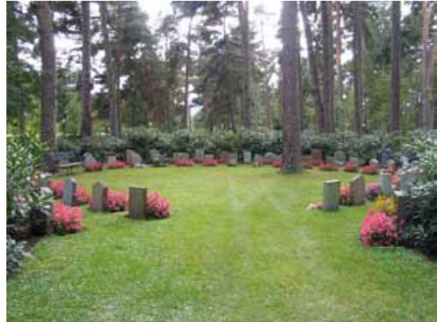
Ett av de rum som skapats med hjälp av rhododendron och lagerhägg. Västra delen av kvarter 6. (KI Norra kyrkog 176)