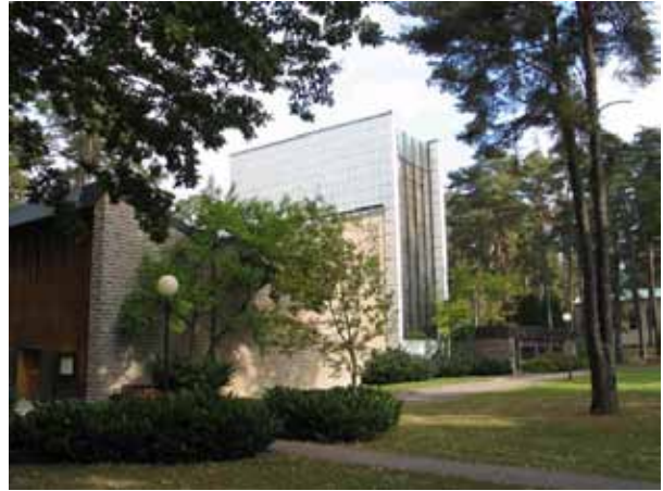
Heliga Korsets kyrka från sydväst. (KI Norra kyrkog 230)