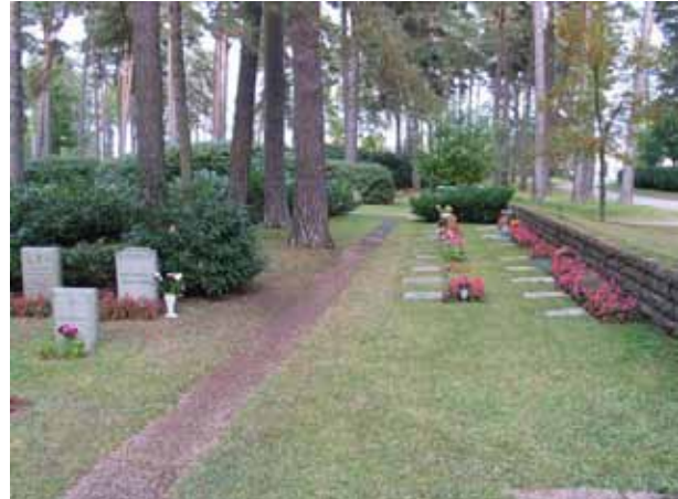
Södra delen av kvarter 7 från väster. Till höger i bild syns jordvallen och den mur av kalksten som omgärdar kvarteret. (KI norra kyrkog 188)