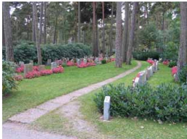
Västra delen av kvarter 6 Skogskyrkogården. Tallskogen och buskagen av rhododendron och lagerhägg skapar rumskänsla. Kvarteret är ett av flera urngravskvarter. (KI Norra kyrkog 171)

Norra kyrkogården ligger i södra delen av kyrkogårdsområdet. Norr om detta ligger Skogskyrkogården som började anläggas på 1930-talet. Gränsen mellan de båda områdena markeras av två häckar, en av idegran och en av avenbok. Mellan de båda är ett utrymme insått med gräs. Gräsen markeras också genom det tydliga skiftet av anläggningsstil. 1930-talets kyrkogård rymmer två olika typer av anläggningsformer. I södra delen av Skogskyrkogården ligger en rad ordnade ytor för urngravar tillsammans med ett stort kistgravsområde. Urngravplatserna är anlagda i en rad öppna eller slutna små ytor som avdelas av eller är omgivna av häckar av avenbok. I de mot gången öppna ytorna är gravvårdarna vända mot norr. In i de av avenbokshäckar inneslutna ytorna leder gångar belagda med kalkstensplattor och gravvårdarna är här vända mot gången antingen mot öster eller väster. Majoriteten av gravplatserna är belagda med grus och omgärdade av låga buxbomshäckar. Gravvårdarna är omväxlande placerade stående eller liggande. Kistgravsområdet är utlagt med rader av gravvårdar i nord-sydlig riktning med undantag av kvarter 2A där rader är lagda i öst-västlig riktning. Majoriteten av gravvårdarna är ryggställda och mellan flertalet av raderna är häckar av olika slag planterade. Gångsystemet går i nord-sydlig och öst-västlig riktning och gångarna möts i räta vinklar.