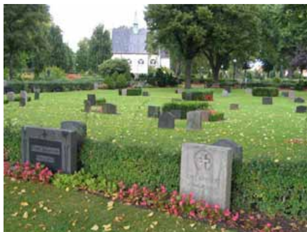
Kvarter 6B från sydväst. På bilden syns köpta gravplatser i kvarterets ytterkant och innanför häcken av hagtorn är ett av kyrkogårdens linjegravsområden. I fonden syns Norra kapellet. (KI Norra kyrkog 036)