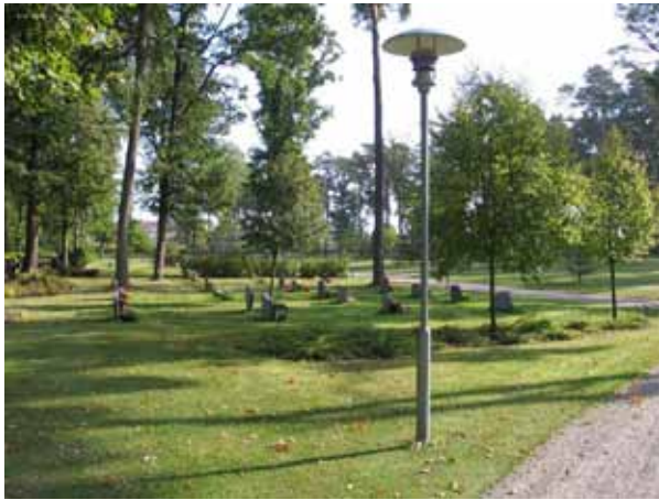
Ett av kvarteren för kistor i norra delen av området som anlades 1995. Kvarter 18 från väster. (KI Norra kyrkog 214)

gravplatser tagna i bruk. De är placerade utmed häcken mot kyrkogården och vända in mot öster.