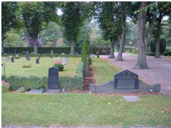
Kvarter 7 Norra kyrkogården. Bilden visar dels delar av en av kyrkogårdens lindalléer och dels hur köpta gravplatser placerats i kvarterets ytterkant och linjegravplatserna i kvarterets mitt. (KI Norra kyrkog 107)

anläggningstiden. Köpta gravplatser med grusade ytor och omgärdningar har placerats i kvarterens ytterkanter och i mitten har linjegravsområden anlagts. 1900-talets teknikutveckling har lett till att områden med grusgravar sätts in med gräs och omgärdningar kring gravplatser har tagits bort. Delvis har dock dessa äldre former av gravplatstraditioner bevarats vilket ger ledtrådar till kyrkogårdens utvecklingshistoria. Rester av linjegravsområdena återfinns i samtliga kvarter där de från början har funnits. Områdets centrum är Norra kapellet där gångsystemet strålar samman.