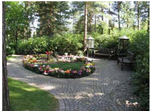
Minneslunden (KI Norra kyrkog 079)