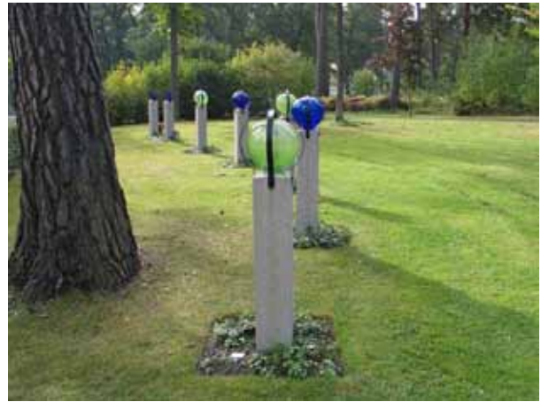
Ett av urngravsområdena med gemensam gravvård i kvarter 22. Vårdarna är granitpelare som kröns av glaskulor och svartmålade järnband. (KI Norra kyrkog 223)