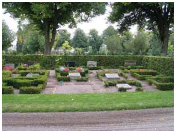
Ett av de öppna rummen för urngravar i kvarter 2A. Gravplatserna är belagda med grus och omgärdade av buxbomshäckar. Gångarna är belagda med kalkstensplattor. Stående gravvårdar är placerade längst in. (KI Norra kyrkog 158)