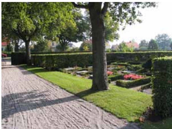
Kvarter 1A från väster. I kvarter 1A och 2A är urngravarna ordnade i rum som skapas av häckar vartannat öppet och vartannat slutet. Häckar av avenbok ramar in. (KI Norra kyrkog 145)

Utmed gränsen mot Norra kyrkogården är ett band av häckomgärdade ytor för urngravar placerade. Norr om dessa gravar går en gång och två rader av ryggställda gravvårdar för kistgravplatser med häck av avenbok emellan. Utmed gången är oxlar planterade. Kvarter 1A utgörs av en mindre del längst i öster i anslutning till kvarter 1. Kvarter 2A utgörs förutom av de ovan beskrivna typerna av gravplatser av två områden med ryggställda gravvårdar med häckar av spirea eller jasmin. Här är majoriteten av gravvårdarna vända mot norr eller söder. Urngravarna är placerade inom ytor som antingen är helt omgärdade av häckar av avenbok eller är öppna mot gången i norr. Ytorna är indelade i rutor med hjälp av gångar belagda med kalkstensplattor och låga buxbomshäckar som omgärdar varje gravplats. Hela urngravsområdet sluttar svagt mot norr. Den äldsta gravvården är en urngrav från 1946 i kvarter 1A. Bland urngravarna dominerar gravvårdar från 1950- 60-talen medan vårdarna på kistgravsområdet främst är från 1980- och 90-talen.