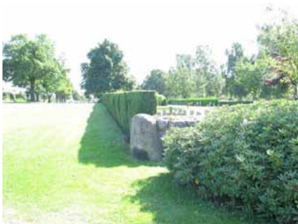
Del av tujahäcken som omgärdar kyrkogården i öster. (KI Norra kyrkog 093)

I väster: Brunmålat trästaket som söder om Heliga Korsets kapell övergår i en kallmurad stenmur. Längst i söder tar en hög tujahäck vid.