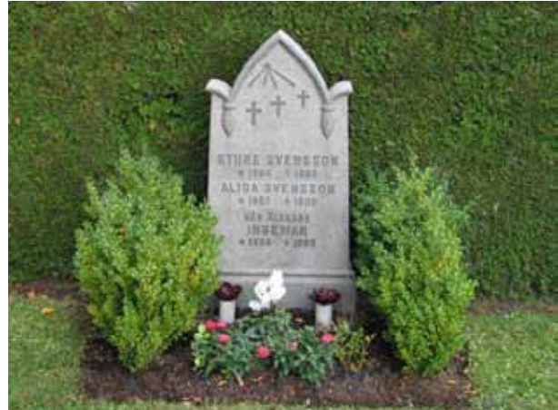
Gravvård i granit som efterliknar 1800-talets gravvårdar av sandsten dekorerade med pinjekottar. (KI Norra kyrkog 165)