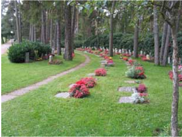
Södra delen av kvarter 11. Närmst gången är rader av liggande vårdar placerade och därefter rader med stående vårdar. (KI Norra kyrkog 173)