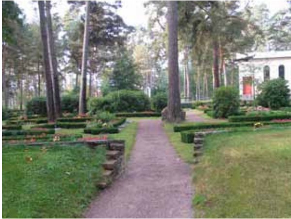
Ingång till kvarter 10 från öster. På bilden syns en del av de buxbomshäckar som är planterade i olika formationer. (KI Norra kyrkog 200)

markeras av en platta i muren och gravplatsernas planteringar avgränsas av låga buxbomshäckar. I kvarter 7 är gravvårdarna placerade i rader. Liggande gravvårdar är placerade närmast gångarna och bakom dem rader med stående gravvårdar. Samtliga gravvårdar är vända mot gångsystemet. Mindre gångar i kvarteret är belagda med kalkstensplattor.