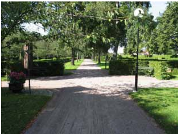
Gång i nord-sydlig riktning mellan kvarteren 1B-1G och kvarteren 2B-2D på kistgravsområdet som anlades på 1930-talet. (KI Norra kyrkog 102)

Se vidare i beskrivningarna av de olika delarna.