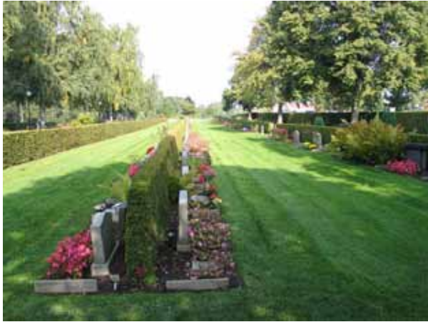
Kvarter 1B-1E med kvarter 1B närmast i bild. (KI Norra kyrkog 146)