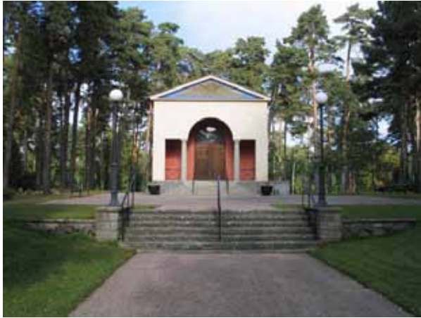
Skogssalen från söder. (KI Norra kyrkog 232)