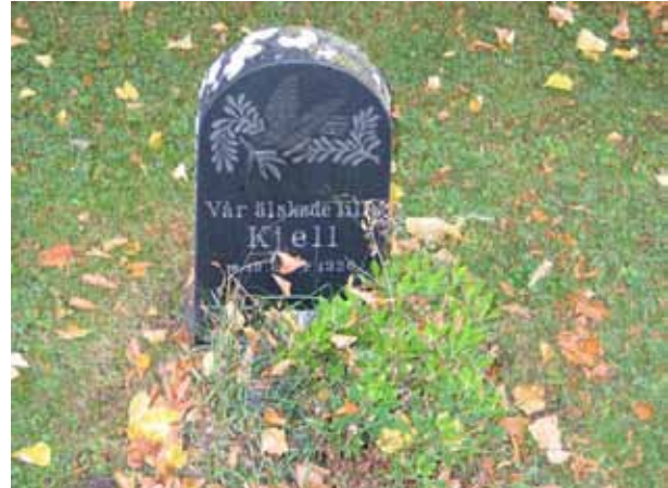
.....det enkla. En av linjegravvårdarna på linjegravsområdet i kvarter 8A. Området är ett av de två där barn begravts på linje. (KI Norra kyrkog 113)