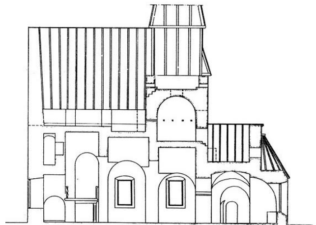
Sektion av dagens kyrka.

De stickbågiga fönsteröppningarna med småspröjsade rutor hör dock till 1700-talets utformningsideal även om flera av dem fått dagens storlek på 1800-talet. Förutom detta representeras 1700-talet i form av en predikstol som har Jonas Berggrens otvivelaktiga signatur. Predikstolar från 1700-talet gjorda av Berggren är