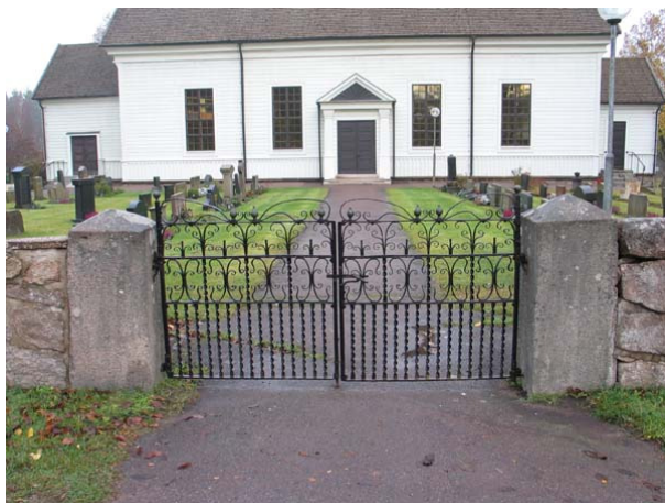
Ingång i söder. Ena grindstolpen märkt 1871. (KI Karlslunda kyrkog 009)