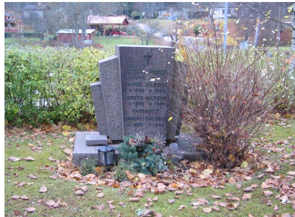
En solfjädersliknande form på en gravvård från 1940-talet. KI Karlslunda kyrkog 097)