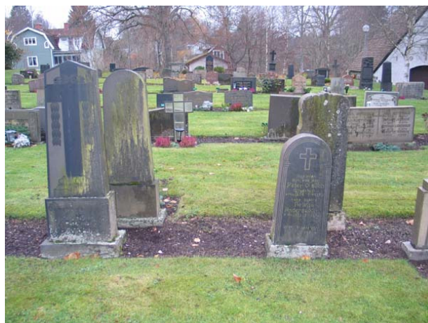
Några av de lite högre, äldre gravvårdarna inne i kvarteret. Till väster är vården över en kantor (oläsligt namn) d. 1928 och till höger syns vården över kyrkovården P. Olsson med maka d. 1908 ( KI Karlslunda kyrkog 078)