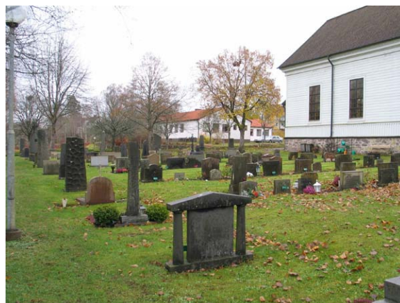
Kvarter II mot sydost. I raden längst till väster syns lite mer påkostade stenar och i mitten en tydligt lägre profil. (KI Karlslunda kyrkog 062)