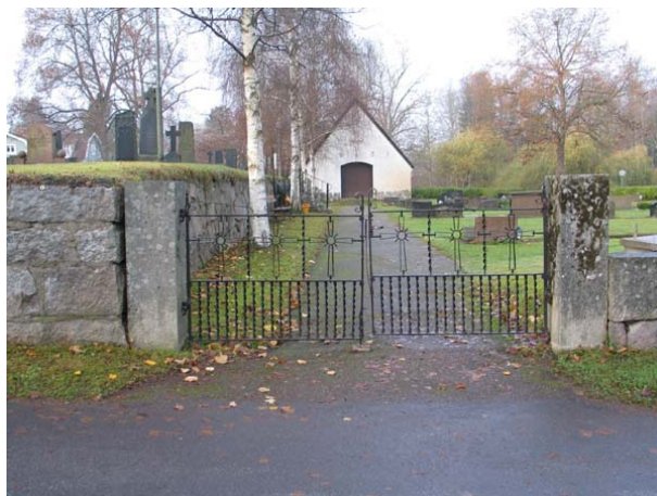
Ingång till den på 1930-talet utvidgade delen i norr med bårhuset i fonen. (KI Karlslunda kyrkog 025)