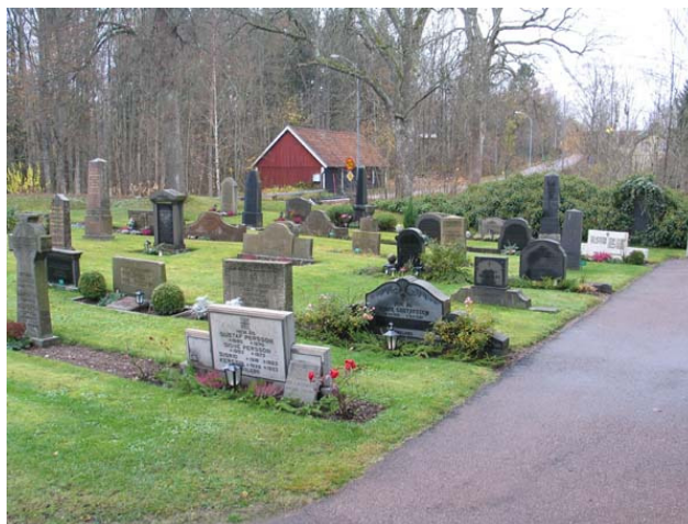
Den västra hälften av kvarter I med olika typer av vårdar. På bilden syns några av de riktigt breda gravvårdarna, typiska för 1940-50-talet. I fonden syns de gamla kyrkstallarna. (KI Karlslunda kyrkog 040)