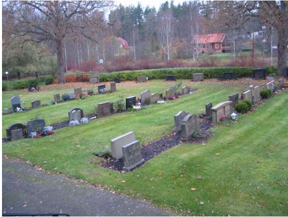
Den västra hälften av kvarter III. Bild mot nordväst. Rader av relativt låga gravvårdar, mestadels linjegravvårdar. (KI Karlslunda kyrkog 092)

platserna i kvarteret. Elof Nilsson var lantbrukare i Känagärde. En annan gravvård med en speciell form är en solfjäderslik sten av grå granit med inskription gjord i brons. Denna är från 1940-talet. Linjegravvårdarna är mestadels tydligt mindre än familjegravvårdarna och kan följas i tidsordning från 1947-62. Många av vårdarna bär klassicerande drag. I kvarteret finns nästan uteslutande gravvårdar från 1930-60-talet. Titlar anges i detta kvarter mycket sällan på gravvårdarna. De som förekommer är konditor, fabrikör och sjöman (2). Gårds- eller bynamn anges dock på merparten av vårdarna.