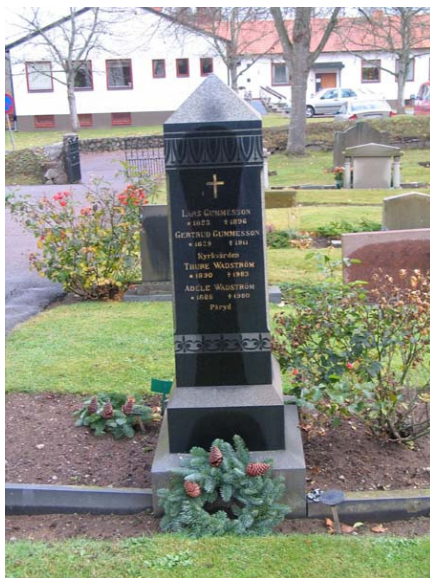
En utmärkande gravsten med vacker dekor. Daterad till 1869, men stenen kan möjligen vara från 1910-talet. (KI Karlslunda kyrkog 038)