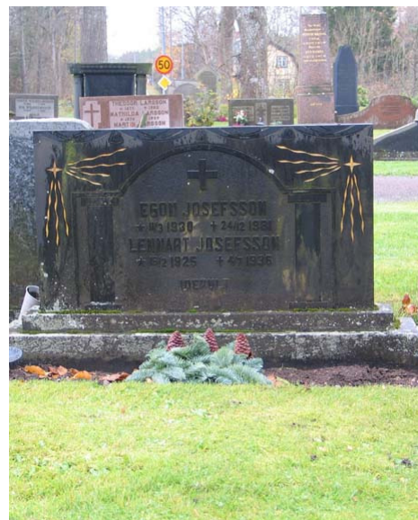
Exempel på en relativt vanlig typ av gravsten, rektangulär och med klassicerande dekor. Denna är från 1930-talet. (KI Karlslunda kyrkog 037)