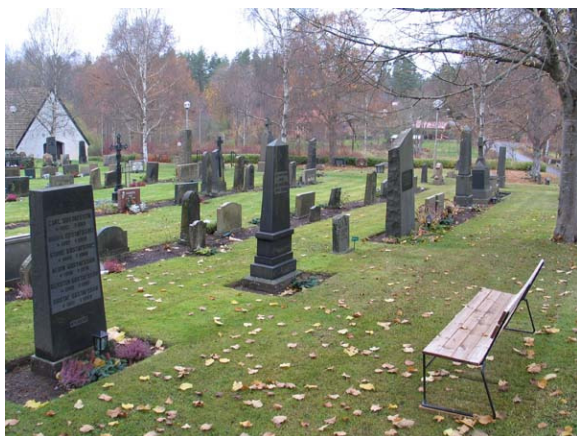
Kvarter II mot nordväst. Notera de äldre, höga gravvårdarna i kvarterets första rad mot öster. (KI Karlslunda kyrkog 058)

Kvarter II ligger längs kyrkans norra långsida och rymmer omkring 300 gravplatser. Kvarteret avgränsas av kyrkogårdsmur i öster och väster. I norr finns gamla kyrkogårdsmuren som numera ligger mellan den gamla kyrkogården och den utvidgade delen, kvarter III. Inga grusgångar finns i eller kring kvarteret. På det gräsbevuxna området är gravvårdar placerade i rader. Längs ytterkanten i öster, norr och väster finns en enkel rad med vårdar som är anlagd som en "ram" kring det inre området. Här är alla vårdar vända mot öster. Innanför "ramen" finns ryggställda rader, där varannan rad har vårdar vända mot öster och varannan mot väster. I dessa sammanlagt sju rader står gravstenarna i jordremсор. På gravkartan syns att här tidigare funnits rygghäckar mellan de ryggställda raderna. I den yttre ramen av gravvårdar finns påfallande många höga, äldre gravvårdar från 1900-talets början, medan profilen mestadels är lägre i kvarterets mitt. Framförallt gäller det i den västra hälften. I kvarterets mitt finns rester av linjegravssystem från 1920-40 talen, men det finns också enstaka äldre gravvårdar.