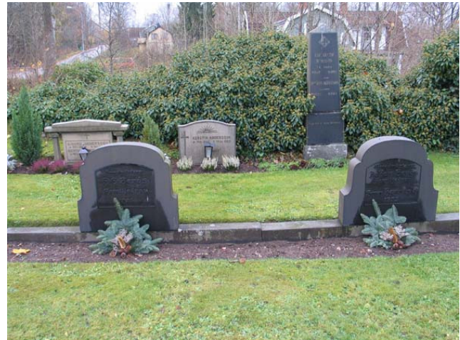
Två smedsmästare från samma familj, familjen Berg, begravda 1925 respektive 1933. De låga stenramarna som vårdarna är fästa i berättar att hela gravplatsen tidigare varit omgärdad av stenramar och belagd med grus. KI Karlslunda kyrkog 053