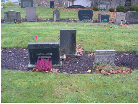
Små linjegravvårdar i kvarter II från 1941. (KI Karlslunda kyrkog 084)