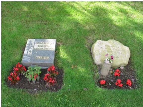
Två liggande vårdar från urngravsdelen. På den högra stenen anges den avlidnes yrkestitel: Brevbärare. (KI Karlslunda kyrkog 234)