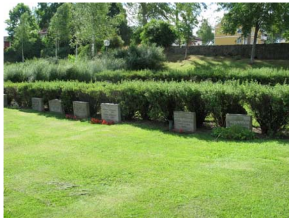
Exempel på mindre, ensartade vårdar från 1960-talet i sydost. (KI Karlslunda kyrkog 243)