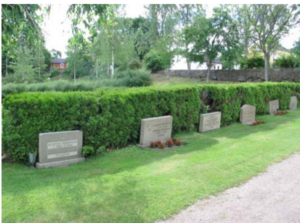
Exempel på utseende längs med huvudingången. (KI Karlslunda kyrkog 257)