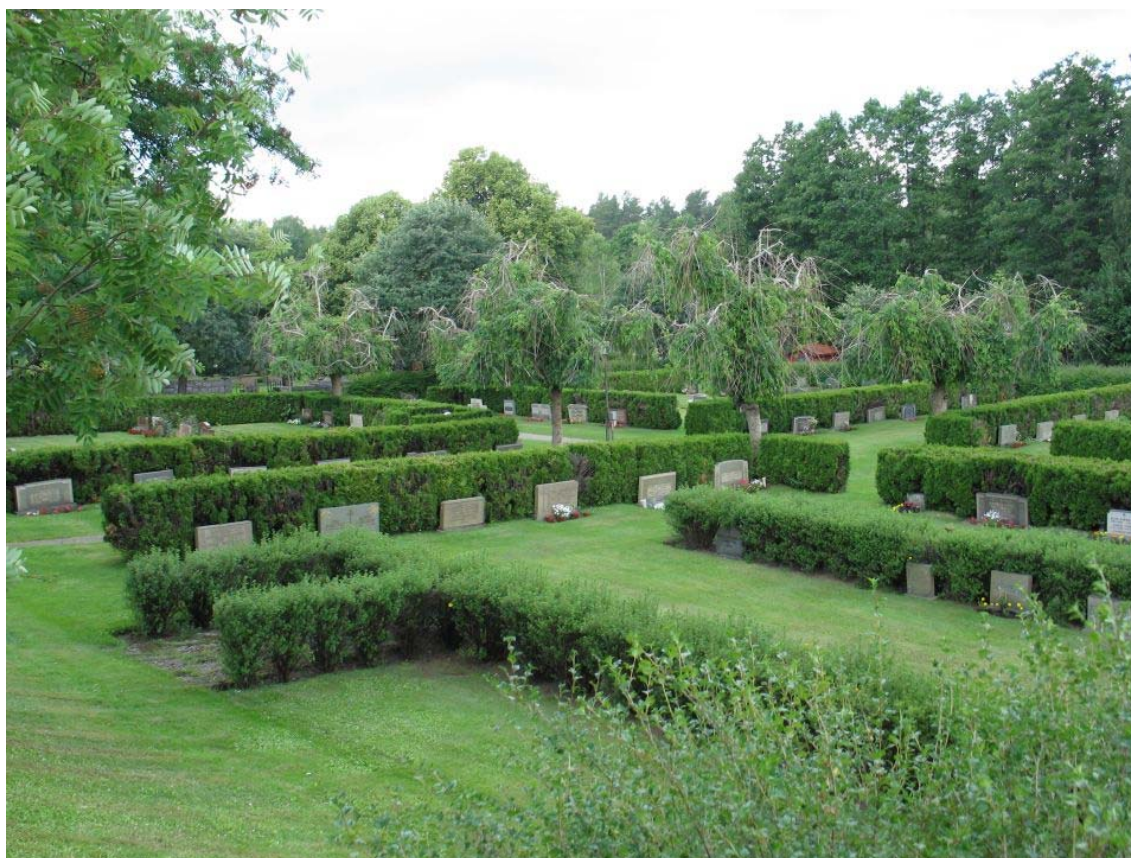
Vy över kyrkogårdens västra del. Bild tagen mot sydväst. (KI Karlslunda kyrkog 217)

Översiktskarta över Nya kyrkogården i Karlslunda utförd av Harry Kolsby 1997. Det röda streck som är draget över ritningen markerar gränsen för den kyrkogård som först anlades kring 1960. Karta från församlingens arkiv.