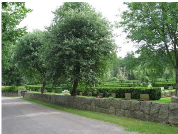
Omgärdningen mot väster med vallmur och oxlar. (KI Karlslunda kyrkog 199)