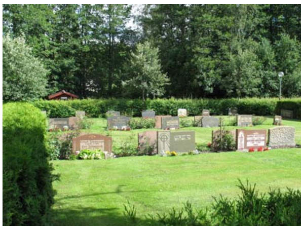
Exempel på utseende i den västligaste delen. (KI Karlslunda kyrkog 255)

I söder: En öppning i vällen och muren är utförd som förbindelse mellan kyrkogården och garaget under församlingshemmet. Kring öppningen har mur murats upp med natursten och betong. Från församlingshemmets tomt kan man via denna öppning komma in på kyrkogården.