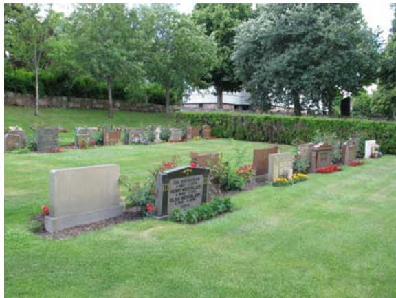
Exempel på gravvårdar i den sydvästra delen. Vårdarna står mot plantering med rosor. (KI Karlslunda kyrkog 238)

En grusgång löper från huvudingången i öster och fram till mitten av det område som är taget i bruk. Gången svänger sedan av söderut till garaget under församlingshemmet. Övriga gångar är omarkerade och består bara av gräsytor mellan rader och häckar.