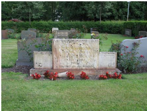
En av kyrkogårdens fyra marmorvårdar, varav ytterligare två är av samma typ. Daterad till 1983. (KI Karlslunda kyrkog 227)

mejeriföreståndare, polismästare. Ytterligare inskriptioner såsom bibelcitat förekommer bara i något fall.