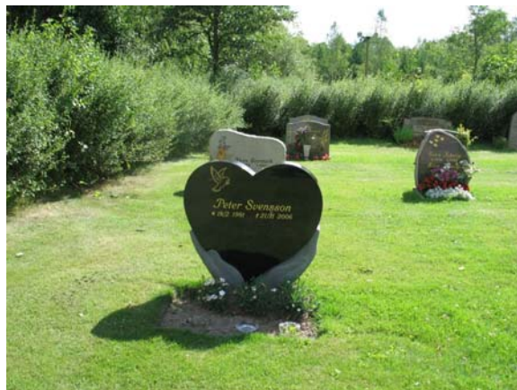
Vårdar från 1990- och 2000-talet har ibland ofta en friare utformning. Här en vård av svart granit från 2006 med två händer som håller ett hjärta. (KI Karlslunda kyrkog 249)