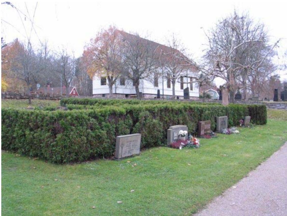
Nya kyrkogårdens placering i förhållande till kyrkan. Foto från 2005. (KI Karlslunda kyrkog 105)