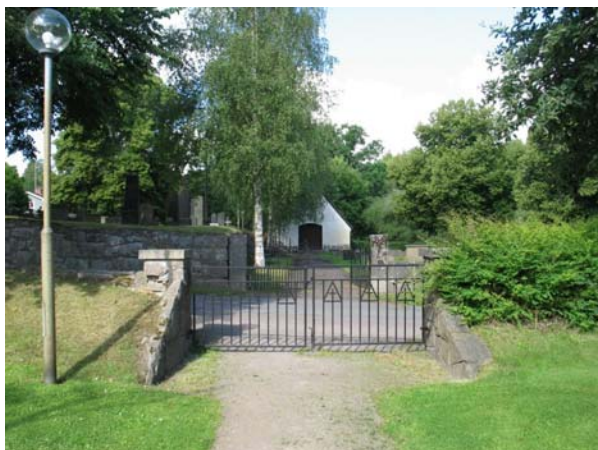
Grindpartiet vid huvudingången. Bild tagen mot väster. Den äldre kyrkogårdens bårhus skymtar i fonden. (KI Karlslunda kyrkog 209)