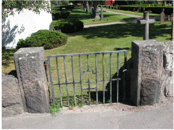
Grinden i nordväst som troligen användes mer innan utvidgningen. Idag är den "låst" och används ej (KI Ryssby kyrkog 196)

I väster: En ingång mitt för vapenhuset med svartmålade smidesgrindar mellan höga, kraftiga, vitputsade grindstolpar med tälttak av koppar. Ytterligare en ingång i väster, vilken sannolikt tidigare var en ingång in till den norra delen av dåvarande kyrkogården. I och med utvidgningen 1957 förlorade den sin betydelse och används numera inte utan är igensatt. Det är en svartmålad smidesgrind mellan stolpar av granit. Längst i nordväst finns en ingång mellan granitstolpar utan grind.