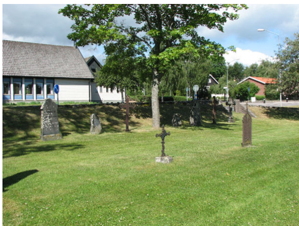
Musealt uppställda vårdar i kv III intill bårhuset (KI Ryssby kyrkog 069)

I samband med utvidgningen på 1950-talet och bårhusets uppförande avsattes en yta öster om det samma för att ställa upp vårdar som tagits ur bruk.