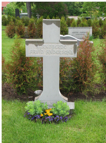
Korsformad, nyttillverkad efter branden, vård i kalksten (KI Ryssby kyrkog 045)