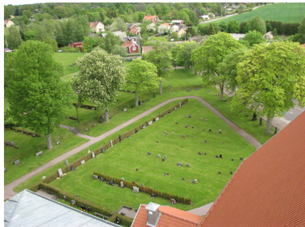
Översikt över kvarter IV (KI Ryssby kyrkog 055)