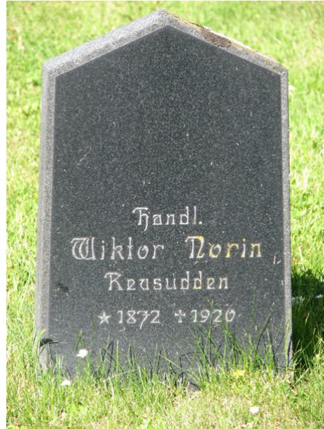
Den äldsta bevarade linjegravsvården i området, kv III (KI Ryssby kyrkog 087)

I kvarteren anges den avlidnes yrkestitel framförallt på de köpta gravplatsernas vårdar i kvarterets ytterkanter. Vanligast är lantbrukaren, hemmansägaren och nämndemannen. Övriga titlar som förekommer är: smeden, slaktarmästaren, friherre, friherrinnan, mjölnaren, köpmannen, fiskaren, mästerlotsen, skepparen, fyrmästaren, trädgårdsmästaren, byggmästaren, landstingsmannen, båtsmannen, skräddarmästaren, sy och vävnadsläraren, distriktsveterinären, elinstallatören, kronolotsen, kyrkoherden, kronofogden, tullvaktmästaren, bryggerimästaren, kyrkvården, kyrkvaktmästaren, skeppstimmermannen, folkskollärarinnan, mjölnaremästaren, kontraktsprosten, handlanden, smidesmästaren, sjökaptenen, kronojägaren, lotsförmannen och ryttmästaren. By-/gårdsnamn anges på merparten av vårdarna.