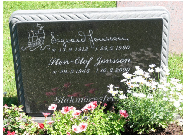
En lite ovanlig typ av modern vård (KI Ryssby kyrkog 166)