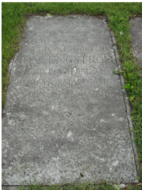
Vården över Jon Engström född 1794 och död 1870 på Knappegården (KI Ryssby kyrkog 026)