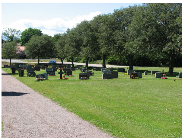
Översikt över kvarter VII (KI Ryssby kyrkog 162)

Kvarter V-VIII ligger längst i norr och nordost och utgörs av den utvidgning som gjordes på 1950-talet. I kvarteren finns platser planerade för nästan 1000 kistgravar och 138 urngravar. I områdets nordöstra del är kyrkogårdens senaste tillskott, minneslunden. Den invigdes 1997. Kvarteren omgärdas av den vallmur i väster och norr som uppfördes samtidigt med utvidgningen, i nordost är en stödmur och i söder utgör den gamla kyrkogårdsbegränsningen med den gamla trädkransen gräns. En höjdskillnad skiljer de olika delarna åt. En ingång finns från parkeringen i väster och en trappa leder upp till kyrkogården i nordost. Ytterligare en trappa och en grusgång förbinder den nya och den gamla delen. Urnlunden avgränsas med en låg vallmur. I kvarter V och VI står vårdarna mot häckar av spirea, tuja eller ölandstok. I kvarter VII och VIII finns inga rygghäckar. Ett par oxelträd är planterade inne i kvarteren. Trädkransen i norr utgörs också den av oxel. Gravvårdarna är placerade i gräsmatta. Vårdarna är låga och relativt jämnstora.