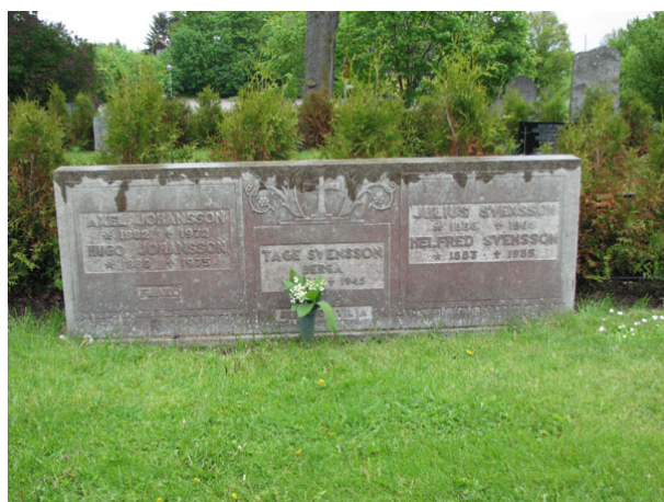
Bred familjevård från 1940-tal i kalksten (KI Ryssby kyrkog 039)