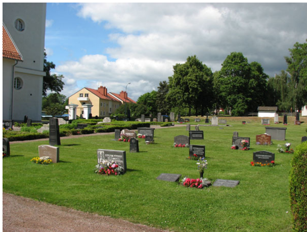
Översikt över kvarter III (KI Ryssby kyrkog 060)

I den yttre ramen av gravvårdar finns en hel del höga, äldre gravvårdar, medan de i de inre områdena har en lägre profil. I de bågige kvarterens mitt finns rester av linjegravssystem från 1920-talet fram till 1950-talet.