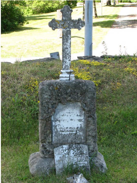
Sandstensvård med marmorplatta och kors. En marmorplatta till en idag försvunnen vård ligger framför (KI Ryssby kyrkog 064)

gjutjärnsstaket är en häst avbildad på grinden. Vårdarna är sköldformade plåtar som är fästa på staketet.