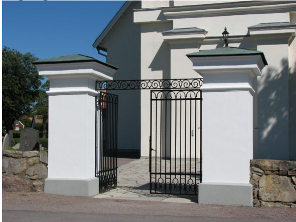
Ingången i väster (KI Ryssby kyrkog 203)