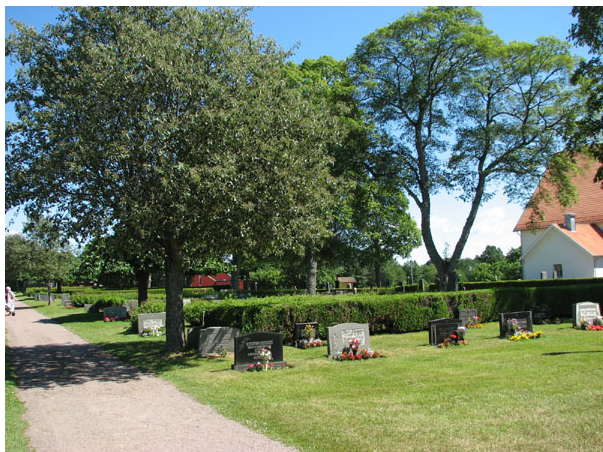
Översikt över kvarter V (KI Ryssby kyrkog 141)