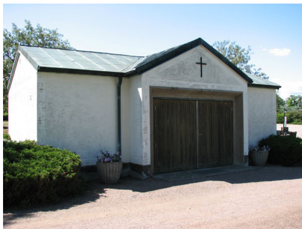
Bårhuset uppfört 1956 i den västra delen av kyrkogården (KI Ryssby kyrkog 199)