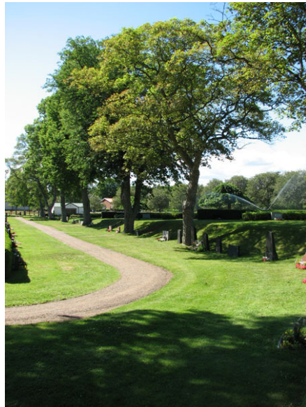
Grusade gånger och den äldre delen av kyrkogårdens trädkrans som är en del av kyrkogårdens gräns mellan den äldre och nyare delen (KI Ryssby kyrkog 214)