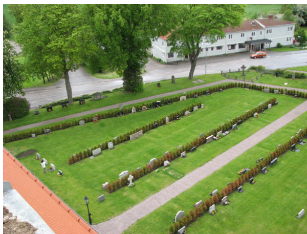
Översikt över kvarter II (KI Ryssby kyrkog 049)