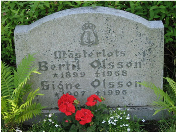
Ett fåtal vårdar i kvarteren har titlar (KI Ryssby kyrkog 144)

By eller gårdsnamn anges på drygt hälften av vårdarna. Den avlidnes yrkestitel anges på ett mindre antal av vårdarna. Hemmansägare är det vanligaste. Övriga titlar som finns i kvarteren är, skepparen, mästerlotsen, byggmästaren, postiljon, trädgårdsmästaren, charkuterihandlaren, nämndemannen, smedmästaren, affärsföreståndaren, skepparen, sadelmakarmästaren, fiskaren, montören, gästgivaren, hushållsläraren, folkskolläraren, smidesmästaren, bildhuggaren och sjökaptenen.