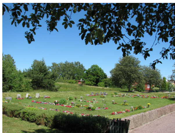
Översikt över urngravsområdet, kvarter VIII(KI Ryssby kyrkog 174)