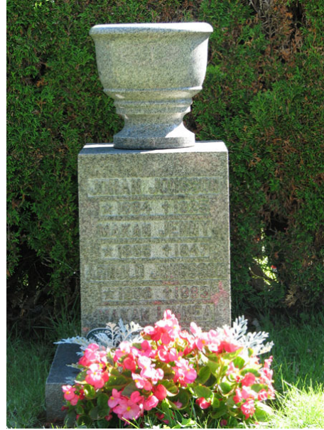
Vård från 1925 med urna (KI Ryssby kyrkog 126)