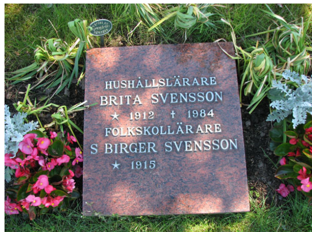
Liggande vård i urnlunden (KI Ryssby kyrkog 181)