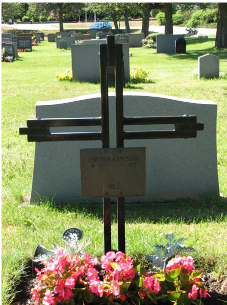
Modern smidesvård, kv VII (KI Ryssby kyrkog 171)