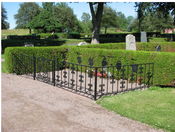
Familjen Rappes gravplats. Notera det fina gjutjärnsstaketet och sköldarna med namn på (KI Ryssby kyrkog 118)

I kvarteren anges den avlidnes yrkestitel framförallt på de köpta gravplatsernas vårdar i kvarterets ytterkanter. Vanligast är lantbrukaren, hemmansägaren och nämndemannen. Övriga titlar som förekommer är: smeden, slaktarmästaren, friherre, friherrinnan, mjölnaren, köpmannen, fiskaren, mästerlotsen, skepparen, fyrmästaren, trädgårdsmästaren, byggmästaren, landstingsmannen, båtsmannen, skräddarmästaren, sy och vävnadsläraren, distriktsveterinären, elinstallatören, kronolotsen, kyrkoherden, kronofogden, tullvaktmästaren, bryggerimästaren, kyrkvården, kyrkvaktmästaren, skeppstimmermannen, folkskollärarinnan, mjölnaremästaren, kontraktsprosten, handlanden, smidesmästaren, sjökaptenen, kronojägaren, lotsförmannen och ryttmästaren. By-/gårdsnamn anges på merparten av vårdarna.