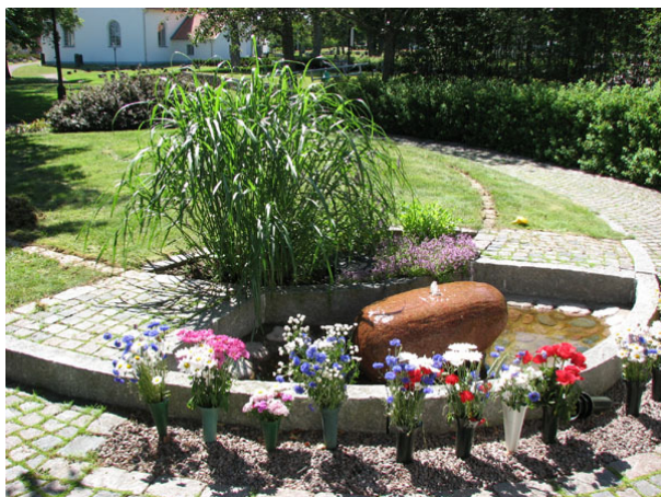
Minneslunden tillkom 1997 (KI Ryssby kyrkog 188)