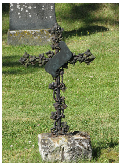
En ovanlig gjutjärnvård, rest 1902 uppställd intill bårhuset (KI Ryssby kyrkog 070)