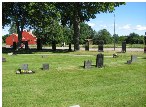
Man kan fortfarande följa linjegravssystemet även om flera vårdar tagits bort (KI Ryssby kyrkog 135)