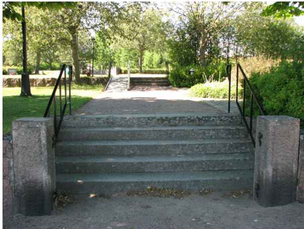
Två trappor leder upp till nivån på den nya delen av kyrkogården. Till vänster skimtar en stödmur från utvidgningen 1957 (KI Ryssby kyrkog 189)