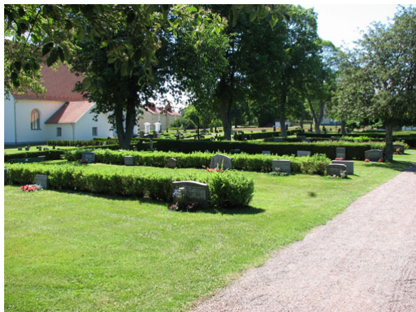
Översikt över kvarter VI (KI Ryssby kyrkog 161)