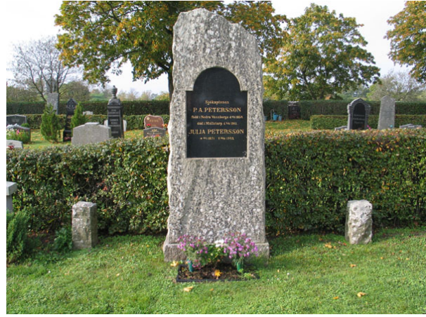
Monumental vård över en sjökaptan i kv S-V.