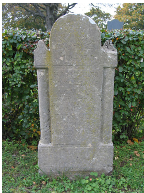
Äldre kalkstensvård i kv S-O.

I hörnet mellan långhus och sakristia står en solvisare av kalksten.