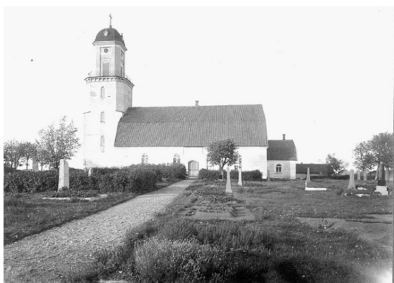
Kyrkogården från söder, 1918.