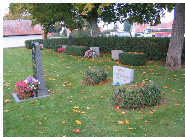
Ostligaste delen av kv N, med murgrönskullar.