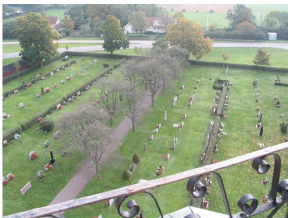
Utsikt från tornet över kvarteren söder om kyrkan.

Kvarter S-V och S-Ö är belägna söder om kyrkan och utgör två lika stora hälften på var sida om mittgången som är kantad av en oxelallé. Kyrkogården är öppen och överskådlig med en blandning av ålderdomligt och modernt. Stora monumentala vårdar finns över hela området men man kan ana en koncentration till platserna utmed mittgången, den sydvästra delen samt närmast kyrkan. Marken i kvarteren är helt insådda med gräs. De gravrader som är ryggställda har en låg rygghäck. Gravvårdarna är placerade i rader och vända mot öster eller väster. Flera lediga gravplatser finns i båda kvarteren.