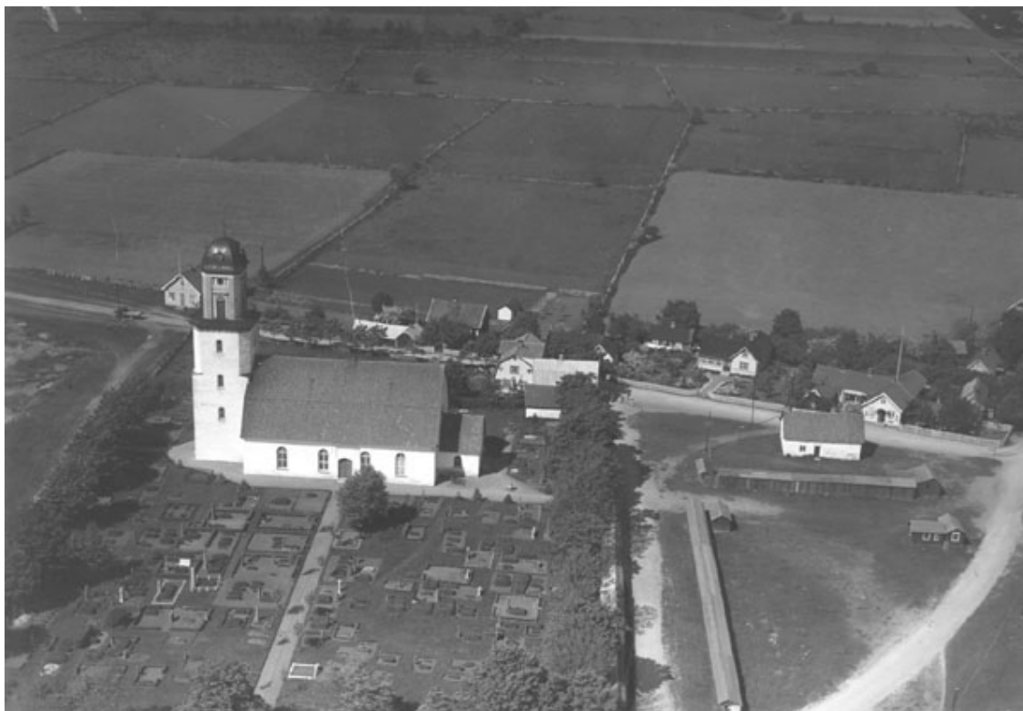
Flygfoto från 1935.