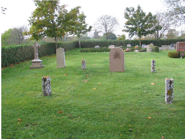
Gamla kalkstensvårdar i kv S-V.