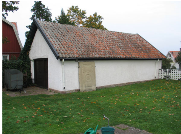
Boden i kyrkogårdens nordöstra hörn. Sedan 1950-talet står en gravhäll i skydd under takfoten.