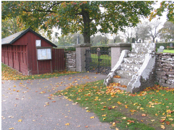
Marknadsbodar, smidesgrindar och klivstätta vid den östra ingången.

I kyrkogårdens nordöstra hörn finns en stenbod med vitputsade fasader under ett sadeltak täckt med enkupigt gammalt tegel. Den byggdes mellan 1874 och 1884.