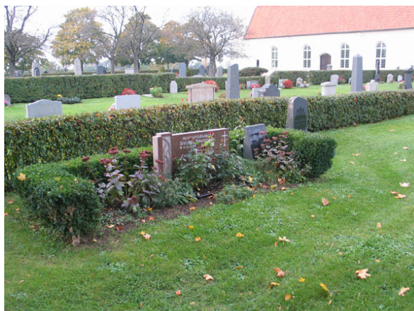
Kvarter S-Ö från det sydöstra hörnet av kyrkogården.