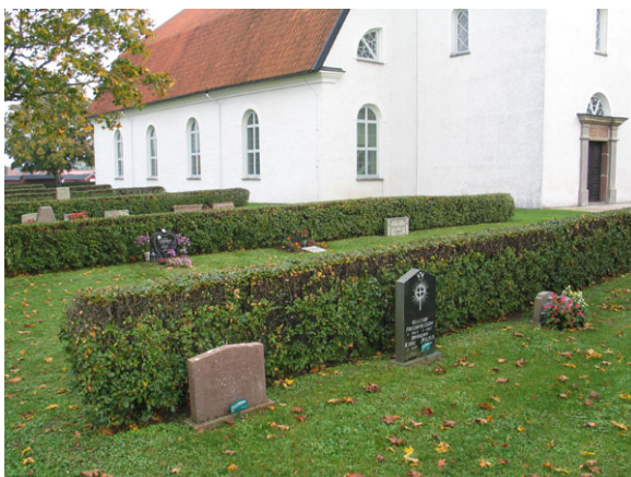
Kv N, från öster.

Kvarter N är beläget norr och nordost om kyrkan. Norr om kyrkan är gravplatserna ordnade i ryggställda rader i nord-sylik riktning med en låg rygghäck emellan. Mot väster finns de flesta platserna mot muren men är i övrigt kraftigt utglesat. Marken är insådd med gräs och där finns inga gångar. Till skillnad från på kyrkogårdens södra sida saknas helt monumentala och mer påkostade vårdar.