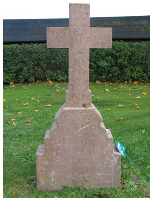
Äldre kalkstensvård i kv S-O.