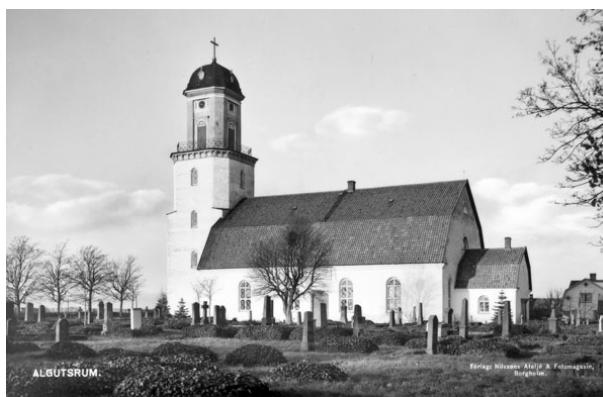
Kyrkogården från söder, ca 1930-40-tal.