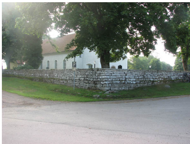
Kyrkogårdens mur från nordväst. (KI N Möckleby kyrkog 016)