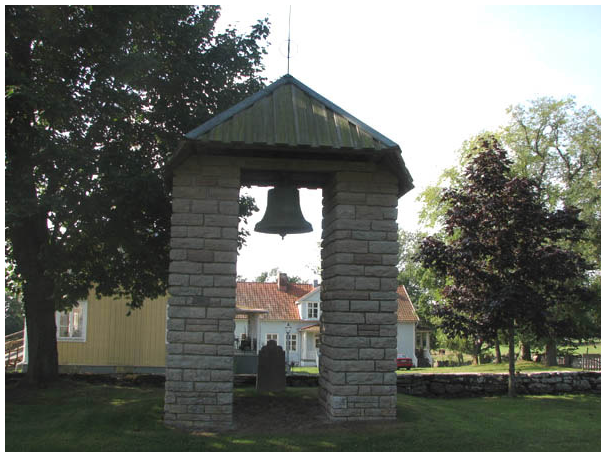
Klockstapeln för den spräckta klockan från 1600-talet byggdes på 1960-talet i södra delen av kvarter A. (KI N Möckleby kyrkog 025)

Under 1990-talet kan man se en uppluckring av bestämmelserna kring gravvårdarnas utformning. Idag är formerna mer varierande och ofta mjukare. Under 1900-talets första hälft var det vanligt att man omgärdade gravplatserna och belade dem med grus. På Norra Möckleby kyrkogård har funnits omgärdningar i form av häckar, stenramar och gjutjärnsstaket. Idag finns endast enstaka rester kvar av detta. Under 1900-talets första hälft var det också vanligt att ange den dödes yrkestitel på gravvården. På Norra Möckleby kyrkogård finns gravvårdar med titlar men inte i någon större omfattning. Titlarna försvann i det närmste i mitten av århundradet. Under senare år har en ny form dykt upp. Gravvården får en dekor som knyter an till den dödes intresse eller yrke, men detta har ännu inte blivit vanligt på Norra Möckleby kyrkogård. På landsortskyrkogårdar har det under hela 1900-talet varit vanligt att ange från vilken by eller gård den döde kommer. På Norra Möckleby kyrkogård finns det angivet på majoriteten av vårdarna.