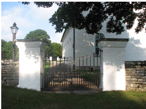
Kyrkogårdens ingång i öster. De dubbla smidesgrindarna bekostades av bönderna i den södra delen av socknen 1831. (KI N Möckleby kyrkog 004)