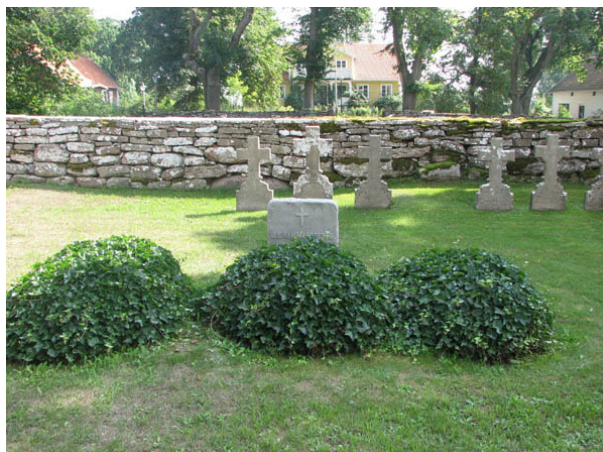
Fram till mitten av 1900-talet fanns flera gravkullar av murgröna på N Möckleby kyrkogård. På bilden syns tre av kyrkogårdens fyra bevarade gravkullar. I bakgrunden syns några av de ålderdomliga kalkstenskors som står uppställda utmed kyrkogårdens östra mur. De ska vara tillverkade av en stenhuggare Jansson från Långrälla. (KI N Möckleby kyrkog 051)