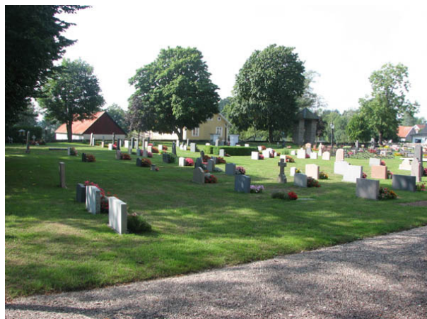
Kvarter B från nordost. (KI N Möckleby kyrkog 030)