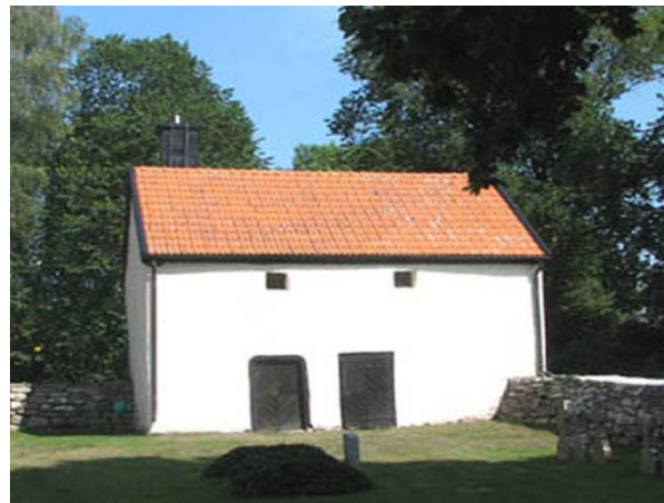
Den f.d. likboden som idag används som förråd. Golvet i byggnaden är lagt av gamla gravhällar. (KI N Möckleby kyrkog 068)