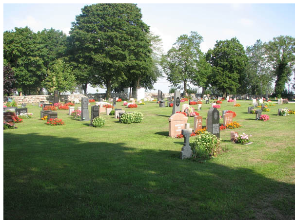
Kvarter A från sydost. (KI N Möckleby kyrkog 018)

Kvarter A och B är belägna söder om kyrkan och kvarter C runt kyrkan i övriga väderstreck. Flest gravplatser finns i de båda kvarteren söder om kyrkan. Gravvårdarna är placerade i rader och vända mot öster eller väster. I kvarter A är samtliga vårdar vända mot öster. Flera lediga gravplatser finns i samtliga tre kvarter. Kyrkogården är öppen och överskådlig med en blandning ålderdomligt av och modernt.