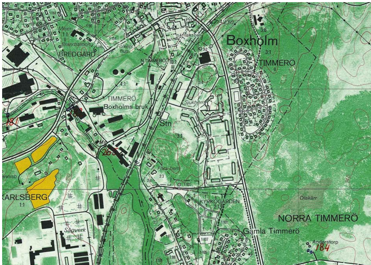
Utsnitt av ekonomisk karta 1983, blad 8F 0b Boxholm