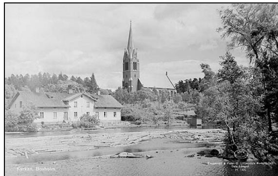
Boxholms kyrka 1935 och 1949.