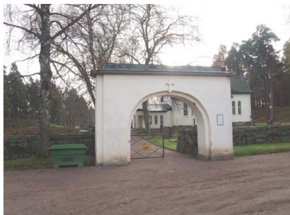
Huvudingången till kyrkogården.

Kapellet ligger på kyrkogårdens nordvästra del, nära huvudingången i norr. Till skillnad från många andra kapell ligger det inte orienterat med entrén i slutet av en gång, utan vinkelrätt mot huvudingången. Troligen låg det äldre kapellet på samma plats. Väster om kapellet finns en skogsklädd höjd, som skiljer kyrkogården från kyrkan och församlingshemmet.