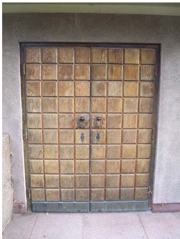
En av de båda källardörrarna.

I kor och långhus är det rundbågiga fönster med vitmålade träbågar och spröjsverk. Fönstren är indelade i en övre och en undre del och sitter samlade i grupper. I entrédelen finns ett rakslutet enlufts-fönster mot norr och två mot söder med isolerglas. Dessutom finns tre rundbågiga fönster med vitmålade och spröjsade träbågar på entrédelens norra långvägg. Källarfönster. Både entrén i nordöst och källarnedfarten i sydväst har rakslutna pardörrar, troligen i ek, med panel i ruttmönster och dekorativa låsbrickor och portklappar. Till källaren är det två dörröppningar i en vägg av terrazzo eller liknande cementmaterial. Entrén i nordöst är inbyggd under sadeltak med trappor och en handikappramp i granit. Till rampen hör ett räcke i smidesjärn.