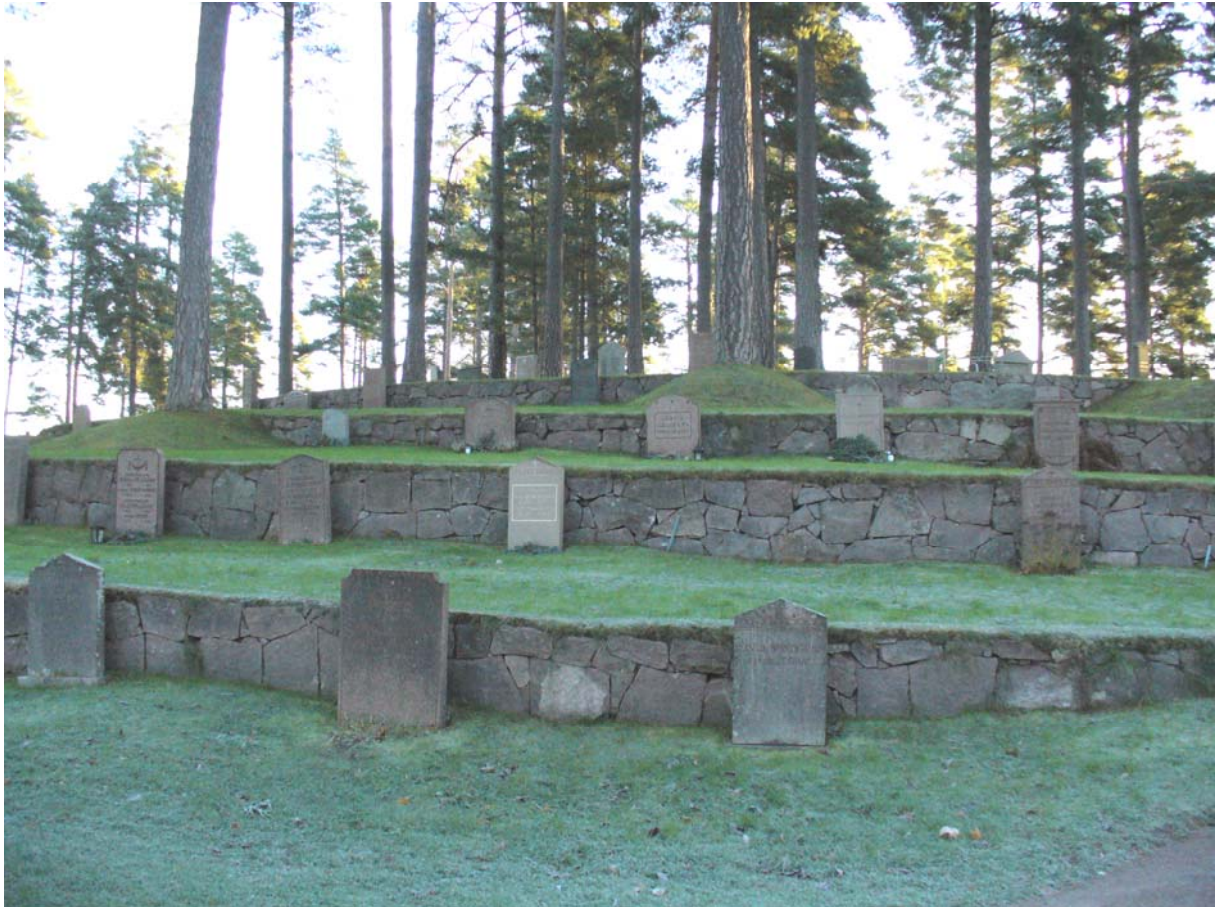
Ett av de kvarter på kyrkogården som utformades av Harald Wadsjö. Foto 2006.

gjordes 1959 och i två omgångar på 1960-talet lades de äldre delarna av kyrkogården om och grusade ytor inklusive grusgravar grästäcktes. Även en del gångar mellan olika kvarter lades igen med gräs. Tidigare hade gravvårdarna varit vända mot söder, men nu ställdes de rygg mot rygg med en rygghäck mellan raderna.