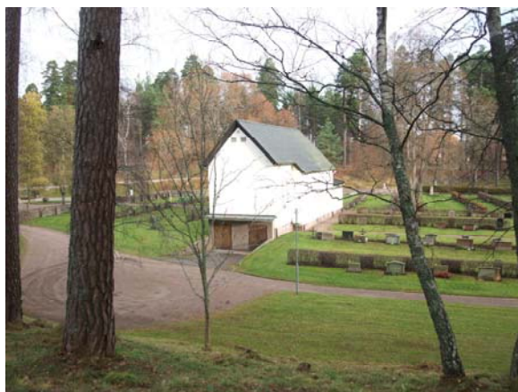
Kapellet från väster.