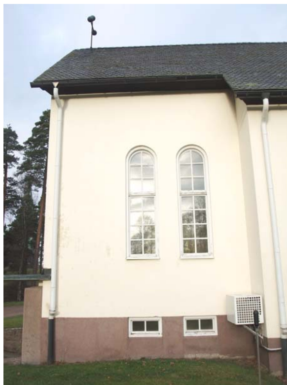
Korets södra sida.