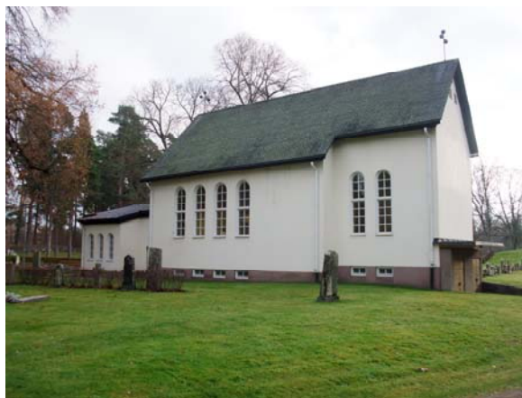
Kapellet från öster.