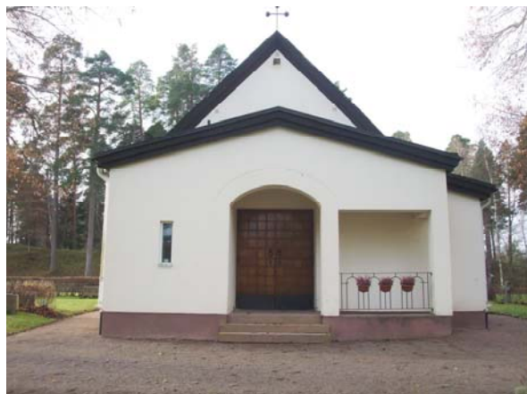
Kapellets entré i nordöst.