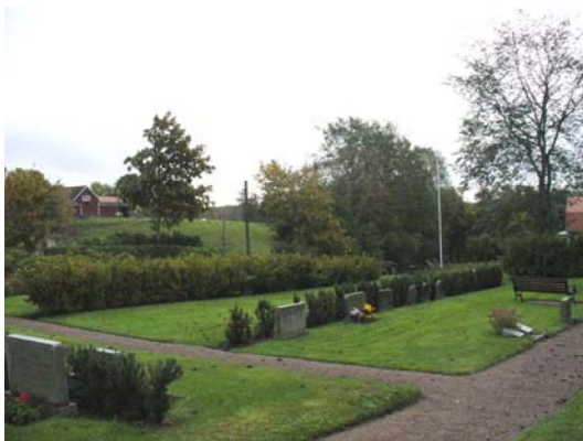
Kvarter C, södra delen från nordväst.