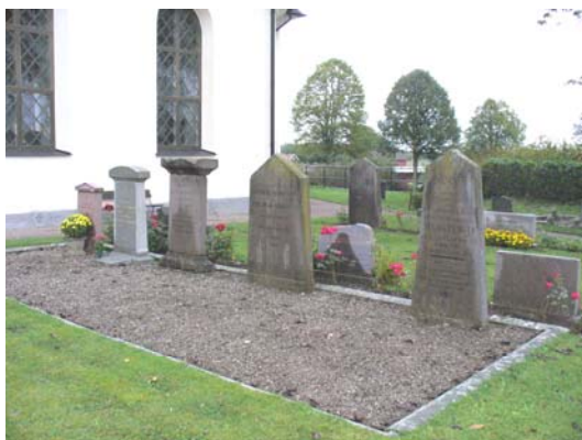
Familjegrav med äldsta årtalet 1831.

I norra delen står fem kalkstensvårdar från 1831-1873 samt en korsvård. Tre av kalkstensvårdarna hör till en stor familjegrav, grusad med stenram för Särstad. Det finns en stenramsgrav med gräs. I kvarterets södra del står en kalkstensvård från 1899. Det är relativt många vårdar från 1930-talet och låga, breda sentida vårdar.