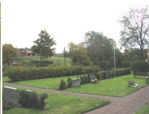
Kvarter C, södra delen från nordväst.