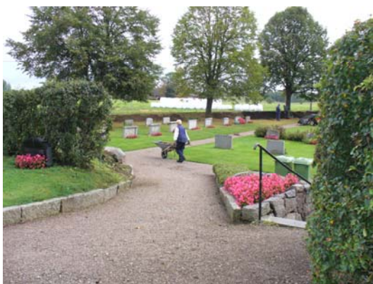
Kvarter D från sydväst.

Kvarteren har en öppen karaktär med tre enkla gravrader i kvarter D i väst/östlig riktning. I kvarter E går gravraderna i nord/sydlig riktning och endast västra delen är tagen i anspråk.