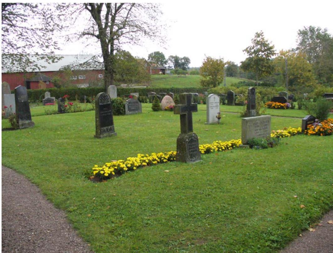
Kvarter B från nordväst.

Kvarteret omfattar gravplats nr B 1-148 och ligger söder om kyrkan med kvarter C i väster, söder och öster.