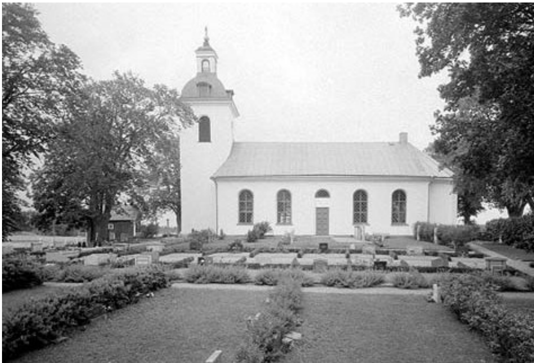
Foto ca 1970. Flera grusgravar omgärdade med häckar finns fortfarande kvar i södra delen av kvarter B. I förgrunden syns linjegravsområdet i kvarter C.