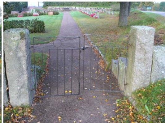
Nordöstra grinden (utvidgade delen).