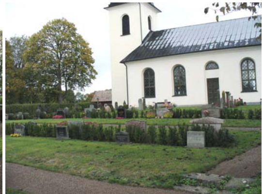
Kvarter B från sydöst.