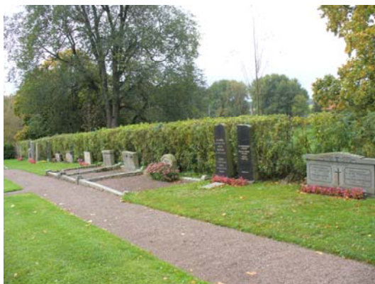
Kvarter C, västra delen från norr.

Kvarterets södra del har delvis linjegravskaraktär. Det finns en del äldre vårdar framför allt vid västra muren där några gravar är äldre familjegravar.