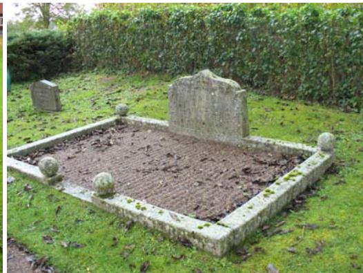
Gravanläggning troligen från 1920-talet.