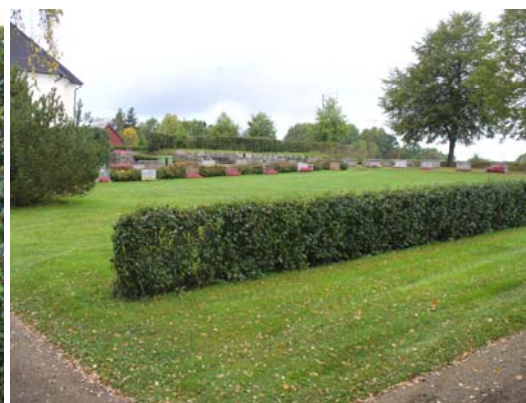
Kvarter E från sydöst.