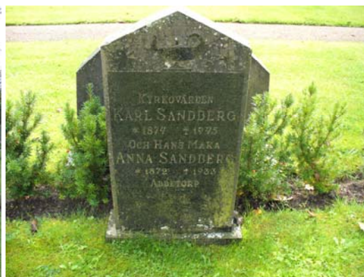
Gravvård med årtalen 1933 och 1945.