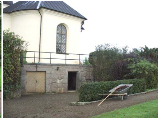
Bisättningsrummet från sydöst.