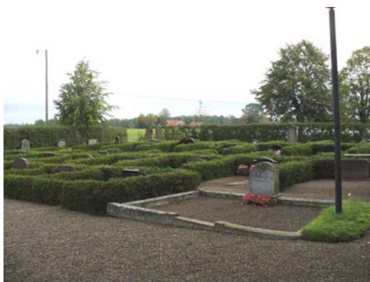
Kvarter A, östra delen från sydväst.

Kvarter A omfattar gravplats nr A 1-204 och ligger på kyrkogårdens norra del med kyrkplanen utanför kyrkogården i väster, landsvägen i norr, kvarter D på 1961 års utvidgning i öster och kyrkan i söder.