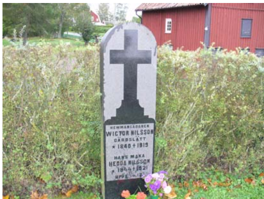
Gravvård med årtalen 1919 och 1921.

En del sentida låga och breda vårdar, framför allt i östra delen, i övrigt högre vårdar eller låga i svart granit eller kalksten. Östra delen har mönsterkrattade grusgravar omgärdade av klippta tujahäckar. Det finns några ålderdomliga gravvårdar i röd kalksten, varav två har årtal 1874. De är de äldsta gravvårdarna på denna del av kyrkogården. Tre stenramsgravar, en med grus och två med gräs, en delvis övervuxen stenramsgrav.