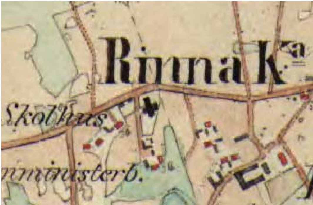
Utsnitt ur häradsekonomska kartan 1868-77, Rinna. Utvidgningen av kyrkogården mot norr är inlagd på kartan. Tecknet för själva kyrkan är missvisande för kyrkans orientering.