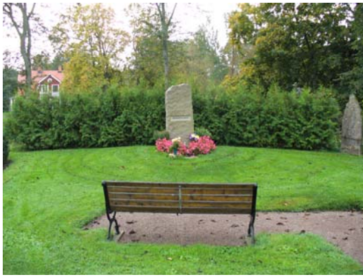
Minneslunden från norr.