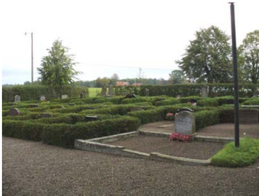
Kvarter A, östra delen från sydväst.