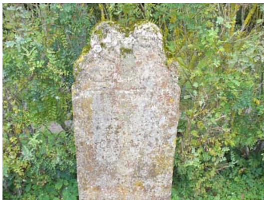
Kalkstensvård med årtalet 1726.

På kyrkogården finns flera gravvårdar av kalksten. De äldsta är två gravvårdar från 1697 respektive 1760 söder om kyrktornet samt två gravvårdar från 1703 respektive 1726 på kyrkogårdens sydvästra hörn. I övrigt är det ca tio kalkstensvårdar från 1800-talet. I övrigt är det inte så många speciella typer av gravvårdar representerade - det finns en sköldformad gravvård i svart granit. I kvarter A utgörs den östra delen, med undantag av en rad invid muren, av grusgravar omgärdade av klippta tujahäckar. Det finns även ett antal grusgravar med stenram. I kvarter B och C är det sammanlagt sju gravar som är omgärdade med stenram. Södra delen av kvarter C är delvis ett linjegravsområde med små gravvårdar. Rent allmänt är något högre gravvårdar blandade med sentida låga och breda vårdar.