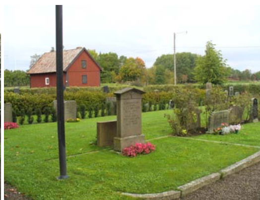
Kvarter A, västra delen från sydöst.