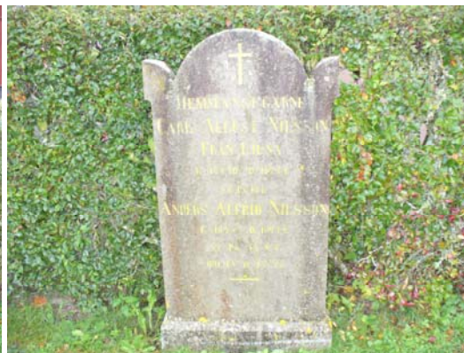
Gravvård med årtalet 1874.