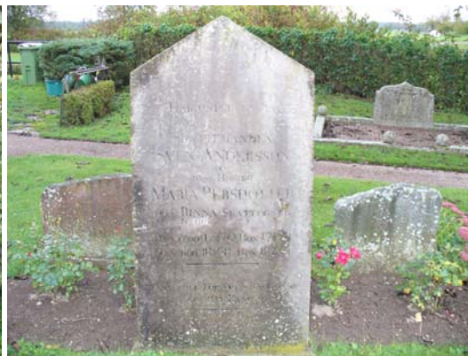
Gravvård från första delen av 1800-talet.