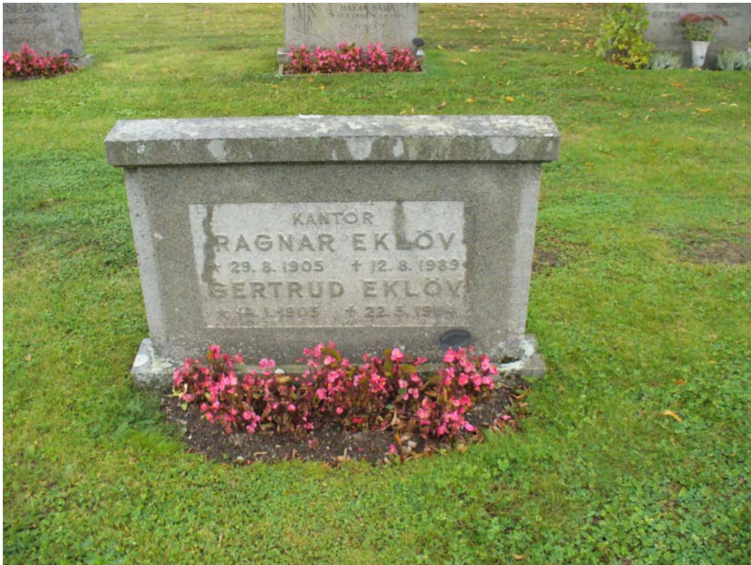
Gravvård som är representativ för kvarteren D och E.