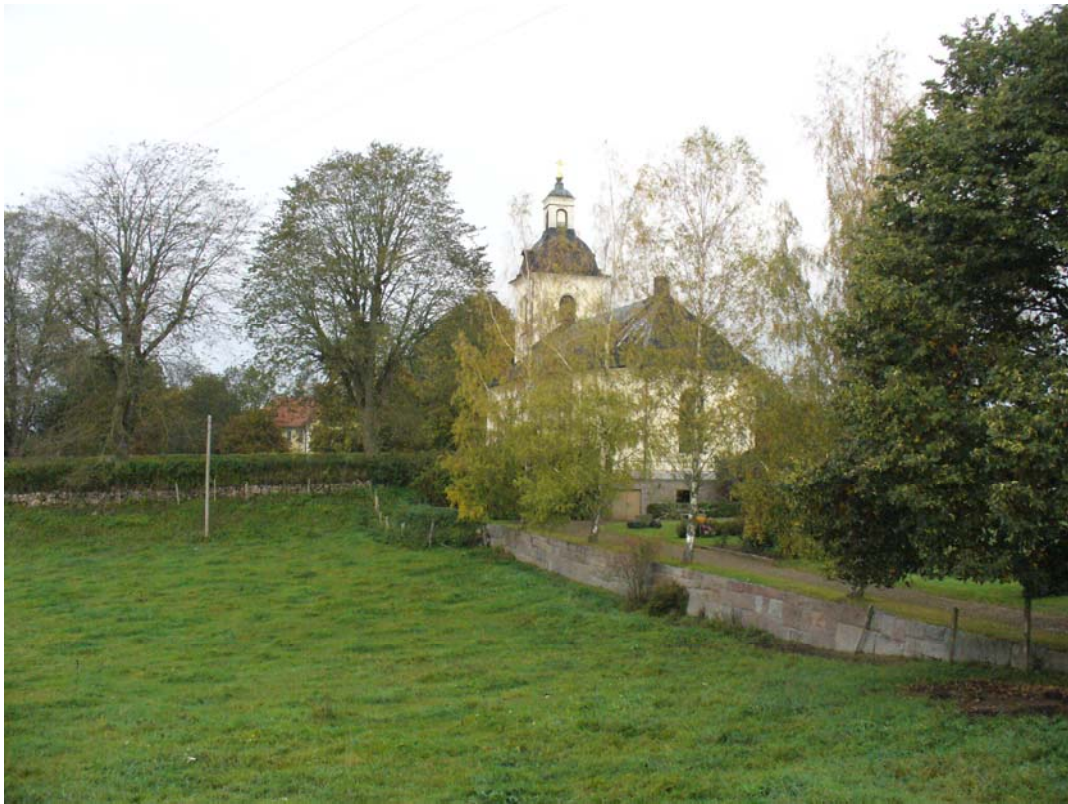
Vy från öster.