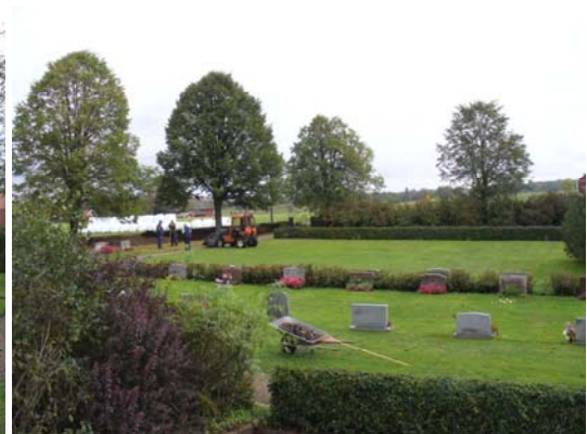
Kvarter D och E från sydväst.