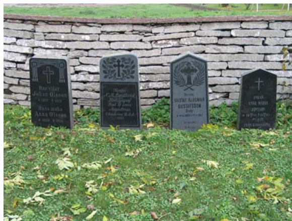
Granitvårdar vid norra muren.