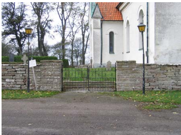
Grindarna från 1864 i den östra muren.

I den östra muren, intill byggnaden i kyrkogårdens nordöstra hörn, finns en klivstätta. Den består av en flisa på högkant i en öppning i muren. Det är osäkert hur gammal den är. Den finns inte med på N.I.Löfgrens teckning från 1816.