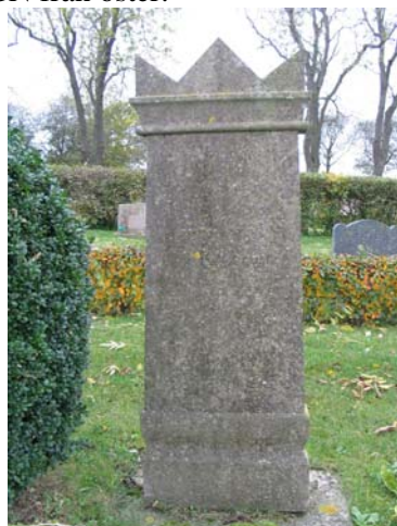
Kalkstensvård från 1891.