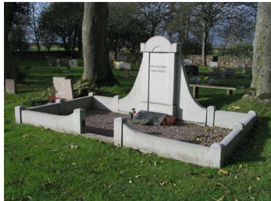
Den enda kvarvarande gravplatsen med stenram och grusad yta. Kvarter GS.