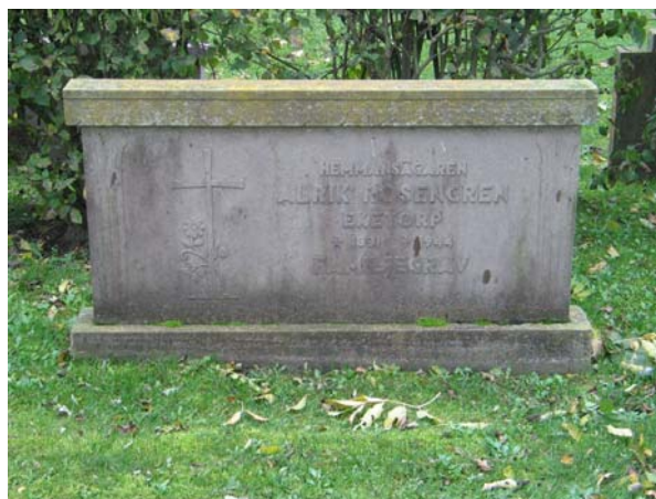
Tidstypisk vård i röd kalksten från 1940-talet