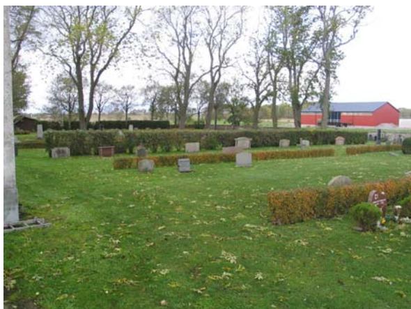
Kvarter GN från öster.

Kvarteret ligger på norra sidan av kyrkan och har liknande struktur som kvarter GS på södra sidan. De ryggställda vårdarna är ordnade i nord-sydliga rader med rygghäckar. Häckarna är emellertid mycket lägre på norrsidan och är av oxbär istället för tuja. Mitten av kvarteret markeras av en hög rygghäck av syren. En syrenhäck finns även planterad utmed norra kyrkogårdsmuren, intill den vitputsade byggnaden i kyrkogårdens nordöstra hörn. Samtliga gravplatser och gångar är insådda med gräs. Gravvårdarna är av varierande åldrar. Kvarteret har en påtagligt lägre profil genom att där inte finns lika många höga vårdar som på den södra sidan.