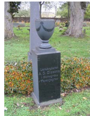
Granitvård med urna på sockel.