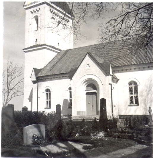
Södra sidan av kyrkogården, år 1953.

År 1945 planerades och dränerades den gamla kyrkogården och 1950 utvidgades den åt väster. Hur kyrkogården såg ut efter dessa åtgärder går att ana sig till genom fotografier. Bilder i Kalmar läns museums arkiv visar hur kyrkogårdens södra sida såg ut i början av 1950-talet. Många av gravvårdarna känns igen från idag. Men istället för gräs på marken finns där låga häckar av buxbom, och krattat grus på gångar och gravplatser. Rygghäckarna av tuja är troligen desamma som fortfarande finns kvar.