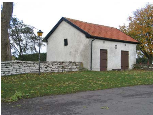
Byggnaden från 1814 i kyrkogårdens nordöstra hörn.