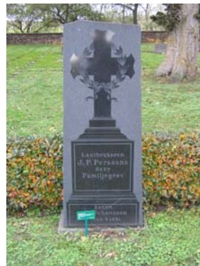
Typisk påkostad familjevård i svart granit.