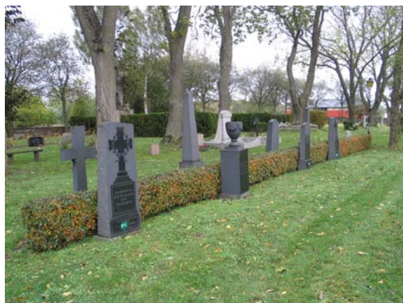
Trädkransen och de höga familjgravvårdarna markerar gränsen mellan den gamla kyrkogården och utvidgningen från omkring 1950.