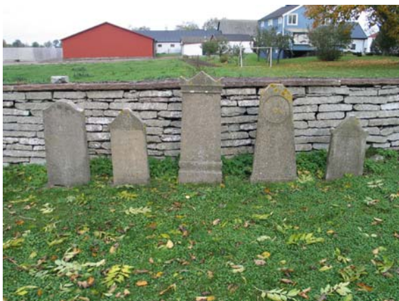
Kalkstensvårdar vid norra muren.

Utmed den norra kyrkogårdsmuren står många gravvårdar som tagits bort från sina ursprungliga platser. Det rör sig främst om kalkstensvårdar från sent 1800-tal och mindre vårdar i svart granit från tidigt 1900-tal. Dessa vårdar är inte så vanliga längre ute på kyrkogården. Det finns därför ett stort kulturhistoriskt värde i att vårdarna fortfarande finns att beskåda för besökare på kyrkogården. Även närmast kyrkan, på södra sidan, står två kalkstensvårdar från sent 1870-talet musealt uppställda. Samtliga dessa kalkstensvårdar bör föras upp på församlingens inventarieförteckning.