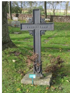
Kyrkogårdens enda gjutjärnsvård.