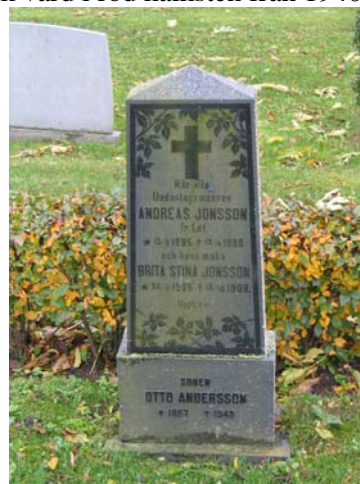
Vård i svart granit med titeln