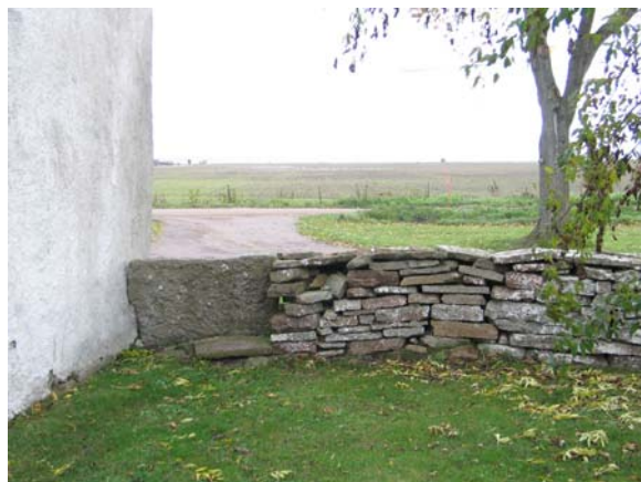
Klivstättan i östra muren.