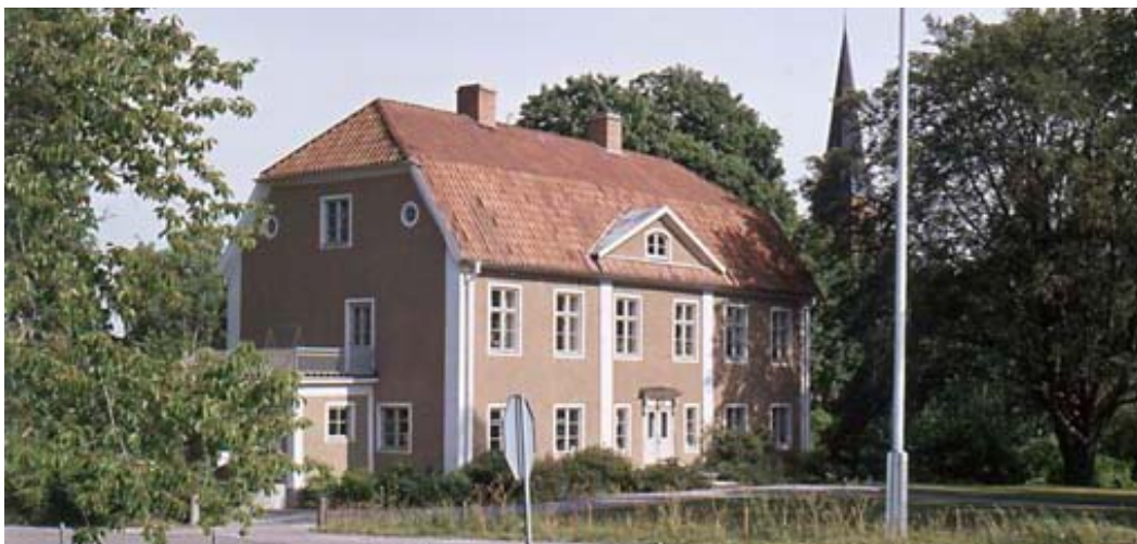
Prästgården med kyrkan i bakgrunden 1976.