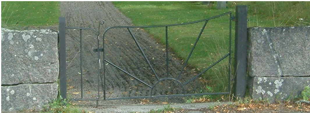
Grind i den södra muren till den utvidgade delen.

Till den nyaste kyrkogårdsdelen som stod färdig 1972 finns i väster en anslutning till gamla kyrkogården via en trappa och en ramp och till 1946 års kyrkogård via en öppning i muren.