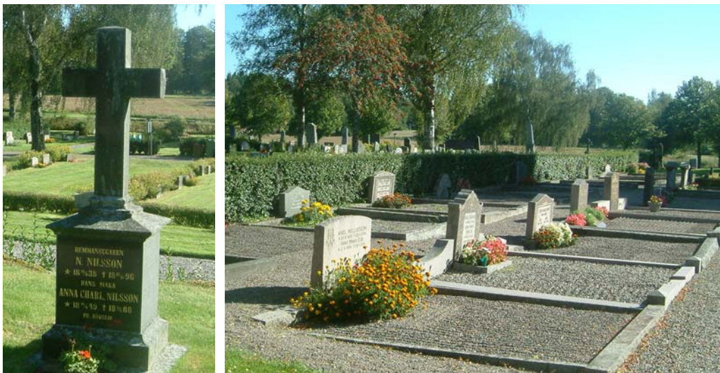
Gravvårdar i kv. D. Det vänstra korset är från 1888, nr 51. Den högra bilden visar de två raderna av grusgravar i kv. D. Närmast i bild syns nr 71-87.

I kv. D finns flera grustäckta gravar på den västra sidan. I utkanten av kvarteret, särskilt i dess södra del, finns ett relativt stort antal höga smala vårdar från tiden kring 1900. Den inre delen av kvarteret var tidigare linjekvarter men idag är så gott som alla vårdar ersatta med yngre, från 1960 och framåt. Enstaka äldre finns kvar. Stora partier har ännu inte åter tagits i anspråk för gravvårdar. Titlar i kv. D är bl.a. kyrkoherde, kättingsmeden, rusthållaren, predikanten, skräddarmästaren, kronojägaren.