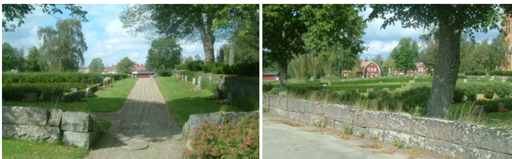
Till vänster ses den östra muren med grusgång till ingången i västra muren. Bilden till höger visar den södra muren.