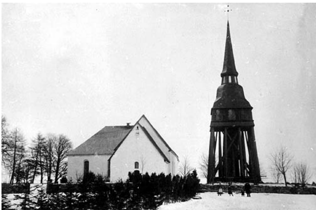
Hällestads kyrka och klockstapel fotat före branden 1893. Klockstapeln flyttades sedan till Skansen. Foto ur Östergötlands läns museums samlingar.

Hällestad är en medeltida sockenbildning och omnämns 1316 som Herlastadh . Socken hör naturgeografiskt till det område som betecknas Norra skogsbygden med Östergötlands bergslag. Området blev koloniserat under medeltiden. Det är rikt på mineraler och bruksbygderna dominerar alltjämt landskapet. Socken domineras av skogsbygd, men runt kyrkan och i socknens mellersta delar öppnar sig en bördig slättbygd med tätare bebyggelse. Socknens största och äldsta bruksegendom är Sonstorps bruk, som fick privilegium år 1580. Bland de övriga bruken bör framför allt Borggårds bruk och Grytgöls bruk nämnas.