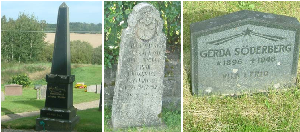
Tre exempel på gravvårdar i kv. B. Från vänster en obelisk, nr 16 från 1909. I mitten en barockinspireerande kalksten, nr 165 från 1921 samt till höger en linjevård, nr 253, från 1948.

I utkanten av kvarter C och D längs den södra muren, finns ett relativt stort antal höga smala vårdar från tiden kring 1900. I öster finns en större gravanläggning avsedd för familjen Trädgårdh (ägare till Borggårds bruk) som också har en familjegrav i form av en sarkofag alldeles intill. Inne i kvarteret finns främst vårdar från tidigt 1900-tal men även enstaka yngre förekommer. Ett fåtal järnkors och träkors finns. Ett av järnkorsen är rest över Karl Erik Bergsten, geologiprofessor i Lund och författare till en avhandling om de östgötska bergslagren. Det finns gott om olika titlar på gravvårdarna i kv. C exempelvis mjölnaren, bruksägaren, fiskhandlare, grenadjären, skorstensfejaren, droskägare, packmästaren, skogvaktarhustrun.