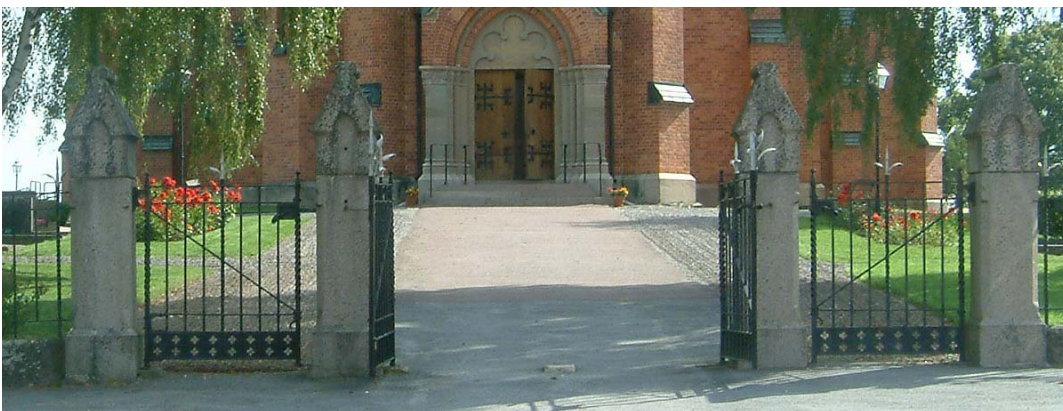
Huvudingången på den västra sidan.

Huvudingången till den gamla kyrkogården och kyrkan finns i väster. Den består av en bågformad utvidgning av västra muren med järnstaket och grindar. Den bågformade utvidgningen har ett svartmålat smidesjärnstaket med delvis vridna spjälor. Detta kröns av silverfärgade liljeformade kronor. Grindarna är utförda på liknande sätt. Staketet står på en låg stenram. Själva grinden har fyra lika höga firsidiga smala stolpar med huggna huvar. Grindarna består av två enkelgrindar och en pargrind ornerad på samma sätt som staketet, med tillägg för att pargrinden har en bottenbård av blomornament. Hela arrangemanget avgränsas av två firsidiga grindstolpar med svagt spetsade huvar.