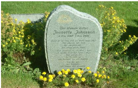
Exempel på modern vård från 2001 med en lång dikt.