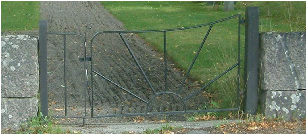
Denna grind finns längst åt öster i den södra muren.