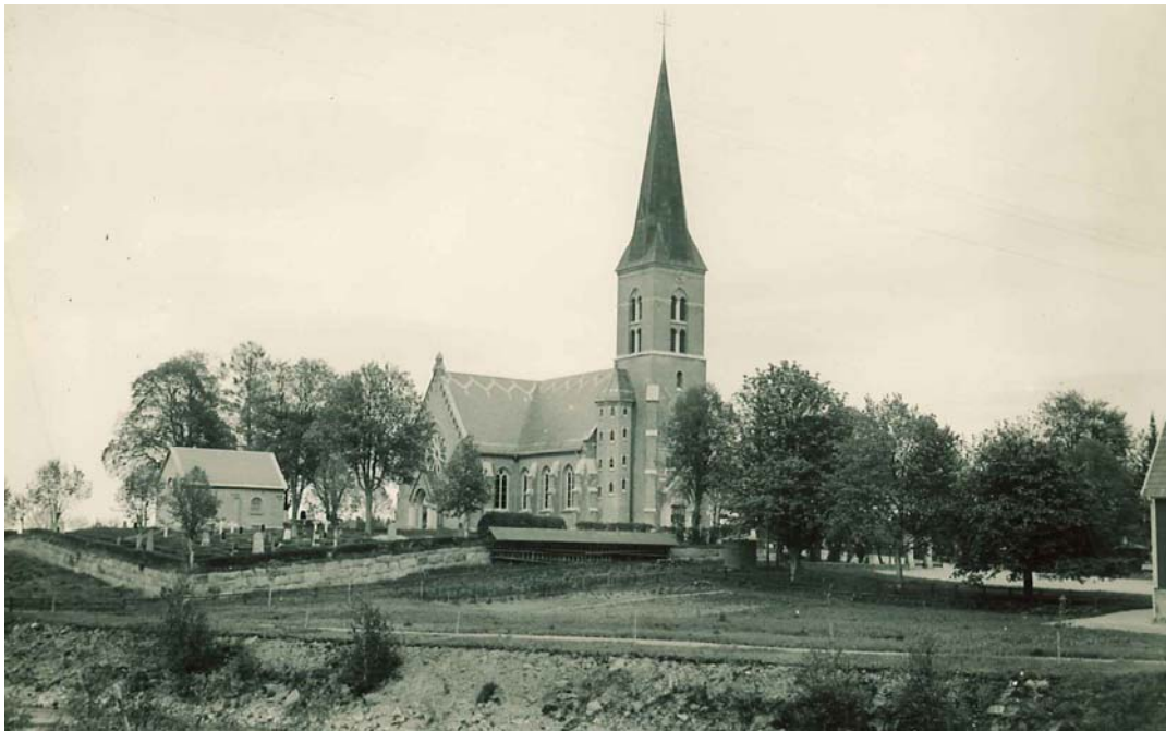
Hällestads kyrka 1939. Byggnaden i förgrunden på den västra sidan finns inte längre kvar. Möjligtvis var byggnaden ett kyrkstall.