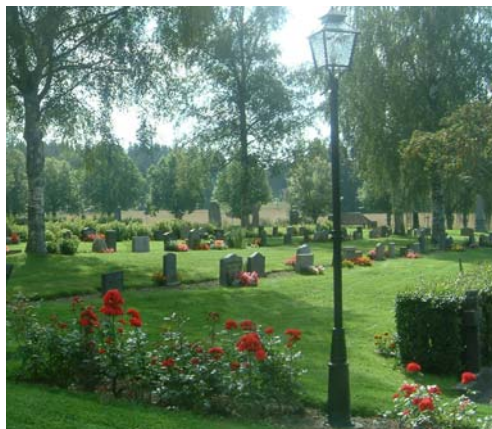
Trädkransen på den västra sidan samt rygghäck och björkar i kv. D och C.

På den östra halvan av den södra sidan, dvs. kv. C, finns från väster till öster räknat en häck av tuja, 0,8 m, en häck av oxbär, 0,8 m samt två häckar av berberis, 0,6 m vardera. En ung björk står i denna del. Mot den utvidgade delen i söder finns utmed den östra halvan en häck av idegran, ca 0,2-0,6 m hög. Mot den utvidgade delen i söder finns utmed den östra halvan en häck av idegran, ca 0,2-0,6 m hög.