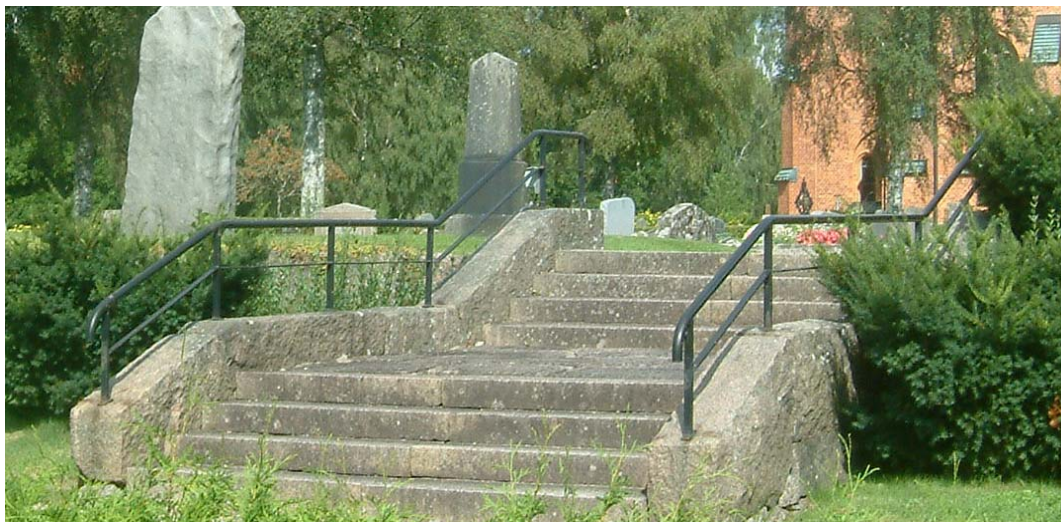
Trappa mellan den gamla kyrkogården och delen som tillkom på 1940-talet.

I söder finns en trappa av röd granit ned till 1946 års kyrkogård bestående av åtta trappsteg i två avsatser. Trappan har räcken av svartmålat rundjärn.