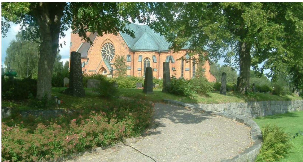
Grusgång mellan de båda utvidgade delarna.

Den nyaste delen består också av grusgångar, förutom en asfaltväg längst i söder. Mot väster går en kort bit grusgång längs med gräsmattan invid muren och går i en sväng in på den södra utvidgade delen. I mitten av den nya delen, längs östra sidan samt i mitten mellan området med minneslunden och de två södra delarna löper en gång.