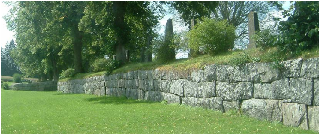
Södra muren av den gamla kyrkogården. Till vänster syns den nyaste delen av kyrkogården.