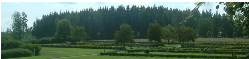
Den senast tillkomna kyrkogårdsdelen med dess häckar och trädkrans.

I den nyaste delen av kyrkogården som tillkom 1972 består kvarteren av regelbundet geometriskt placerade låga häckar, huvudsakligen ölandstok. Längs mittgången står fem unga rönnar. Längs den södra omgärdningen finns tolv nyplanterade lövträd. En alm står i det sydöstra hörnet. Längs mot öster finns en hög bladhäck, 2,5 m. I den nordöstra delen, minneslunden, finns spirea häckar, ca 1,2 m höga, en två meters hög häck av forsythia, tre sockertopps granar, tre unga rönnar samt en idegranshäck samt en alm. I mitten runt ett stenblock finns blomrabatter samt ett nyplanterat lövträd.