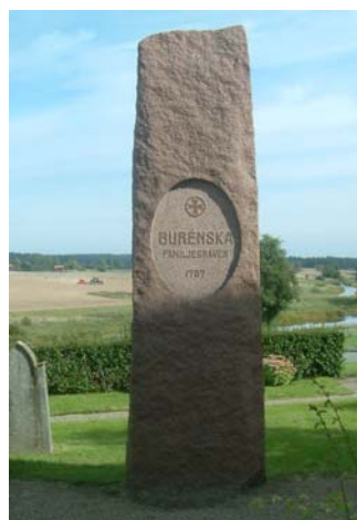
Gravvårdar tillhörande grav 241, samt den bautasten som hör till den Burénska släktgraven. Stenen är märkt 1757 men är troligen av betydligt senare datum. Runt denna finns flera gravvårdar som hör till släkten Burén varav den äldsta dateras till 1846. Övriga av vårdarna är huvudsakligen från sent 1900-tal.