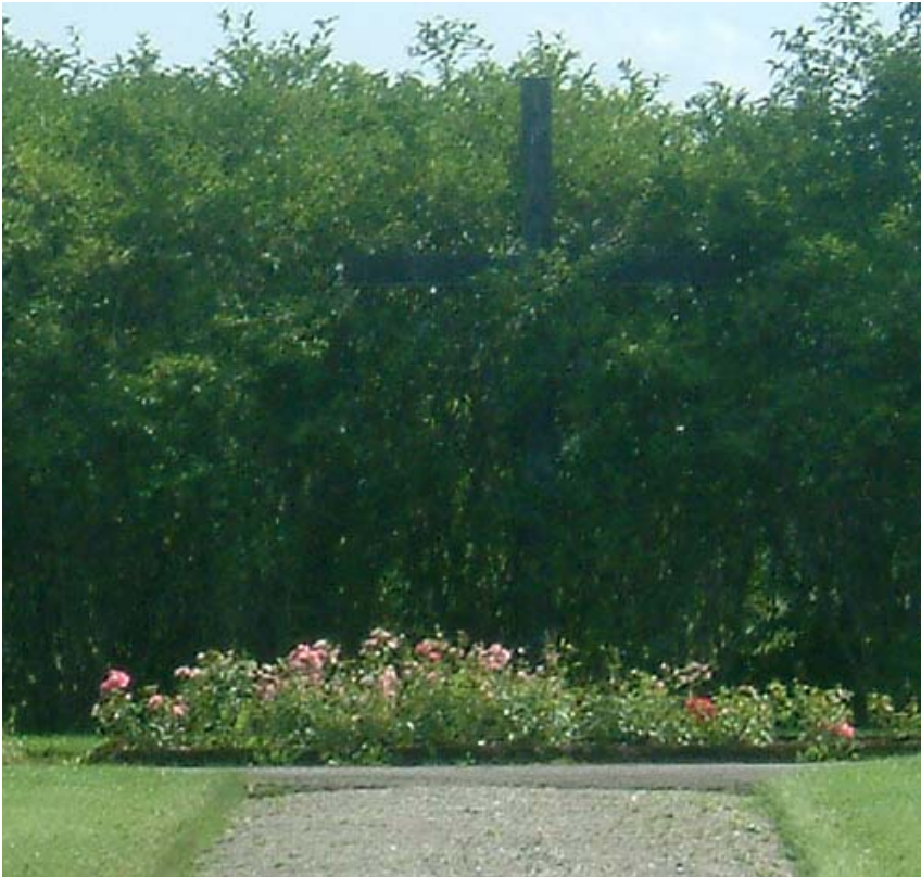
Ett högt minneskors finns på 1972 års kyrkogård i mitten på den östra sidan.