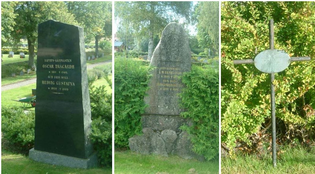
Tre exempel på vårdar i kv. C. Från vänster nr 51 tidigast daterad 1889. I mitten nr 79 från 1879 samt nr 569 från 1907. Utöver sådana högresta vårdar som bilderna ovan är exempel på finns även moderna vårdar med likartat utseende.

I kv. D finns flera grustäckta gravar på den västra sidan. I utkanten av kvarteret, särskilt i dess södra del, finns ett relativt stort antal höga smala vårdar från tiden kring 1900. Den inre delen av kvarteret var tidigare linjekvarter men idag är så gott som alla vårdar ersatta med yngre, från 1960 och framåt. Enstaka äldre finns kvar. Stora partier har ännu inte åter tagits i anspråk för gravvårdar. Titlar i kv. D är bl.a. kyrkoherde, kättingsmeden, rusthållaren, predikanten, skräddarmästaren, kronojägaren.