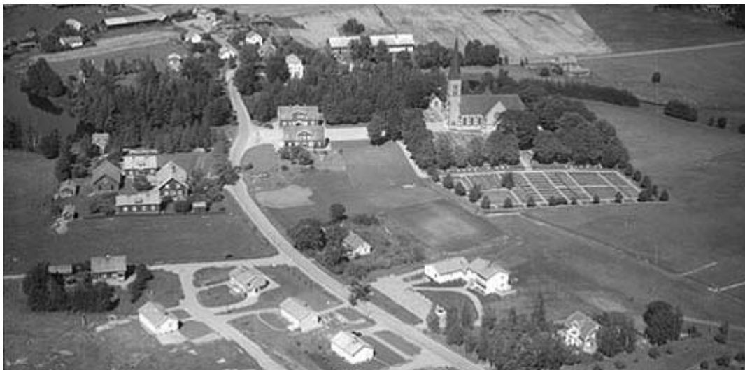
Flygfoto över Hällestads kyrkogård 1960.