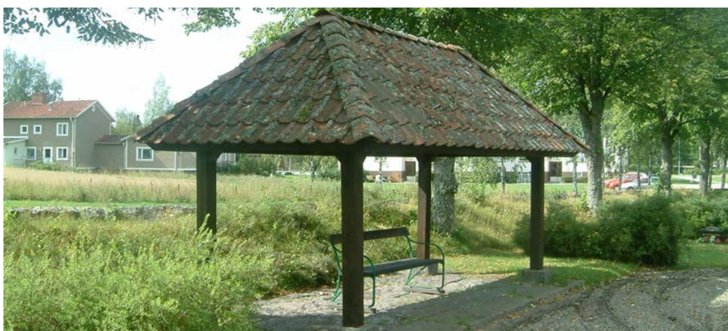
En takbyggnad vid den södra muren.

Ett tak finns vid den södra muren som regnskydd för besökare. Under taket står en bänk på stenplattor. Taket är av tegel och byggnadens sidor är helt öppna.