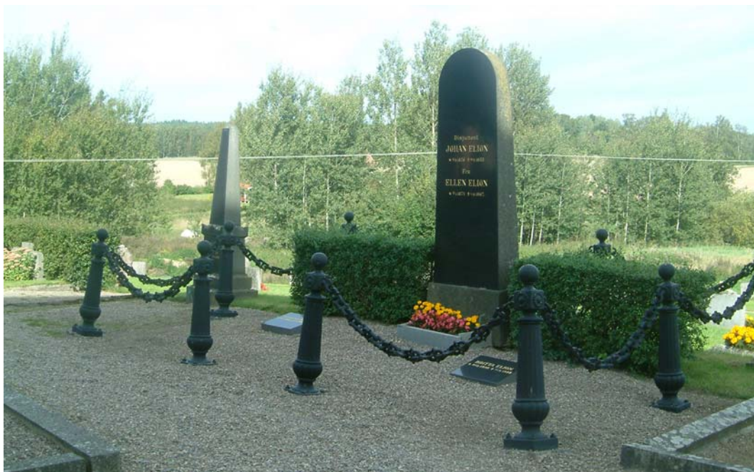
Disponent Johan Elions gravvård med grustäckning och omgärdning.

Gravvårdarna i kv. B är huvudsakligen från 1940-1970-talet även om det finns bra exempel på äldre, mer monumentala vårdar också inom kvarteret. Det finns även enstaka äldre vårdar av linjekaraktär kvar. Två större gravanläggningar som utmärks är nr 12 med gjutjärnsomgärdning och exempelvis nr 8 och 16 som är grusgravar. Titlar som förekommer i kvarter B är exempelvis valsaren, kronolänsman, muraren, smeden, hemmansägaren. Järnvägen mellan Norrköping och Örebro passerar socknen och hade ursprungligen sex stationer inom socken, däribland en sydväst om kyrkan i Hällestad. Spår av detta kan också skönjas på kyrkogården i titlar som stationsinspektör, stationsmästaren och tågmästaren.