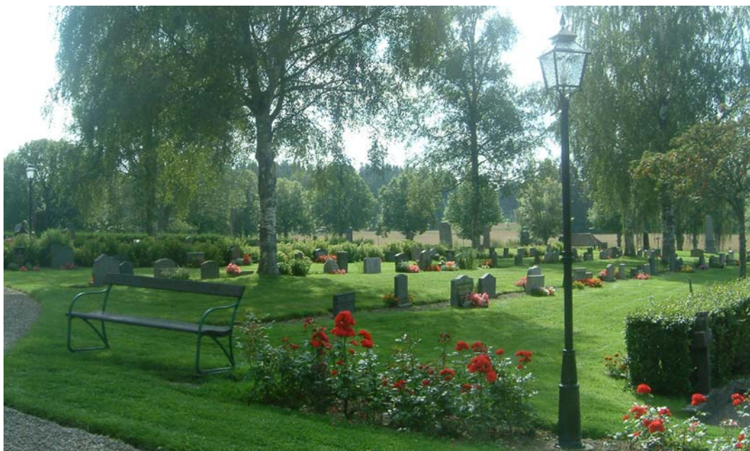
Den södra delen av den gamla kyrkogården är mera lummig med dess häckar och lövträd.