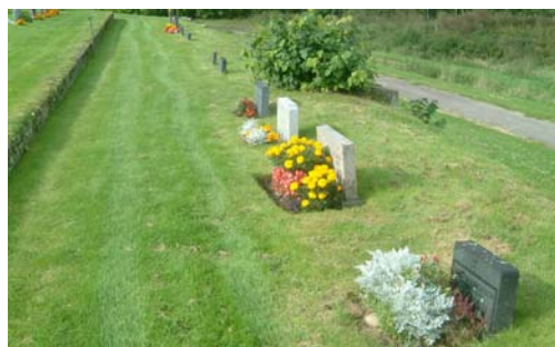
Kvarter B med utsikt österut. Den högra bilden är en gammal allmän linje i kv. B.