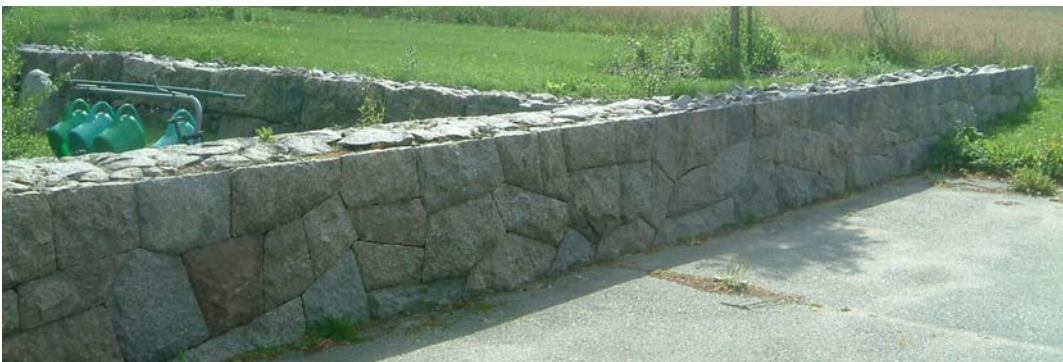
Del av mur tillhörande den del av kyrkogården som tillkom 1972.