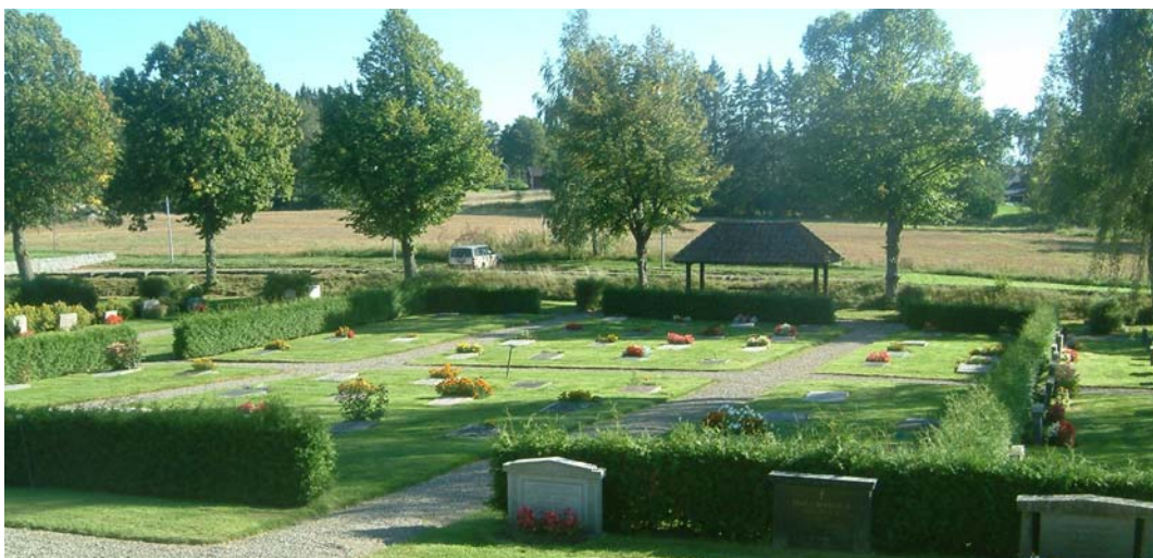
Den mittersta delen av den utvidgade södra delen.

I den utvidgade delen söder om den gamla kyrkogården finns ett flertal rygghäckar. Delen är indelad i sex st gräsbesådda områden. Mellan dessa löper grusgångar i ett rutnätssystem. I den norra halvan består rygghäckarna från väst till öst av två hagtornshäckar, 0,3 m, två häckar av ölandstok, 0,4 m. Mittersta delen är indelad i mindre häckar av tuja, ca 0,6 m höga. Delen längst mot öster består av en häck med ölandstok, 0,8 m, spirea, 1,4 m, två häckar med perenna växter samt en hagtornshäck i väst-östlig riktning, 0,4 m. Den södra halvan av delen består från väster till öster av en hagtornshäck, 0,3 m, två häckar med ölandstok, 0,7 m. Mittpartiet är lika det på den norra sidan med kortare häckar av tuja, ca 0,6 m. Det östra området består av fyra häckar, en ölandstok, 0,8 m, spirea, 1,4 m, två med perenna växter samt en kort häck av idegran i väst-östlig riktning vid första häcken med ölandstok. Längs den södra omgärdningen, utmed den östra halvan, finns sex häckar av spirea, ca 0,6 m höga i nord-sydlig riktning. Det finns en tät trädkrans av lind runt denna del av kyrkogården. Utmed den västra sidan finns fem lindar, varav en nyplanterad. Längs den södra sidan finns åtta lindar samt fyra längs den östra sidan. Längs med muren på den norra sidan mot den gamla kyrkogården växer en häck av spirea som är ca 0,6 m hög. Trappen mellan kyrkogårdsdelarna flankeras av idegransbuskar.