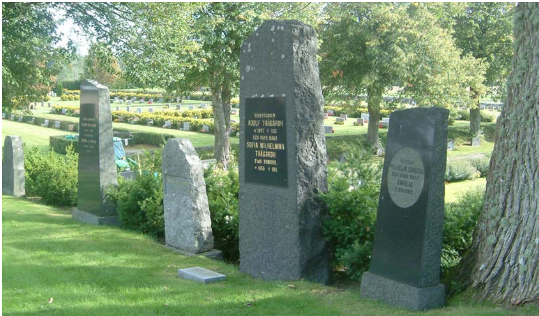
Gravvårdar nr 47-53 längs den södra muren. Längs denna sida dominerar äldre, högresta gravvårdar.