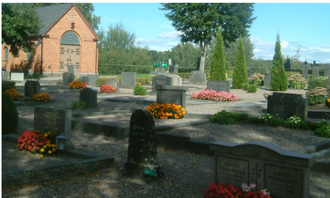
Norra sidan av den gamla kyrkogården.

I den norra delen av den gamla kyrkogården utgör i stort sett hela sidan ett område med mer påkostade gravanläggningar, kv. A. Två mindre gräsmattor på ömse sidor gravkapellet innehåller enklare gravvårdar. Grusgravarna i den västra delen är mer regelbundet placerade och har mer likartade vårdar från 1950-talet och senare. På själva krönet är gravarna större och oregelbundet placerade. Här finns stora gravar för brukspatroner och lokal adel (Mörner av Morlanda, familjen Burén m.fl.). Det finns ett flertal olika typer av gravvårdar, däribland högresta bautastenar, mindre liggare och järnkors. I området finns också ett par vårdar som är från tidigt 1800-tal. Det finns flera kulturhistoriskt intressanta titlar på gravvårdarna i denna del. Titlar är intressanta ur kulturhistorisk aspekt i och med att de ger mycket information om vilka som levtt och verkat i en bygd. I alla kvarter på kyrkogården finns det gravvårdar som har någon form av titel, även om det inte längre är lika vanligt förekommande på de nyare, moderna vårdarna som det är på de äldre. Bland de mer ålderdomliga titlarna som finns, förekommer t.ex. sadelmakaren, bryggaren, fabrikör, fanjunkare, kronolänsmän, stationsinspektoren, kontraktsprosten, bruksförvaltaren, brukspatronskan. De vanligaste titlarna är hemmansägare och lantbrukare. För vidare information om titlars förekomst i de olika kvarteren, se under respektive kvarter i den enskilda beskrivningen.