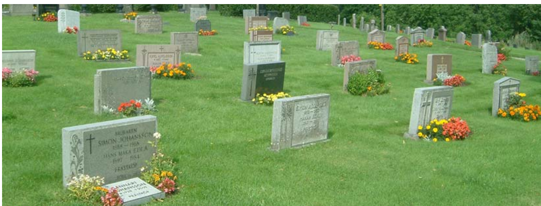
Bilden visar kv. B i det nordöstra hörnet av gamla kyrkogården.

Det finns också mer påkostade gravvårdar i kvarter B. En grusgrav över Disponent Johan Elion omgärdas av kätting och pollare i järn. Flera gravar omgärdas också av stenramar. Det var vanligare förr att gravvårdar omgärdades med stenram och smidesomgärdningar.