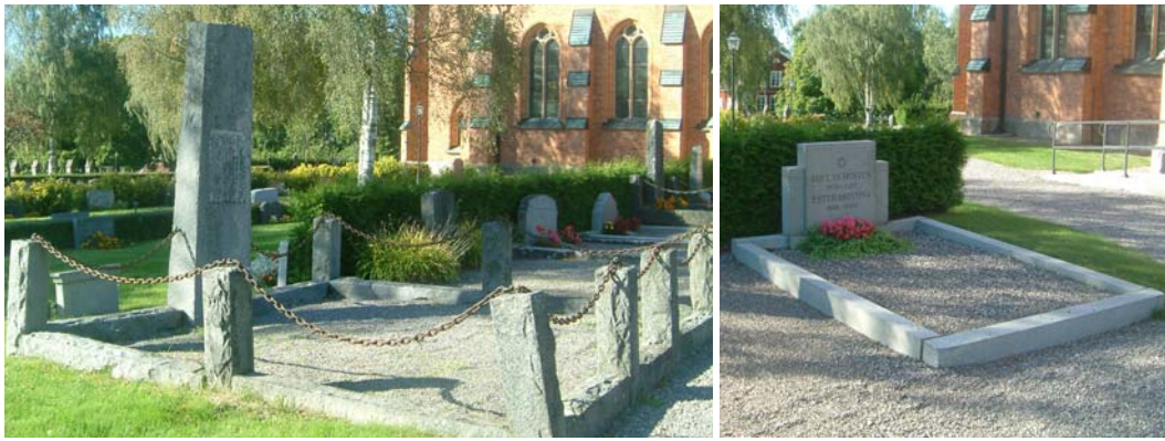
Nr 531 med kätting och pollare samt nr 527 med stenram. Denna är från 1939.