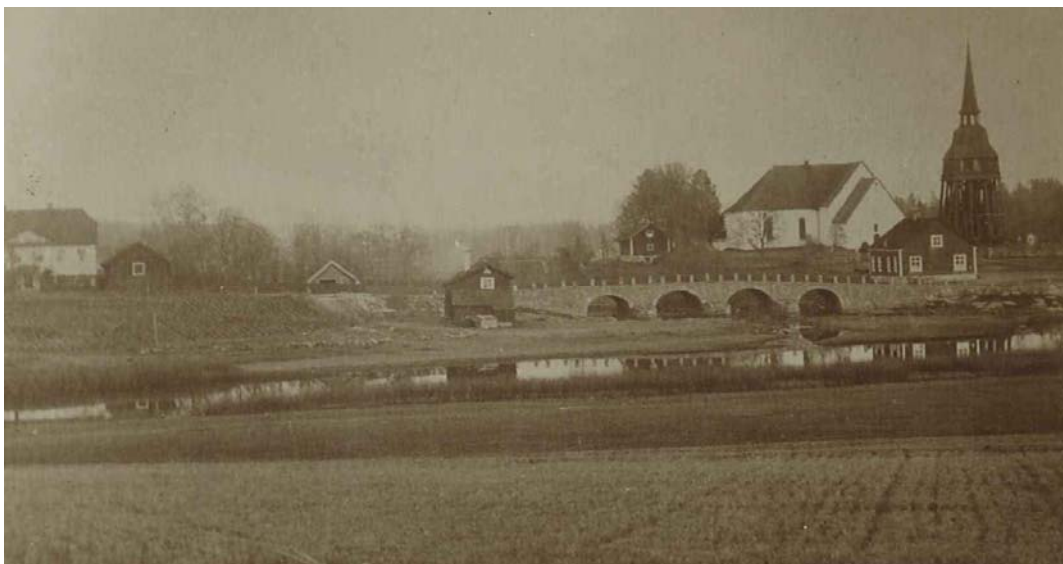
Den gamla kyrkan som brann 1893 samt klockstapeln senare flyttad till Skansen.

sin huvudsakliga karaktär till barocken. När en ny kyrka skulle uppföras efter branden 1893 ansågs klockstapeln dels vara i vägen och dels för dyr att underhålla. Den nya kyrkan skulle dessutom byggas med ett torn för klockorna. På så sätt hade klockstapeln inte längre någon funktion. Efter förslag och samtal med Skansens grundare, Arthur Hazelius, kom klockstapeln att flyttas dit. Söndagen den 15 april 1894 ringde i Hällestads klockstapel för sista gången på sin ursprungliga plats. Under sommaren plockades den ned och transporterades med järnväg till Stockholm. Klockorna blev dock kvar i Hällestad och till klockstapeln på Skansen tillverkades nya klockor 1899. Dessa klockor ringer traditionsenligt varje år vid Skansens nyårsfirande. Klockstapeln har blivit vida känd och går under beteckningen ”Hällestadsstapeln”.