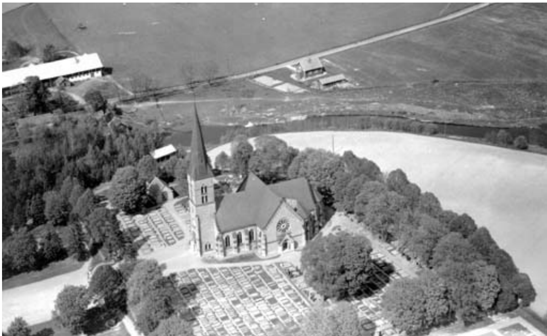
Hällestads kyrka 1955. Det fanns många grusgravar på kyrkogården vid den tiden. Ett flertal av dem finns fortfarande kvar.