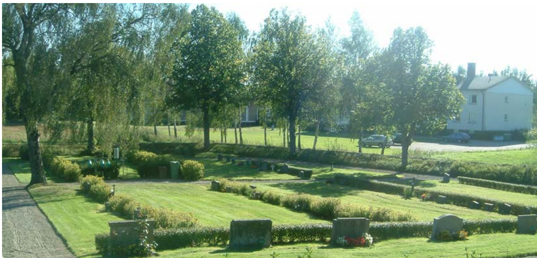
Kv. E på den södra kyrkogårdsdelen.

Förutom i omgärningen finns ett flertal rygghäckar. Delen är indelad i sex st gräsbesädda områden. Mellan dessa löper grusgångar i ett rutnätssystem. I den norra halvan består rygghäckarna från väst till öst av två hagtornshäckar, 0,3 m, två häckar av ölandstok, 0,4 m. Mittersta delen är indelad i mindre häckar av tuja, ca 0,6 m höga. Delen längst mot öster består av en häck med ölandstok, 0,8 m, spirea, 1,4 m, två häckar med perenna växter samt en hagtornshäck i väst-östlig riktning, 0,4 m. Den södra halvan av delen består från väster till öster av en hagtornshäck, 0,3 m, två häckar med ölandstok, 0,7 m. Mittpartiet är lika det på den norra sidan med kortare häckar av tuja, ca 0,6 m. Det östra området består av fyra häckar, en ölandstok, 0,8 m, spirea, 1,4 m, två med perenna växter samt en kort häck av idegran i väst-östlig riktning vid första häcken med ölandstok. Längs den södra omgärningen, utmed den östra halvan, finns sex häckar av spirea, ca 0,6 m höga i nord-sydlig riktning. Det finns en tät trädkrans av lind runt denna del av kyrkogården. Utmed den västra sidan finns fem lindar, varav en nyplanterad. Längs den södra sidan finns åtta lindar samt fyra längs den östra sidan. Längs med muren på den norra sidan mot den gamla kyrkogården växer en häck av spirea som är ca 0,6 m hög. Trappen mellan kyrkogårdsdelarna flankeras av idegransbuskar.