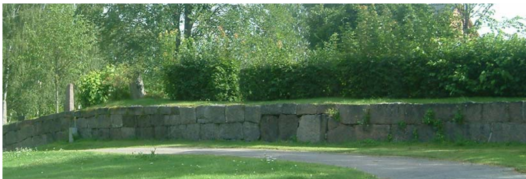
Västra muren runt den gamla kyrkogården, sett mot norr. Bilden nedan visar samma mur men på den södra sidan om huvudingången. Denna mur har en annan karaktär.

Den senaste utvidgningen från 1972 avgränsas på dess västra sida dels till den gamla kyrkogårdens mur och dels på den södra delen av 1946 års kyrkogårdsmur. I söder finns en kortare sträckning nyanlagd stödmur. Kyrkogården ligger lägre på denna del och uppe på muren har en gräsmatta anlagts med trädplantering av 12 unga lövträd på rad. Muren består av tillpassad 2-3 skift 0,6-1,0 m stor sten. I norr består kyrkogårdens avgränsning av en öppen gräsmatta i svag sluttning ned mot Hällestadån.