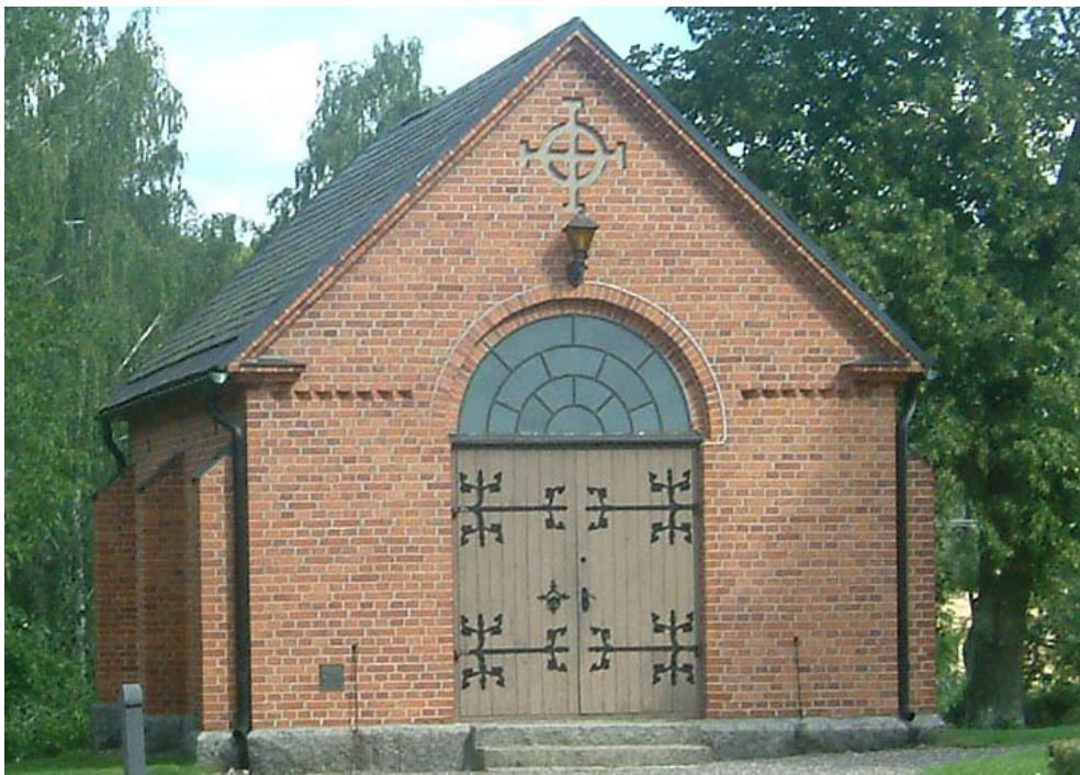
Gravkappellets södra sida.

I norra delen av gamla kyrkogården finns ett gravkapell i rött tegel under ett falsat plåttak. Kapellet är uppfört i samma medeltidsromantiska stil som kyrkan.