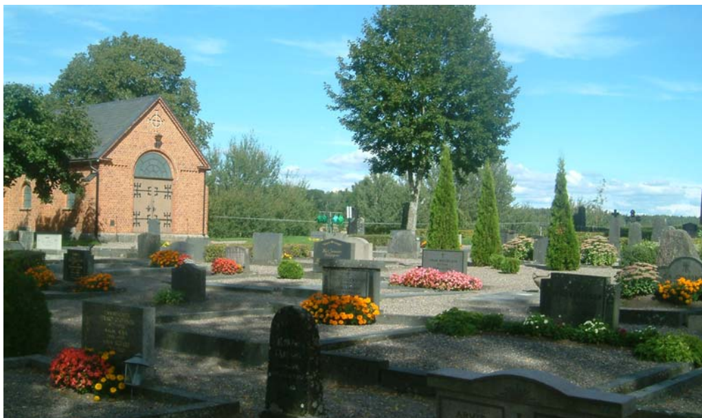
Kvarter A med dess grusgravar och vegetation.

Kvarteret är nästan helt grusat, men två smala gångar begränsar de mindre gräsytorerna i väster och öster.