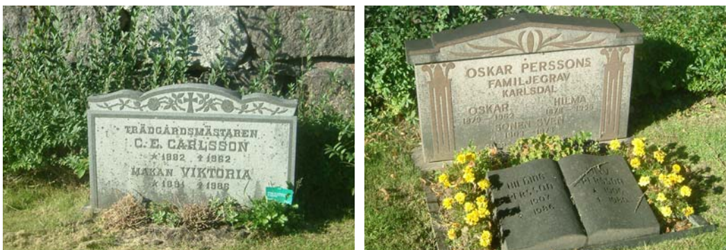
Exempel på gravvårdar i kv. G. Från vänster nr 6 och till höger nr 39.

träkors finns också. Längst mot väster finns ett område avsatt för barngravar. I mitten finns en öppen gräsmatta med enbart liggande vårdar.