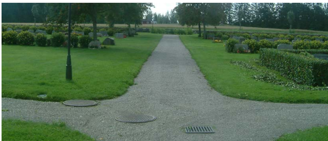
1972 års kyrkogård med korsande grusgångar. Fotot är taget mot söder.