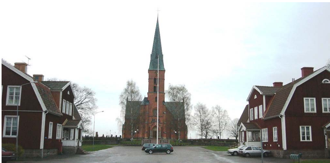
Hällestads kyrka med omgivning.

1970-talets kyrkogård ligger öster om de andra två och är anlagd på åkermark. Marken sluttar långsamt ned mot Hällestadsån i norr mot vilken anläggningen är helt öppen. Mer än hälften av anläggningen är ännu inte tagen i anspråk och består av en öppen gräsmatta.