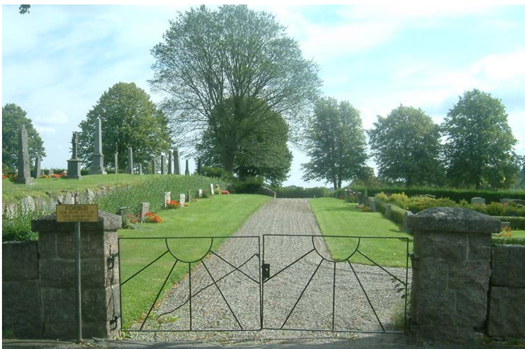
Den västra, huvudingången till den utvidgade delen. De höga träden i bakgrunden står i trädkransen längs den östra muren.

I väster finns en ingång bestående av en pargrind i smidesjärn mellan firsidiga murade grindstolpar. Grinden har en enkel ornering i form av en sol i tidstypisk stil. I norr, i den gamla delens södra mur, finns en trappa som förenar de två kyrkogårdsdelarna. Den östra muren har en öppning där en grusgång sträcker sig mellan denna och den senaste kyrkogårdsdelen. I östra delen av sydmuren finns en enkel smidesgrind mellan enkla järnstolpar. Denna har en enkel ornering i form av en sol.