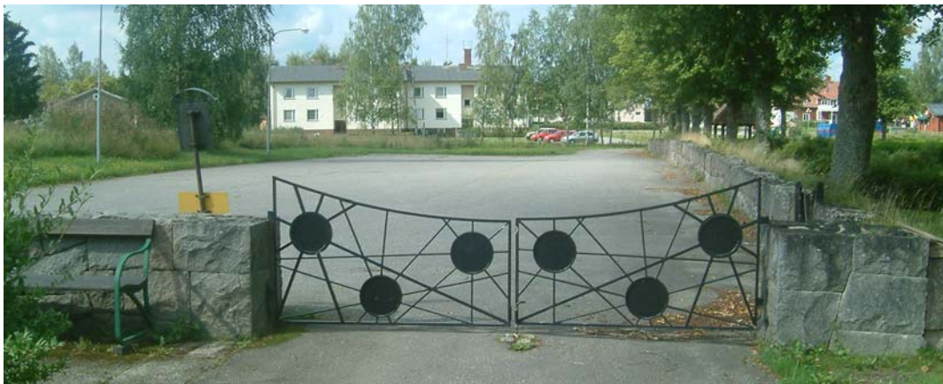
Grind till den nya delen av kyrkogården.

I nordväst löper en mindre asfalterad körväg utanför den gamla kyrkogårdens norra mur och ansluter till 1972 års kyrkogård i ytterkanten invid ån. I sydväst finns en pargrind i järnsmide infäst i muren. Denna har en modern design med solar fästade mellan raka linjer, se bilden nedan.