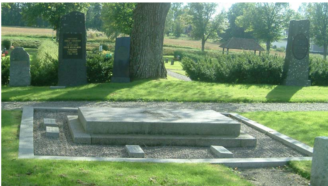
Gravanläggning tillhörande den Trädgårdhska släkten. I bakgrunden syns även ett par av de mer högresta gravvårdarna längs muren mot den södra utvidgningen.