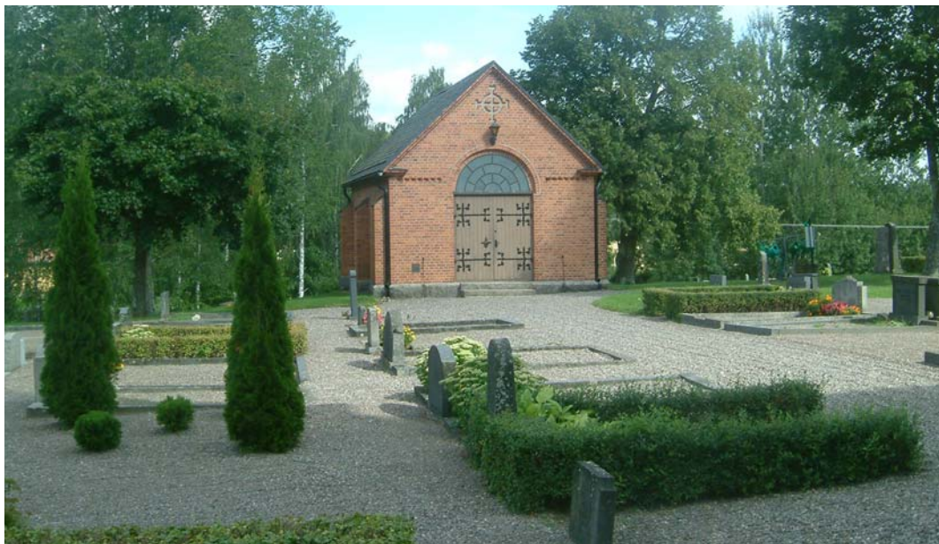
Den norra delen av den gamla kyrkogården domineras av grusgravar, en del omgärdade av låga häckar.

utvidgade delen i söder finns utmed den östra halvan en häck av idegran, ca 0,2-0,6 m hög. Den norra delen av den gamla kyrkogårdsdelen har stora ytor grusgravar. I den nordöstra delen finns en rygghäck av oxbär som är ca 0,6 m hög. Ett par lövträd finns på denna sida om kyrkan. Det är en lönn, en lind, en liten hängbjörk samt två unga rönnor. Mot den västra muren växer utmed halva delen en meter hög häck av hassel. Ett par av gravarna omgärdas av låga häckar av varierad sort t.ex. buxbom, måbär och liguster. Det finns också flera formklippta barrbuskar av exempelvis tuja, en etc.