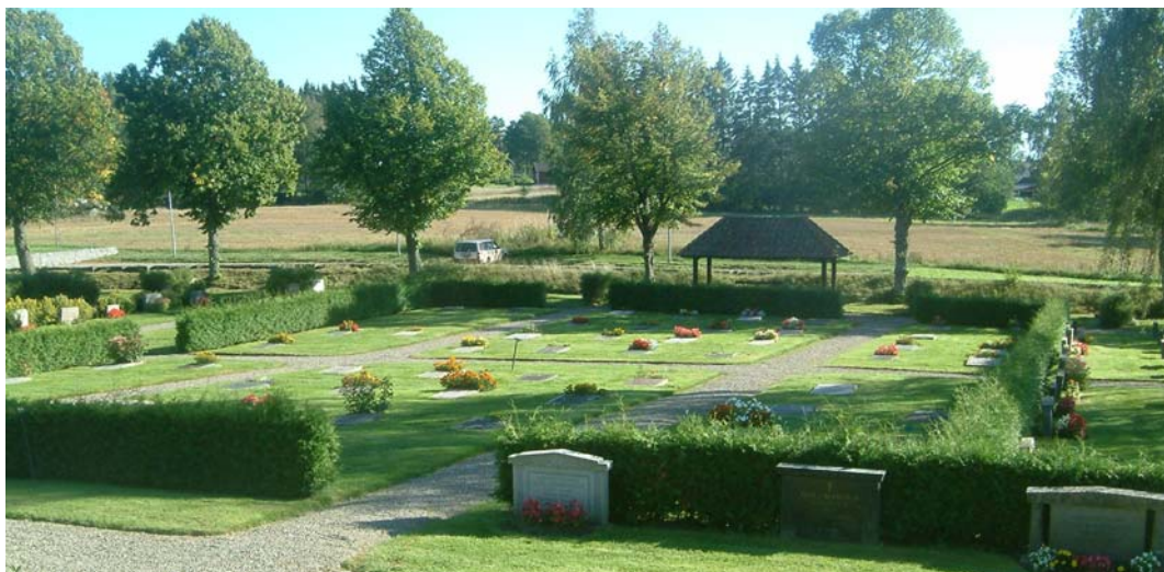
Utsikt över den från 1940-talet utökade delen.

1946 års kyrkogård ligger söder om den gamla och är en tidstypisk anläggning. Samtliga av vårdarna är på sin ursprungliga plats och är typiska för sin tid. System av rygghäckar bildar halvöppna rum. I mitten finns en öppen gräsmatta med liggande gravvårdar. Murarna består av skarpkantad sten och innanför finns en jämngammal trädkrans av lindar.