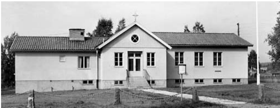
Hällestads församlingshem fotat 1959.