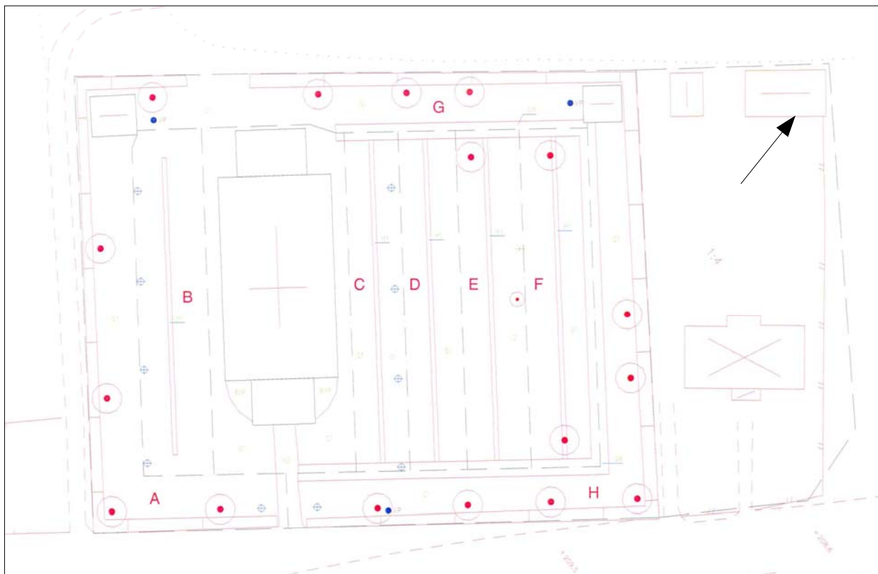
Gravkarta från 2005, utförd av Nils Blomstrand, Vetlanda Mark- och Naturdesign.

Kyrkogården har sin huvudsakliga utsträckning nordost om kyrkan. Kyrkogården omgärdas av en bred stenvägg av kanthuggen granit, huvudingång finns på nordöstra sidan mitt framför kyrkans torn. Kyrkogården är förhållandevis liten och består i stort sett av två kvarter samt gravrader utmed kyrkogårdsmuren. Gravkvarteren är relativt jämbördiga och likvärdiga, med en uppblandad karaktär av äldre gravar blandade med yngre. Idag präglas kyrkogården av långa rygghäckar av cotoneaster utmed kyrkans fulla längd, huvudsakligen med låga och breda gravvårdar från 1900-talets andra hälft, på gräsklädda mattor.