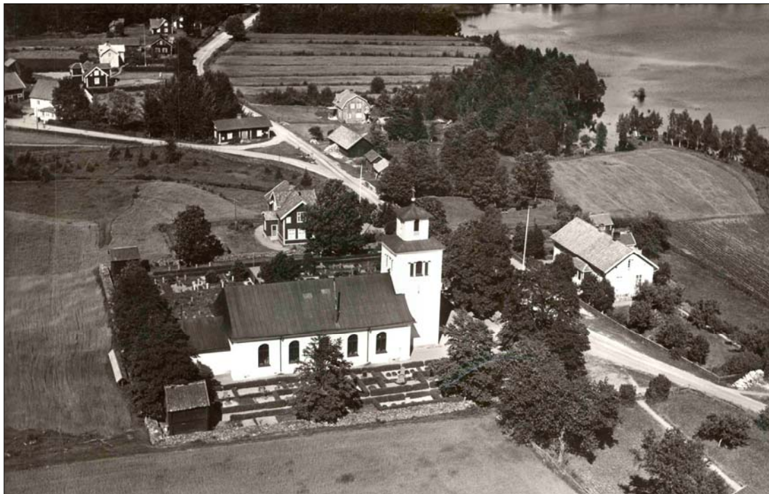
Bellö kyrka och kyrkogård flygfotograferad på 1930-talet av AB Flygtrafik. Som tydligt synes präglas kyrkogården av häckomgärdningar och grusgravar, på norra sidan verkar gravarna varit mindre. Foto från Jönköpings läns museum.

Bellö socken ligger i Jönköpings läns östra del och gränsar i norr till huvudförsamlingen Inga-torp, i väster till Edshult, i sydost till Kråkshult och i öster till Hässlebys socken. Bellö omtalas första gången i skriftliga källor som ”Bælo” 1337 och härleds ur namnet på sjön i väster; Belle som beskrivs som ”den stora sjön”. Namnet är bildat från ett fornsvenskt adjektiv ”Balder” som betyder ”stor”. Landskapet är till stora delar kuperat och består huvudsakligen av skogsmark, huvudnäring är skogsbruk och träindustri. Socknen är liten och bestod 2003 av endast 215 invånare. Det finns endast två fasta fornlämningar registrerade, två rösen belägna på höjdryggar i skogs- respektive åkermark. Däremot har flera lösa fynd gjorts, främst kopplade till områden nära sjöstränderna. En bit nordost om Bellö kyrka ska en pilgrimskälla – ”Lussekällan” – ha legat. Bebyggelsen är spridd på uppodlade höjdryggar, herrgårdar och större gods saknas i socknen. Sockencentrum utgörs av Bellö kyrkby vid norra stranden av sjön Lilla Bellen, kyrkbyn består av kyrka, fd folkskola och lärarbostad, småskola samt ett trettiotal byggnader norr om kyrkan.