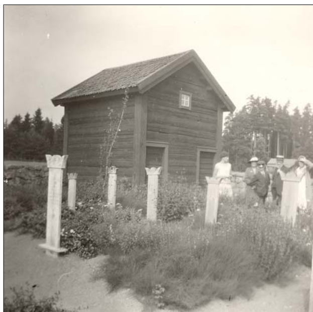
Norra delen av kyrkogården med trävårdar. Foto: Ivar Wideen, omkring 1926. Foto från Jönköpings Läns Museum.

En flygbild från 1930-talet visar att den norra delen var uppdelad i två delar, åtskiljda av en grusgång som gick i axel med norra ingången till kyrkan. Troligen har det nuvarande systemet med rygghäckar planterats kring 1950-talets mitt, av åldern på flertalet gravar att döma.