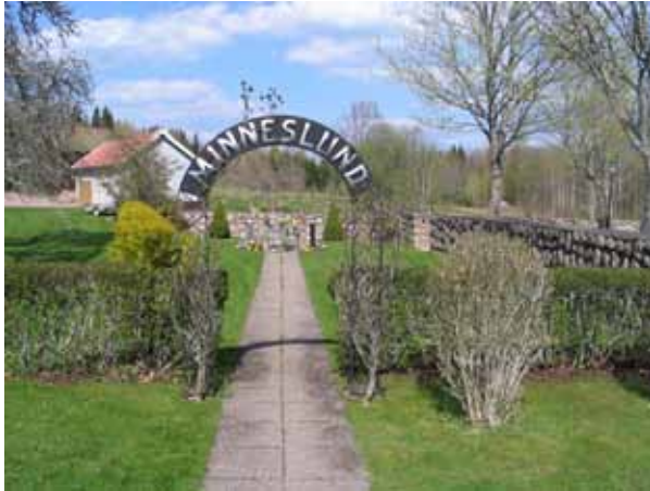
Minneslundan i anslutning till den nya kyrkogården. (KI Lönneberga kyrkog 060)

Mellan kvarteren H och I finns en gammal handpump av svartmålad gjutjärn.