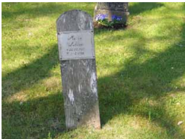
Tidigare var trävårdar mycket vanliga på Lönneberga kyrkogård. Idag finns endast denna vård bevarad på plats samt ytterligare en som förvaras i ett förråd. (KI Lönneberga kyrkog 022)

Majoriteten av gravvårdarna är små, låga vårdar av grå eller svart granit typiska för linjegravsområden. Flertalet är stående men det finns även liggande vårdar. I ett par fall har linjegravvårdar över maka och make flyttats tillsammans. En av parterna har då en äldre datering än områdets linje. Den äldsta linjegravvården som hör till området är från 1920 och den yngsta från 1936. Det finns även några köpta gravplatser. Den äldsta från 1859, vilken även är kyrkogårdens äldsta gravvård, och den yngsta från 1989. Gravvården från 1859 har en gravplats belagd med grus och omgärdas av en stenram. Även tre av linjegravplatserna har en liten stenram. Förutom vårdar av svart och grå granit finns gravvårdar av marmor, smide och trä i kvarteret. Trävårdar var tidigare mycket vanliga på Lönneberga kyrkogård. Gravvården i kvarter A är dock den enda på plats bevarade. Att ange den dödes yrkestitel förekommer på ett mindre antal vårdar. De som finns är hemmansägare, fanjunkare, kyrkoherde, änka, verkmästare och kopparslagare. På fler än hälften av vårdarna finns angivet vilken by eller gård den döde kommer från.