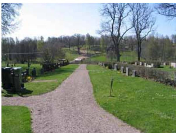
Kvarteren B till vänster och C till höger. Bilden är tagen från norr. Längst i söder finns tre grusbelagda och omgärdade gravplatser kvar. (KI Lönneberga kyrkog 024)

De fem kvarteren ligger alla söder om kyrkan. Området delas av grusgångar som bildar ett H. Kvarteren B, C och F består av en enda rad av gravplatser i nord-sydlig riktning utmed två av dessa gångar. Kvarteren D och E är större och rymmer 77 respektive 153 gravplatser. Samtliga gravvårdar i de fem kvarteren är ryggställda mot häckar av liguster. En häck av liguster skärmar också av kvarter D mot norr. I kvarter B är en del av häcken av måbär. Gravvårdarna är vända mot öster eller väster.