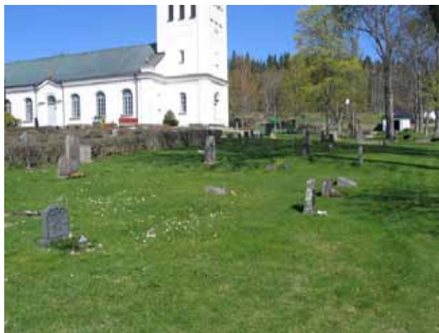
Kvarter A från sydost. (KI Lönneberga kyrkog 019)

Kvarteret är beläget i sydöstra delen av kyrkogården. Här finns idag 45 gravvårdar varav flertalet är linjegravplatser. I hela kvarteret beräknar man att det ska finnas plats för 100 kistgravplatser. Det gör att det idag finns en hel del outnyttjad yta. Planer finns på att göra om kvarteret till ett urnområde.