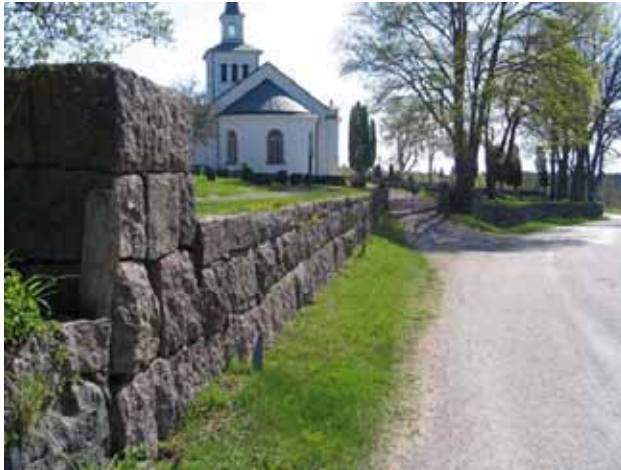
Kyrkogårdens stödmur i söder samt ingången i söder. Genom den södra ingången gick tidigare landsvägen. (KI Lönneberga kyrkog 011)

Lönneberga gamla kyrkogård har idag i det närmaste formen av en rätvinklig triangel. Gravkvarteren är utlagda söder, väster och norr om kyrkan. I söder och väster är majoriteten av gravplatserna insådda med gräs medan det i norr även finns flera gravplatser som är belagda med grus. I kvarteren närmast kyrkan är gravvårdarna av varierande ålder vilket gör att olika typer av gravvårdar från skilda tidsperioder blandas. I kvarter A finns rester av ett linjegravsområde bevarat. Kvarteren K, V och X är inte i bruk.