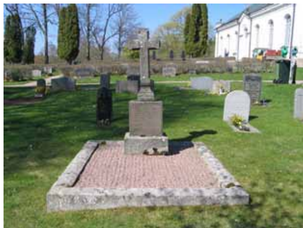
Fanjunkare Schreibers gravvård som enligt uppgift står vid den gamla kyrkans östra vägg. Gravvården från 1859 är den äldsta bevarade på kyrkogården. (KI Lönneberga kyrkog 023)