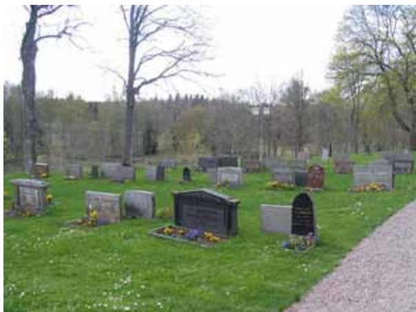
Kvarter H från öster. Här är gravvårdarna placerade i ryggställda rader. Några av de små vårdarna utgör rester av ett linjegravsområde från 1910-talet. (KI Lönneberga kyrkog 034)

De tre kvartererna ligger söder och sydväst om kyrkan och rymmer 68, 103 och 14 gravplatser. I kvartererna G och H är gravvårdarna ryggställda i rader vända mot öster eller väster. Kvarter I är ett mindre område för barngravar. Här finns nio vårdar som samtliga är vända mot öster.