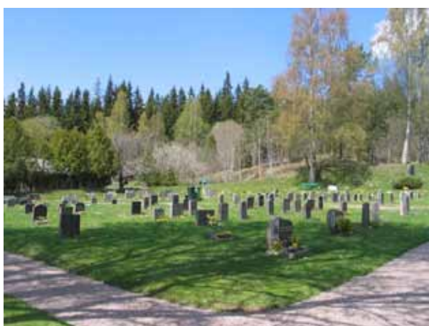
Kvarter L från sydost. Här börjar det linjegravsområde från 1937 som följer de fyra kvarteren. (KI Lönneberga kyrkog 041)

Gravkvarteren, utom kvarter P, avgränsas av grusbelagda gångar som möts i räta vinklar. Den största delen av området upptas av ett linjegravsområde från 1930- till 50-talet. Gravvårdarna är placerade i rader. Majoriteten av vårdarna är vända mot öster men i kvarter N och i västra delarna av kvarter M är gravvårdarna ryggställda. Kvarter P skiljer sig från de övriga. Här finns gravplatser för urngravar. Samtliga vårdar är här vända mot norr.