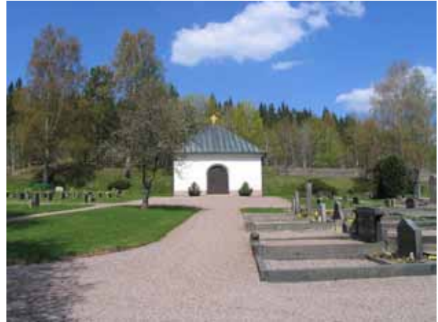
Bårhuset väster om kyrkan. Till höger i bild ses några av de grusbelagda och omgärdade gravplatserna i kvarter L och till vänster kvarter K. (KI Lönneberga kyrkog 040)