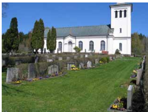
Kvarter E från söder. Gravvårdarna är placerade i ryggställda rader med häckar emellan. (KI Lönneberga kyrkog 026)