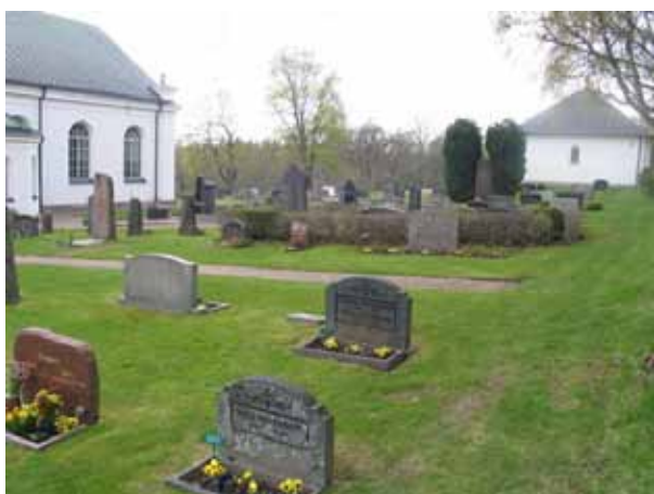
Delar av området från öster. Gravplatserna längst fram i bilden tillhör kvarter U. (KI Lönneberga kyrkog 045)

Kvarter J är beläget rakt väster om kyrkans kor medan övriga kvarter ligger norr om kyrkan. Kvarteren är små. Här finns från 9 till 54 gravplatser. De flesta kvarteren är långsmala och rektangulära till formen. De avgränsas av grusbelagda gångar. Gravvårdarna är ibland ryggställda och ibland ställda i fristående rader. De är vända mot den gång som ligger närmast vilket gör att de antingen vända mot öster eller väster.