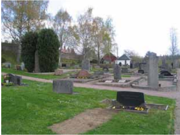
Området från väster. Längst fram i bilden gravvårdar i kvarter Q. (KI Lönneberga kyrkog 050)