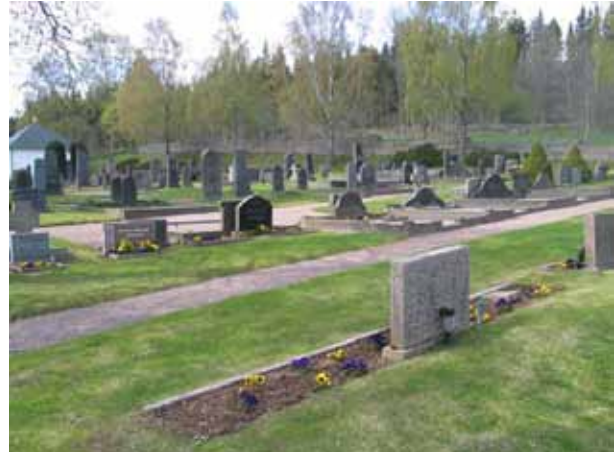
I flera av gravkvarteren finns grusbelagda och omgärdade gravplatser. Närmast i bild kvarter Ö och på andra sidan gången kvarter Ä. (KI Lönneberga kyrkog 051)