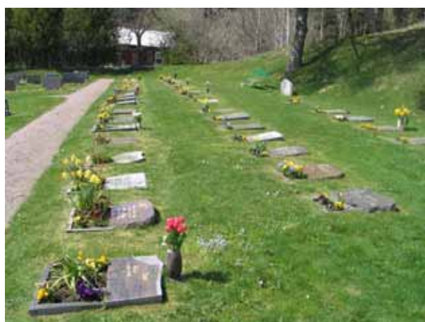
Urngravsområdet, kvarter P, från öster. (KI Lönneberga kyrkog 044)