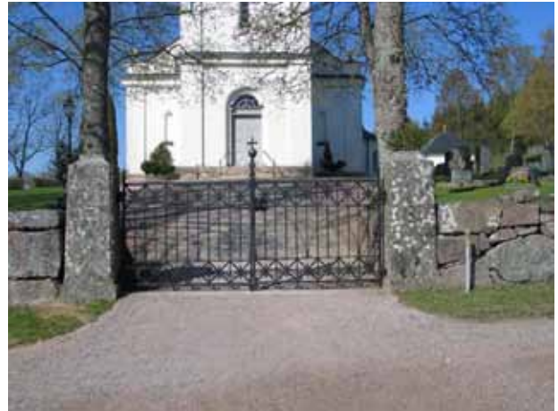
Ingången i öster. (KI Lönneberga kyrkog 007)