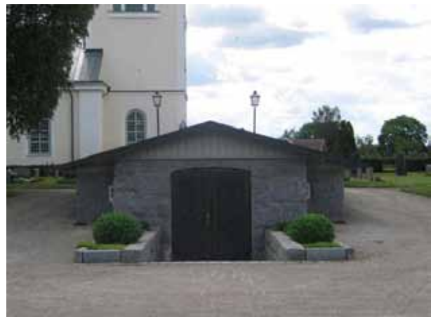
Bårhuset från norr. (KI Målilla kyrkog 071)