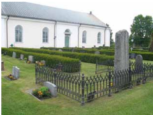
Kvarter C från sydväst. I förgrunden syns Familjen Hults gravplats omgärdad av ett gjutjärnsstaket. Den äldsta dateringen på gravvården är över prosten L B Hult död 1812. (KI Målilla kyrkog 034)

Kvarteren C och D ligger rakt söder om kyrkan. De avgränsas i norr av kyrkan med undantag av nordöstra delen av kvarter D som sträcker sig öster om kyrkan. I söder är kyrkogårdsmuren gräns liksom i östra delen av kvarter D. I väster utgör en gång gräns mellan kvarter C och B. Mellan de båda kvarteren går en gång från kyrkogårdens ingång i söder till kyrkans södra ingång. De båda kvarteren tillkom troligen åren efter att den nya kyrkan stod klar men har under 1900-talet lagts om. Idag är gravvårdarna placerade i ryggställda rader vända mot öster eller väster med häckar av tuja, cortoneaster eller liguster emellan. En del gravvårdar är också placerade i rader utmed kyrkogårdsmuren i söder och öster.