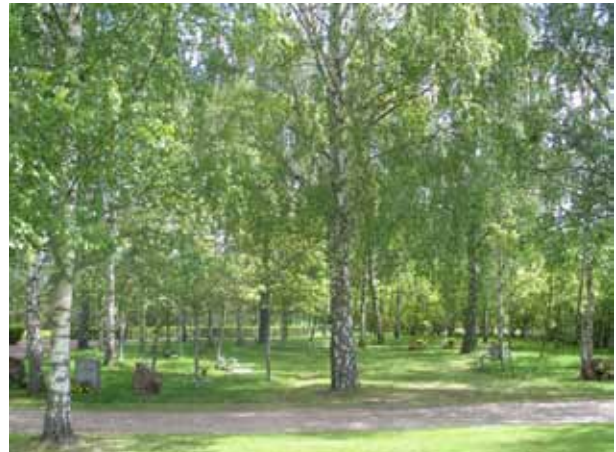
Kvarter Y från väster. (KI Målilla kyrkog 066)