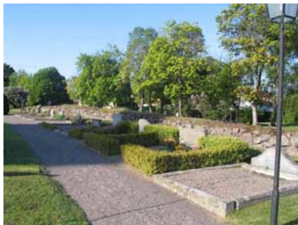
Rad med grusbelagda gravplatser i västra delen av kvarter A. (KI Målilla kyrkog 024)

I norra delen av kvarter B står idag ett gjutjärnskors som visar platsen för Målilla gamla kyrka. Här finns även ett gjutjärnskors som visar platsen för familjen Drakes gravkor. Vi vet att i äldre tider var kyrkogårdarna framförallt utlagda söder om kyrkan. Det gör det troligt att de södra delarna av kvarter A och B brukades som kyrkogård redan när den första kyrkan i Målilla byggdes. Troligen fick de båda kvarteren mycket av sin utformning när den nya kyrkan stod klar på 1820-talet. Kvarteren har brukats kontinuerligt fram till idag. Delar av