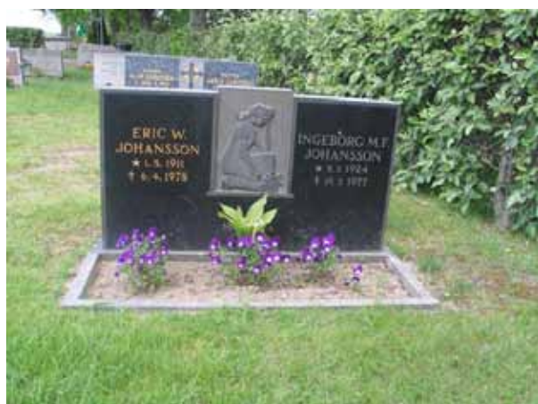
Ovanlig gravvård från 1970-talet i kvarter O. (KI Målilla kyrkog 060)