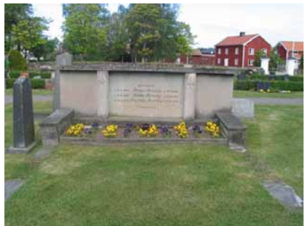
Påkostad gravvård i kvarter B av kalksten från 1930-talet över godsägaren Bengt Sporning och hans familj. Familjen ägde gården Christineberg. I gräset syns rester av den stenram som en gång omgärdade gravplatsen. (KI Målilla kyrkog 032)