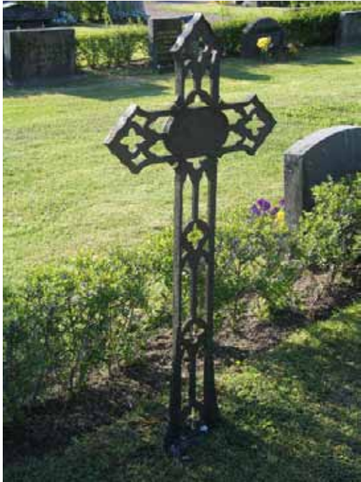
På Målilla kyrkogård finns flera gjutjärnskors av den här typen. Denna gravvård återfinns i kvarter A. (KI Målilla kyrkog 025)