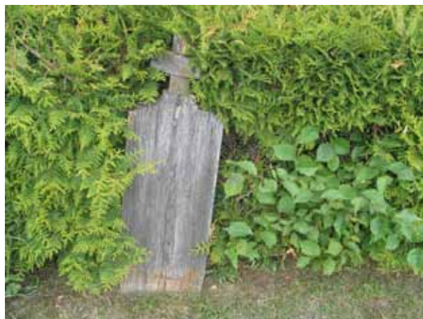
På Målilla kyrkogård finns få trävårdar bevarade. Denna står i sydöstra delen av kvarter C. Inskriptionen är borta. (KI Målilla kyrkog 038)