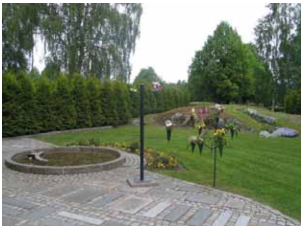
Minneslundan från söder. (KI Målilla kyrkog 070)

Minneslundan är belägen öster om kvarter I och J samt norr om kvarter Z. Platsen omges i alla väderstreck, med undantag av en del i norr, av en hög tujahäck. I väster finns också den gamla kyrkmuren som byggdes när kyrkogården utvidgades på 1920-talet. In till minneslundan leder en gång med grovt stenmjöl. Även en mindre del av minneslundan är stensatt. Mönstret är lagt med hjälp av smågatsten och gravstenar som plockats bort från kyrkogården. Här finns bänkar, perennrabatt, ställ i svart smide för blomvaser och en liten damm med en stensatt kant. En bergsknalle går idag i områdets nordvästra hörn. En rabatt är anlagd på dess sydsida. I nordöstra hörnet av området växer en stor alm. Under hösten 2006 inköptes en ljusbärare med plats för ca 40 mindre gravljus.