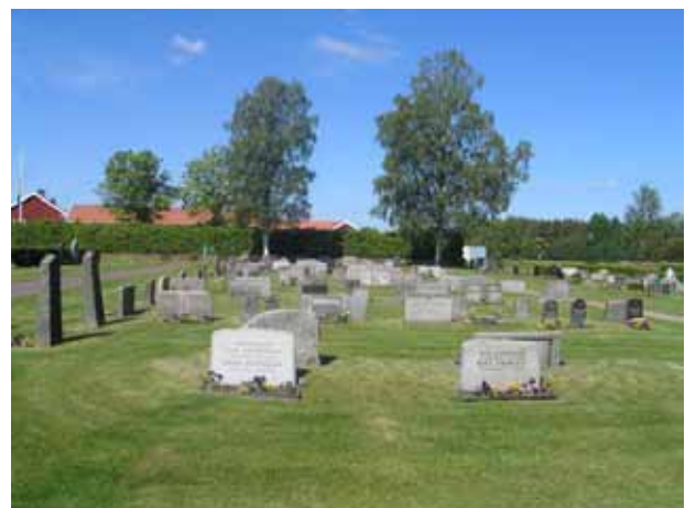
Kvarter F från öster. till höger i bilden syns tre små gravvårdar av svart granit. De är några av de kvarvarande resterna av det linjegravsområde som tidigare fanns i kvarterets mitt. (KI Målilla kyrkog 045)