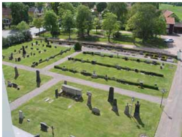
Delar av kvarteren A och B från kyrkans torn. (KI Målilla kyrkog 005)

Kvarteren A och B är belägna i kyrkogårdens sydvästra hörn. I norr avgränsas båda kvarteren av den gång som leder fram till kyrkans ingång i väster och i söder av kyrkogårdsmuren. Kvarter A avgränsas även i väster av kyrkogårdsmuren och kvarter B avgränsas i öster av en mindre grusgång. En grusgång skiljer de båda kvarteren åt. Båda kvarteren delas också på mitten av grusgångar i öst-västlig riktning. En del mindre gångar i kvarteren har såtts in med gräs men deras sträckning kan ännu avläsas. Kvarteren A och B tillhör de äldsta på kyrkogården.