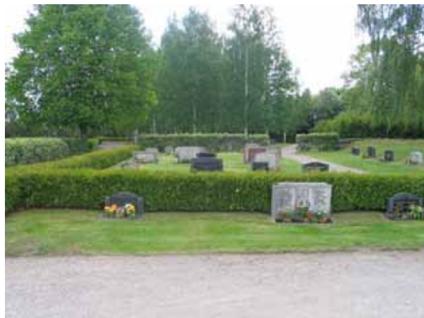
Kvarter L från väster. (KI Målilla kyrkog 054)