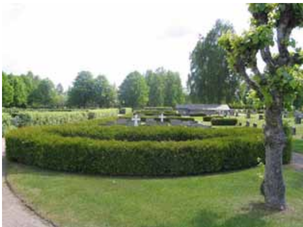
Kvarter K från väster. (KI Målilla kyrkog 053)