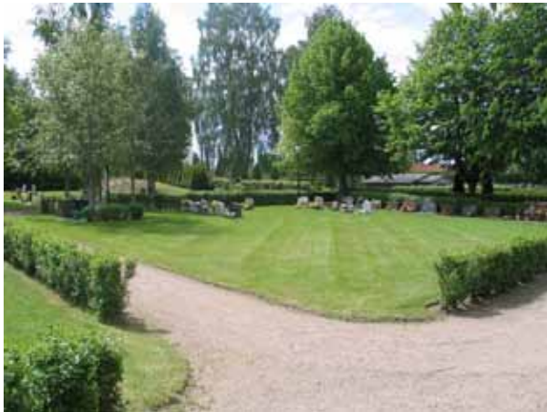
Kvarter U från nordost. (KI Målilla kyrkog 064)

Den äldsta gravvården är från 1988 och finns i kvarter R. Kvarteren har därefter tagits i bruk utan någon särskild ordning. Gravvårdarna är låga och stående. De är antingen rektangulära till formen eller asymmetriska. Flera är blankpolerade med enkel dekor. Vanliga typer av dekor är blommor och kors. Flertalet av urngravplatserna i kvarter Y har liggande gravvårdar. I området finns en yrkestitel angiven, boktryckare i kvarter U. På majoriteten av gravvårdarna anges inte från vilken by eller gård den döde kommer.