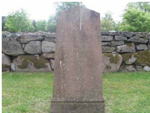
Kvarter D. Organisten Pehr Bergstrand och hans makas gravvård i kvarter D öster om kyrkan. Hustrun dog 1828. Gravvården är av kalksten. (KI Målilla kyrkog 028)