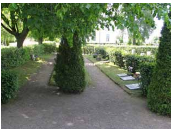
Urngravsområdet i kvarter N från norr. (KI Målilla kyrkog 057)

Kvarteren K-P tillkom i två etapper på 1940-talet och 1960-talet. Området har en enhetlig struktur. Gravvårdarna är låga och enkla till sin utformning och dekor vilket är helt i tidens anda. I anläggningsformen finns ett rationellt och effektivt tänkande när det gäller användningen av marken. I det fortsatta bruket av området bör denna karaktär bevaras. Inom området finns också ett nytt inslag på kyrkogården i form av gravplatser avsatta för urnsättning.