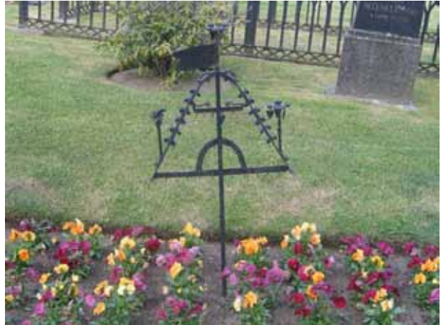
Smidesvård uppställd i nordöstra hörnet i kvarter B. (KI Målilla kyrkog 029)