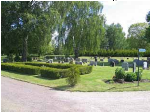
Kvarter I från sydväst. (KI Målilla kyrkog 050)

De sex kvarteren tillkom 1921 då kyrkogården utvidgades. Området har en för tiden typisk anläggningsform med köpta gravplatser i kvarterens ytterkanter och linjegravsområden i dess mitt. Det finns en noggrann plan för gravvårdarnas placering som man följt och som gör att området utnyttjats effektivt. På flera av våra kyrkogårdar kan vi idag hitta områden med den här utformningen. De representerar det tidiga 1900-talets syn på kyrkogården och visar på vilka behov som då fanns. Även om gravplatserna, i synnerhet de köpta, har förlorat mycket av sin ursprungliga utformning så finns spår av kvarterens ursprungliga utformning kvar. Området utgör därför ett viktigt led i kyrkogårdens utvecklingshistoria. Linjegravsområden var tidigare en mycket vanlig företeelse på våra kyrkogårdar. Här begravdes socknens fattiga. Därför har linjegravsområdena idag ett socialhistoriskt värde i kontrast till de köpta gravplatsernas påkostade gravvårdar. I enskilda gravvårdar finns person- och lokalhistoriska värden att värna. Det gäller i synnerhet de äldre vårdarna i kvarter E. Gravvårdar av trä var tidigare mycket vanliga på våra kyrkogårdar. De som finns kvar utgör rester av en vanlig gravvårdstradition och de bör vårdas så att deras livslängd förlängs. Gravvårdar från mitten av 1800-talet, gravvårdar av gjutjärn och smide samt staket av gjutjärn skall införas på församlingens inventarieförteckning.