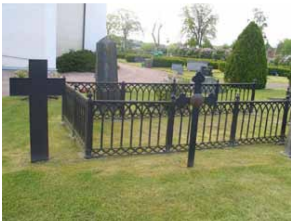
Till vänster i bild järnkorset som markerar platsen för Målilla gamla kyrka. I bildens mitt syns korset som markerar var familjen Drake af Hagelsrums gravkor låg. Kvarter B. (KI Målilla kyrkog 030)