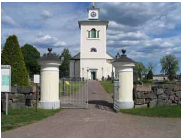
Kyrkogårdens ingång i väster. (KI Målilla kyrkog 007)

Se vidare i de enskilda kvartersbeskrivningarna.