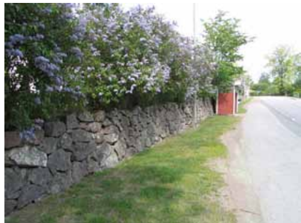
Kyrkogårdens stödmur i söder och blommande syrenhäck. (KI Målilla kyrkog 009)