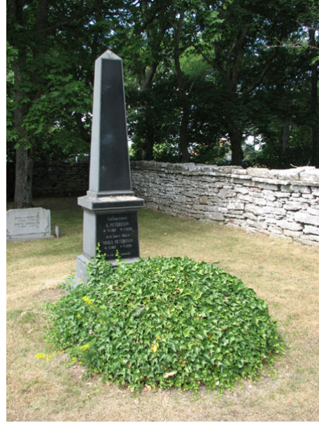
Kyrkogårdens enda murgrönskulle och en obeliskformad vård på norra sidan av kyrkan rest över sjökaptenen A Peterson och hans hustru 1892. De avled med endast några dagars mellanrum (KI Smedby kyrkog 102)