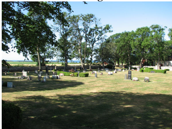
Översikt över kyrkogården söder om kyrkan från nordost (KI Smedby kyrkog 004)