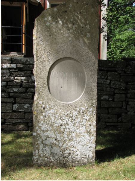
Nationalromantisk kalkstensvård rest 1900 över M G W Falkenberg på norra sidan av kyrkan (KI Smedby kyrkog 097)