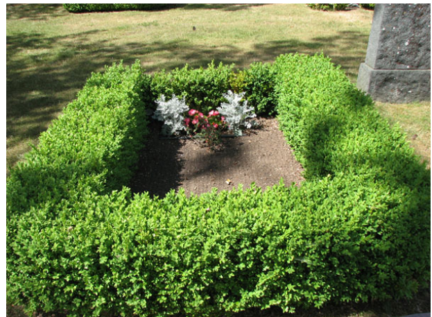
Gravplatsen har ingen vård men platsen omgärdas av buxbom och gravplanen är belagd med jord (KI Smedby kyrkog 081)