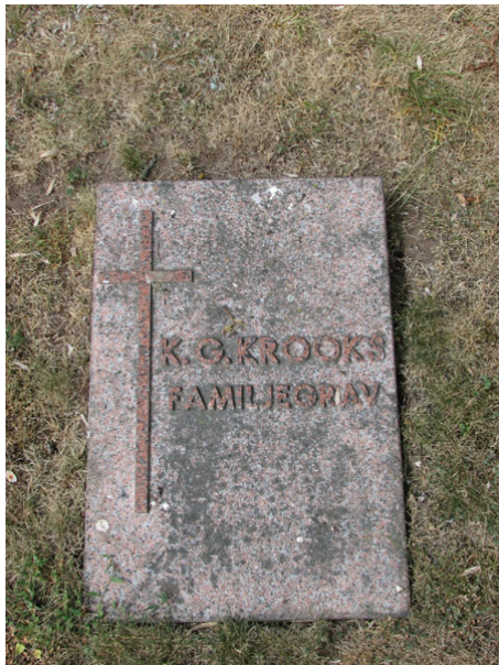
En av kyrkogårdens få liggande vårdar på norra sidan av kyrkan (KI Smedby kyrkog 095)

Kyrkogården omgärdas åt alla håll av kyrkogårdsmuren i kalksten. Sammanlagt skall det enligt gravkartan finnas 535 gravplatser. Kyrkogården har idag ingen kvartersindelning och gravplatserna ligger utspridda i ett oregelbundet mönster. Det finns inte heller några markerade gångar. Flera av gravplatserna var ända fram till början av 1990-talet omgärdade med häckar av dessa återstår endast ett fåtal. Alla vårdarna är vända mot väster och öster och hela kyrkogården är insådd med gräs.