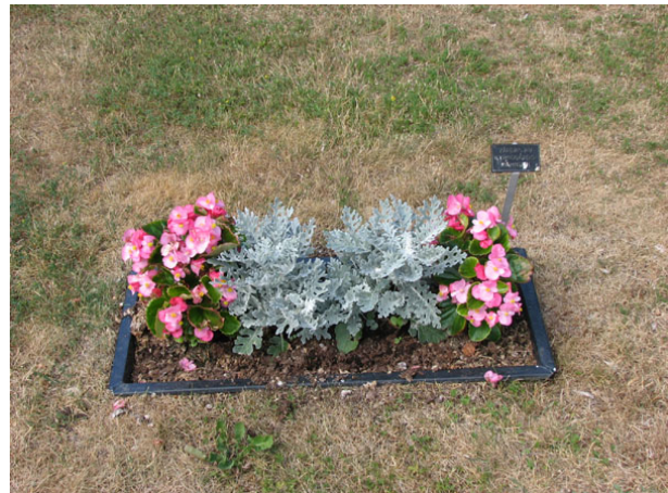
Vissa gravplatser saknar vård och endast en plantering visar platsen (KI Smedby kyrkog 110)