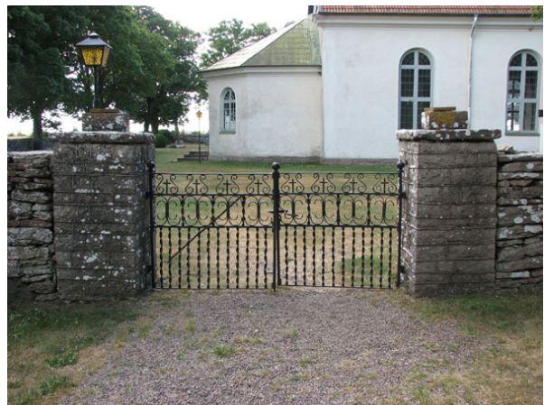
Huvudingången i det nordöstra hörnet. Smidesgrindar mellan murade stolpar av kalksten (KI Smedby kyrkog 114)