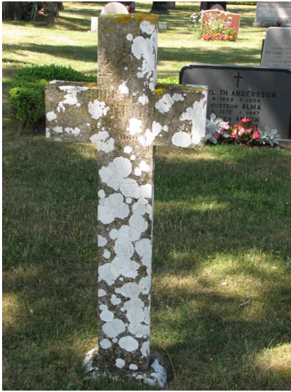
Korsformad vård i kalksten rest 1864 (KI Smedby kyrkog 060)