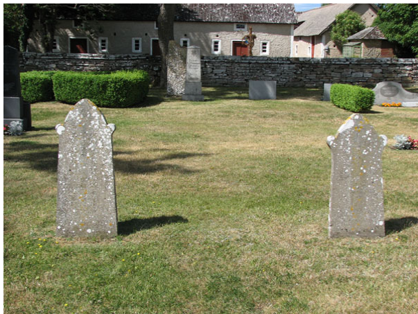
Två kalkstensvårdar, den till vänster rest 1859 och den till höger 1845 (KI Smedby kyrkog 074)

På ungefär hälften av alla vårdar är den dödes yrkestitel angiven. Vanligast är lantbrukare. Andra titlar som förekommer är kontraktsprosten, hemmansägaren, sjökaptenen, kantor och folkskolläraren, trädgårdsmästaren, smedmästaren, skepparen, nämndemannen, snickarmästaren, ”machinisten”, kyrkovaktmästaren, lärarinnan, köpmannen, prosten, kyrkoherden, provinsialläkaren, advokaten, sjöingenjören, lärarinnan, kyrkovården och professorn. By/gårdsnamn anges på merparten av vårdarna.