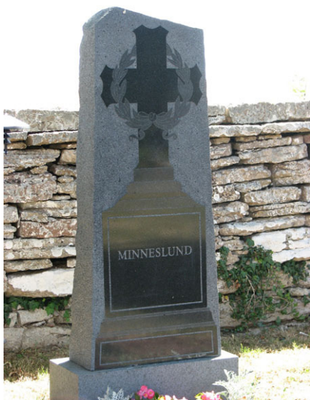
En äldre vård har återanvänts i minneslunden (KI Smedby kyrkog 037)