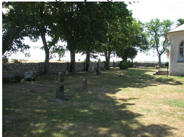
Översikt över det östra området från norr (KI Smedby kyrkog 028)