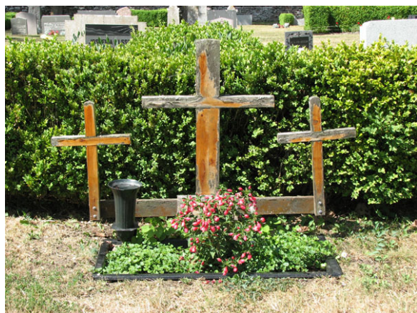
Trävård rest 1995 på södra delen av kyrkogården (KI Smedby kyrkog 055)

dock själva vårderna ut att vara gjorda senare. Kanske har den ersatt en tidigare vård eller möjligen har man slipat om stenen. Den äldsta vårderna på den norra sidan är från 1867. Under 1900-talet är det en jämn spridning av vårdar från de olika årtiondena. Materialen är främst svart och grå granit, men även röd förekommer. De äldsta vårdarna och flertalet av vårdarna från 1800-talet är dock gjorda i kalksten. På den norra sidan är de flesta vårdarna höga stående, blankpolerade svarta granitvårdar från slutet av 1800-talet och början av 1900-talet. Två vårdar på södra sidan, är gjorda i trä, varav den ena föreställer tre kors och den andra ett enkelt kors. En granitvård har ett kors av marmor. Ett fåtal vårdar är korsformade. Enstaka vårdar har nationalromantiska stildrag och vårdarna från 1930-talet är mycket breda. Norr om kyrkan växer det buskar av tuja eller buxbom vid ett par av gravplatserna och i området finns kyrkogårdens enda bevarade murgrönskulle. Kyrkogårdens enda gravplats med stenram finns söder om kyrkan och dess plan är grusad och två gravplatser har låga buxbomsomgärdningar och jordbelagda ytor. Norr om kyrkan är gravplatserna koncentrerade till den västra delen och i den östra finns en stor tom gräsyta. Enstaka gravplatser har ingen vård utan markeras endast med en plantering.