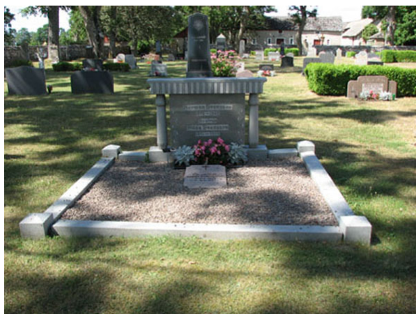
Kyrkogårdens enda gravplats med stenram och grusad yta från 1939, finns söder om kyrkan (KI Smedby kyrkog 050)