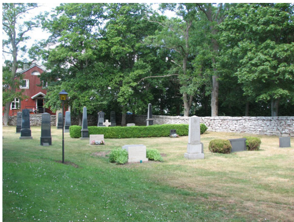
Översikt över den norra sidan av kyrkogården från sydost (KI Smedby kyrkog 109)