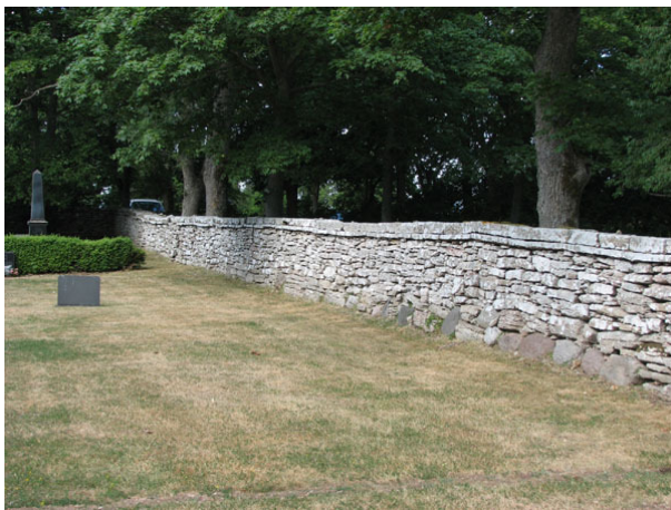
Kalkstensmuren i norr. Notera inslaget av gråsten i botten av muren (KI Smedby kyrkog 111)

Hela kyrkogården omgärdas av en kallmurad kalkstensmur med visst inslag av gråsten. På 1990- och 2000-talet har delar av muren restaurerats då träden gör att den rasar.