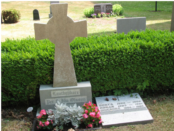
En kalkstensvård i form av ett ringkors med sockel av grå granit (KI Smedby kyrkog 103)