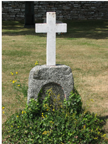
Granitvård med marmorkors från 1892 söder om kyrkan (KI Smedby kyrkog 079)