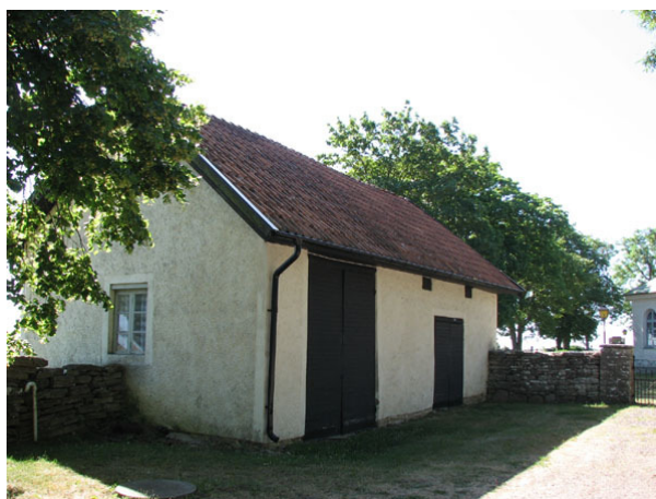
Redskapsbod och toalett i en byggnad i nordöstra hörnet utanför kyrkogården (KI Smedby kyrkog 026)