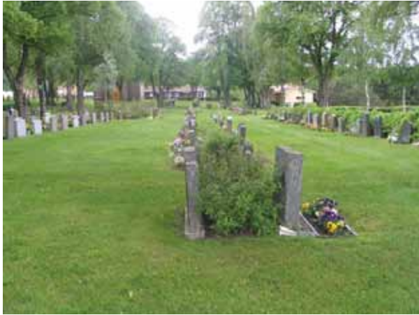
Kvarter IV från norr. Gravvårdarna är placerade i ryggställda rader med häckar emellan. Längst bort i bilden syns gravkapellet till vänster och vaktmästeriet till höger. (KI Vena kyrkog 031)