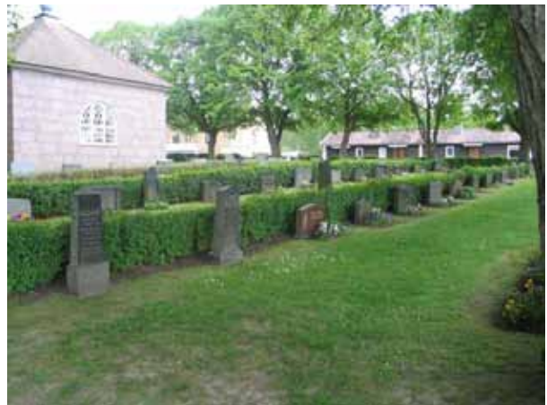
Kvarter VII från nordväst. (KI Vena kyrkog 042)