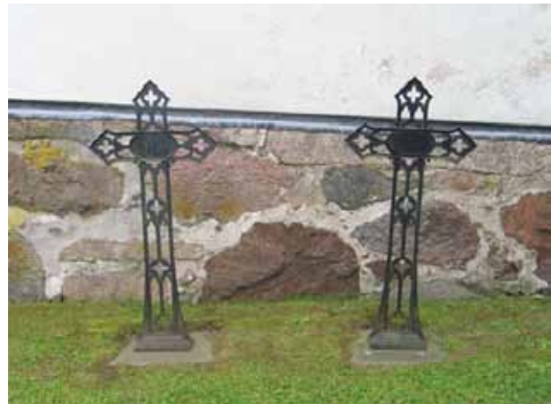
Två gjutjärnsvårdar vid kyrkans norra vägg. Båda saknar inskriptionsplatta med data. (KI Vena kyrkog 050)