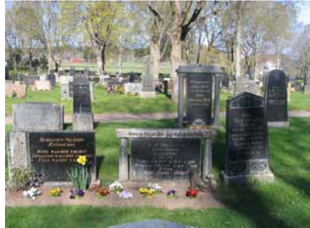
På Vena kyrkogård är det mycket vanligt att man låter äldre gravvårdar stå kvar på familjens gravplats. Här tre olika vårdar över medlemmar av samma familj från Björkesbo. (KI Vena kyrkog 015)