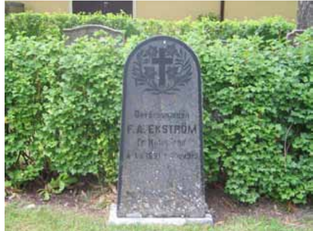
Här märks de militära traditionerna runt Hultsfred. F A Ekström var gevärssmed och avled 1912. (KI Vena kyrkog 045)