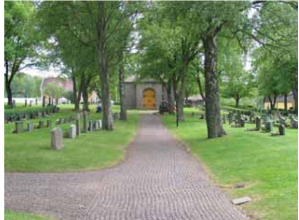
Fram till gravkapellet leder en gång kantad av björkar. Till vänster kvarter VI och till höger kvarter V. (KI Vena kyrkog 054)