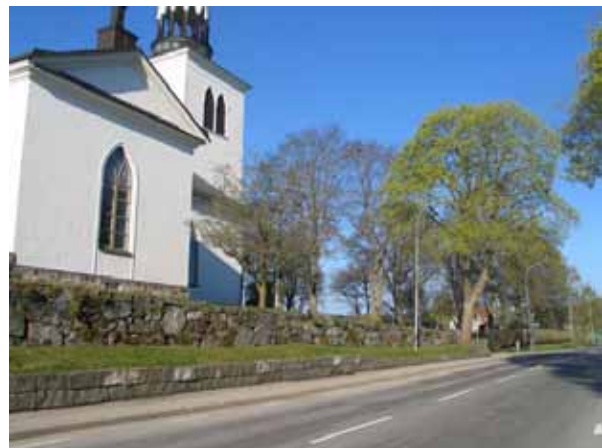
Kyrkogårdens omgärdning i norr. (KI Vena kyrkog 006)