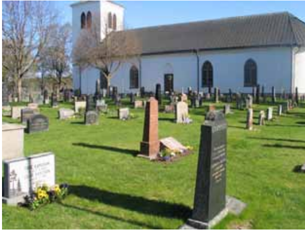
Kvarter I från söder. (KI Vena kyrkog 011)