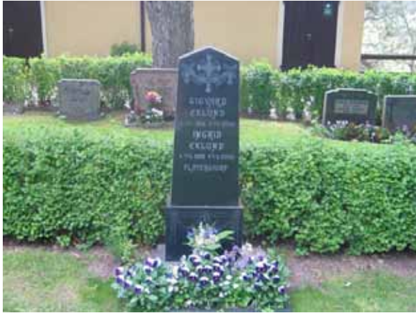
Gravvård i kvarter VII som återanvänts. Vården är typisk för det tidiga 1900-talet. (KI Vena kyrkog 044)