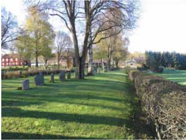
Kyrkogårdens omgärdning i väster. (KI Vena kyrkog 008)