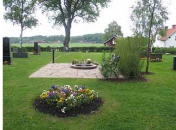
Minneslundan (KI Vena kyrkog 034)