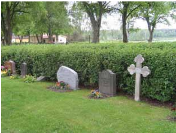
Gravvårdar i kvarter III. I kvarteret finns rester av ett linjegravsområde från mitten av 1920-talet till 1936. Träkorset och vården till vänster om detta har varit delar av linjegravsområdet. (KI Vena kyrkog 029)