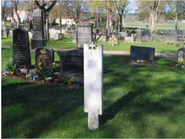
En av kyrkogårdens bevarade trävårdar. (KI Vena kyrkog 014)