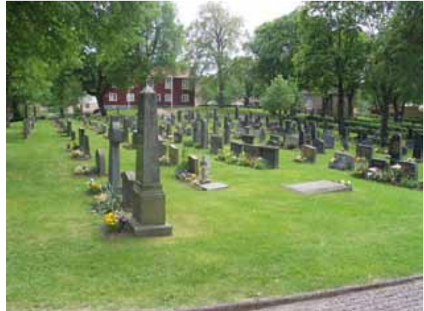
Kvarter II från norr. (KI Vena kyrkog 055)