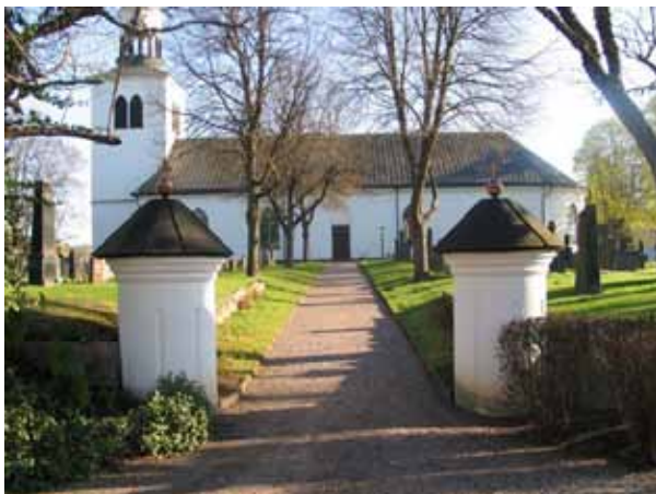
Ingång till Vena kyrkogård i söder. (KI Vena kyrkog 004)

I söder: Ingång till kyrkogården markerad av dubbla svartmålade smidesgrindar mellan runda stolpar som putsats och avfärgats i vitt. De har tak av svartmålad plåt och kröns av kors och kula i bronsfärgad metall. I söder finns också en trappa bakom sockenstugan och en infartsväg till vaktmästeriet i sydväst.