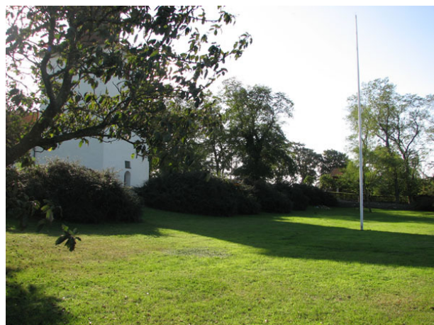
Kyrkoparken väster om kyrkan (KI Ventlinge kyrkog 008)