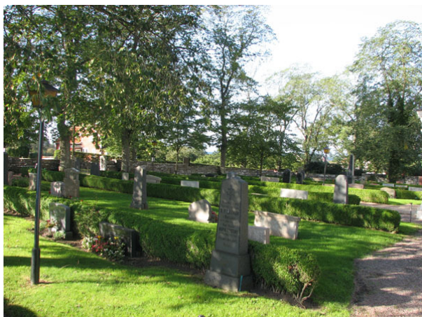
Översikt över kvarter I och II från NO (KI Ventlinge kyrkog 013)

Kvarter I och II ligger söder om kyrkan. I öster och söder avgränsas området av kyrkogårdsmuren. I norr finns kyrkan och i väster börjar kvarter V. Runt om kvarteren går en grusad gång och kvarteren delas också av en grusbelagd gång med kalkstensplattor. Den södra delen av kyrkogården rymmer 124 gravplatser. Vårdarna är ryggställda mot häckar av buxbom och vända mot öster eller väster. Hela området är insått med gräs.