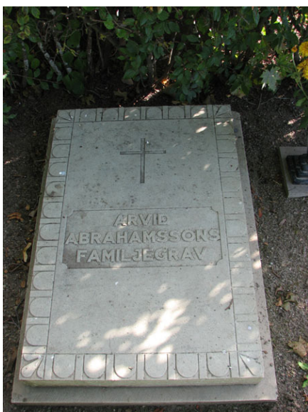
Liggande vård i kv III (KI Ventlinge kyrkog 056)

Norr om kyrkan finns ett blandat gravvårdsmaterial av varierande ålder och utförande. De höga rygghäckarna av häckoxbär dominerar intrycket av området. Det stora flertalet vårdar är låga och rektangulära men det finns även ett fåtal höga stående vårdar och ett litet antal hållar. Den äldsta vården är från år 1876 och är en liggande kalkstenshäll. Under den vilar sadelmakare J Stoffrejden och hans maka. I övrigt finns det ytterligare sex vårdar från 1800-talet. Övervägande delen av gravvårdarna är från 1960-talet och fram till och med 1990-talet. Det dominerande materialet är liksom på södra sidan kalksten men här finns även vårdar av svart, grå och röd granit. I kvarter IV finns två vårdar, av sandsten respektive kalksten som har textplattor av marmor. Vidare finns det en vård i form av ett marmorkors med sockel av granit.