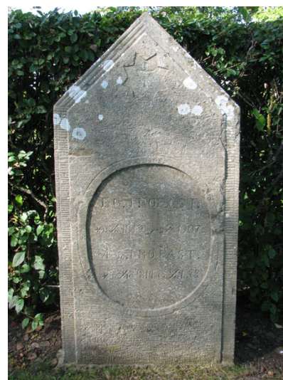
Under kalkstensvården, rest 1878, vilar herr och fru Trofast, Kv IV (KI Ventlinge kyrkog 084)