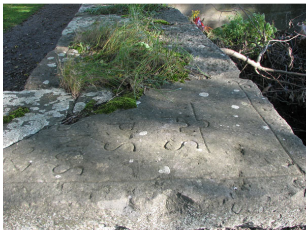
Gammal gravhäll liggandes som sten i kyrkogårdsmuren (KI Ventlinge kyrkog 015)