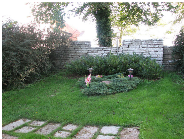
Minneslunden ligger i kyrkoparken väster om kyrkan (KI Ventlinge kyrkog 007)

En minneslund anlades och invigdes år 1998. Den anlades strax utanför och intill kyrkogårdsmuren i väster i den så kallade kyrkoparken. I fonden mot muren är det planterat rhododendron och runt själva stenen med ordet "minneslund" inristat växer det blå krypen. I övrigt är det planterat lagerhägg som avgränsar lunden i norr och söder och framför planteringen är det lagt kalkstensplattor.