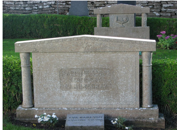
Flera vårdar på den södra sidan är klassicistiska i sin utformning (KI Ventlinge kyrkog 041)