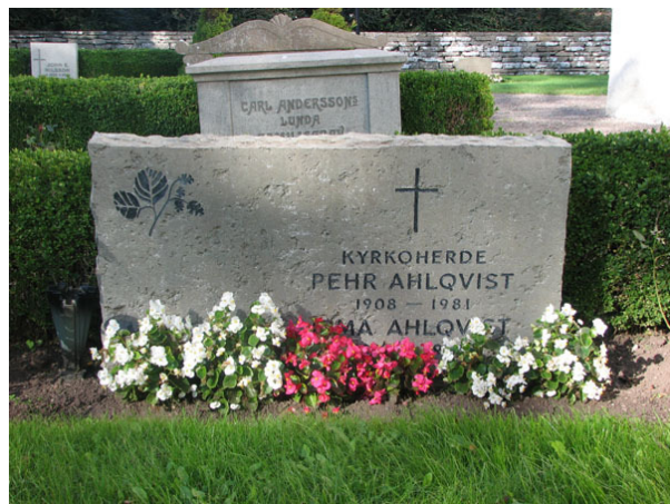
Ett stort antal gravvårdar är gjorda i kalksten bland annat denna rest över kyrkoherde Ahlqvist 1981 (KI Ventlinge kyrkog 021)