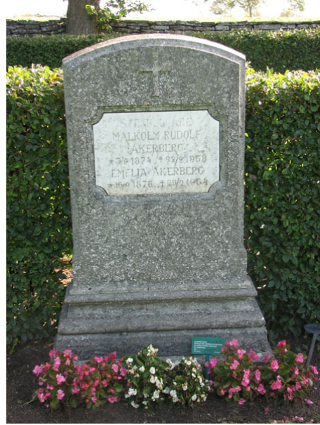
En gravvård rest över en stenhuggare. Har stenhuggaren möjligen själv utformat vården? Kv IV (KI Ventlinge kyrkog 081)