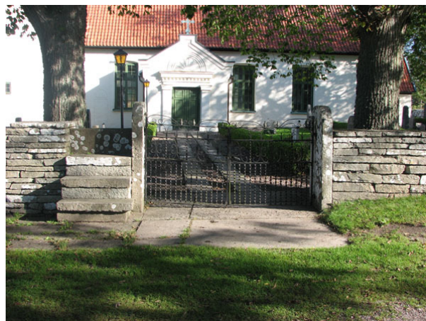
Smidesgrind och klivstätta i söder (KI Ventlinge kyrkog 004)