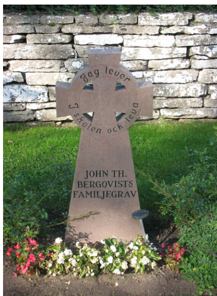
Ringkors av kalksten i kv V (KI Ventlinge kyrkog 036)

Den dödes yrkestitel anges på en minoritet av gravvårdarna. Hemmansägare och lantbrukare är de vanligaste på norra delen av kyrkogården. Övriga titlar som finns är folkskollärarinnan, skepparen, hammästaren, sadelmakaren, skipper, nämndemannen, stenhuggare, kyrkogårdschefen i Gävle, styrman, doktor samt trotjänaren och medaljören. Varifrån den döde kommer anges med by eller gårdsnamn på mindre delen av vårdarna.