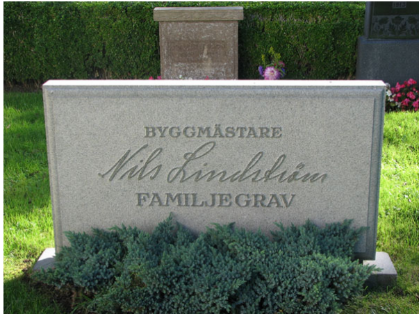
På ett fåtal vårdar har den dödes yrkestitel skrivits ut, som här på byggmästare N Lindströms gravvård (KI Ventlinge kyrkog 042)