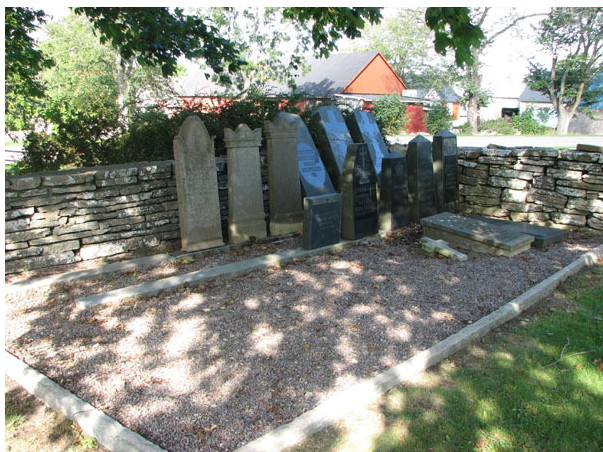
Museal uppställning av gamla gravvårdar i kyrkogårdens NV-hörn (KI Ventlinge kyrkog 049)