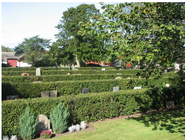
Översikt över kvarter III - V från Ö (KI Ventlinge kyrkog 095)

Norra delen av kyrkogården, samt kvarter V längs den västra muren, består sammanlagt av ungefär 350 gravplatser. Kvarteren avgränsas åt väster, norr och öster av den kallmurade kyrkogårdsmuren och i söder är kyrkan. I området finns inga markerade gångar och kvarteren åtskiljs endast av något bredare gräsytor. Vårdarna är vända mot öster och väster och ryggställda mot häckar av häckoxbär. Området är gräsbesätt. I det nordvästra hörnet finns en uppställningsplats för gamla vårdar tagna ur bruk.