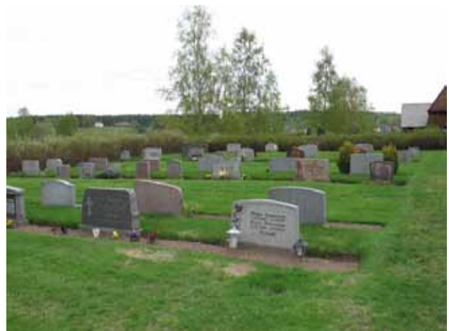
Kistgravsområdet med dess strikta rader av jämnstora vårdar i grå och röd granit. (KI Djursdala kyrkog 117)