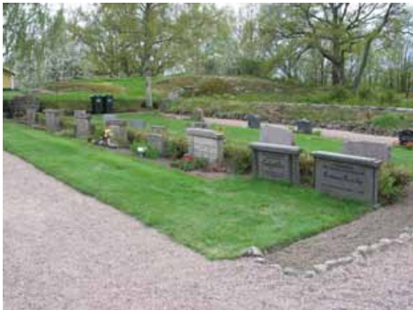
Kvarter D mot nordväst. (KI Djursdala kyrkog 088)