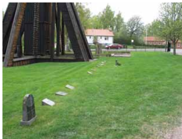
Barngravsområdet med de små gravstenarna. (KI Djurdala kyrkogård 035)