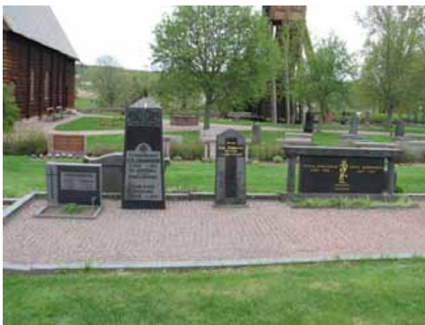
Längst i väster finns en hel rad av grusbelagda och stenramsomgärdade gravplatser med vårdar i mörk granit. Här syns familjen Johanssons familjegrav med vårdar från 1916 till 1994. Många av familjegravarna har använts under lång tid. (KI Djurdala kyrkog 052)