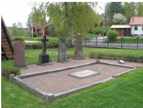
Gravplatsen intill klockstapeln, en plats som måste ha varit eftertraktad. (KI Djurdala kyrkogård 036)

Kvarter A är beläget dels öster om kyrkan, dels väster och nordväst om klockstapeln. Öster om kyrkan är vårdarna glest och lite oregelbundet placerade. Vårdarna står i gräsmatta, förutom en som har grusad gravplats. Väster och nordväst om klockstapeln består kvarteret dels av ett antal barngravar, små gravstenar i gräsmatta, dels av en stor grusad yta med flera högresta vårdar. I området finns relativt många äldre gravvårdar.