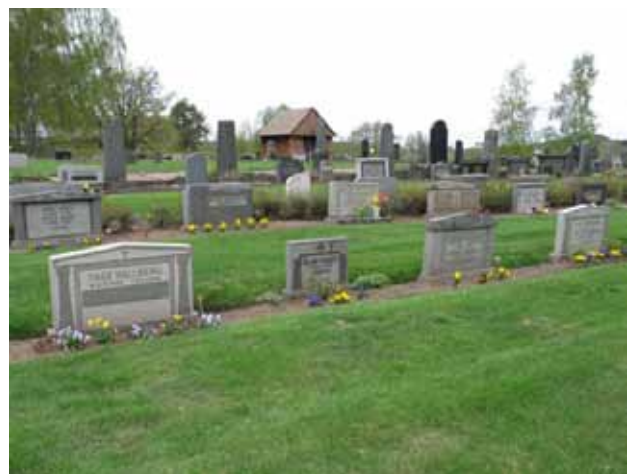
Rader av likartade vårdar av grå granit från 1900-talets mitt. Motivet med slipade (eller fristående) kolonner eller pilastrar på stenen var mycket populärt. (KI Djursdala kyrkog 049)