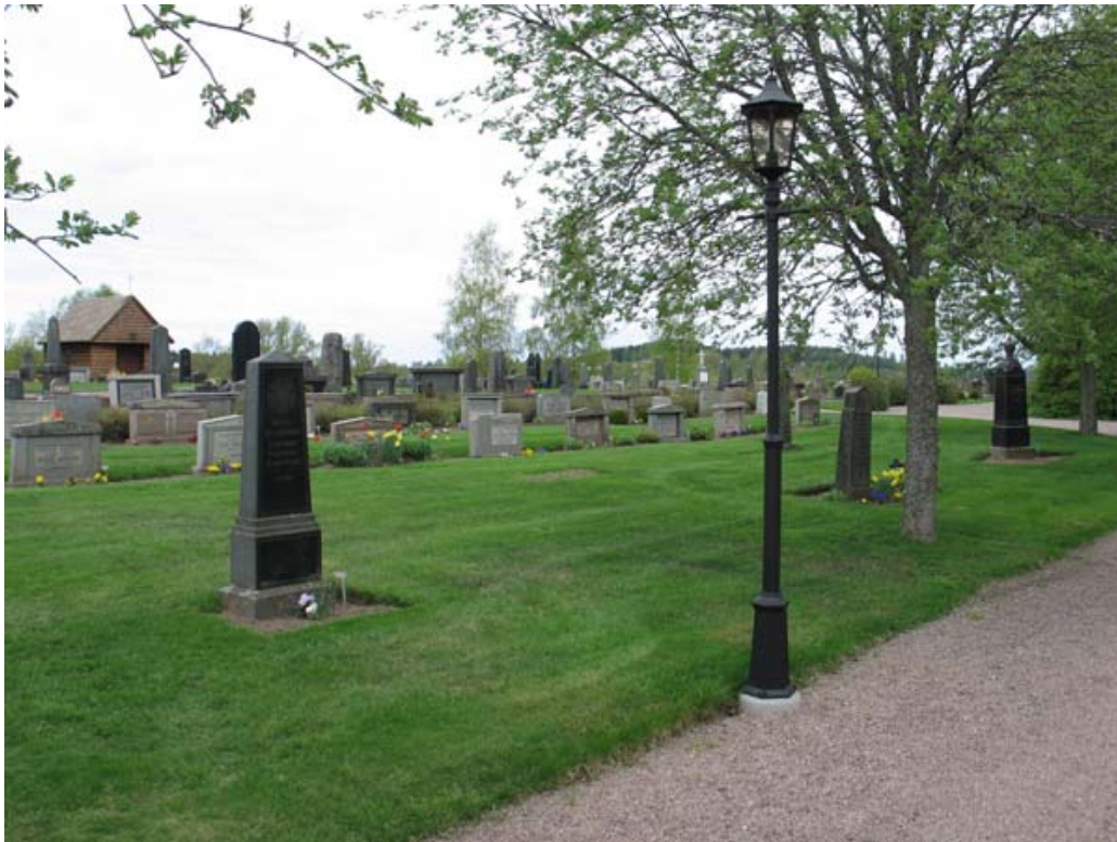
Kvarter B mot nordväst. Här syns i förgrunden några av de äldsta vårdarna längs med gången som är belägen öster om kvarteret. Bakom den finns rader av grå rektangulära vårdar. (KI Djursdala kyrkog 048)