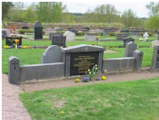
Exempel på den typ av vårdar som förekommer speciellt från 1930-talet och ca 20 år framåt. Oftast förekommer bara mittpartiet men ibland är det förlängt med breda sidopartier. Detta har tidigare varit en grusad gravplats. Vården är rest över nämndemannen Gottfrid Pettersson med familj 1948. (KI Djursdala kyrkog 083)