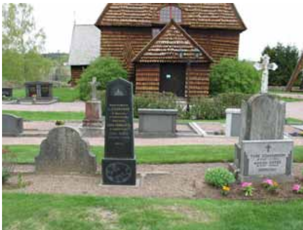
Ett parti av kvarter G. (KI Djursdala kyrkog 062)