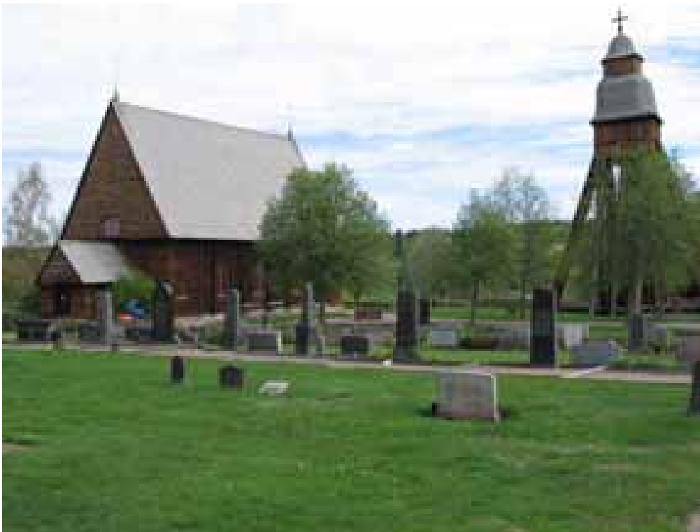
Vy över kyrkogården mot nordost. Kvarter C och B. (KI Djursdala kyrkog 030)

Övrigt: Häckarna, som mestadels fungerar som rygghäckar, består av liguster, ölandstok, spirea och rosentry. Kring några gravplatser finns häck av liguster.