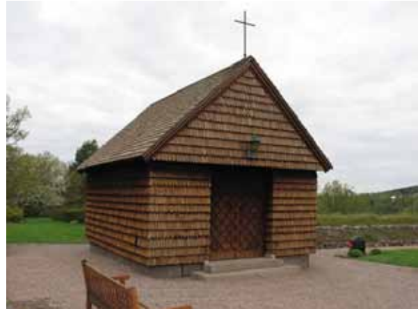
Bårhusets östra och södra fasad. (KI Djursdala kyrkog 108)