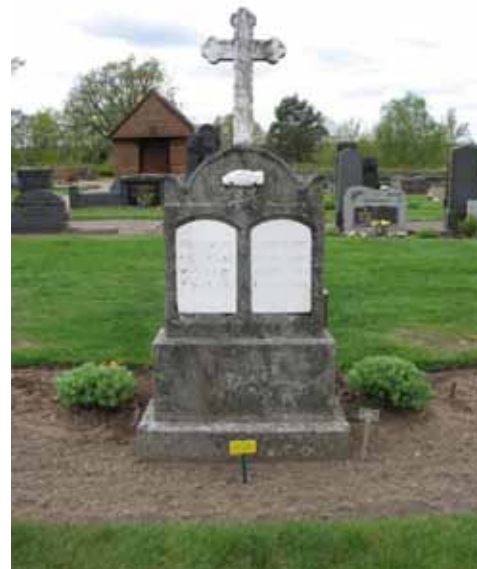
En av kyrkogårdens äldsta gravvårdar, rest över komminister Olof Törnell d. 1881 och hustrun A. Sofie Törnell d. 1869. Enligt inskriptionen reste åtta sörjande döttrar vårdan. (KI Djursdala kyrkog 063)