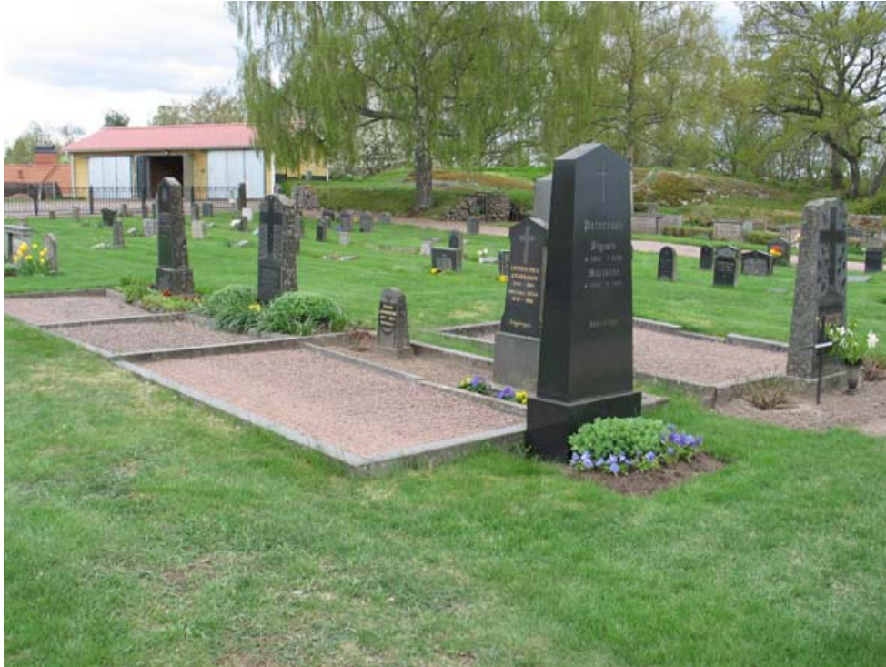
Kvarter C mot sydväst. I förgrunden syns gruppen av grusbelagda familjegravar i kvarterets norra del. I bakgrunden kan linjegravsområdet skönjas med små vårdar i gräsmattan. (KI Djursdala kyrkog 091)