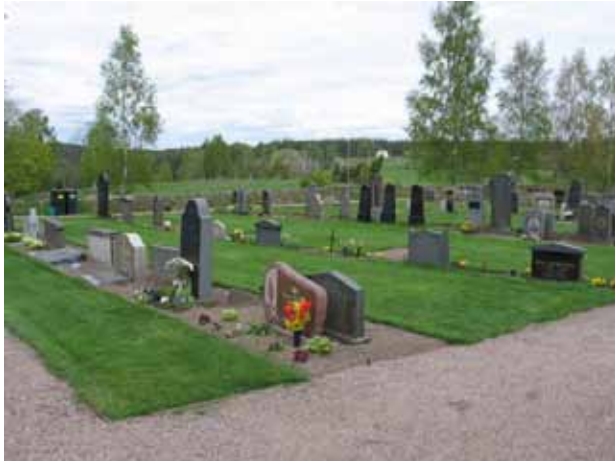
Kvarter G mot nordost. Notera blandningen av olika vårdar. (KI Djursdala kyrkog 072)