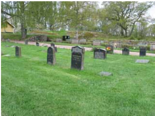
Del av linjegravsområdet med sina små vårdar. Här syns några av gravstenarna från 1940-talet. (KI Djursdala kyrkog 093)