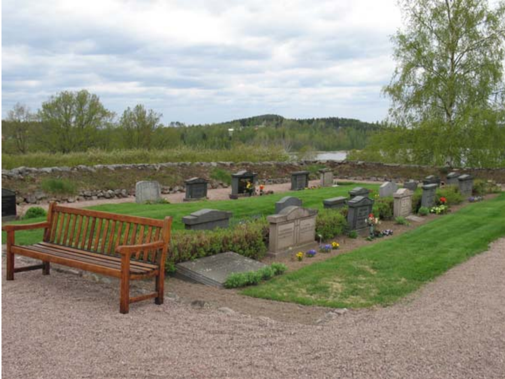
Kvarter E mot sydväst. Notera de jämnstora vårdarna. (KI Djursdala kyrkog 084)

Kvarter D och E är två små områden som ligger närmast norr, respektive söder, om bårhuset. Båda kvarteren består av rader av mellanstora gravvårdar som står i en jordränna eller i gräsmattan. De flesta är familjegravplatser.