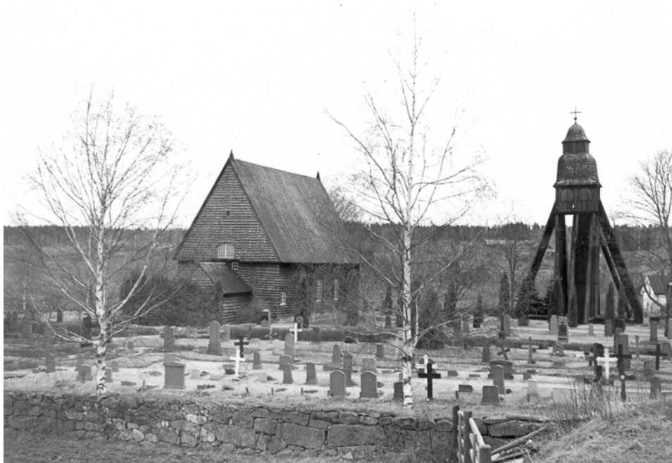
Nuvarande kvarter B och C dokumenterat 1947. Notera den täta placeringen av vårdar och de många korsen.