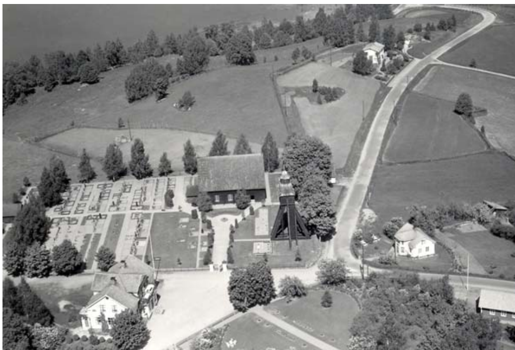
Flygfotografi över kyrkomiljön år 1950. Här kan man se att grusgravarna ökat i antal och att även linjegravsområdet nu ligger i grusad yta. Bårhuset skymtar nu också i kyrkogårdens västra del. I det nedre högra hörnet syns delar av den byggnad som numera är församlingshem.

Bilden ovan från 1950 visar hur hela norra delen av kyrkogården bestod av grusgravar som omgärdades av häckar och/eller stenram. Även barngravsområdet i kvarter A utgjordes av en grusad yta. Stora delar av kvarter B är på bilden ännu ledigt. Linjegravsområdet kvarter C verkar i det närmaste fullbelagt och stora ytor ligger i grus eller jord.