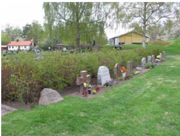
En av raderna med urngravar från 1980-90-talen. Här förekommer olika typer, naturstenar, rektangulära vårdar, kors m m. (KI Djursdala kyrkog 114)

Kvarter I utgör den senast utvidgade delen av kyrkogården. Området består av urngravar i två rader i söder samt ett sammanhängande och stort, rektangulärt område med kistgravplatser i norr. Urngravarna är placerade längs häckar och omges av vegetationen kring minneslunden medan kistgravsområdet är mer strikt ordnat med raka rader med ryggställda gravvårdar. I urngravsområdet finns många lediga platser.