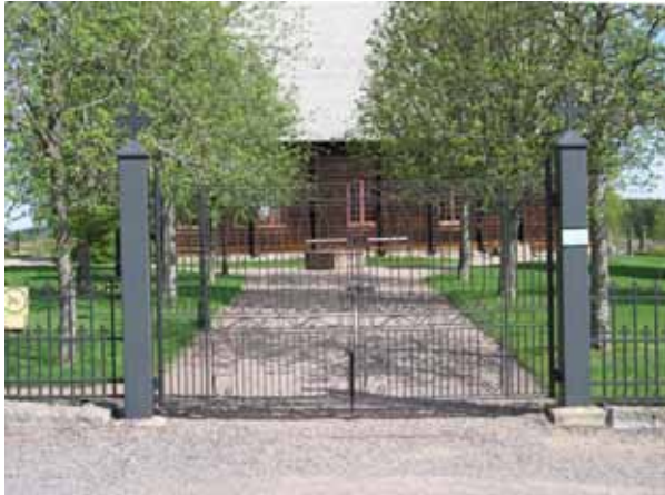
Huvudentrén söder om kyrkan. (KI Djursdala kyrkog 002)