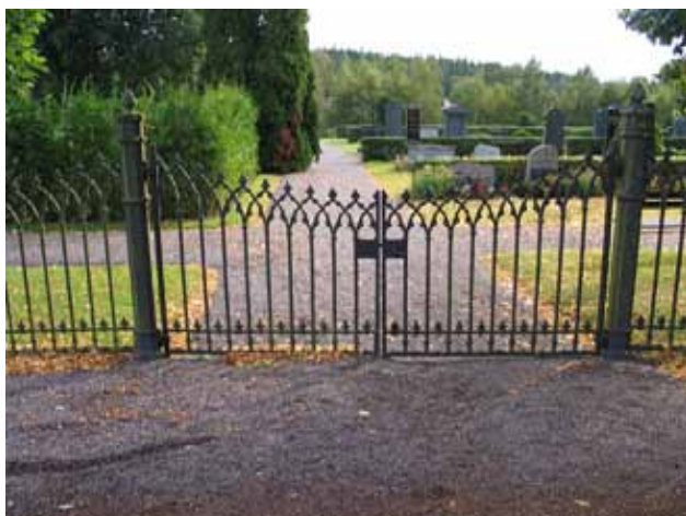
En av kyrkogårdens västra ingångar. (KI Frödinge 0128)