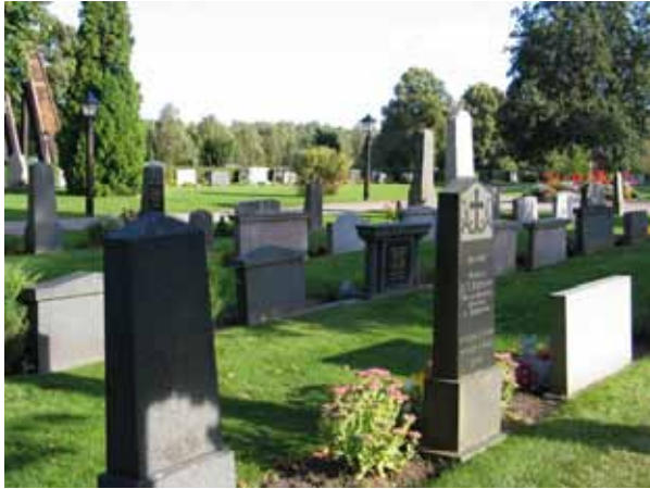
Kvarter D från väster. Notera de återanvända stenarna (KI Frödinge 210)