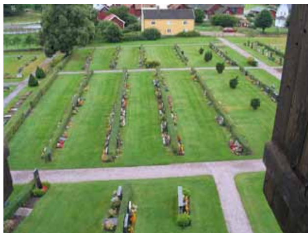
Vy över östra delen av kvarter A och E. (KI Frödinge 0114)