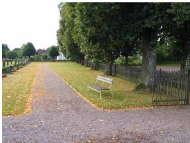
Gjutjärnsstaket och trädkrans av lindar i väster. (KI Frödinge 0131)