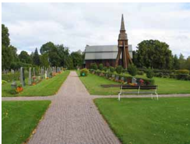
Gång som delar kvarteren A och E. (KI Frödinge 0139)

Området omfattar 464 gravplatser, men är inte fullbelagt. Dels är enstaka gravplatser tomma dels är rader eller delar av rader tomma i kvarterens östra delar. I områdets västra del mot gången finns rader med köpegravar medan det i öster är en blandning av köpegravar och enstaka linjegravar. En rad av oklippta cypresser är planterade i nord-sydlig riktning i områdets västra del. Raderna är ryggställda med ligusterhäckar mellan. I de två östligaste raderna är ligustern utbytt mot måbär. Områdets äldsta och yngsta vård från 1911 respektive 2003 finns kvarter A. Området är åldersmässigt splittrat eftersom nya gravsättningar har skett kontinuerligt i det gamla linjegravsområdet. På några platser i området kan man se mer sammanhängande spår av linjegravsområdet.