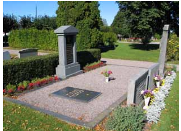
Grusgrav (KI Frödinge 0170)