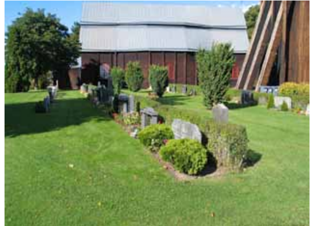
Kvarter B. (KI Frödinge 0186)