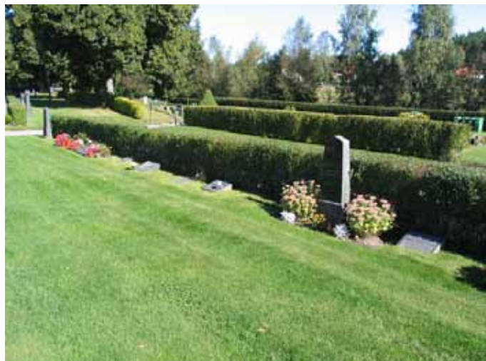
Rester av linjegravsområde i östra delen av kvarter A. (KI Frödinge 0172)