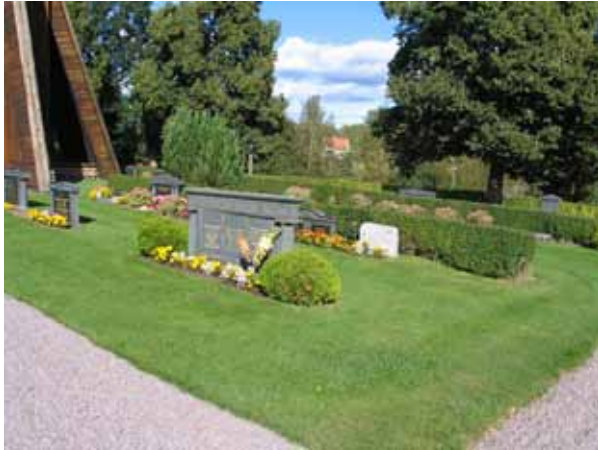
Kvarter C. (KI Frödinge 0184)