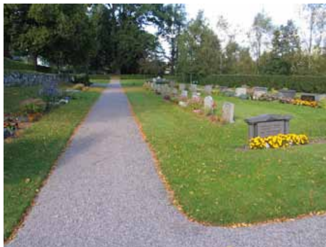
Kvarter H mot norr. (KI Frödinge 0180)