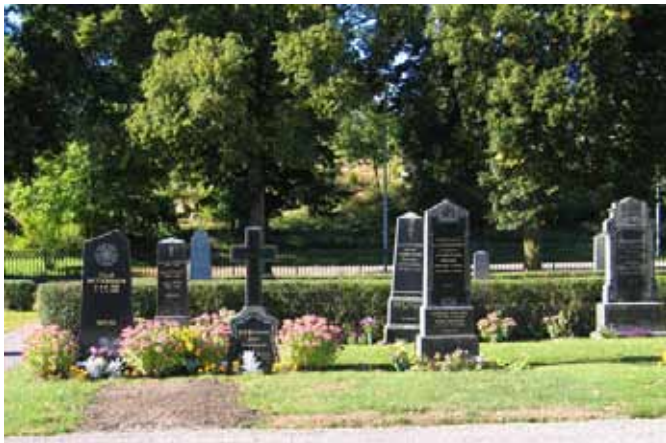
Äldre, höga vårdar i västra delen av kvarter A. (KI Frödinge 0169)

De västra delarna av kvarter A och E utmärks av höga gravvårdar. Detta är speciellt påtagligt i den del som tillhör kvarter A. Enstaka liggande stenar finns. Materialet är grå eller svart granit. Gravvårdarnas utformning varierar. Här finns t.ex. vårdar utformade som kors, vårdar utformade med de antika templen som förebild samt en hög kvadratisk sten i svart granit krönt av en urna i samma stenmaterial. På de flesta gravvårdarna finns den dödes hemort angiven. Hemmansägare är den vanligaste angivna titeln. Här finns också titlarna trädgårdsmästare, kantor, nämndeman, predikant i Ö.S.M. (Östra Smålands Missionsförening), häradsdomare, skoldirektör, bankdirektör och smedmästare. I den del som tillhör kvarter A finns kyrkogårdens enda bevarade grusgrav. Gravplatsen rymmer två vårdar, en stående, äldre och en liggande av yngre datum. Den stående vården lånar drag från klassiska tempelfasader.