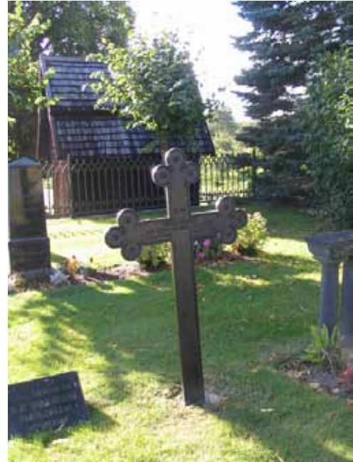
Gjutjärnsvård i kvarter D. I bakgrunden spruthuset. (KI Frödinge 0198)