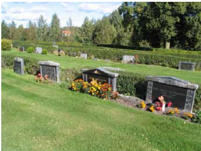
Köpegravar i östra delen av kvarter A. (KI Frödinge 0176)