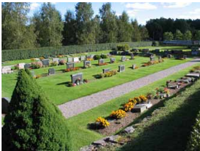
Kvarter I och J mot söder. (KI Frödinge 0179)

Kvarteret är avsett för urngravar och togs i bruk 1998. Området är planerat för 54 platser men idag är endast fyra av dessa använda. Rader med blå kantnepeta är planterade och gravvårdarna har ryggställts mot dessa.