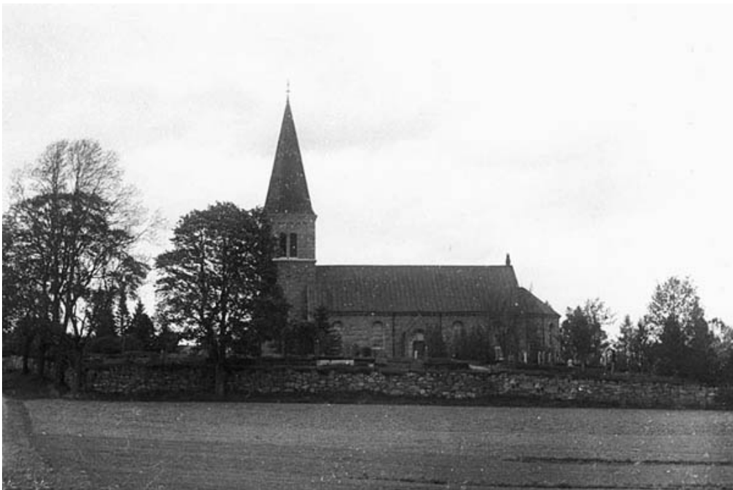
Locknevi kyrka fotograferad från söder omkring 1910-20.