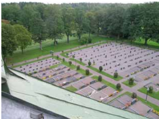
Kvarter B till vänster och C till höger. Strukturen kan skönjas med större familjegravar i väster och linjegravar i öster. (KI Locknevi 0224)

Kvarter B omfattar omkring 380 gravplatser och ligger öster om kyrkans kor. I den västra delen av kvarteret finns köpegravar belagda med grus. I den östra delen finns några rader av linjegravar, även de på en grusad yta. Kvarteret omgärdas av grusgångar i alla väderstreck. Längs grusgången står almar på en remsa av gräs. Marken sluttar från kyrkan mot öster.