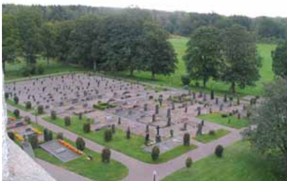
Kvarter C mot sydost. Notera strukturen med

Kvarter C omfattar närmare 500 gravplatser och ligger sydost om kyrkan. I den västra hälften av kvarteret finns köpegravar, nästan alla grusbelagda. I den östra hälften finns rader av linjegravar, även de på en grusad yta. Kvarteret omgärdas av grusgångar i alla väderstreck. Längs gångarna står almar på en remsa av gräs. Marken sluttar något mot öster.