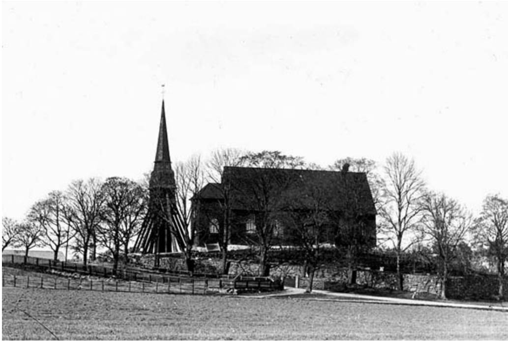
Locknevi gamla kyrka fotograferad från sydväst omkring år 1900.