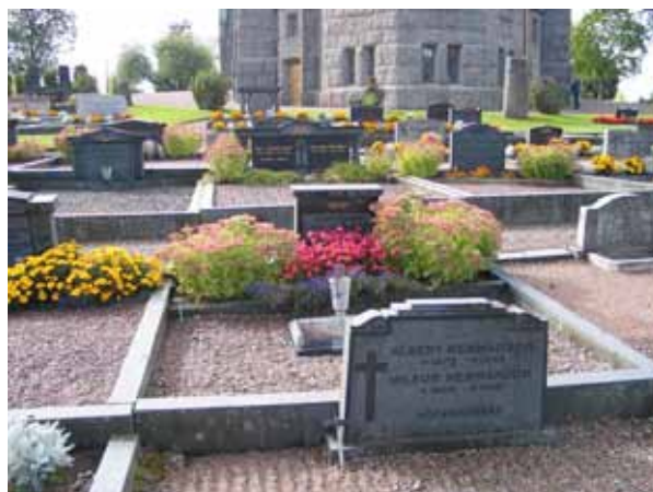
Kvarter B, familjegravar i den västra delen (KI Locknevi 0060)