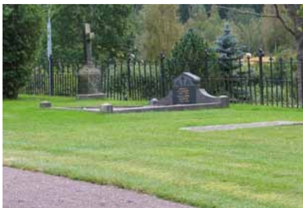
Kvarter E mot sydväst. (KI Locknevi 0222)