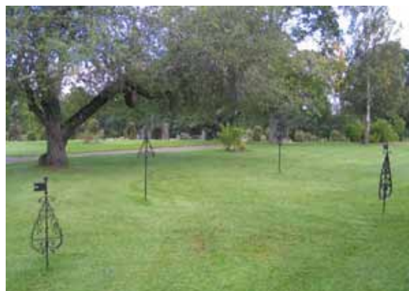
Området med friare parkkaraktär sydväst om kyrkan. Notera de sekundärt uppställda smidesvårdarna. (KI Locknevi 0101)