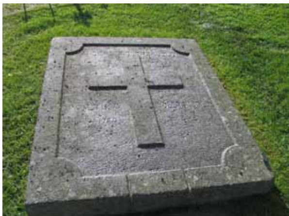
Kvarter D. En av granithällarna över familjen Fidlerskjöld, daterat 1836. (KI Locknevi 0097)

sydväst om kyrkan. Bild från norr. I bakgrunden syns Locknevi skola. (KI Locknevi 0005)