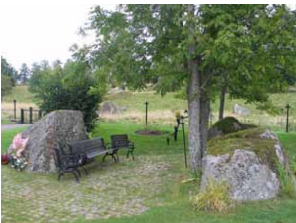
Minneslundan öster om kvarter B. I bakgrunden syns den östra ingången till kyrkogården. (KI Locknevi 0022)