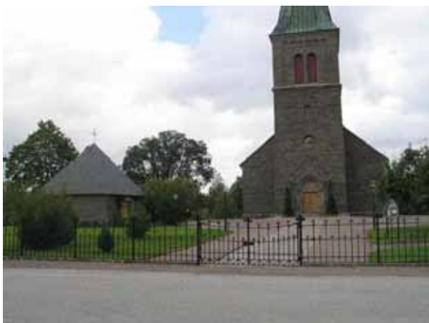
Kyrkogårdens huvudingång framför kyrkans torn. Bårhuset till vänster. (KI Locknevi 0009)