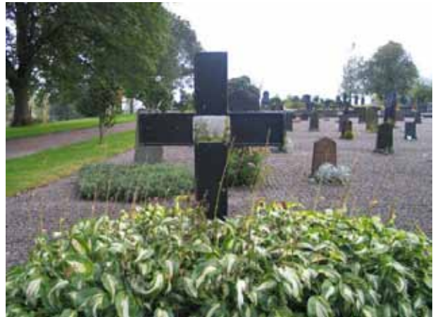
Kvarter C med en av kyrkogårdens två bevarade trävårdar, daterad 1924. (KI Locknevi 0087)