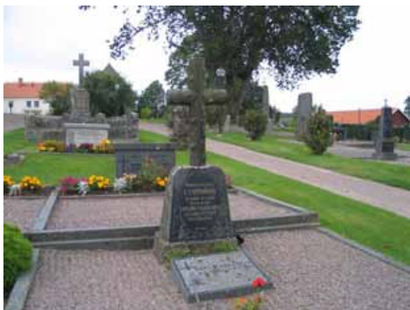
Kvarter B, nordvästra hörnet med en grupp äldre gravvårdar. (KI Locknevi 0056)