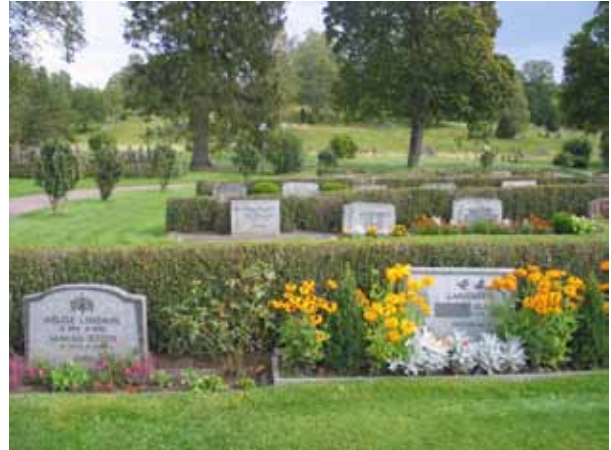
Kvarter A mot öster. Regelbundna rader mot rygghäckar. (KI Locknevi 0045)