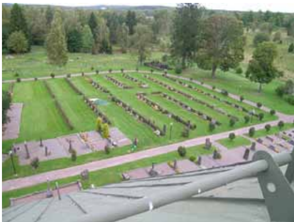
Kvarter A, översikt mot norr. (KI Locknevi 0226)

Kvarter A omfattar ca 550 gravplatser och ligger på kyrkogårdens nordöstra del. I den sydvästra delen av kvarteret finns många gravvårdar från 1900-talets början, samt flera grusgravar. I den norra och östra delen är merparten av vårdarna från 1960-talet och framåt och står i gräsmatta längs rygghäckar av liguster. I nordväst finns många lediga platser. Kvarteret omgärdas av grusgångar i alla väderstreck. Längs gångarna står almar på en remsa av gräs. Inne i kvarteret finns några gångar av betongplattor. Vid kvarterets sydvästra hörn står en gammal alm.