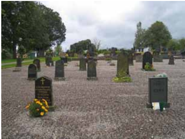
Kvarter C med linjegravområdet mot i öster. (KI Locknevi 0088)

familjegravar i väster och linjegravar i öster (KI Locknevi 0007)