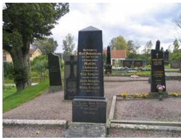
Kvarter D mot väster, med de för kvarteret dominerade