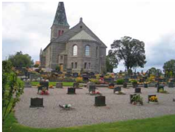
Kvarter B mot väster. Linjegravar på grusad yta i förgrunden. (KI Locknevi 0052)