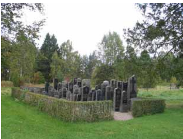
Sekundärt uppställda äldre gravstenar i nordöstra delen av kyrkogården. (KI Locknevi 0026)

Blandad gravvårdskaraktär från 1800-talets mitt och framåt. Höga vårdar av svart granit dominerar i kvarter D, södra delen av kvarter C, samt närmast kyrkan i öster och norr. Ett stort antal låga, breda vårdar från 1900-talets mitt finns i kvarter A, B och C. Enstaka hållar från 1800-talets mitt i kvarter D och E. Ett stort antal linjegravvårdar av litet format från 1920-talet till 1960-talet. Svart, grå och ljusröd granit dominerar på hela kyrkogården. Enstaka vårdar av kalksten och sandsten. Ett gjutjärnskors, två träkors samt några smidesvårdar. Större delen av kyrkogården är belagd med grus, med största undantaget i kvarter A där gräs såtts i. I den östra delen av kvarter D står en hög sten uppställd mot ett träd. Stenen är utförd i stil liknande en runsten, med en ormslinga som rymmer inskription. På stenen finns också ett kors samt årtal 1759 eller 1859. Historien kring stenen är oklar.