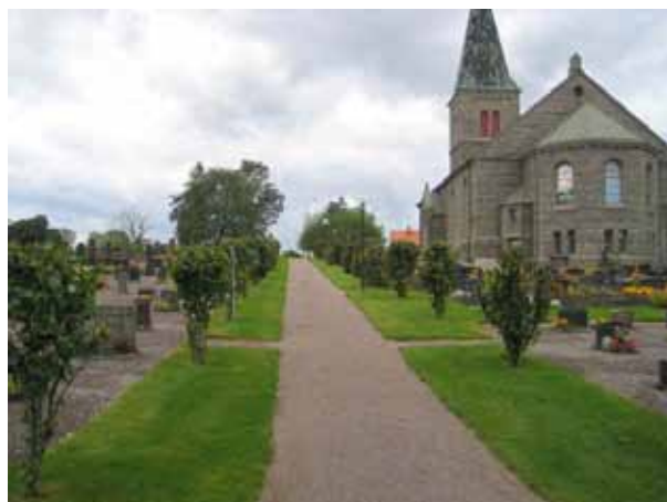
Södra delen av kyrkogården med gång kantad av almar. (KI Locknevi 0066)