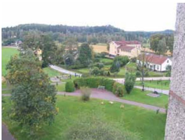
Vy mot kvarter D och det parkliknande området

Titlar finns angivna på många av vårdar, såsom kyrkoherde, hemmansägare, organist, häradsdomare, kantor och godsägare. Ortnamn anges på många av vårdarna.