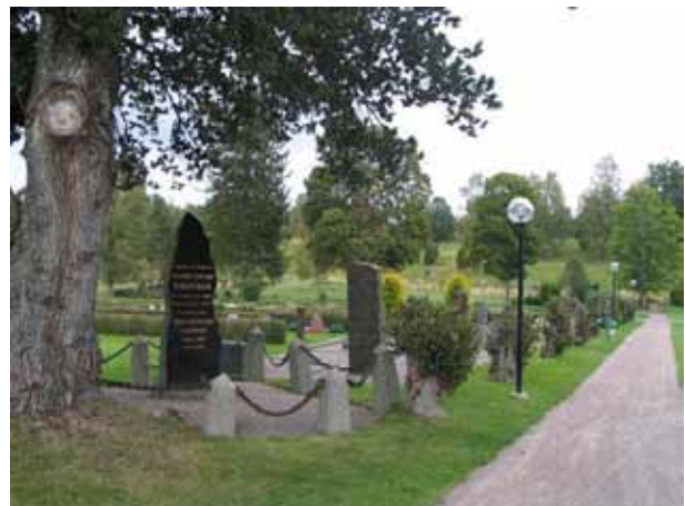
Kvarter A mot nordväst. Gravplats A 57 i förgrunden med vårdan över Ingenjören och Riddaren Wikander död 1899. (KI Locknevi 0034)