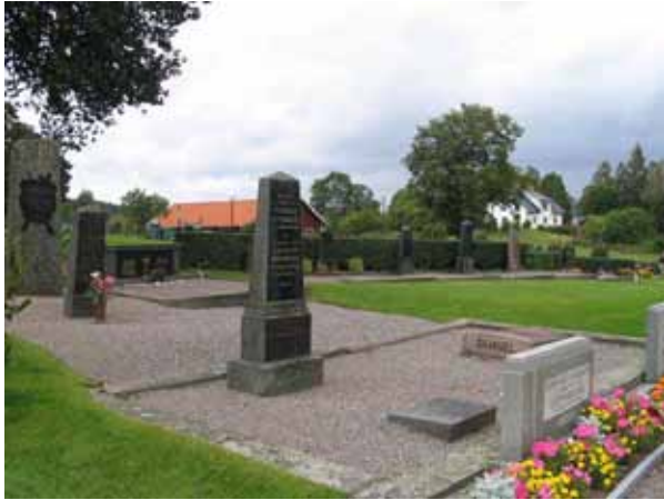
Kvarter A mot nordväst med det mindre partiet med grusgravar samt de gräsbelagda gravplatserna mot rygghäckar. (KI Locknevi 0037)