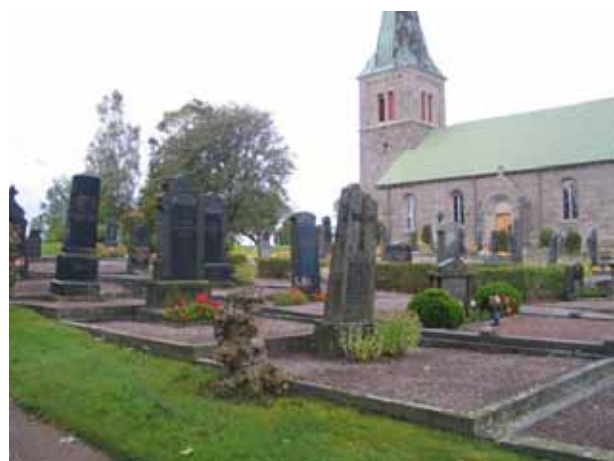
Kvarter C mot nordväst. (KI Locknevi 0070)