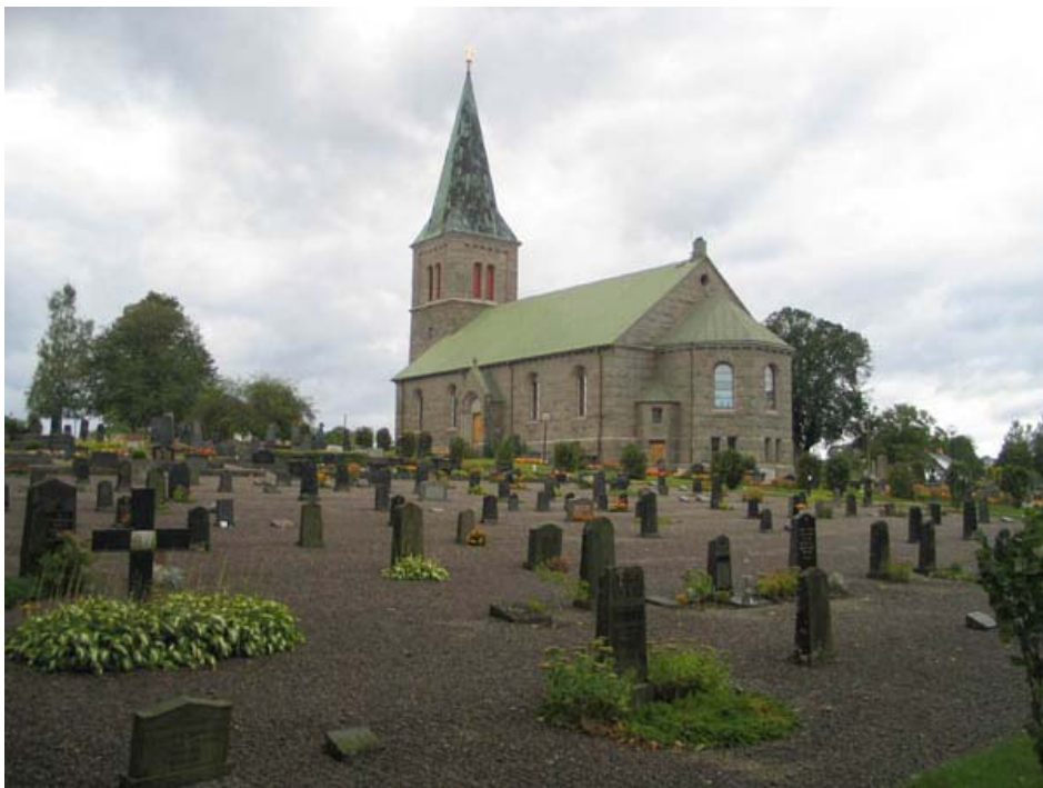
(KI Locknevi 0068)

Frödinge-Locknevi församling Linköpings stift Kalmar län