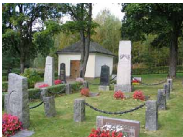
Omgärdad grav i kvarter III (KI Pelarne kyrkog 037)