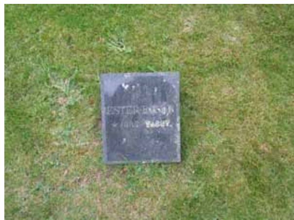
Liggande gravvård kvarter IV(KI Pelarne kyrkog 074)