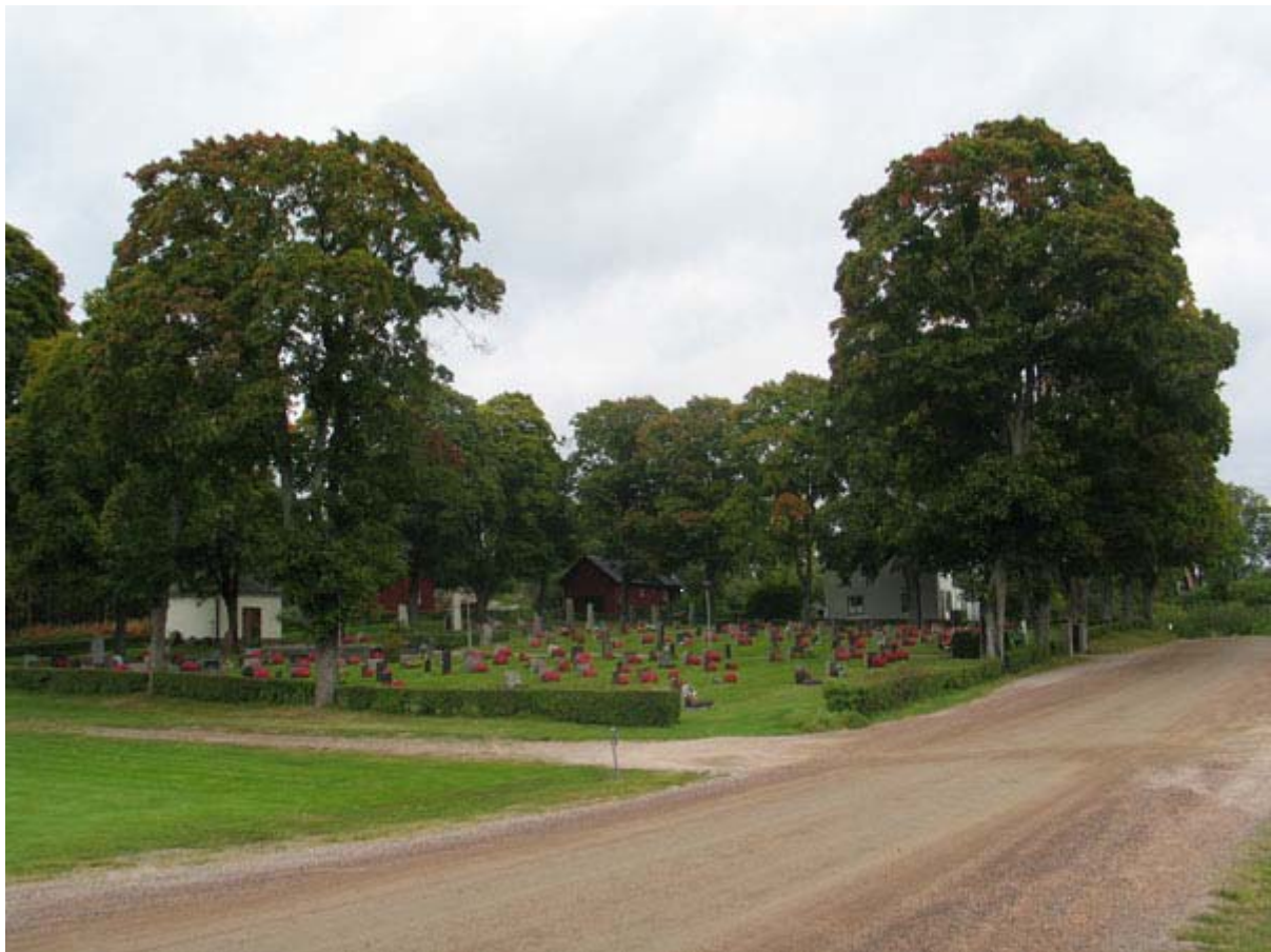
(KI Pelarne kyrkog 004)

Kulturhistorisk inventering av kyrkogårdar/ begravningsplatser i Linköpings stift 2005