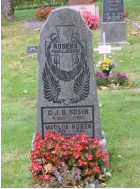
Gravvård kvarter IV (KI Pelarne kyrkog 043)