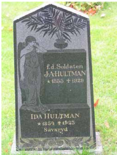
Gravvård kvarter I(KI Pelarne kyrkog 059)