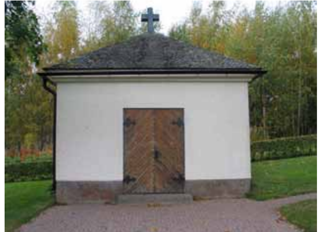
Kapellet. (KI Pelarne kyrkog 011)