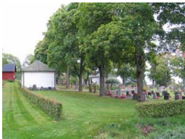
Träden utgjorde tidigare kyrkogårdens norra gräns. (KI Pelarne kyrkog 007)