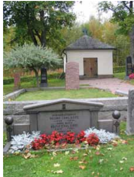
Gravvård kvarter I (KI Pelarne kyrkog 029)