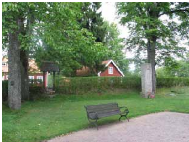
Del av kyrkotomten från öster. (KI Pelarne ka 027)

Runt om kyrkan ligger Pelarne socknens ursprungliga kyrkogård. Den har en något oregelbunden form och den största öppna ytan finns mot söder. Kyrkan och kyrkogården omges av en kallmurad halvmur samt en trädkrans bestående av stora almar och i muren finns en stiglucka mot väster. Söder om kyrkan står klockstapeln. På kyrkogården finns nio gravvårdar kvar. Här finns bl a flera platser som tillhör familjen Drangel som hade en viktig position i socknen och som också är släkt med Ramsvärds som uppförde gravkoret som ingår i kyrkobyggnaden. Vårdarna är vända mot söder, väster och norr. Hela området är insått med gräs. På södra sidan om kyrkan finns ett stort träkors rest till minne, år 1962, av de cirka 7000 personer som begravts på kyrkogården fram till 1882.