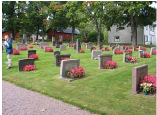
Översikt kvarter IV från sydväst (KI Pelarne kyrkog 061)