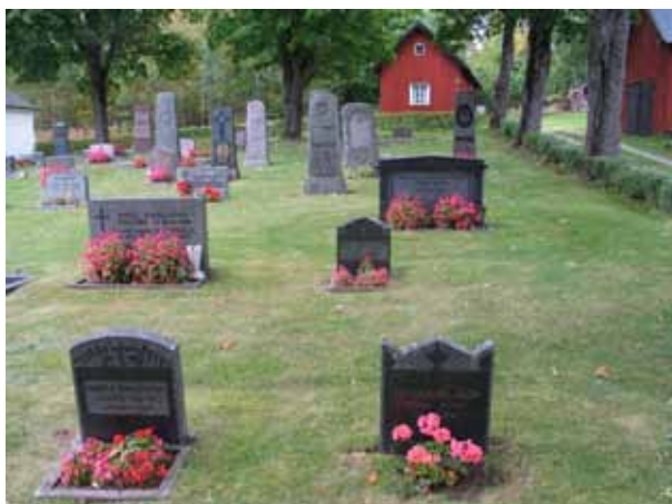
Gravvårdar kvarter IV (KI Pelarne kyrkog 066)

Flertalet gravvårdar i kvarter II och IV är rektangulära gravvårdar med klassicistiska drag, men här finns även ett antal små liggande stenar. Möjligen är stenarna i kvarter II något mindre än de i kvarter IV. Den äldsta gravvården i kvarteren är från 1894 och finns i kvarter IV. I kvarter II finns en liten dominans för gravvårdar från åren mellan 1974-1981 och i kvarter IV finns en liten majoritet för perioden 1950- och 60-talen. I övrigt är det en stor spridning fram till 1998. Här finns möjligen spår efter vad som kan ha varit ett linjegravssystem bevarat, synligt genom små enkla, ibland liggande stenar. Materialet är företrädesvis grå och svart granit men även röd granit förekommer. Den dödes titel är inte lika vanlig här som i kvarter I och III men bland de titlar som påträffas nämns hemmansägare (9), smeder (2), lantbrukare (2), smidesmästare, godsägare, kyrkvaktmästare, nämndeman, slöjdlärare och en fd soldat. Ortnamn förekommer på övervägande delen av gravvårdarna.