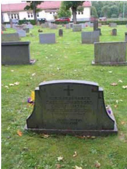
Återanvänd gravvård i kvarter I (KI Pelarne kyrkog 026)

I kvarter I har en av stenarna återanvänts och den tidigare texten fanns kvar på baksidan. Av allt att döma är det släktingar som återanvänt stenen.