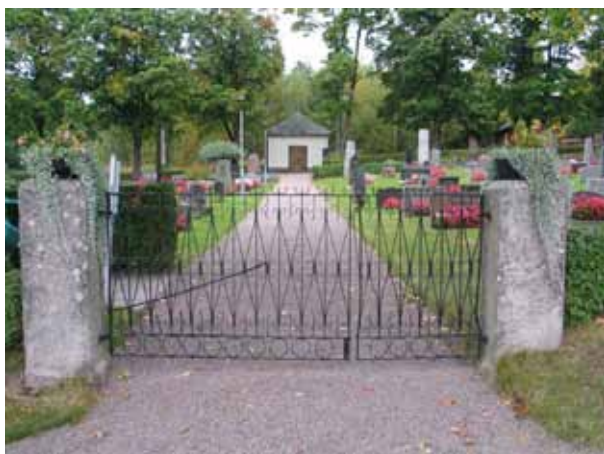
Ingången i söder. (KI Pelarne kyrkog 002)

På Pelarne kyrkogård finns av vårdar från olika epoker. Här finns de höga stående vårdarna från slutet av 1800-talet och tidigt 1900-tal och de låga rektangulära stenarna som dominerat från 1930-talet. Även moderna stenar finns. Ett mindre antal grusgravar och en del gravar med omgärdningar finns fortfarande kvar främst i den norra delen av kyrkogården.