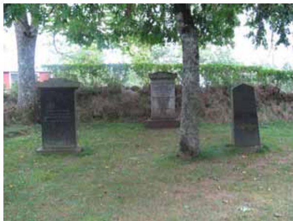
Gravvårdar på kyrkotomten från öster (KI Pelarne ka 134)