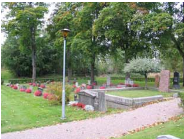
Översikt kvarter I från sydöst. (KI Pelarne kyrkog 019)