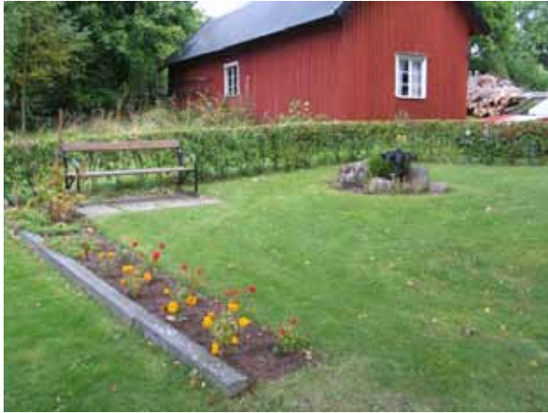
Minneslund. (KI Pelarne kyrkog 013)