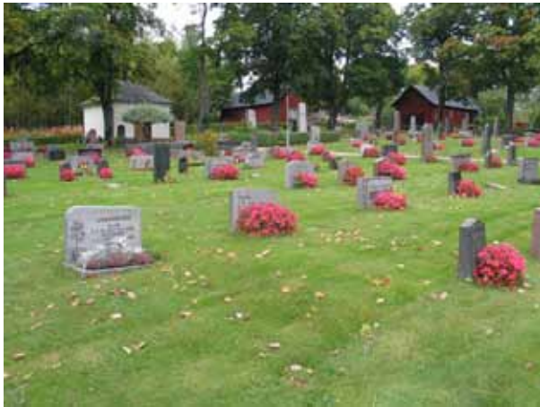
Översikt kvarter II från sydväst (KI Pelarne kyrkog 019)