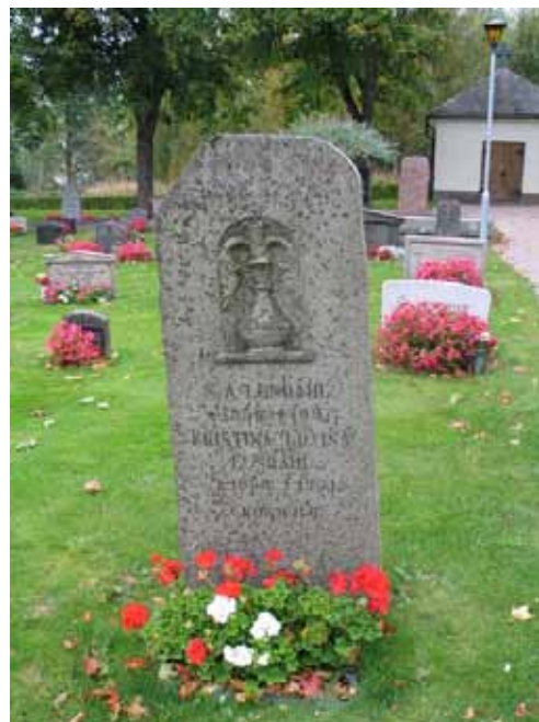
Gravvård kvarter I (KI Pelarne kyrkog 049)