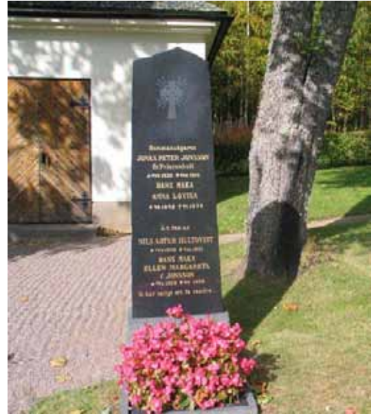
Gravvård kvarter IV KI Pelarne kyrkog 034)