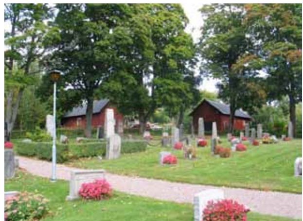
Översikt kvarter III från sydväst. (KI Pelarne kyrkog 033)