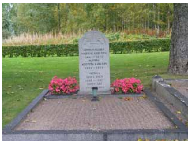
Grusgrav i kvarter I (KI Pelarne kyrkog 022)

Kvarter I och III är belägna på varsin sida om mittgången precis söder om kapellet. Kvarteren omgärdas i väster respektive öster av hagtornshäcken som omger kyrkogården. I söder skiljer endast gräs kvarteren från kvarter II respektive kvarter IV. Kvarter I avgränsas i norr av de lönnar som tidigare utgjorde kyrkogårdens norra gräns. Norr om kvarter III finns minneslundan. Kvarteren rymmer cirka 95 respektive 96 gravplatser. Mest iögonfallande är de stora stående vårdarna och gravplatser med omgärdningar vilka finns i norra delen av båda kvarteren. Samtliga gravvårdar i kvarter I och III är vända mot söder. Förutom ett fåtal grusgravar är området insått med gräs.