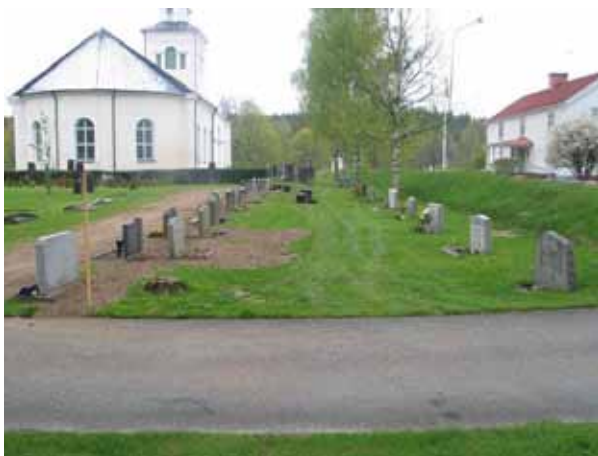
Kv 3 från öster. ( KI Rumskulla kyrkogård 032)

Kvarter 3 är beläget utmed den norra kyrkogårdsmuren, öster om kyrkan, medan kvarter 9 är beläget i det sydvästra hörnet av kyrkogården. I norr avgränsas kvarter 3 av kyrkogårdsmuren, i öster av en asfalterad gång, i söder av en insådd gång och i väster av kvarter 2. Kvarter 9 avgränsas i söder och väster av kyrkogårdsmuren och i norr och öster av insådda gångar. De båda kvartererna rymmer enligt gravkartan 56 respektive 123 gravplatser. I kvarter 3 är gravvårdarna vända mot norr eller söder eftersom två av raderna med gravvårdar är ryggställda. Den östra raden av gravvårdar i kvarter 9 är vända mot öster medan övriga är vända mot väster. Den äldsta gravvården står i kvarter 9 och är ifrån 1950. I kvarter 3 finns endast gravvårdar från 1950-, 60- och 70-talen medan det i kvarter 9 finns gravvårdar från 1950 fram till 2001. I östra delen av kvarter 9 är avståndet mellan gravvårdarna större vilket tyder på att dessa gravplatser tidigare varit omgärdade och då troligen också belagda med grus. Yrkestitlar är ovanliga. Endast en gravvård med titeln hemmansägare finns i varje kvarter. Däremot anges den dödes hemort på majoriteten av gravvårdarna.