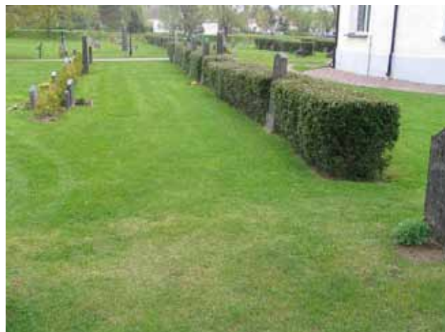
Kv 2 från norr. ( KI Rumskulla kyrkogård 030)