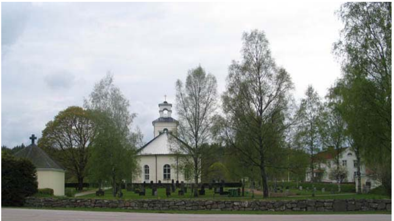
KI Rumskulla kyrkogård 008

Kulturhistorisk inventering av kyrkogårdar/ begravningsplatser i Linköpings stift 2005