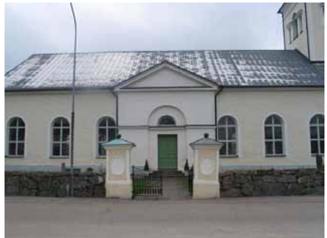
Ingång till kyrkogården i norr. ( KI Rumskulla kyrka 065)