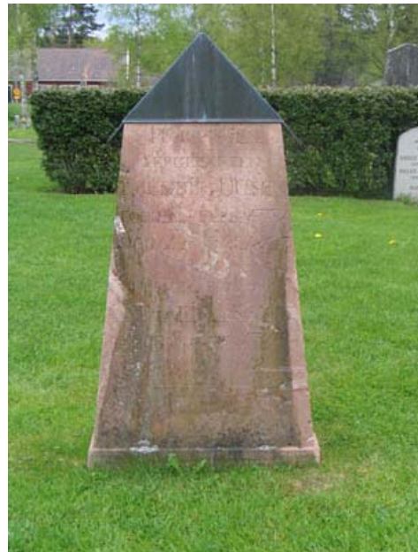
Kyrkogårdens äldsta gravvård placerad i östra delen av kv 1 från 1807 över sergeanten Fredrik Dusén. ( KI Rumskulla kyrkogård 022)