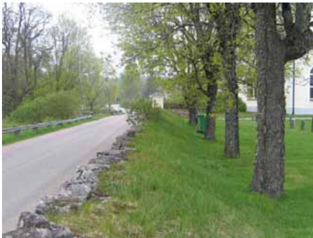
Stödmur och trädkrans av lönn i väster. (KI Rumskulla kyrkogård 012)

Kallmurad stödmur ca 1-1,5 m hög i ytterkanten omger hela kyrkogården med undantag för en mindre del av den östra kyrkogårdsgränsen. Från gravkapellet och söderut till sydöstra hörnet är en 2,5 m hög granhäck planterad.