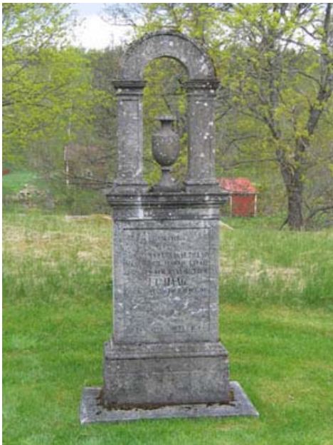
Minnesvården över kyrkoherde C J Haag i västra delen av kv 1. (KI Rumskulla kyrkogård 017)

Kvarter 1 är beläget norr om kyrka. Det omges i väster och norr av kyrkogårdens stödmur och i söder av kyrkobyggnaden. I öster gränsar området till kvarter 2. Kvarteret delas på mitten av en gång av plattor som leder till kyrkans norra ingång och vidare till sakristians ingång i sydost. Väster om gången är gravvårdarna vända mot öster medan de öster om gången kan vara vända mot söder, väster eller öster. Kvarter 1 är ett äldre köpegravsområde med 25 gravvårdar. Den äldsta gravvården är från 1807, men det är något osäkert om denna vård, tillsammans med en gravvård från 1848, står på sina ursprungliga platser. Kvarterets yngsta gravvård är från 1994. Ett flertal av gravvårdarna är från 1910-talet. Titlar är vanliga i området. Här finns fyra kyrkoherdar, två hemmansägare och två nämndemän samt köpman, säteriägare, kantor, häradshövding och sergeant. Den dödes hemort anges på knappt hälften av gravvårdarna.