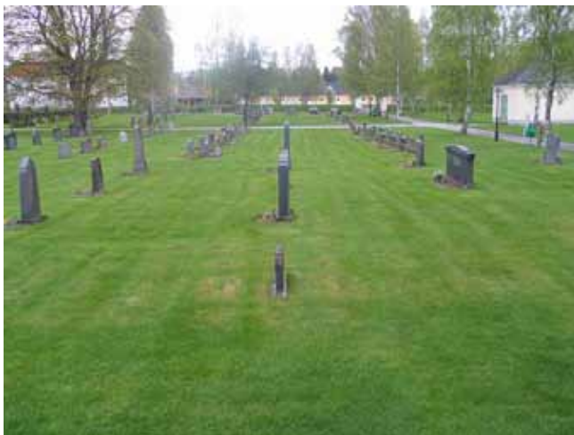
Kv 5 från söder och bortom det, norr om den asfalterade huvudgången, kv 4. (KI Rumskulla kyrkogård 035)