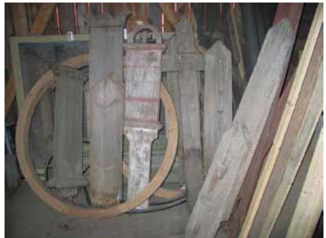
Trävårdar förvarade i kyrkstallarna. (KI Rumskulla kyrka 070)