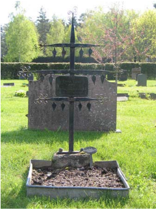
Smidesvård i kv 8. ( KI Rumskulla kyrkogård 053)

I kvarter 7, 8 och 10 finns flera spår av de äldre strukturer som utmärkte Rumskulla kyrkogård före den stora omläggningen 1969-70. Det äldre gångsystemet kan klart utläsas,