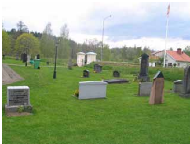
Kv 1 från väster. (KI Rumskulla kyrkogård 018)

Kvarter 1 rymmer flera av Rumskulla kyrkogårds äldsta gravvårdar. I dessa gravvårdar finns såväl hantverksmässiga som lokalhistoriska värden. Flera för bygden betydelsefulla personer har fått sina gravplatser här vilket är viktigt att beakta i det fortsatta brukandet av området. En intressant detalj är att flera kyrkoherdar fått sin gravplats i kvarteret. I mitten av 1800-talet ville man arbetar bort den norra kyrkogårdssidans dåliga rykt, som en plats för brottslingar och självmördare. I spetsen för denna förändring gick ofta prästerna. Kanske är det ett utslag av detta som man kan se på Rumskulla kyrkogård. De tre äldsta gravvårdarna från 1807, 1847 och 1867 bör i de fall gravrätten har upphört införas på församlingens inventarieförteckning och vårdas av församlingen.