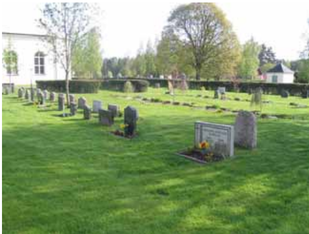
Kv 8 från sydväst och bortom det långsmala kv 7. (KI Rumsquilla kyrkogård 046)