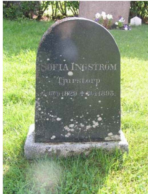
Trolig linjegravvård i norra delen av kvarter 8. En man med samma efternamn och hemort avliden 1906 är begravd en bit ifrån i samma kvarter (KI Rumskulla kyrkogård 056)

linjegravvårdarnas placering innanför köpegravar är tydlig liksom avståndet mellan köpegravvårdarna som vittnar om att omgärdningar plockats bort. Här kan man läsa socknens sociala historia i de olika gravvårdarnas utformning. Det sammanhängande linjegravsområdet i kvarter 8 visar på ett gravskick som var vanligt på våra kyrkogårdar under slutet av 1800-talet och fram till mitten av 1900-talet. I det fortsatta bruket av kyrkogården bör linjegravvårdar bevaras på sin ursprungliga plats som en viktig del av kyrkogårdens och socknens historia. Idag har kvarteren en utformning som är anpassad för att kunna skötas på ett rationellt sätt. Den smidesvård som står i kvarter 8 är ett exempel på en typ av gravvårdar som förekom under 1800-talet. Smidesvården har ett ålderdomligt formspråk men är troligen av senare datum. Den har dock ett hantverksmässigt värde.