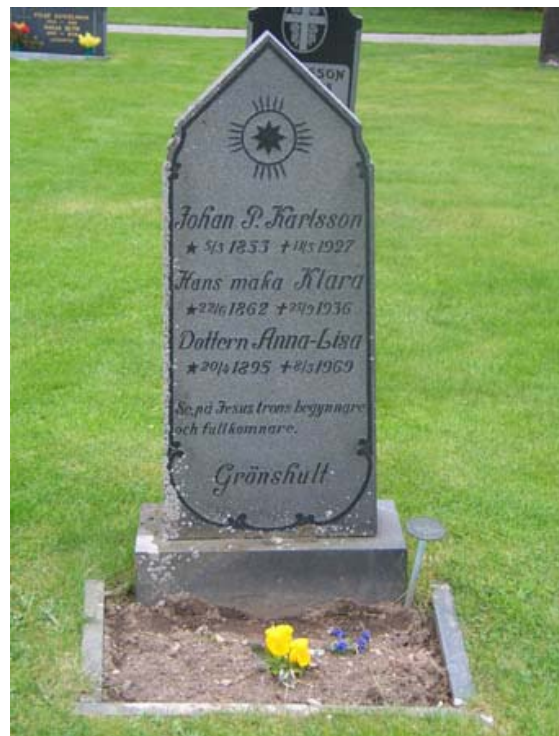
En av de höga, stående gravvårdarna i kv 5. (KI Rumskulla kyrkogård 038)