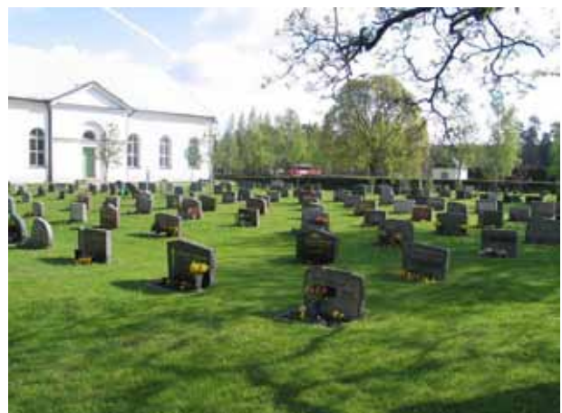
Kv 9 från sydväst. ( KI Rumskulla kyrkogård 050)