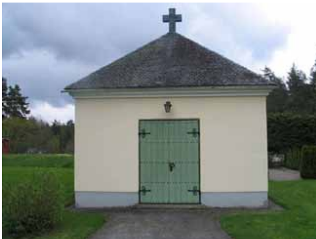
Gravkapellet från öster (KI Rumskulla kyrkogård 014)

Minneslundan utmärks av ett stenblock och ett svartmålat smideskors. Framför stenen och korset finns en mindre yta för plantering. En ställning för vaser i svart smide samt en bänk ingår också i anläggningen. Endast en gravsättning har i skrivande stund skett i minneslundan.