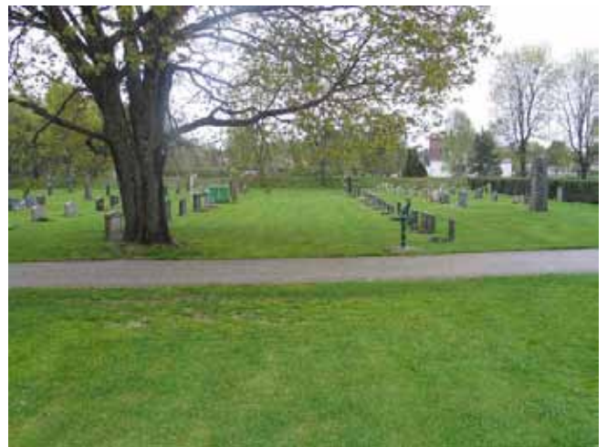
Kv 6 från norr med en av de insådda gångarna till höger om den stora lönnen. (KI Rumskulla kyrkogård 039)