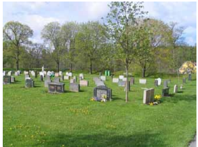
Kv 10 från nordost. (KI Rumsquilla kyrkogård 054)