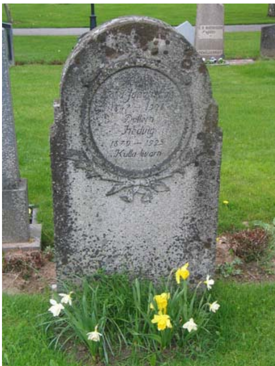
En typ av höga, tjocka gravvårdar av granit som det finns ett mindre antal av på Rumskulla kyrkogård, kv 4. (KI Rumskulla kyrkogård 034)

De tre kvarter rymmer idag gravvårdar från 1920-talet och in på 2000-talet. Det gör att kvarteren har en varierande samling av gravvårdar. I kvarter 4 och södra delen av kvarter 5 dominerar dock höga, stående gravvårdar. Flera av gravvårdarna från mitten av 1900-talet har klassiserande stildrag i form av uthuggna pelare eller tempellika gavlar. Flera vårdar har samma typer av stilelement polerade i stenen. Gravvårdarna är med få undantag stående. Materialet är företrädesvis grå granit men också svart och röd förekommer. I kvarter 6 har en av de höga, stående gravvårdarna återanvänts och fått en ny inskription på baksidan.