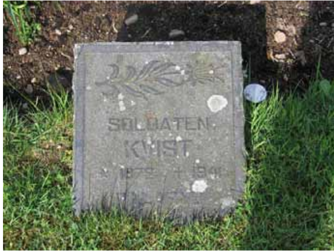
Soldaten Kvists gravvård på linjegravsområdet i kv 8 (KI Rumskulla kyrkogård 047)