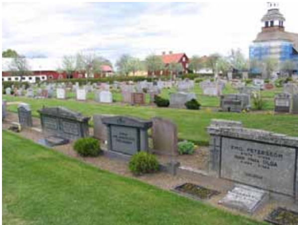
Kvarter D2 från sydväst. Gravvårdarna är placerade i ryggställda rader med öppen jord. (KI Södra Vi kyrkog 040)

Kvarter D2 är ett äldre kvarter mellan D1 och E som lades om senast under 1980-talet. De andra fem kvarteren ligger på rad, med G längst i väster och K i öster, utmed kyrkogårdens södra del. Kvarter D2 omfattar 255 gravplatser medan de övriga är relativt små med mellan 56 och 104 gravplatser. I kvarter D2 är gravvårdarna placerade i nord-sydliga, ryggställda rader. Längst i väster finns en rad med ett mindre antal gravplatser från mitten av 1900-talet. Dessa är rester av en äldre struktur som indikerar att kvarteret ursprungligen varit anlagt med köpta gravplatser i kvarterets ytterkanter och linjegravsområde i dess mitt. Kvarteren G-K ligger lägre än de äldre delarna av kyrkogården. I kvarter G är gravvårdarna placerade i ryggställda rader. Kvarteren H-K är alla ordnade på samma sätt. Längst i norr finns en rad med gravplatser vända mot norr. Söder om denna rad är en brant sluttning. I kvarter H har här planterats buskar och perenner men i övriga kvarter är sluttningen insådd med gräs. Nedanför slänten finns en rad med gravplatser vända mot söder samt två med varandra ryggställda rader. Kvarteren avgränsas mot varandra av grusgångar och trappor som förbinder området med den gamla kyrkogården. Undantaget är gången mellan kvarteren I och J som är belagd med asfalt. Här har trappan ersatts med en lång sluttning.