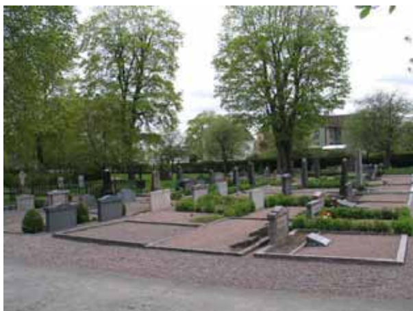
Kvarter B1 från norr. Gravvårdar från tidigt 1900-tal blandade med vårdar från århundradets mitt. ( KI Södra Vi kyrkog 018)