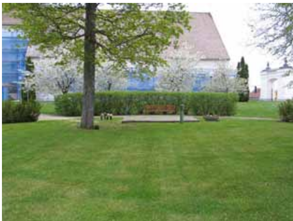
Minneslundan i parkområdet söder om kyrkan. (KI Södra Vi kyrkog 054)

Minneslundan ligger i den park som finns söder om kyrkan. Intill och runt omkring den cirkelformade platsen går en gång belagd med smågatsten. Platsen omgärdas av en häck. Den inre runda ytan där urnsättningen sker skuggas av två stora lönnar och häckar av buxbom. I området norra del finns en bänk, en stensatt damm med fontän samt plats för blomvaser och en urna för plantering av sommarblommor.