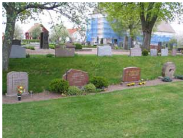
Exempel på gravvårdar i kvarter K. (KI Södra Vi kyrkog 052)