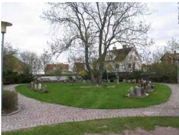
Kvarter för urngravplatser. (KI Södra Vi kyrkog 055)

Området som tillkom vid utvidgningen 1986 ligger i kyrkogårdens sydvästra hörn. Platsen omgärdas av en blandad häck med bl.a. häggmispel, spirea och idegran. Gravkvarteren har här en friare och mer varierande form än på de äldre delarna av kyrkogården. Det gör även gångsystemet oregelbundet. Gångarna är lagda med smågatsten. Hela platsen ger ett lummigt intryck med många olika träd t.ex. lärk, björk och ask, samt häckar av liguster och måbär. I öster är två kvarter U1 och U2 anlagda för urngravar. Av dessa är kvarter U1 i bruk. Kvarteret är äggformat. Gravplatserna är placerade i ryggställda rader runt hela kvarteret. I mitten växer en stor ask. Här finns också en stensatt damm med fontän. Utmed gången som omger kvarteret är bänkar utplacerade. Övriga kvarter inom området är anlagda för kistgravar men har ännu inte tagits i bruk.