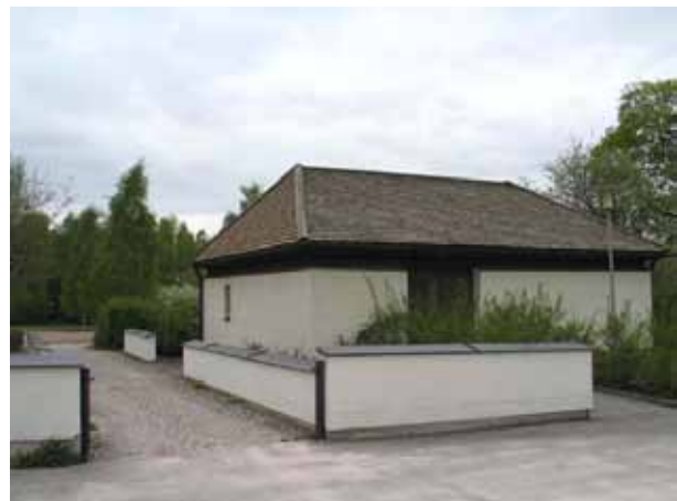
Nya bårhuset som byggdes 1970. (KI Södra Vi kyrkog 057)