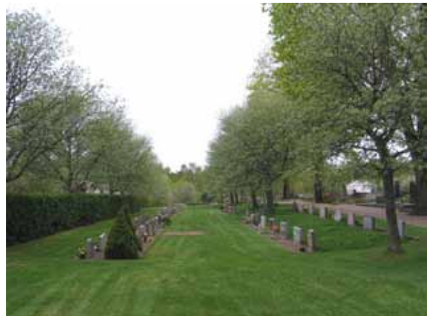
Utvidgningen från 1971 från öster. I förgrunden kvarter K. (KI Södra Vi kyrkog 053)