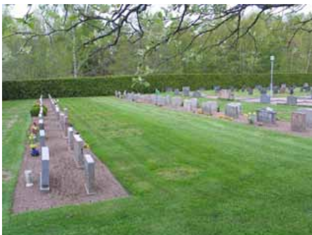
Kvarter G från sydost. (KI Södra Vi kyrkog 048)