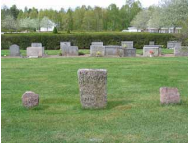
Kvarter A från öster. I förgrunden syns tre av de gravvårdar som står uppställda framför kyrkans västra ingång. Alla tre är av granit. (KI Södra Vi kyrkog 015)

Yrkestitlar är ovanliga i kvarter A. Här finns endast titeln professor emeritus. I kvarter C är det relativt gott om titlar med tanke på att majoriteten av vårdar är från mitten av 1900-talet och framåt. Vanligast är titlarna hemmansägare, ingenjör och skogvaktare. Här finns också mera ovanliga titlar som svensk-amerikanska, skogsarbetare och ringkarl. På majoriteten av gravvårdarna anges från vilken by eller gård den döde kommer.