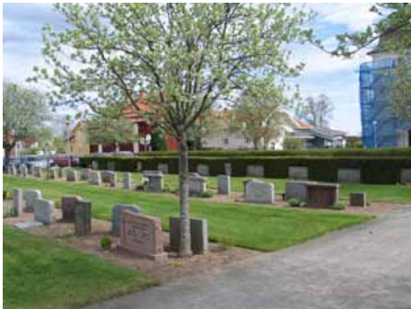
Kvarter A från sydväst. Gravvårdarna är placerade i ryggställda rader med eller utan häckar emellan. (KI Södra Vi kyrkog 016)

Båda kvarteren ligger i linje med varandra rakt väster om kyrkan. De avgränsas i söder av kyrkogårdens asfalterade huvudgång och i norr av det smidesstaket som omgärdar kyrkogården. I östra delen av kvarter A är ett mindre antal gravvårdar uppställda i gräsmattan. Här återfinns bl.a. en gravvård daterad 1728. Den och ytterligare en sten, som saknar datering, hittades när man grävde grunden till det nya vaktmästeriet. Här finns också en smidesvård. Kvarter C avgränsas i väster av en grusgång. En grusgång utgör också gräns mellan de båda kvarteren. Gravvårdarna är placerade i ryggställda rader och vända mot öster eller väster. Mellan flertalet av de ryggställda raderna är häckar av liguster eller tuja planterade. Häckarna är något högre än gravvårdarna och bidrar till att ge kvarteren en låg och avskärmad karaktär.