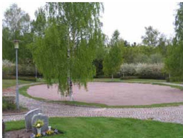
Del av det område som anlades 1986. (KI Södra Vi kyrkog 056)