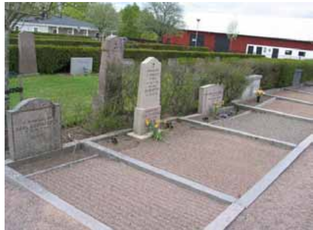
En del av de två rader med grusbelagda gravplatser som finns i kvarter C. (KI Södra Vi kyrkog 030)