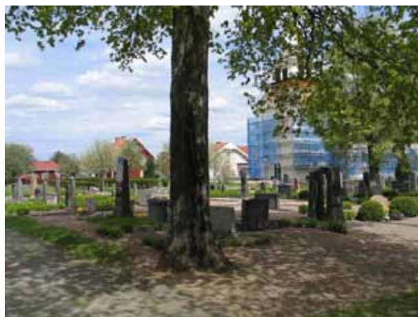
Kvarter B2 från sydväst. ( KI Södra Vi kyrkog 024)