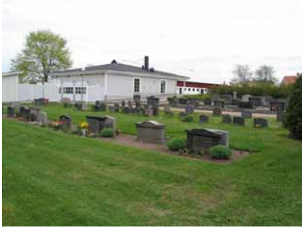
Kvarter E från sydväst. Längst fram i bilden köpta gravplatser som sätts in, ett mindre, sammanhängande linjegravsområde från 1950-talet och bortom det köpta gravplatser belagda med grus. (KI Södra Vi kyrkog 043)