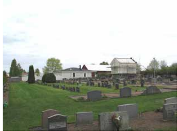
Kvarter F från sydväst. I bakgrunden syns det gamla gravkapellet under renovering och vaktmästeriet. (KI Södra Vi kyrkog 047)