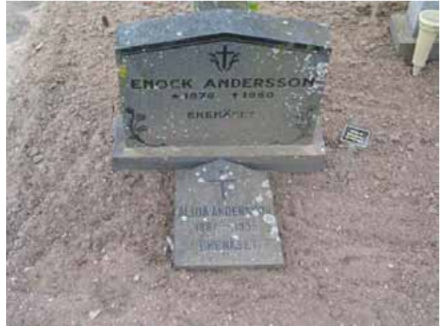
Linjegravvårdar i kvarter C. Den lilla liggande gravvården från 1936 har flyttats från ett äldre linjegravsområde. (KI Södra Vi kyrkog 028)