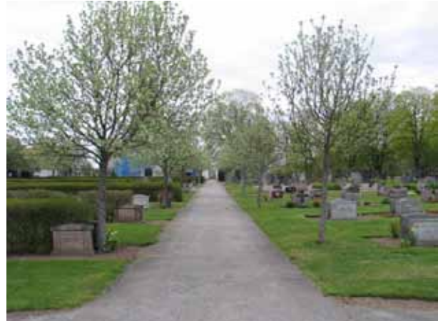
Asfalterad gång från gamla gravkapellet till portalen i öster. Utmed gången är oxlar planterade. Till vänster kvarter C och till höger kvarter D2. (KI Södra Vi kyrkog 060)