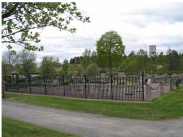
Nordströmska gravplatsen i kvarter D1 från nordost. Tidigare växte popplar i gravplatsens fyra hörn och framför de liggande vårdarna fanns kullar med murgröna. (KI Södra Vi kyrkog 032)