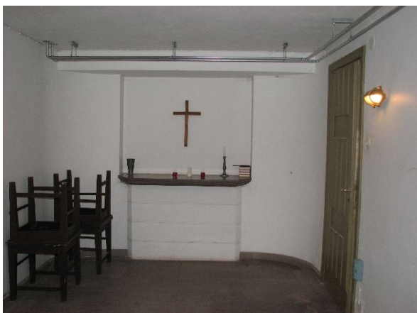
Kistmottagningsrummet i källaren.

Mellan vapenhuset och officiantrummet ligger ett trapphus med kalkstenstrappa till orgelläktaren respektive betongtrappa till källarvåningen. Källare finns under hela byggnaden och nås även via en tillfart från väster. I källaren finns lokaler för förråd, toalett, elcentral, personallokal, kistmottagningsrum, bisättningsrum för kistförvaring och hissrum. Rummen har betonggolv och vitputsade väggar. I kistmottagningsrummet är golvet däremot av kalksten och väggarna är vitkalkade. I fondväggen är en kalkskiva insatt som blombord/altare.