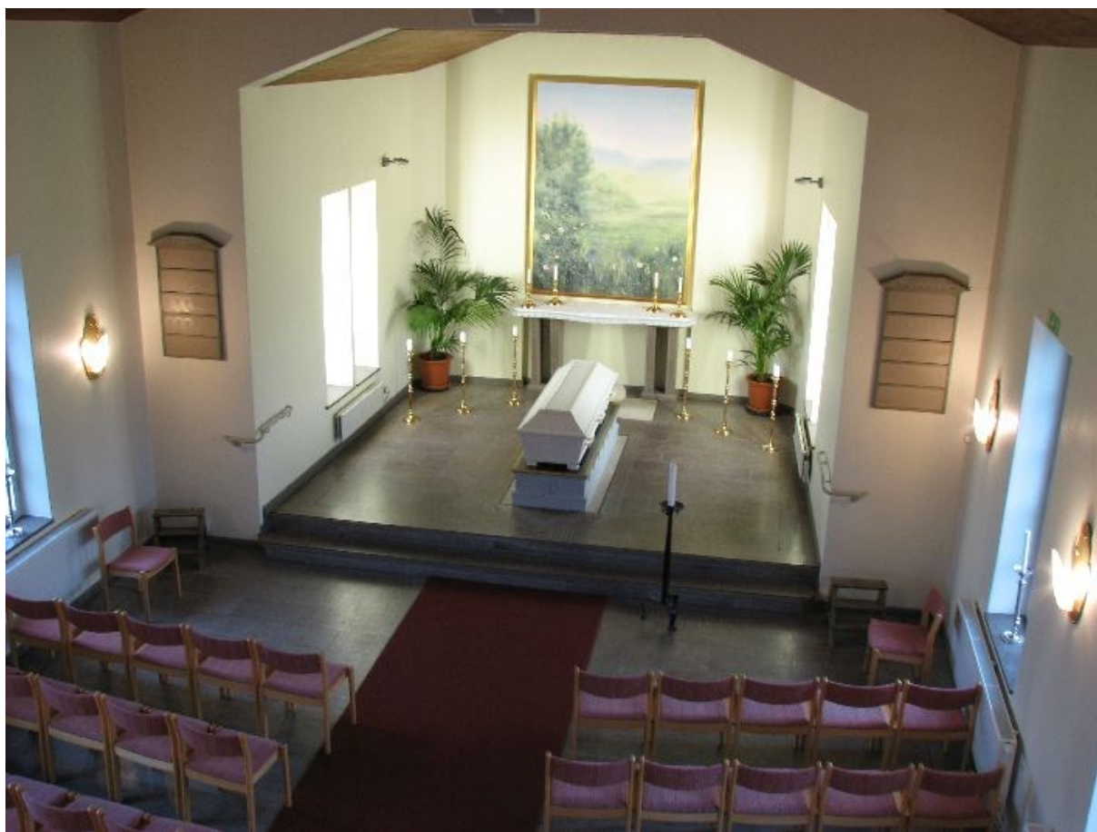
Ceremonisalen sedd från orgelläktaren.