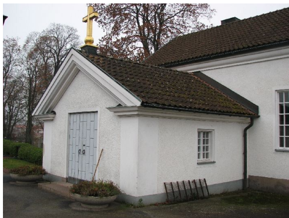
Vapenhuset utgörs av ett äldre bårhus som fanns på platsen och som integrerades med kapellet då det uppfördes 1954.