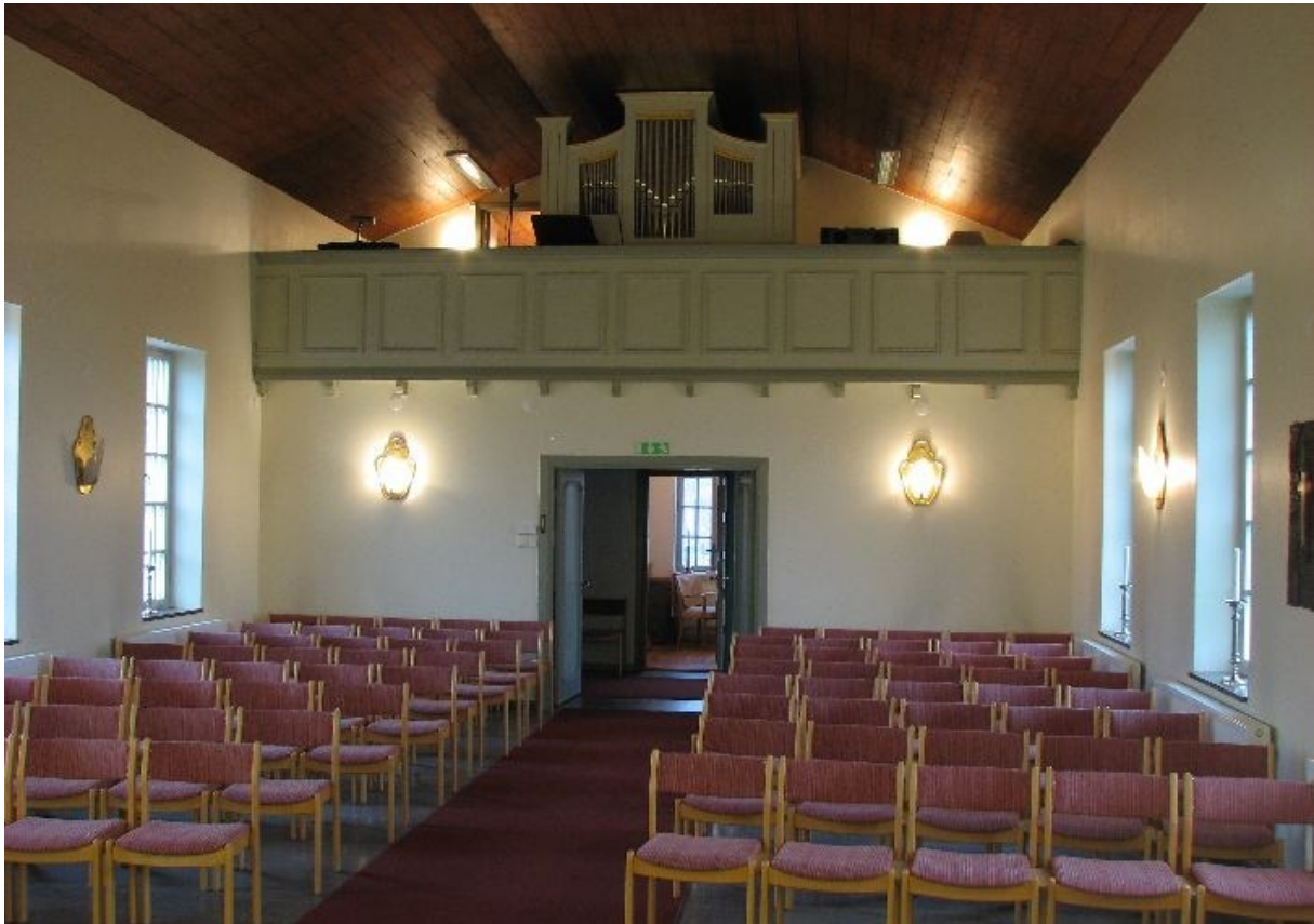
Salen från norr.