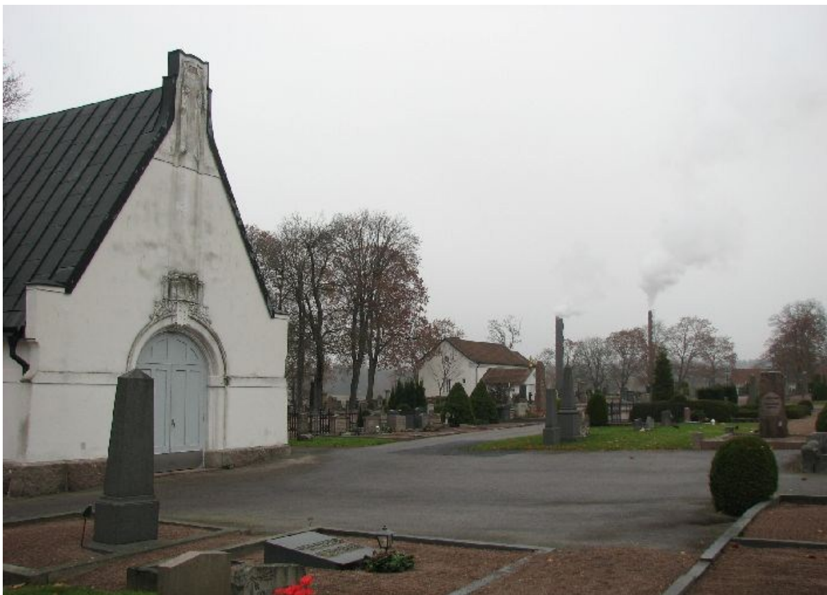
Vimmerby kyrkogård sedd från söder. I förgrunden ses det lilla gravkapellet och mitt i bilden S:t Johannes gravkapell.