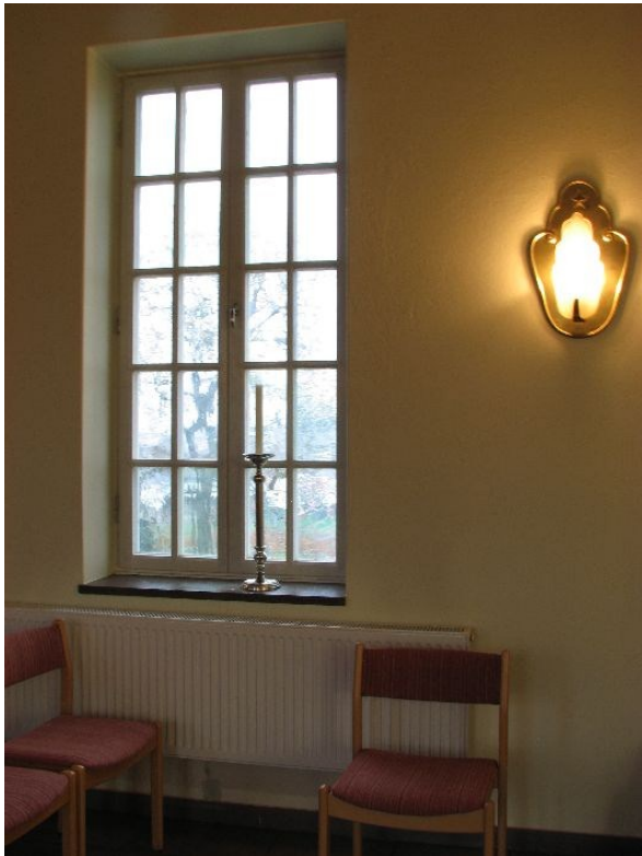
Detalj av väggparti mot väster med fönster och ljuslampett.