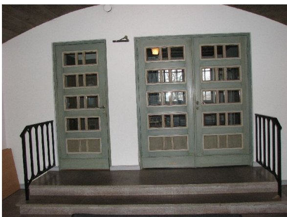
Vapenhuset. En kalkstenstrappa leder in till trapphuset (vänstra dörren) respektive kapprummet (pardörren).

Vapenhuset utgörs av ett rum med vitkalkade väggar, golv täckt av kalkstensplattor och ett mörkt fernissat träpaneltak. En kalkstenstrappa i två steg med enkelt smidesräcke leder upp till två glasade dörrar, vilka leder in till ett kapprum respektive officiantrum. Kapprummet har kalkstensgolv, vitputsade väggar och ett grönbetsat kassetak av plywood med ursprunglig pendalarmatur. Officiantlokalen har ett ekparkettgolv, vitputsade väggar och fernissat kassetak. Rummet är möblerat med ett klädskap och ett skrivbord. Från kapprummet nås även en toalett med plastmattor på golv och väggar samt ett fernissat kassetak. Samtliga innerdörrar i markplanet är försedda med rutdekor genom listverk och är ljus grönlaserade.