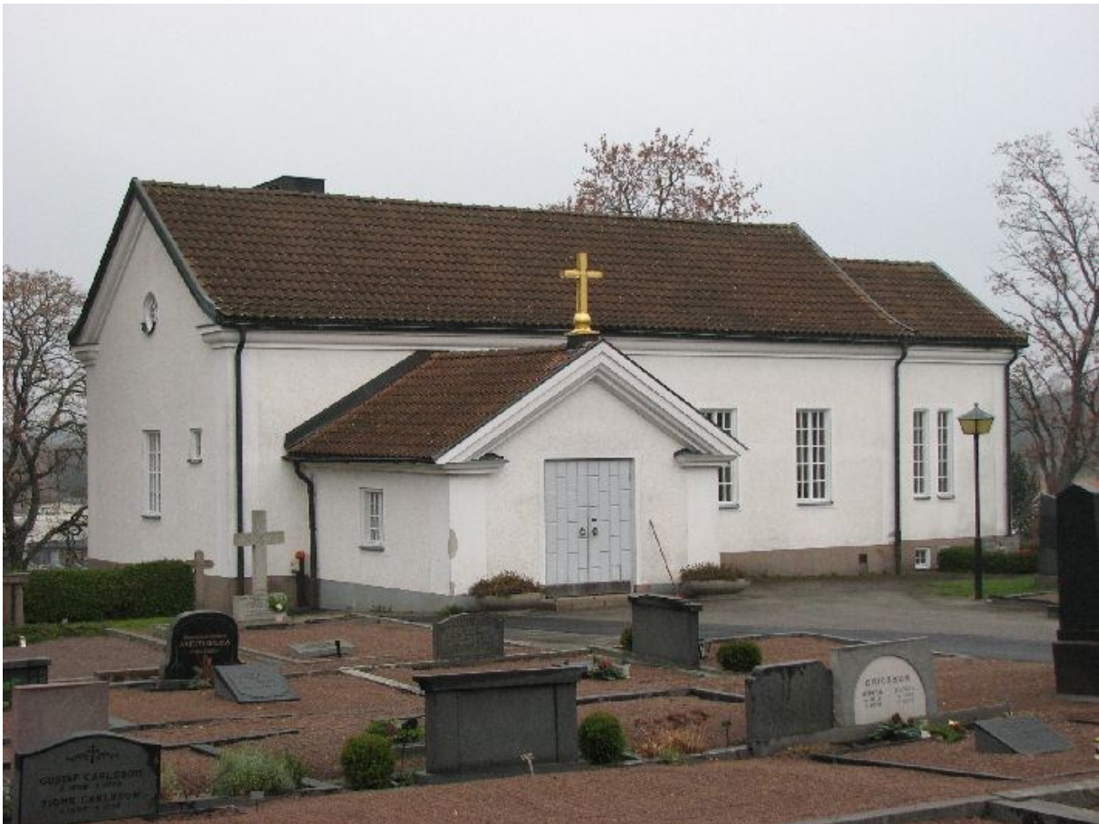
Kapellet sett från sydost.

Vapenhuset, d.v.s. det f.d. bårhuset, har en stomme av trä med spritputsade väggar, gråmålad putsad grund och betongpannor på taket. Vapenhusets tak kröns av ett förgyllt kors med kula. Entréportarna till vapenhuset respektive till källarvåningen är av trä med panel i rutmönster, gråmålade och med fotplåt av koppar. Yttertrappor är av granit.