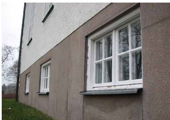
Kapellets sockel är klädd med granit.