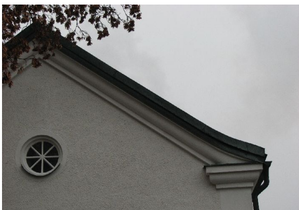
Detalj av kapellets lätt svängda takfall.