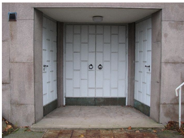
Källarvåningens entré. Den vänstra dörren leder in till ett förråd, den mittersta till ett bisättningsrum och den högra till en personallokal.