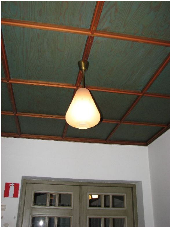
Detalj av kapprummets betsade kassettkav av plywood. Liknande kassettkav förekommer även i officiantrummet och toaletten.