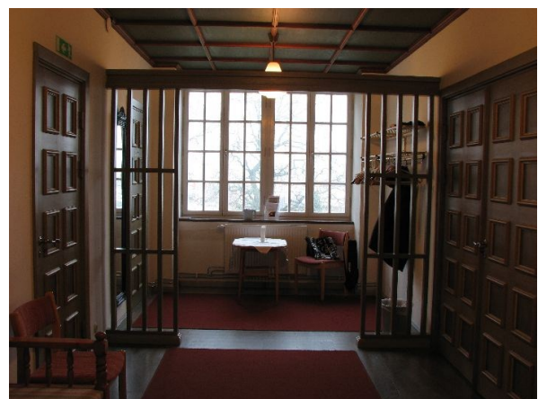
Kapprummet med (från vänster) dörrar till officiantrummet, toaletten och kyrkosalen.