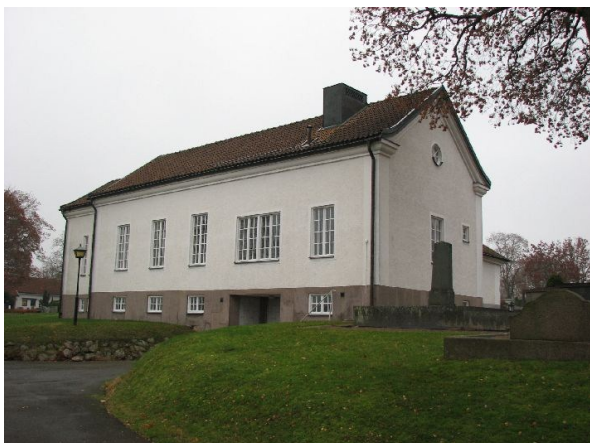
Kapellet från sydväst. Vid den västra fasaden finns en infart till källarvåningen.