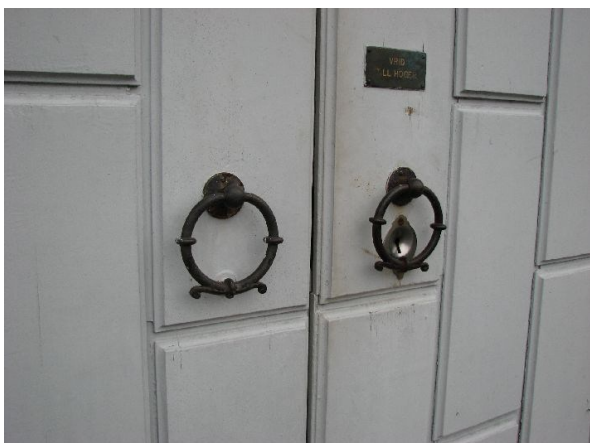
Detaljbild av huvudentréns kläpp.