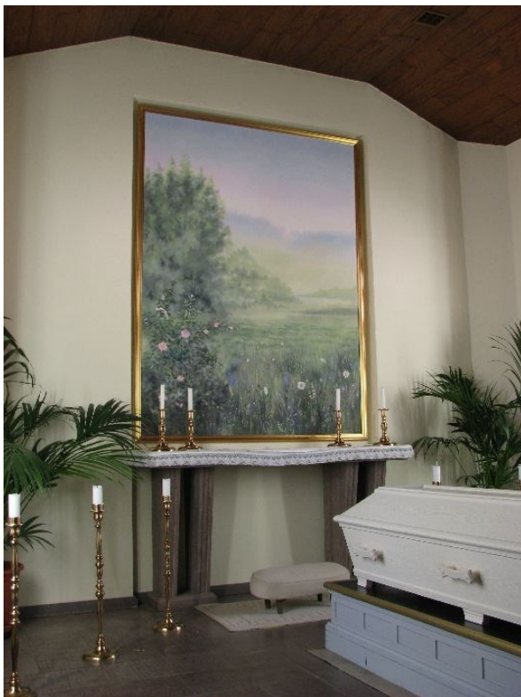
Altaret med altartavlan. Lagg märke till korets kantiga form.