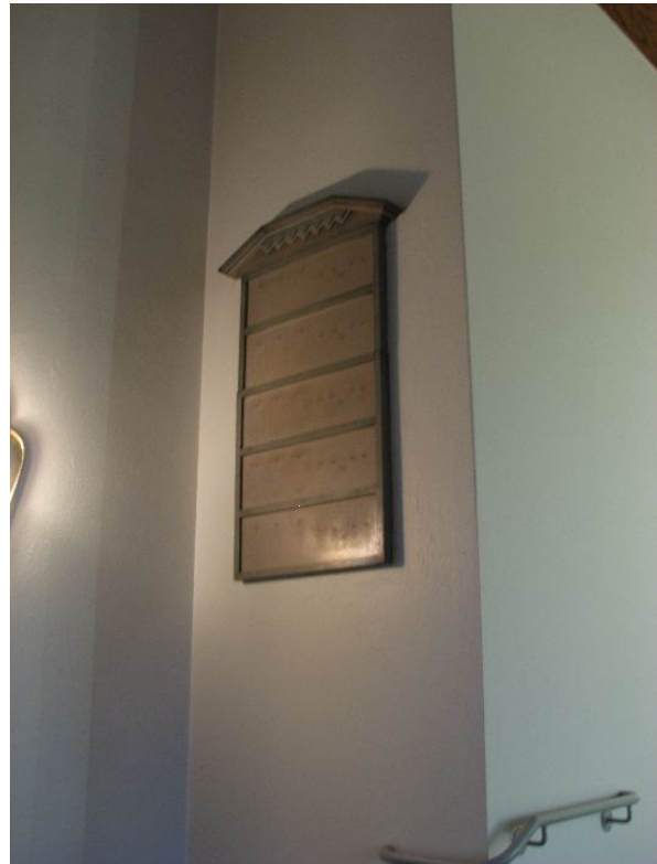
En av de två nummertavlorna.

Vapenhuset utgörs av ett rum med vitkalkade väggar, golv täckt av kalkstensplattor och ett mörkt fernissat träpaneltak. En kalkstenstrappa i två steg med enkelt smidesräcke leder upp till två glasade dörrar, vilka leder in till ett kapprum respektive officiantrum. Kapprummet har kalkstensgolv, vitputsade väggar och ett grönbetsat kassetak av plywood med ursprunglig pendalarmatur. Officiantlokalen har ett ekparkettgolv, vitputsade väggar och fernissat kassetak. Rummet är möblerat med ett klädskap och ett skrivbord. Från kapprummet nås även en toalett med plastmattor på golv och väggar samt ett fernissat kassetak. Samtliga innerdörrar i markplanet är försedda med rutdekor genom listverk och är ljus grönlaserade.