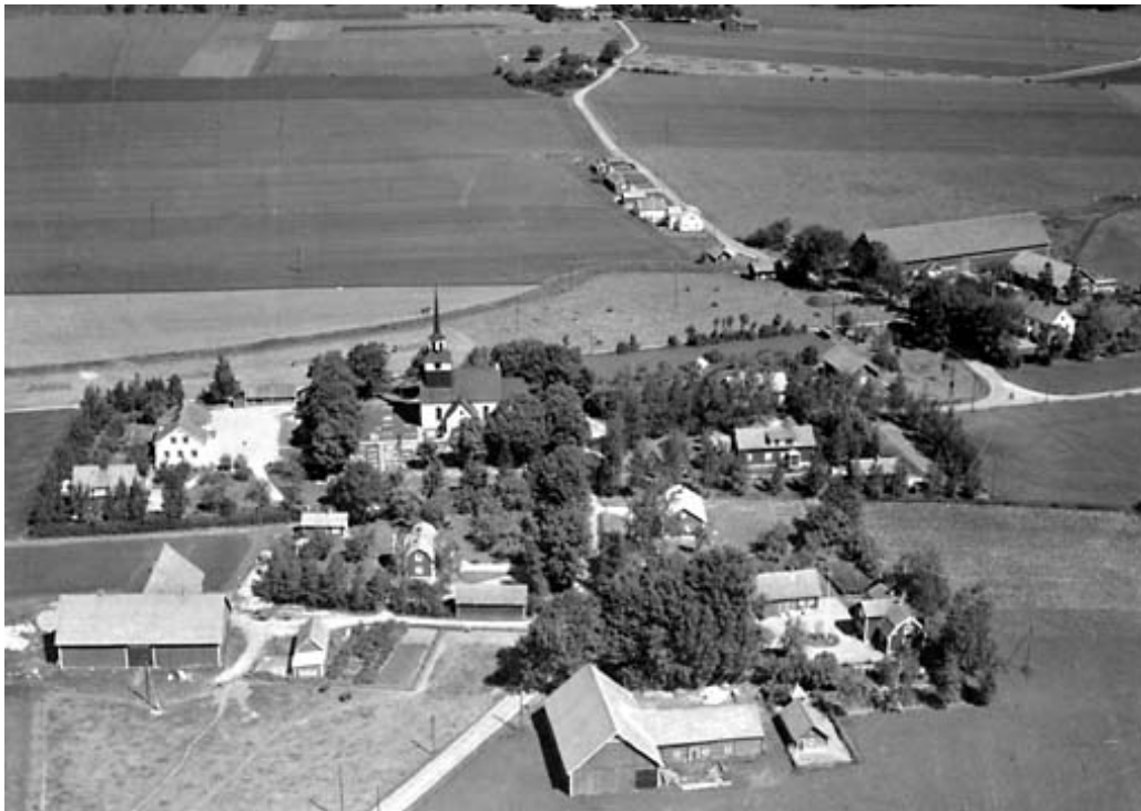
Flygfoto över Järstads kyrkby tagen 1954. Det mesta av kyrkogården döljs av den högt uppväxta trädkransen. En bit av kyrkogården väster om kyrkan syns dock. Här framgår att gravarna ligger radvis på gräsmatta.

Utanför kyrkan vid södra långväggen finns en runsten. Inskriften lyder enligt Brate: "Orökja reste denna sten efter system Amma".