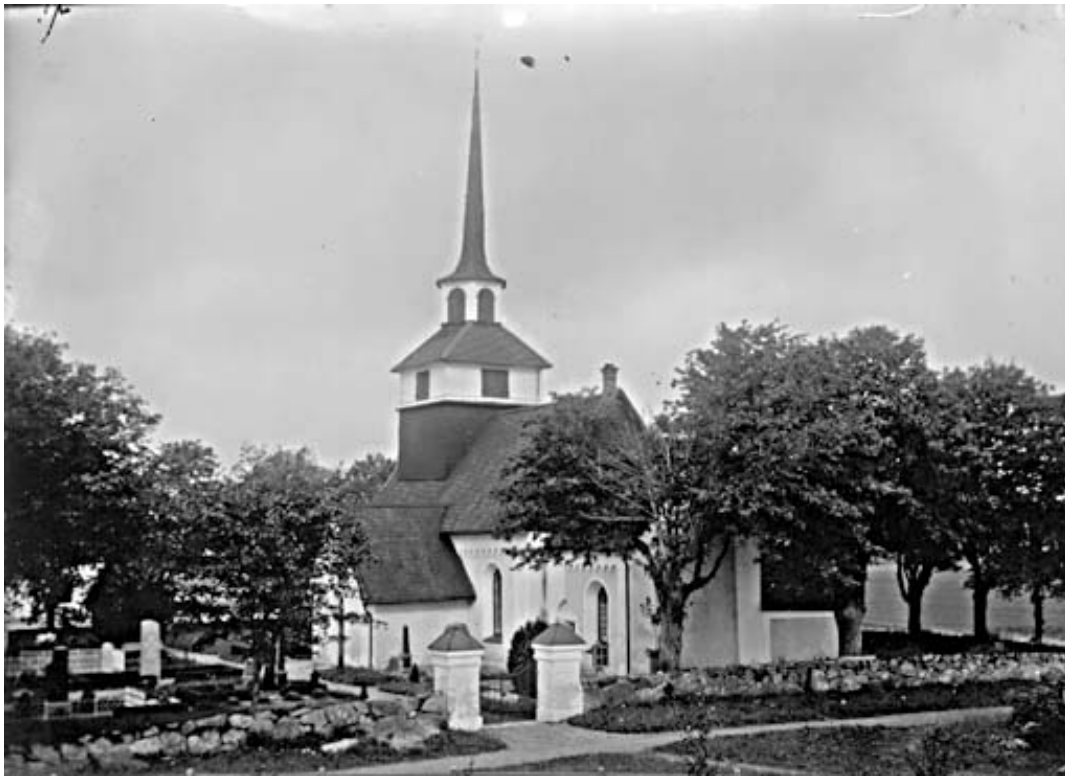
Järstads kyrka och kyrkogård 1931. Bilden visar en kyrkogård med uppväxt trädkrans invid östra muren. Denna är ersatt av relativt låga tallar idag. Längst till vänster syns en del av de höga gravvårdarna i häck/gruskvarteret söder om kyrkan.

En serie foton från 1932 visar samma del av kyrkogården. Här syns en förändring jämfört med idag på det sättet att grusgravarna 1932 gick ända ut till kyrkogårdsmuren på södra sidan av kyrkogården, samt att den kringgående grusgången saknas på den nordöstra delen av kyrkogården invid koret.