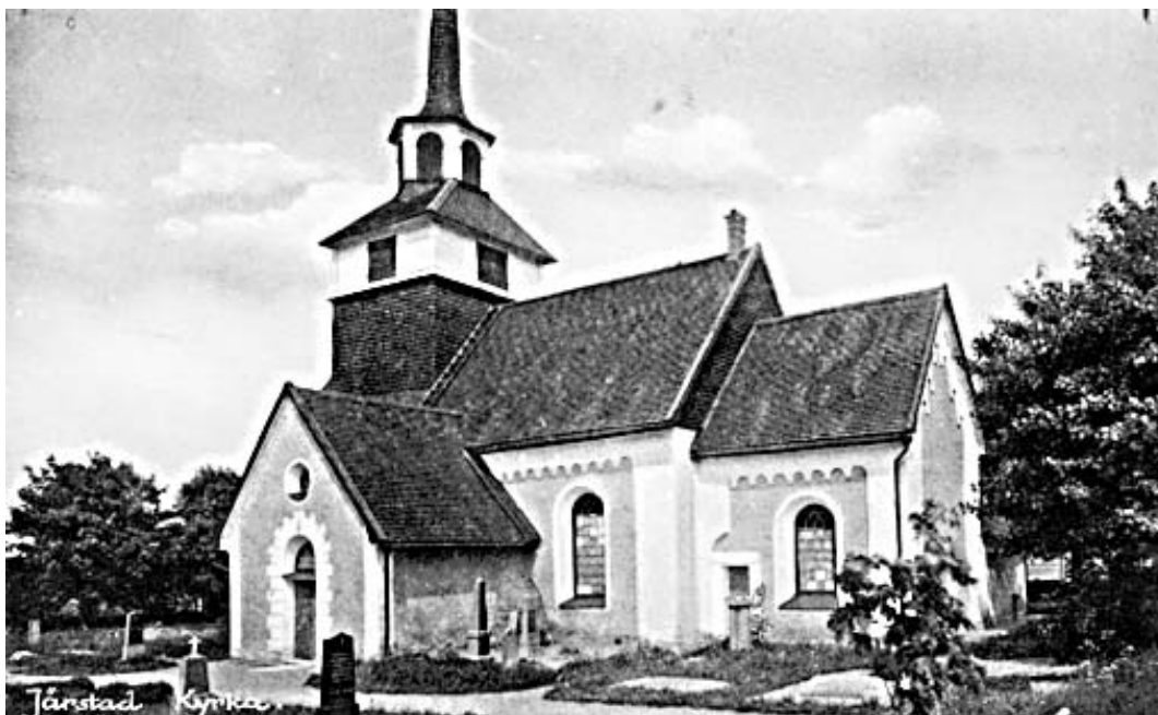
Järstads kyrka från ett gammalt vykort, ca 1930? Av bilden framgår att gravkvarteren framför kyrkan är desamma som idag.

Det kan antagas att kyrkogården vuxit fram kring kyrkan under medeltiden. Få rester efter denna kyrkogård finns bevarade. I samband med restaureringen av kyrkan på 1930-talet gjordes dock ett par intressanta observationer. En ej underskriven arkivhandling daterad 2/11 1934 låter meddela att man påträffat fem skelett under golvet till sakristian. Samtliga skelett var skadade och relativt omkringrörda. Författaren menar ändå att det kan konstateras att de döda begravts på kyrkogården innan sakristian uppförts, vilket skulle innebära att de är äldre än 1400-tal. Skeletten återbegravdes och är därför inte längre tillgängliga för forskning. Samtidigt gjordes en observation av den ursprungliga västmuren under kyrkans västligaste valvbåge. Författaren konstaterade därvid att några spår efter en västingång helt saknades.