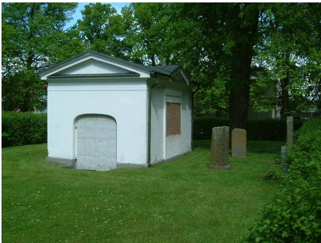
Familjen Ehrenkronas gravkor

Öster om kyrkan ligger familjen Ehrenkronas gravkor uppfört i början av 1800-talet. Sannolikt i samband med begravningen av Erik Ehrenkrona 1803. Gravkoret innehåller ytterligare sex gravkistor daterade från 1804-1855.