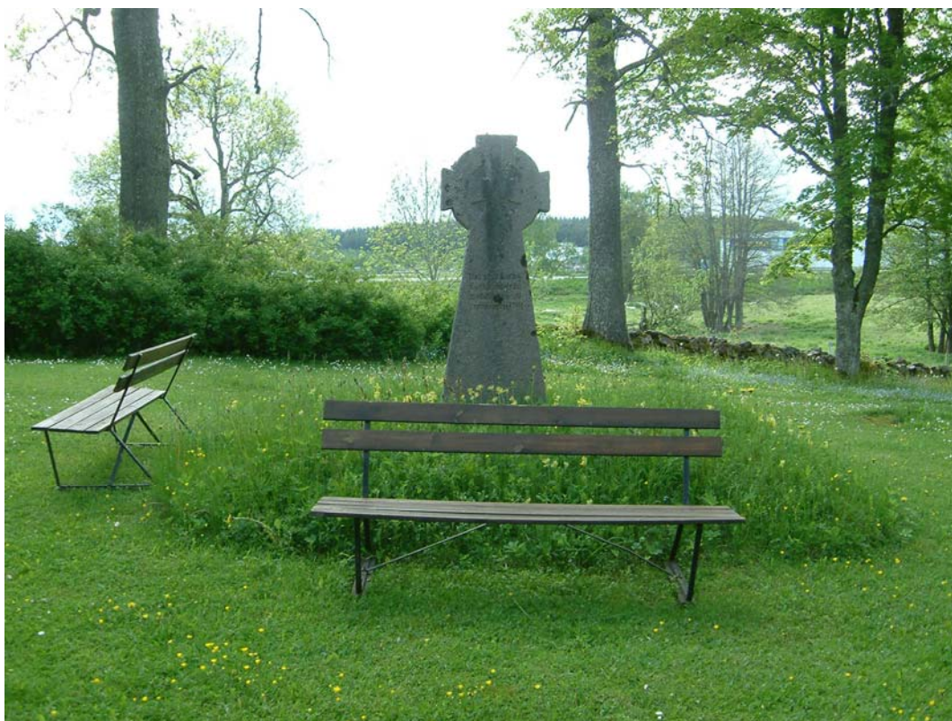
Platsen för Sörby kyrka markeras av fyra hörnstenar samt en minnessten från 1954. Texten lyder "Här stod Sörby kyrka från medeltiden fram till 1791".

Kyrkan saknade altartavla. Över altaret fanns istället ett gavelfönster och kring detta fanns bildhuggerier, ett krucifix och bilder av evangelisterna.