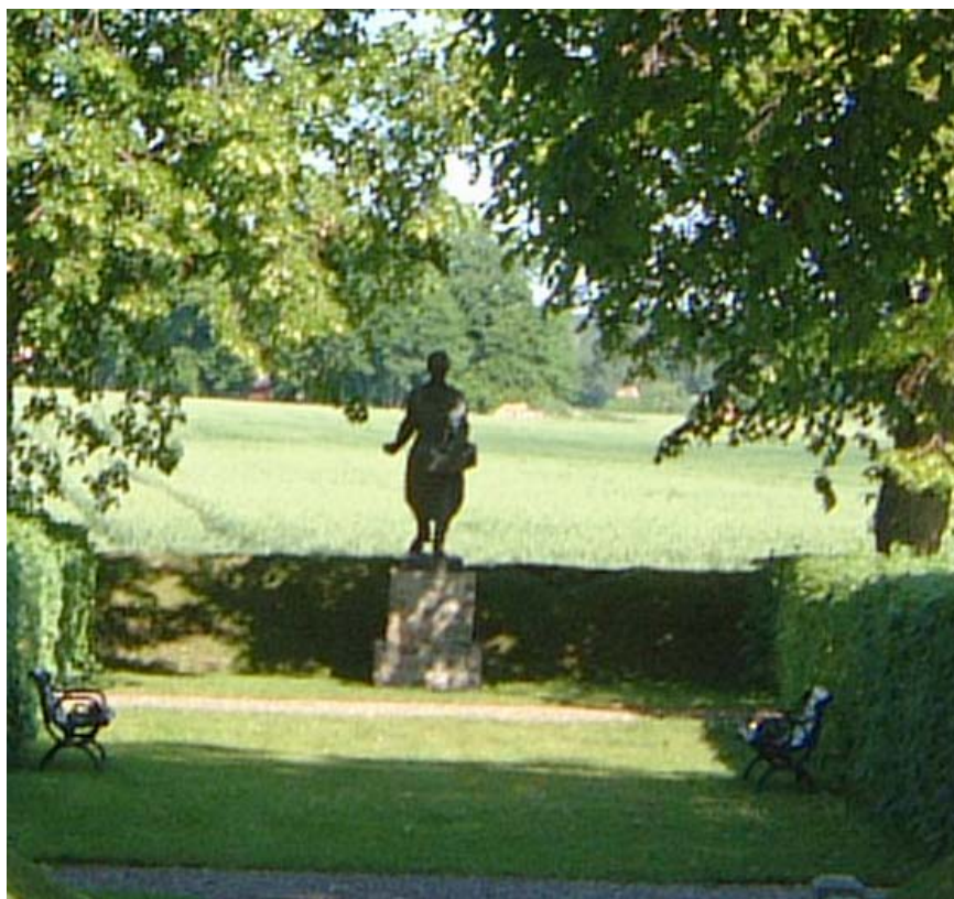
Såningsmannen med löv och häckinramning.