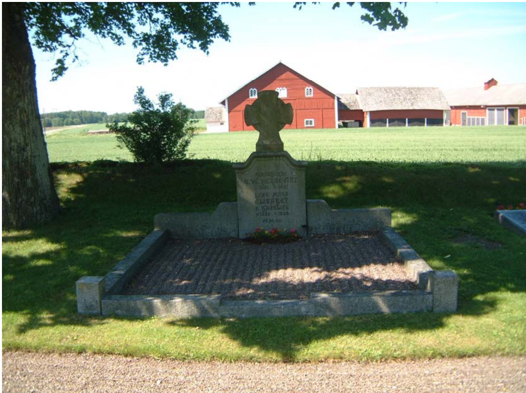
Kyrkoherde Lindmarks grav i SÖ kvarteret. Lindmark var den kyrkoherde som ansvarade för bygget av den nya kyrkan 1830–33. (Grav 292).

Från det tidiga 1800-talet och perioden strax efter den nya kyrkans uppförande finns en grav kvar. Det är gravvården över den vid kyrkbygget tjänstgörande kyrkoherden Lindmark. Den ingår i en serie med inte mindre än 6 kyrkoherdar, döda under 1800-talet och begravda på rad vid västra kyrkogårdsmuren.