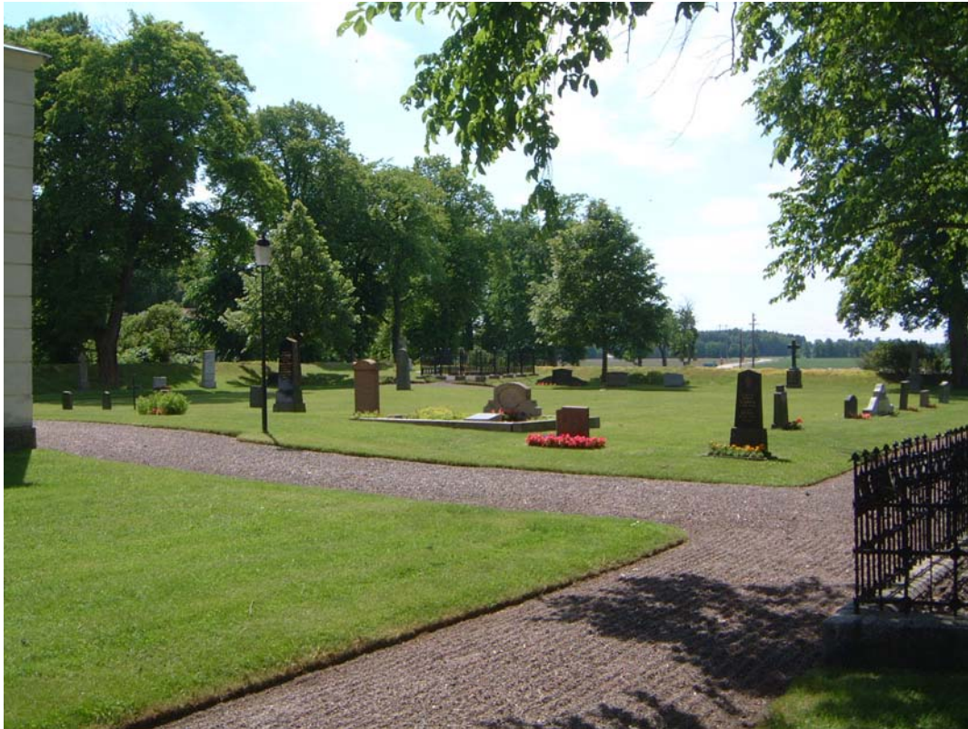
Den öppna gräsmattan mitt i SV-kvarteret innehåller flera äldre gravvårdar.