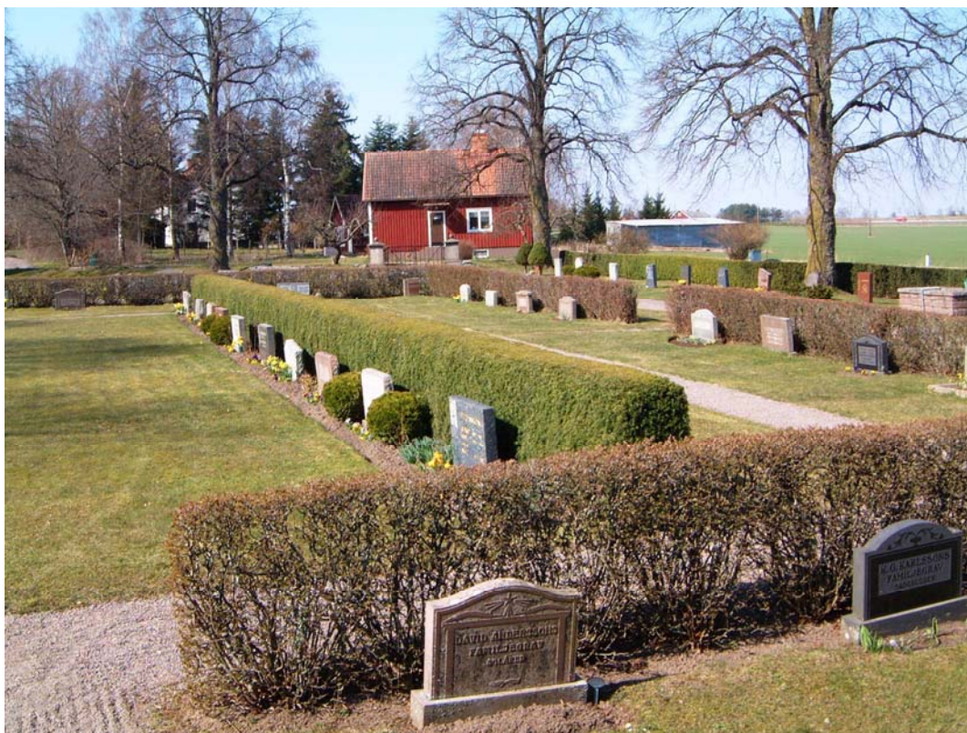
Kvarter E från sydöst.

Kvarteret är splittrat eftersom gravarna vid häcken i norr känns som ett eget kvarter. Kvarterets södra del är mer samhörigt med delar av kvarter D. Strikt karaktär.