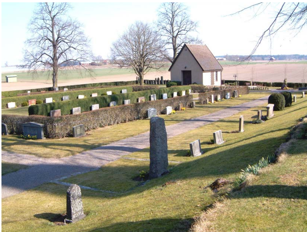
Kvarter D från sydväst.

Kvarteret är splittrat eftersom gravarna vid muren i söder känns som ett eget kvarter. Kvarterets norra del är mer samhörigt med kvarter E. Strikt karaktär.