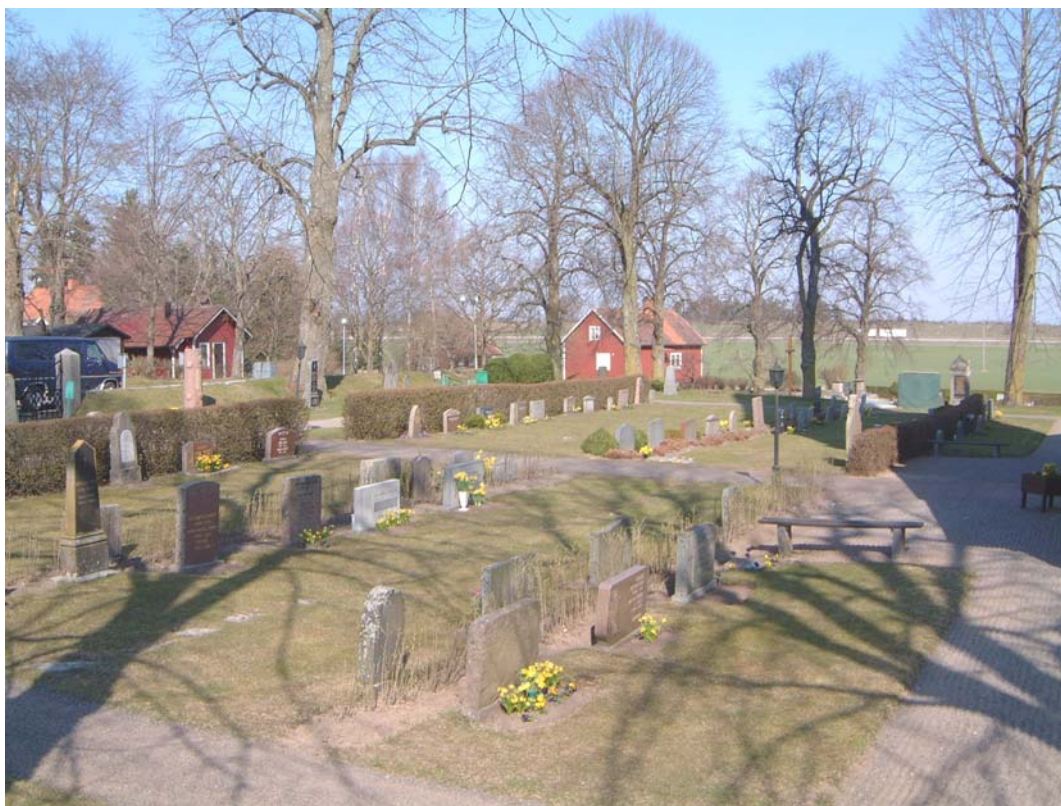
Kvarter A från sydöst.

Kvarteret upplevs inte som ett avgränsat kvarter, eftersom det saknar direkt avgränsning mot kvarter C i norr. I kvarteret finns en del äldre gravvårdar, men i övrigt har det en rätt enhetlig mer sentida karaktär.