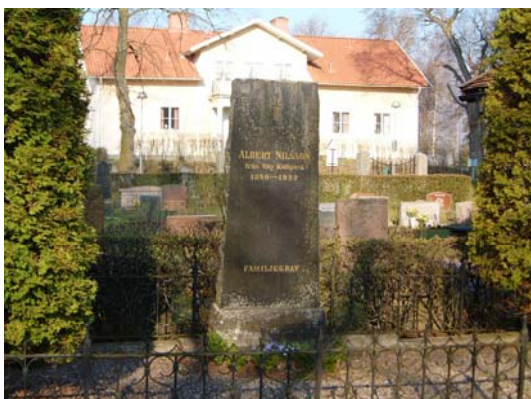
Familjegrav med gjutjärnsstaket.

Här finns en större familjegrav omgiven av ett järnsmidesstaket, en större grav med stenram, en liggande häll samt ett kors i koppar från tidigt 1900-tal. Gravläggningar från 1860-tal – 2001.