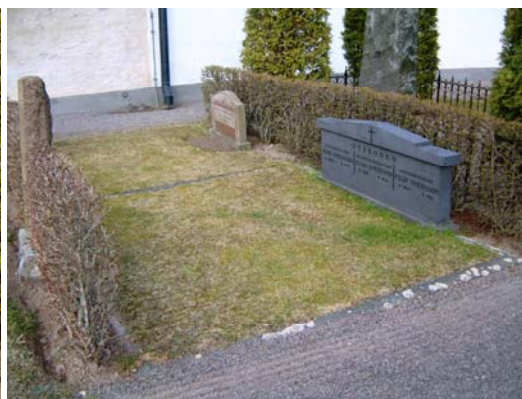
Gravvård över de tre syskonen Svensson.