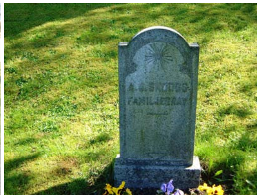
Knekten Skoogs familjegrav.