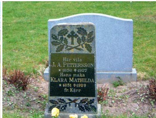
Gravvård i svart granit från 1920-talet.