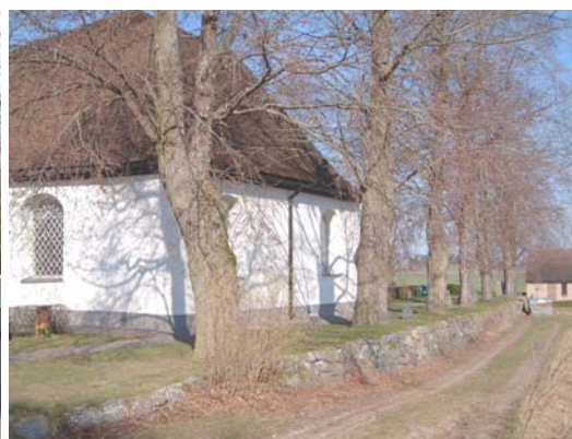
Trädkrans i öster med almar.