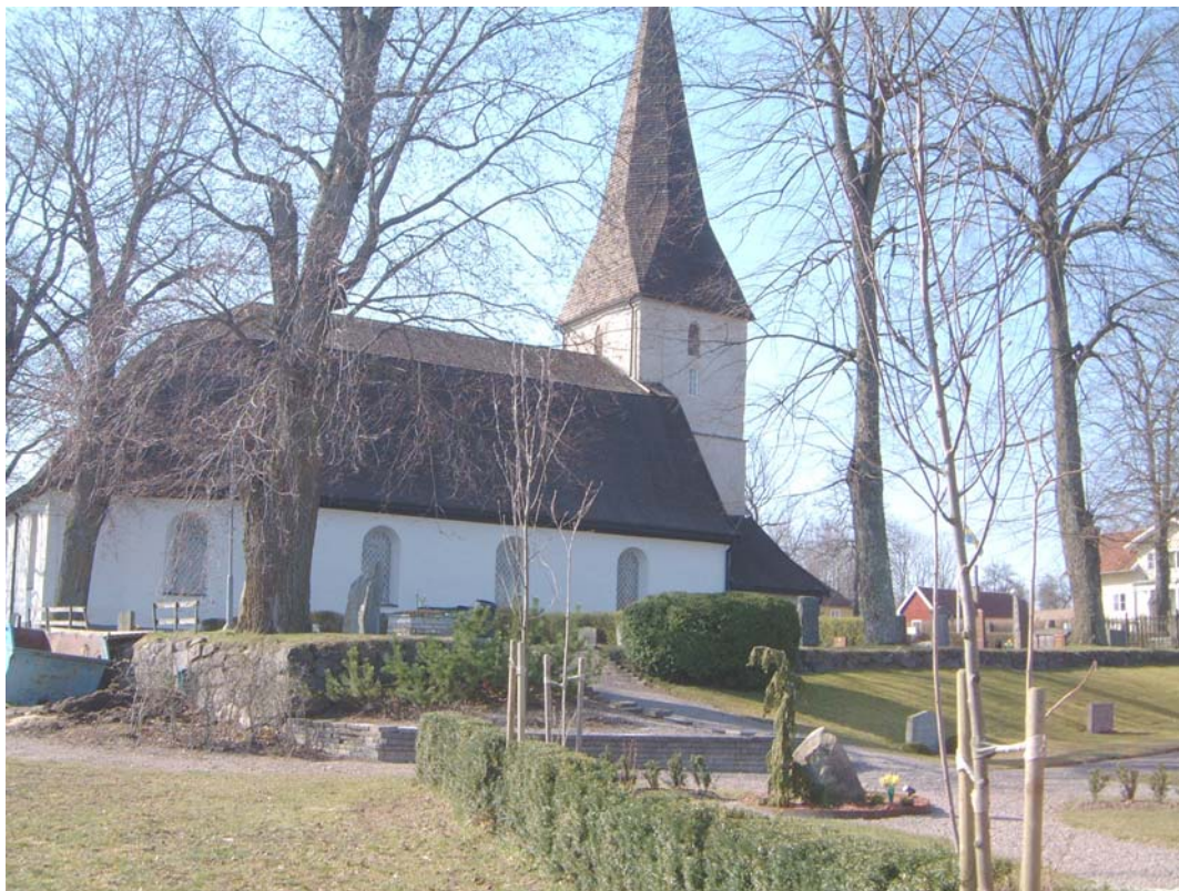
Nya kyrkogården, kvarter D, E och F, och kyrkan från nordöst.