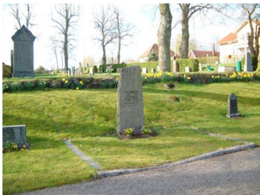
Stenramsgrav, tidigare med grus.

Två gravvårdar med stenram och grästäckt yta. Gravvårdarna rent allmänt är mestadels låga och breda. Gravläggningar från 1930-tal – 2001, i huvudsak 1970-tal.