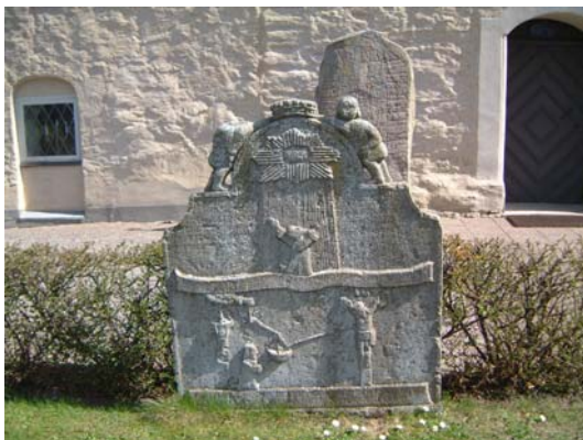
Gravvård i kalksten från 1752

Det finns två stycken stenar från 1740- respektive 1750-talen med figurscener i relief samt ett avbrutet livsträd och några gravvårdar från 1800-talet i kolmårdsmarmor och kalksten. Två gravar är omgivna av stenram. Gravvårdarna i övrigt är huvudsakligen låga och breda i röd eller grå granit. Eventuellt står de mest ålderdomliga stenarna på ursprunglig plats, i övrigt är det gravläggningar från 1830-tal - 2001, i huvudsak 1960-90-tal. De äldre vårdarna finns i huvudsak i kvarterets yttre kant.