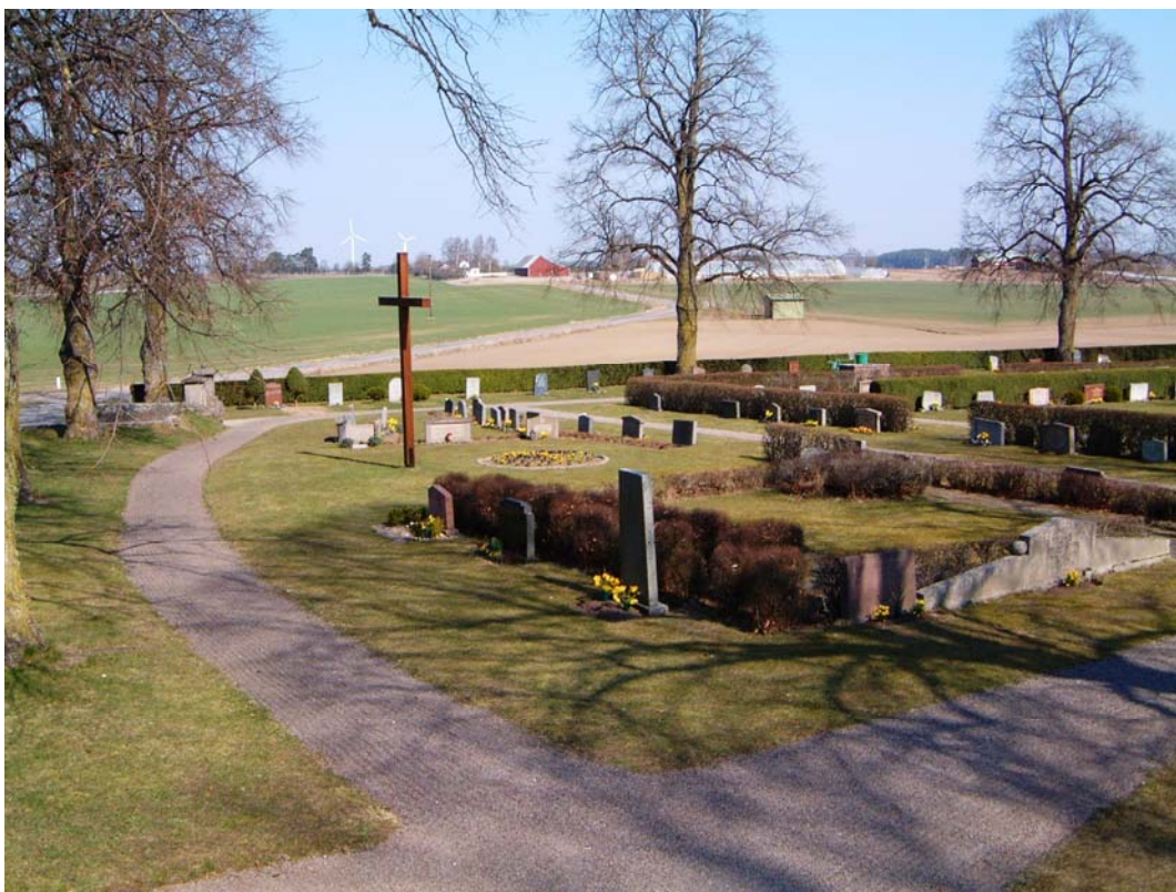
Kvarter F från sydväst.

Kvarteret har en mer oregelbunden form än övriga kvarter. Karaktären är öppen med gravstenar placerade i grupper.