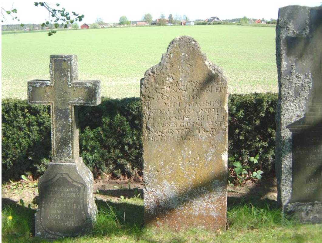
Undanställda gravvårdar öster om kvarter E.

Öster om kvarteret finns en gräsyta med grusgång och här växer en kastanj. Vid häcken i öster står åtta stycken ”museivårdar”, bl a en från 1600-talet.