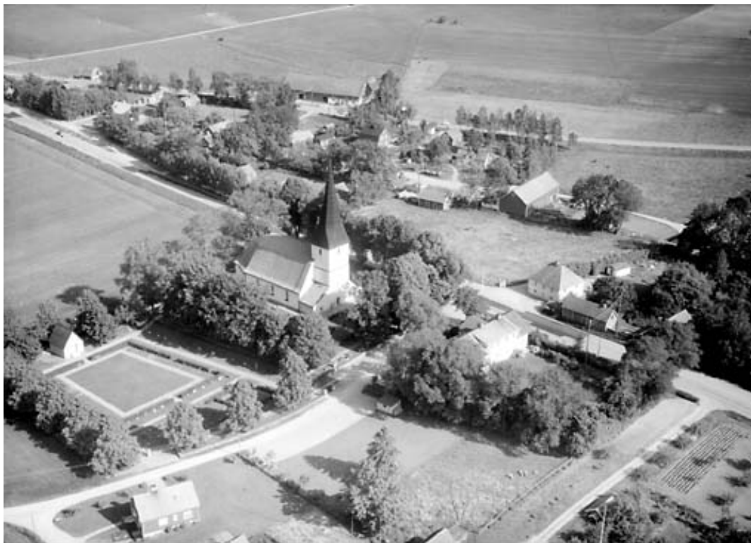
Flygfoto över Viby kyrkby år 1964. De centrala delarna av den nya kyrkogården har ännu inte tagits i anspråk.

1962 upprättade ingenjör Ture Jangvik ritningar till ett bisättningshus, som ligger på nya delens östra sida.