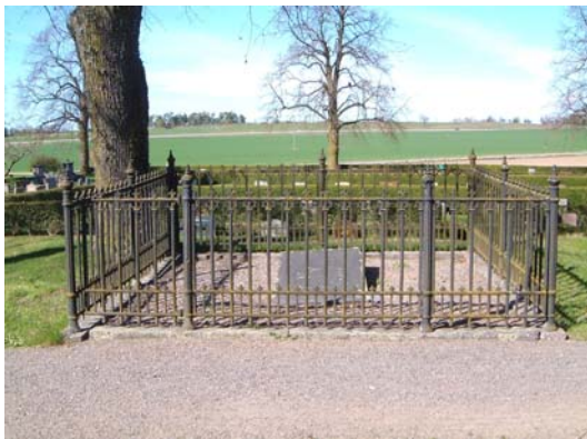
Gravanläggning med gjutjärnsstaket.

En grav med stenram, en grusgrav med gjutjärnsstaket/smidesstaket och en grusgrav med gjutjärnsstaket. Gravläggningar från 1870-tal – 2001, huvudsakligen 1970 – 90-tal.