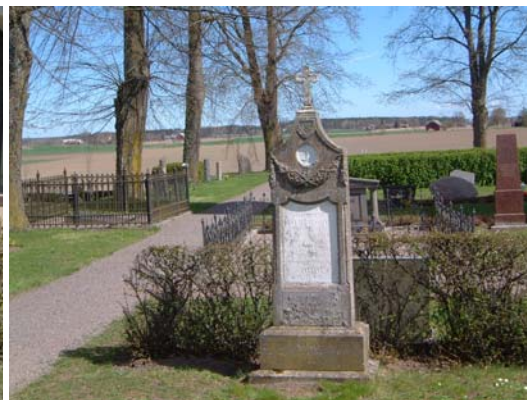
Gravvård från 1867 med medaljong.