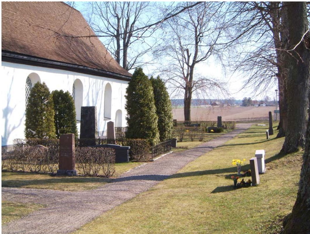
Kvarter B från väster.

Något utglesad karaktär, med några mindre gravvårdar och två större familjegravar.