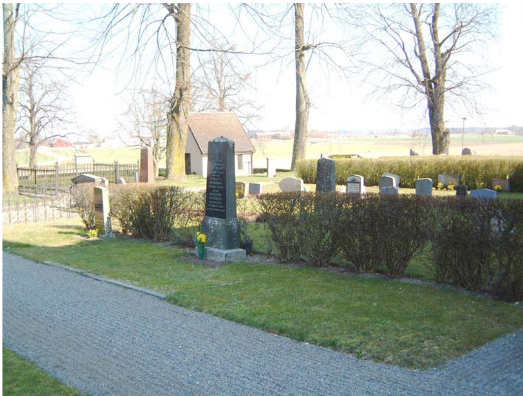
Kvarter C från sydväst.

En enhetlig, något utglesad karaktär med en del större gravar i kvarterets nordvästra del.