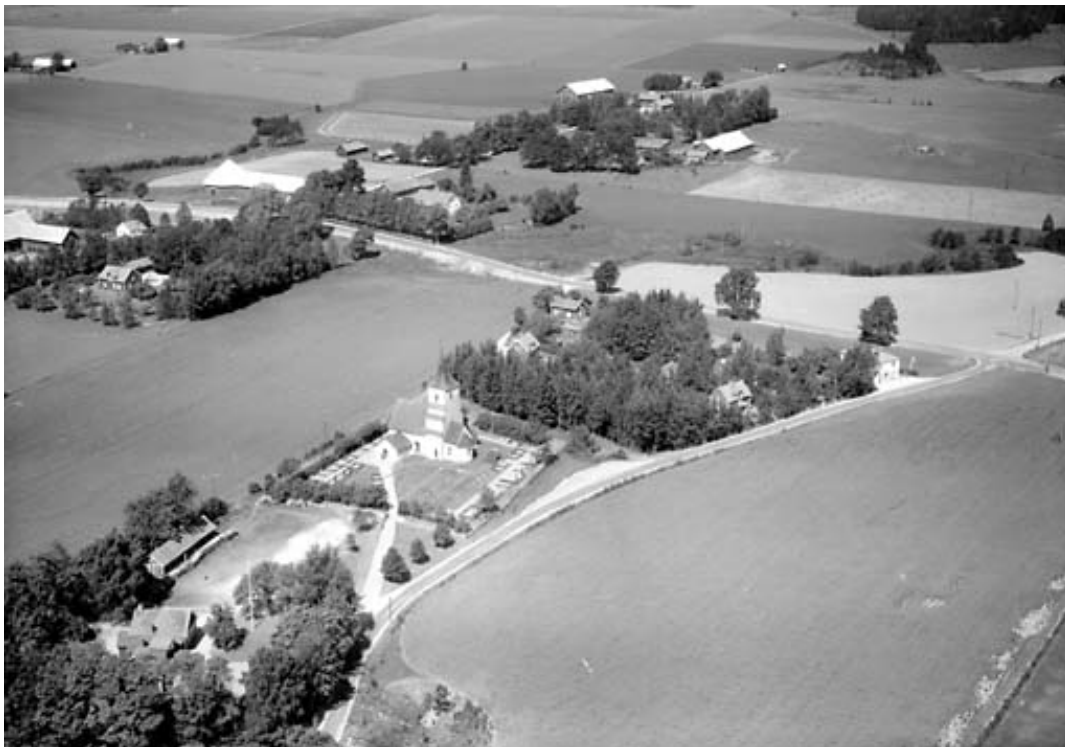
Flygbild från 1959 över Asks kyrka. Trots avståndet syns tydligt de heltäckande grusgravssystemen i kyrkogårdens utkanter, både i norr, öster och väster.