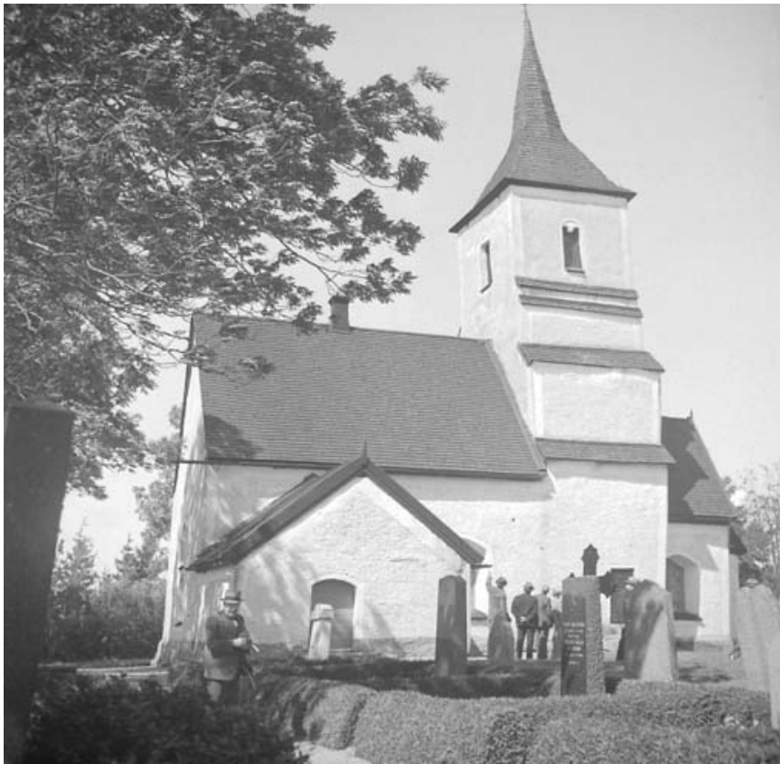
Foto från 1938 i Östergötlands läns museums arkiv. I förgrunden syns gravplatserna 50-55 som då utgjordes helt av häckomgärdade grusgravar.