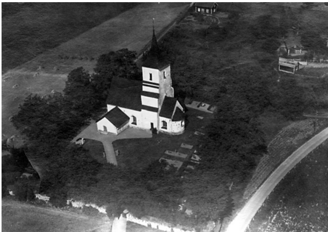
Flygbild över Asks kyrka och kyrkogård från 1935. På bilden syns ett stort antal grusgravar som nu är borttagna, dels norr om kyrkan och dels, närmast i bild, sydöst om kyrkan.

Det finns en tydlig statusuppdelning mellan de ovan beskrivna delarna där de yttre delarna av kyrkogården och den inre SV delen liksom den inre NV delen har tydligt mycket högre status än de inre östra delarna.