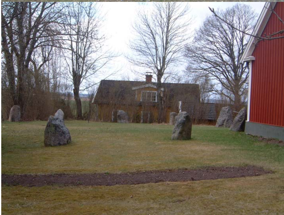
Domarring direkt söder om skolbyggnaden i Ask.

Kyrkogården kan antas sedan medeltiden ha vuxit fram runt den medeltida kyrkan. Kyrkogården är unik också på det sättet att den ursprungliga medeltida kyrkogårdsmuren kommit att bevaras, vilket är mycket ovanligt. I Östergötland finns i övrigt ett knappt 10-tal kyrkor med delar av medeltida kyrkogårdsmur i behåll.