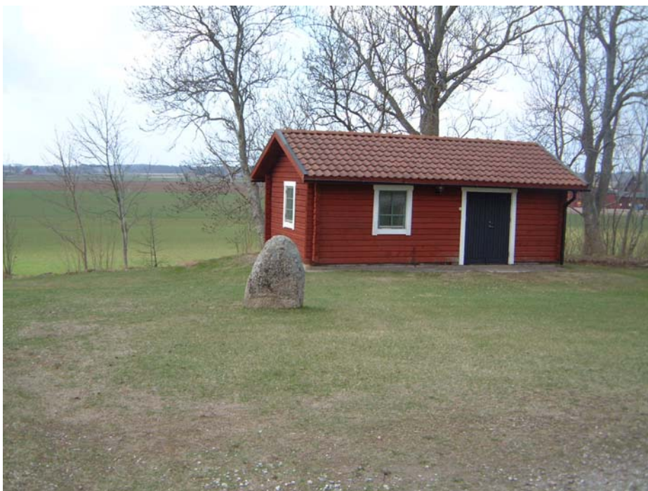
Rest sten norr om skolan och söder om parkeringen vid Asks kyrka.