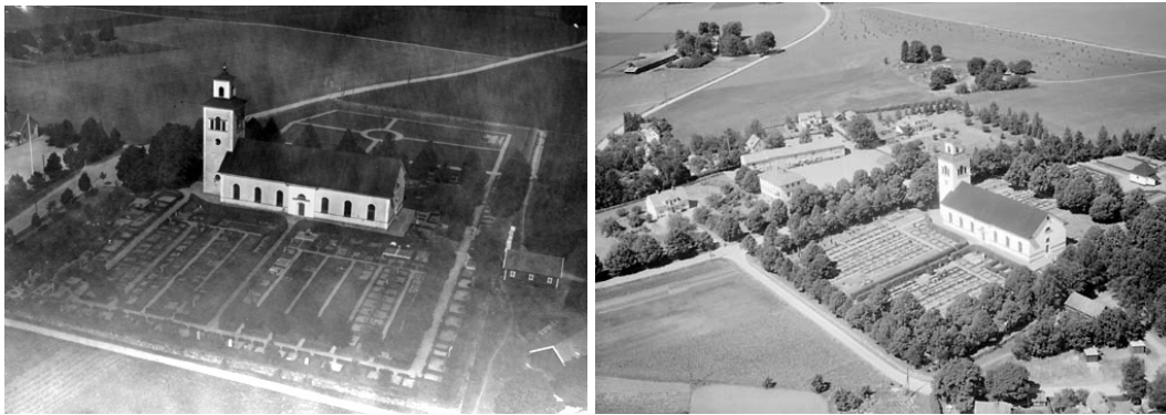
Flygfoto över Klockrike kyrka och kyrkogård från 1935 (t v) och 1959 (t h). På fotot från 1935 syns antalet grusgravar tydligt. Det högra fotot från 1959 visar en tätare trädkrans och i rundeln på kyrkogårdens norra del syns gravkapellet.

1932 ansökte Klockrike församling om tillstånd hos byggnadsstyrelsen att flytta en del av stenvallen som omgärdar kyrkogården, då denna skulle utvidgas. Arbetet med den nya kyrkogårdens utökning påbörjades hösten 1931 och pågick under vintern och våren 1932. I september 1933 invigdes den nya delen som är belägen norr om kyrkogården. Området omfattar ca 60 hektar som är avsöndrat från hemmanet Gislorp.