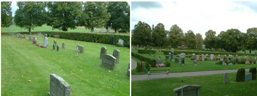
Kvarter C, linjevårdar (t v) och kvarterets mellersta del (t h).