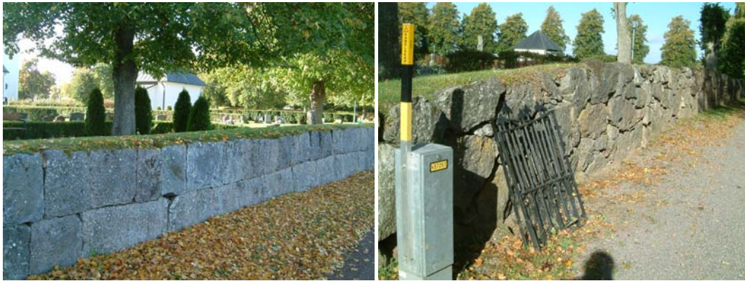
Västra muren (t v) och östra muren (t h).

Muren som omgärdar kyrkogården är en kallmurad halvmur som består av sprängd gråsten. Muren är ca 1,5 m hög och består av tre varv, den är släntad på insidan till ca 0,7-1 m höjd.