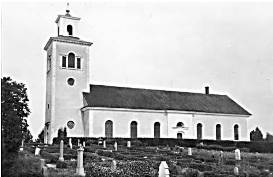
Klockrike kyrka 1931.

Klockrike och Brunneby församlingar uppförde 1826 en gemensam kyrka på en ny kyrkplats ca en kilometer norr om Klockrike medeltida kyrka. Den nya kyrkan uppfördes 1826-1830 efter ritningar av arkitekt Samuel Enander. Den är en av länets största landsbygdskyrkor. Kyrkan uppfördes av sten med rektangulärt långhus med raksluten östvägg, ursprungligen inrymmande två sakristior samt herrskapsläktare och torn i väster. Exteriören präglas av en stram nyklassicism. Fasaderna är putsade och avfärgade i vitt och sadeltaket är belagt med kopparplåt. Huvudingången är via tornet i väster, men ingångar finns även centralt placerade på sydfasaden samt i öster. Interiören har bevarat sin ursprungliga prägel med kyrkorummet som genomströmmas av ljus genom de stora fönsteröppningarna och det höga tunnvalvet. Korväggen med sina rika och ovanliga väggmålningar tillsammans med Bengt Frökenbergs målade "rullgardiner" utgör ett ovanligt inslag bland länets kyrkobyggnader.