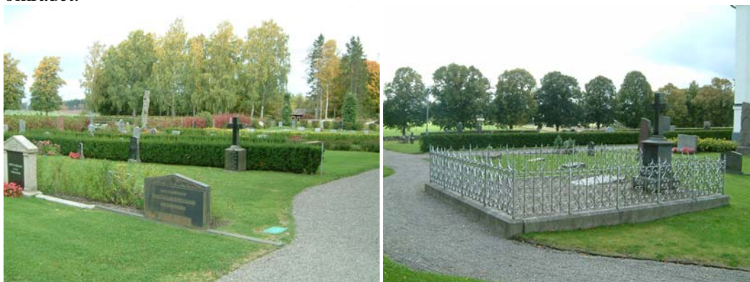
Kvarter A, mellersta delen (t v) och exempel på gravvård i kvarter A (t h).

Öster om koret finns ett reservat med nästan enbart äldre vårdar, från 1830-2003. Det finns en grusgrav med stenram och försilvrat staket. En mindre stenramsgrav med grus, tre äldre kalkstensvårdar, en obelisk och två bautastener finns på området. Det finns också tre borttagna stenramar varav en har kedjan kvar. Flera kyrkoherdar vilar på området.