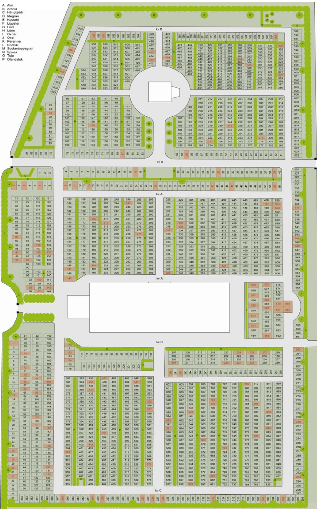
Karta över exempel på gravvård med kulturhistoriskt intresse.