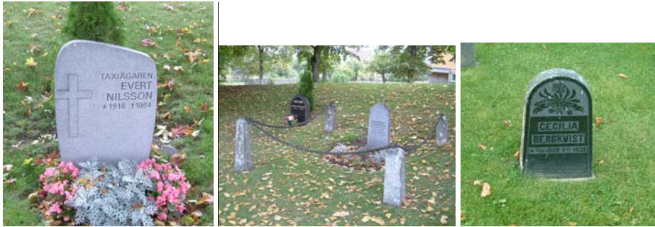
Exempel på yngre och äldre gravvårdar i kvarter C.