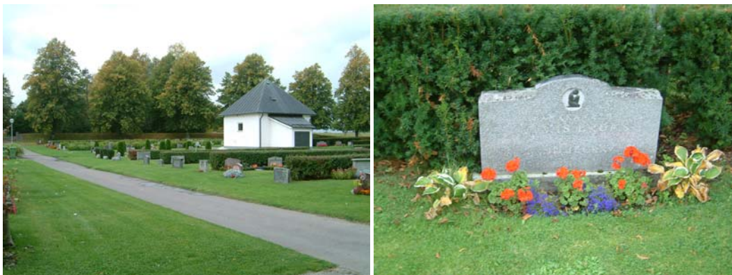
Kvarter B (t v) och exempel på gravvård i kvarter B (t h).

Nästan uteslutande yngre, breda vårdar utan titlar, vanligast förekommande från 1930-2005. Längst i öster finns ett tiotal äldre vårdar kvar, bland dem två metallkors från slutet av 1930-talet. I övrigt är allt utbytt under de senaste 30 åren.