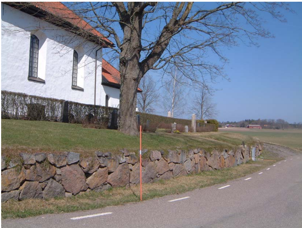
Kvarter B. Rader av gravar utanför den omgivande häcken.

Väster om kvarteret ansluter det till kvarter A och C. I norr och öster ligger åkermark. I söder om kvarteret ligger en parkeringsplats i breddningen av landsvägen. Dessutom ingår två rader gravar utanför huvudhäcken i sluttningen ned mot kyrkogårdsmuren i öster.