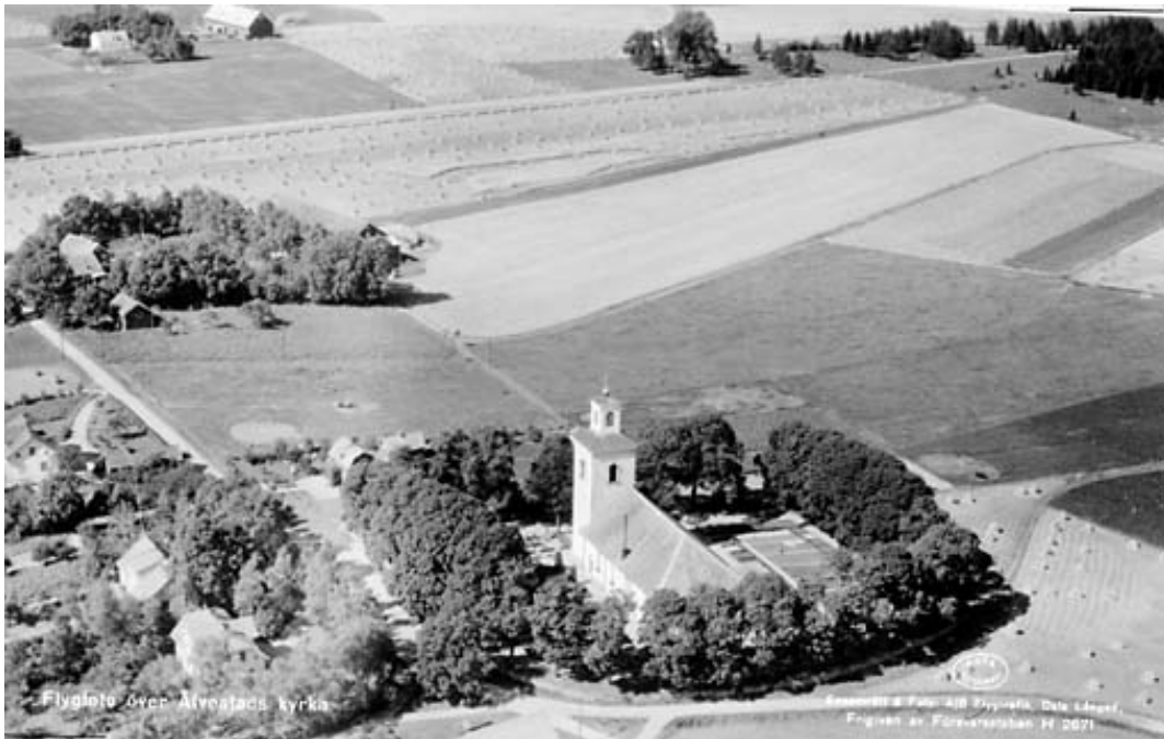
Flygbild över Älvestad 1939 ur Östergötlands läns museums arkiv. På grund av den kraftiga trädkransen döljs det mesta av kyrkogården. Synligt är framför allt kvarter C norr om kyrkan. Här verkar gravarna vara arrangerade i raka rader utan häcksystem mellan.

En arkeologisk förundersökning utförd av undertecknad 1993 innebar att ett VA-schakt drogs in under kyrkmuren från söder strax öster om murens SV hörn. Därefter följdes kyrkogårdens grusgång österut mot tornet, för att sedan runda detta och ansluta till den nybyggda toaletten i långhusets nordvästligaste del. På hela denna sträcka berördes endast grova fyllnadsmassor, ibland av blockstorlek, och inga spår av gravar syntes. Endast närmast tornet framkom en sådan, som dock kunde undvikas. Detta bör innebära att nuvarande kvartersindelning varit i bruk ända sedan utfyllnaden skett. Eventuella medeltida eller äldre gravar ligger i så fall kvar djupt under denna utfyllnad.