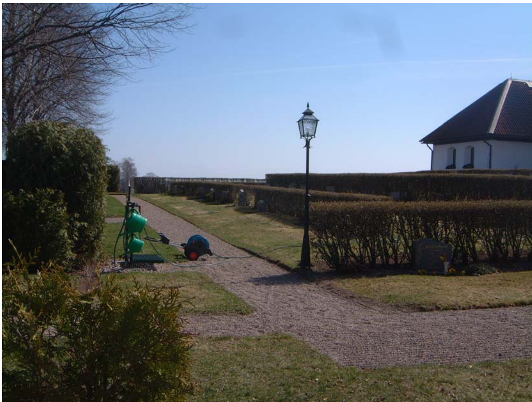
Kvarter C, nordvästra delen

Väster om kvarteret ansluter det till kvarter A. I norr ligger öppen åkermark. I öster ansluter det till kvarter B och i söder direkt till kyrkan.