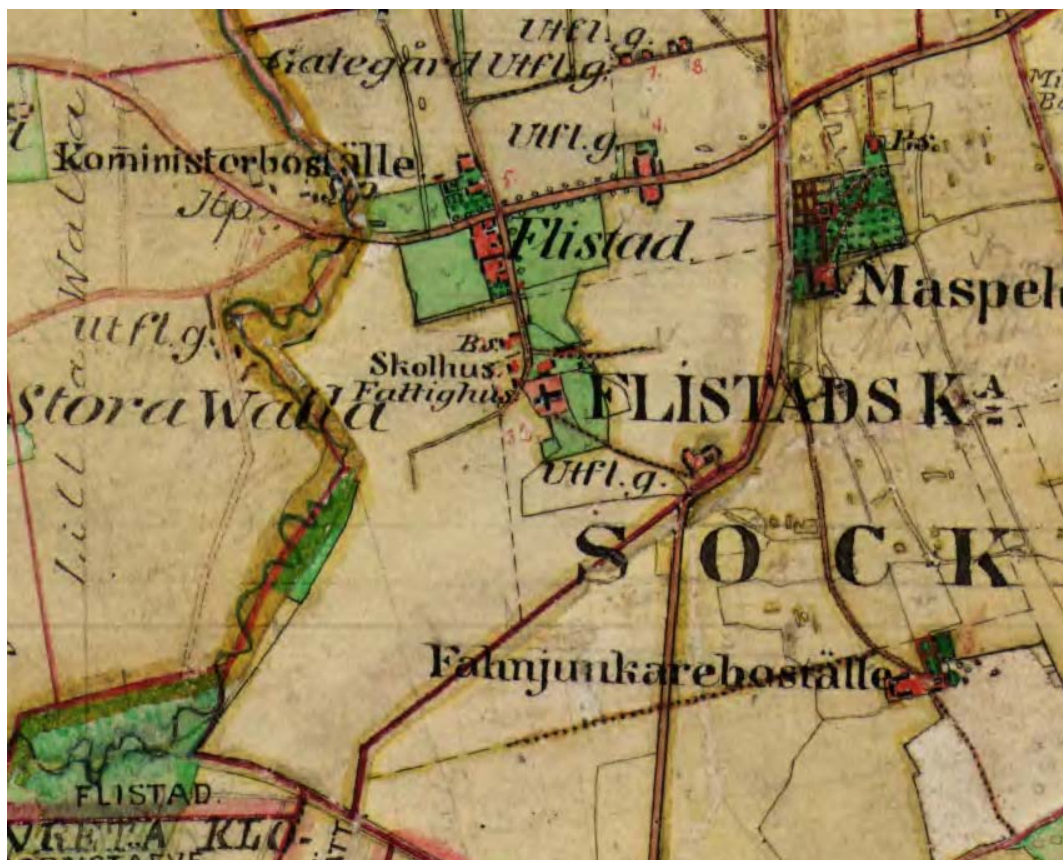
Flistad på häradskartan från 1868-1877, blad Flistad.

Flistad kyrka är belägen ca en mil nordväst om Linköping på en moränhöjd med vida utblickar över det fornlämningsrika landskapet. En allé kantar kyrkans uppfartsväg från landsvägen. På vägens västra sida är skolbyggnader och församlingshem placerade och på den östra lärarbostad och privatbostäder. Den äldsta skolbyggnaden utgörs av en reveterad byggnad i en våning med frontespis, uppförd i mitten av 1800-talet och används nu som församlingshem. En ny skolbyggnad uppfördes 1920 och utgörs av en stor reveterad tvåvåningsbyggnad i en enkel 20-talsklassicism. Skolan nedlades 1984 och är nu i privat ägo. Även den f d lärarbostaden är i privat ägo och utgörs av en stor reveterad byggnad, som vid uppförandet 1949 inrymde fyra lägenheter. Den f d prästgården är belägen norr om landsvägen vid den gamla byplatsen och består av en reveterad mangårdsbyggnad i en våning från 1838. I samband med att byn laga skiftades 1836 utflyttades tre gårdar. Kyrkbyn innefattar idag två gårdar.