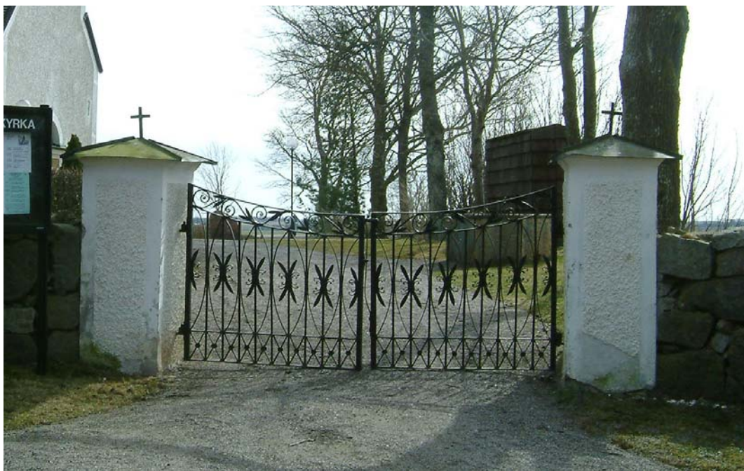
Ingång till kyrkogården.

Väster : ingång i nordväst. Pargrind i järn mellan firsidiga putsade stolpar med falsat plåttak med kors. Grinden är av gjutjärn och ornerad med blad, kryss och löpande hund i tre nivåer. Grindstolparna och grinden härstammar från 1830-talet.