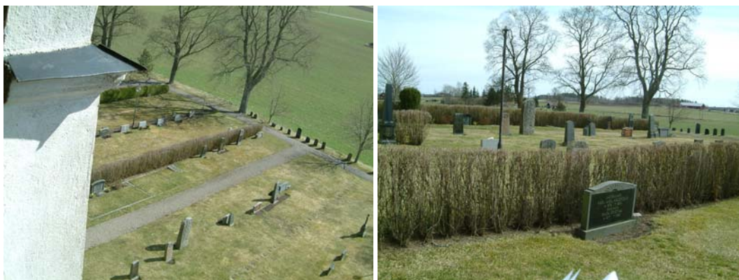
Kvarter A (t.v.), bilden är tagen från kyrktornet, och kvarter B (t.h.).

Kvarter A: en nedklippt häck växer parallellt med den västra muren, en oxel ca 2,0-3,0 m hög. Längs den norra muren växer en ca 3,0 m hög syrenhäck. Kvarterets rygghäckar utgörs av tre oxbärshäckar i östvästlig riktning, två är ca 1,3 m höga och den tredje är ca 0,5 m hög. En idegran är ca 1,2 m hög i östvästlig riktning. Två rygghäckar i nordsydlig riktning, en tuja ca 0,7 m hög samt en tuja under plantering. Två björkar växer i kvarteret. En rosenbuske växer vid den östra muren i anslutning till det nordöstra hörnet. En hög ask växer vid den norra muren i anslutning till det nordöstra hörnet.