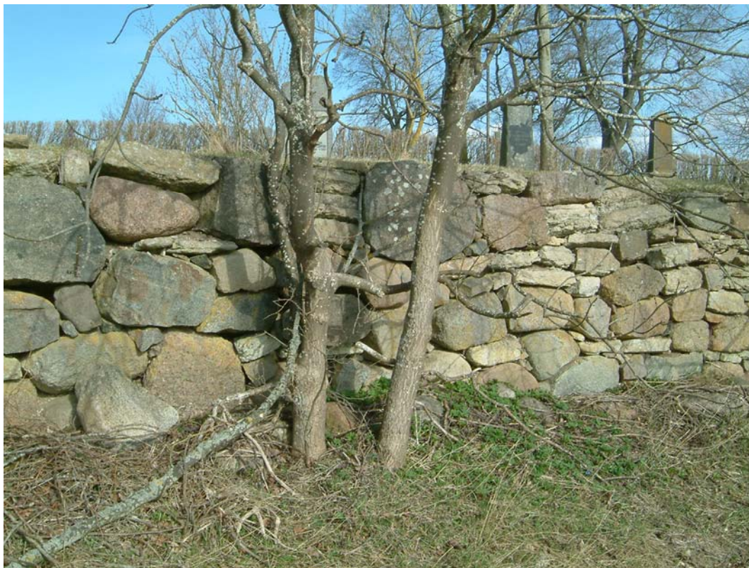
Skarv i västmuren mellan två helt olika murningstekniker och material.

En jämförelse mellan storskifteskartan från 1767 och lagaskifteskartan från 1836 visar att kyrkogården utvidgats. Troligen har detta skett vid omläggandet av kyrkogården på 1830-talet.