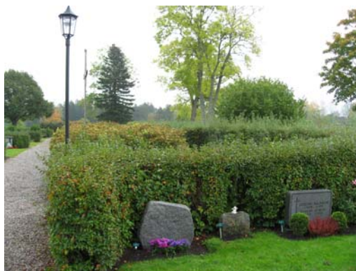
Ett av de mindre kvartererna längs södra sidan.