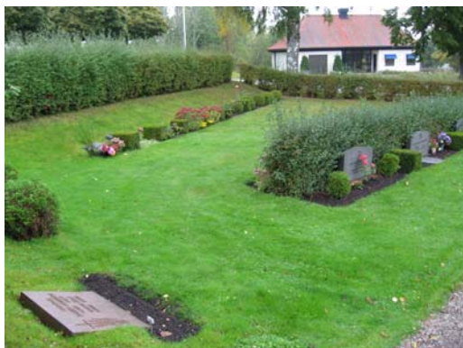
Kvarter B, mot norra sidan

mellan kvarter C och E-F. Inom kvarter D finns två rygghäckar av oxbär. Rygghäckarna i dessa kvarter är ca 0,8-1,1 m höga. Häcken av brudspirea är högre, ca 1,5 m hög. Intrycket av att häcken är hög förstärks också av att marken är något högre där häcken växer. Inom kvarter C finns fyra rygghäckar av liguster och inom kvarter E-F finns fem rygghäckar av oxbär. Längst ned mot öster går en häck av oxbär över hela sidan. De mindre kvartererna på den södra sidan har dels en yttre häck av brudspirea, och dels häck inom kvarteret av ölandstok och liguster. För övrigt finns på flertalet ställen olika formklippta buxbom/tuja buskar mellan gravarna.