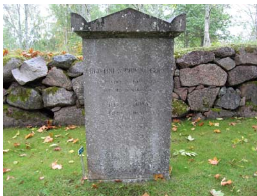
Kvarter YN, nr 16 är en ovanlig gravvård. Till vänster, en gravvård i kalksten, nr 20ö från 1861.

Titlar på gravvårdar säger en del om näringsliv och social struktur i en socken. Titlarna på gravvårdarna i Landeryd varierar. I dessa kvarter finns kyrkliga titlar så som Kantorn, Kyrkoherde, Pastor, Prosten och Organisten. De vanligaste titlarna är Hemmansägaren och Lantbrukaren. Exempel på militära titlar är Kaptenen, Öfverste och Major. Exempel på andra yrkestitlar är bland annat Snickaren, Kassör, Åkeriägaren, Slussvaktaren, Gymnastikdirektörerna.