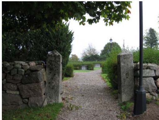
Öppning i den östra muren mot söder