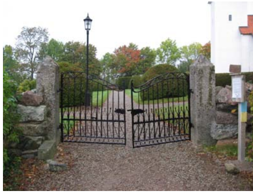
Grind i den södra muren mot väster