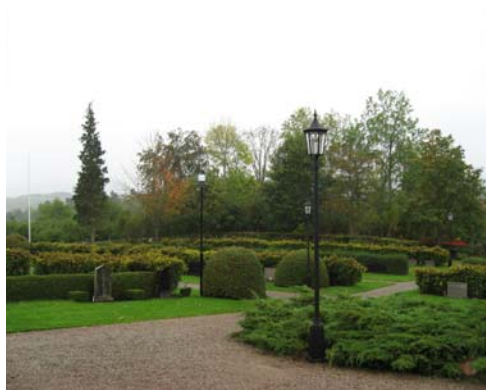
Kvarter 1, i bakgrunden den östra muren. Kvarter 2-4.