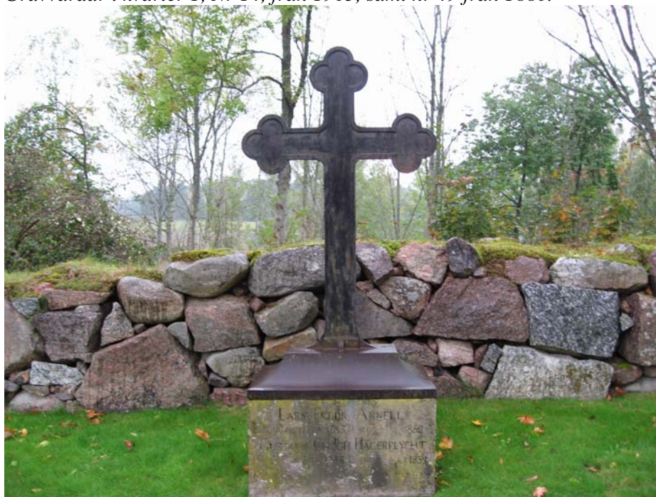
Kvarter YN, nr ÖLM 3 är den äldsta gravvården ute på Landeryds kyrkogård. Den äldsta dateringen är 1839.