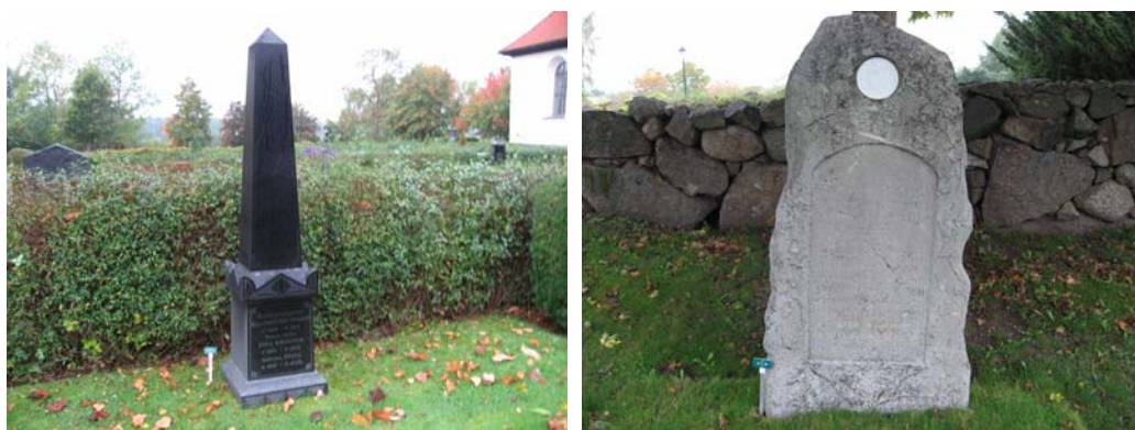
Gravvårdar i kvarter 1, Nr 14, från 1905, samt nr 49 från 1880.

Det är i denna del som de äldsta gravvårdarna finns. Men flertalet av gravvårdarna är tillkomna under det senaste halvsekle. Dessa gravvårdar är relativt likartade, med breda, låga gravstenar i olika typer av granit. Många av dessa gravar har inte något årtal utskrivet. Flertalet av dessa gravvårdar är så kallade familjevårdar. Längs med den östra muren, kvarter 1, och längs den norra muren, kvarter YN, finns de äldsta gravvårdarna. Flera av dessa är högresta, men även äldre hållar/liggare finns. I kvarter YN finns även flera modernare gravvårdar, låga/breda graniter, men de som står i jämnhöjd med kyrkan, är alla av äldre art. Enligt äldre fotografier har det på den här delen av kyrkogården funnits ett flertal grusgravar som hägnades in av låga häckar av buxbom. En grav hade också en järnsmides-/gjutjärnsomgårdning. Inga av dessa grusgravar finns längre kvar.