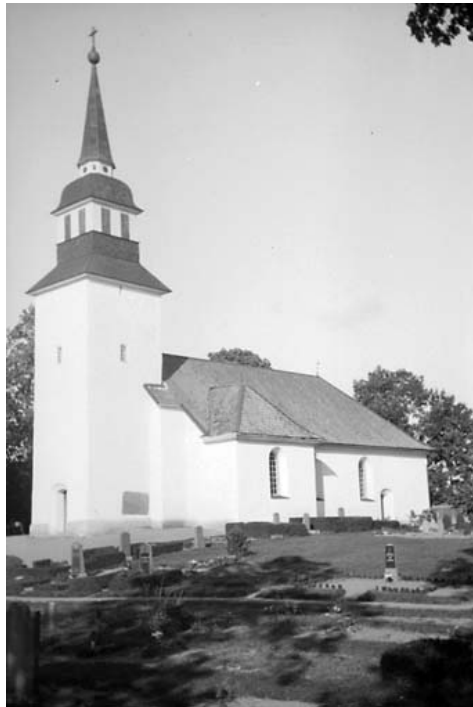
Samma vinkel, okänt årtal

Att det tidigare funnits flera grusgravar runt Landeryds kyrka, visar även fotografiet nedan från 1935. Dessa grusgravar finns inte längre kvar. Grustäckta gravar var tidigare mycket vanliga på länets kyrkogårdar, men ofta har de som här, lagts om till gräsgravar.