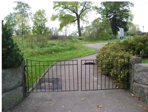
Grind i den östra muren, nya delen