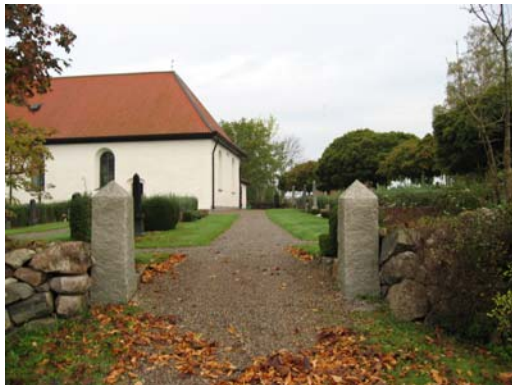
Öppning i den södra muren, mot öster