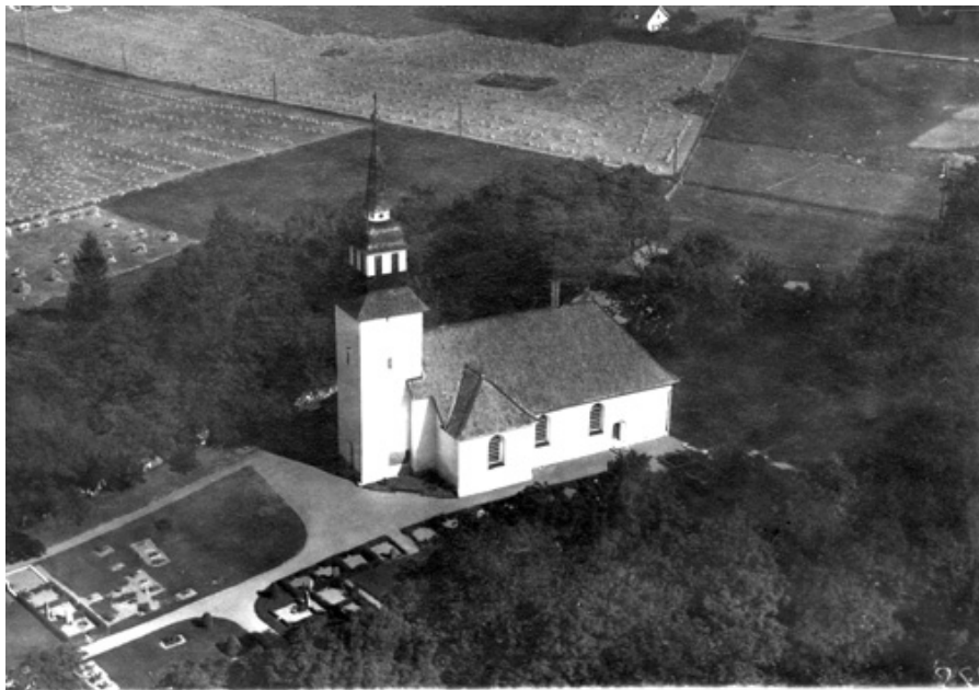
Flygfoto från 1935 ur ÖLMs samling

Att det tidigare funnits flera grusgravar runt Landeryds kyrka, visar även fotografiet nedan från 1935. Dessa grusgravar finns inte längre kvar. Grustäckta gravar var tidigare mycket vanliga på länets kyrkogårdar, men ofta har de som här, lagts om till gräsgravar.