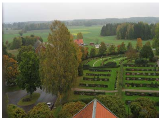
Österut över den nya delen av kyrkogården