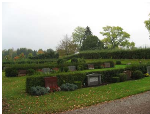
Kvarter C. Bakom den höga häcken i bakgrunden finns kvarter E-F.