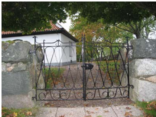
Grind i den östra muren mot norr