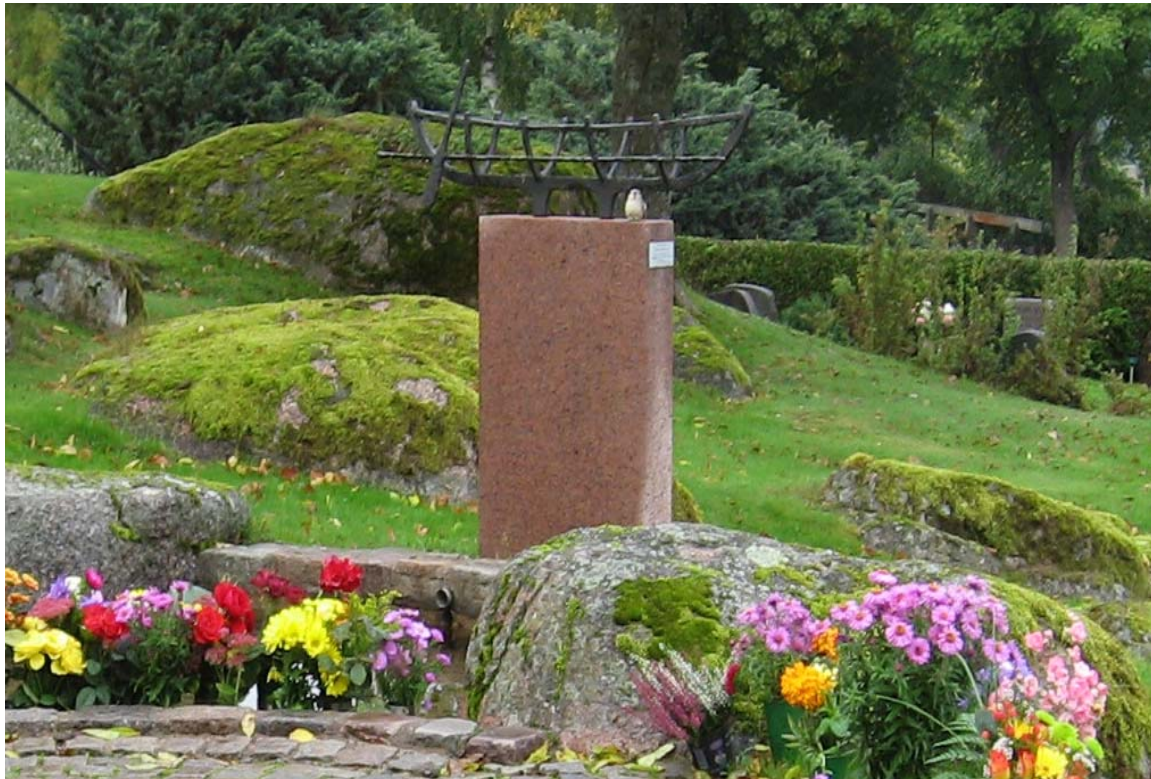
Minneslunden på Landeryds kyrkogård.