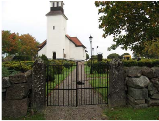
Grind i den västra muren