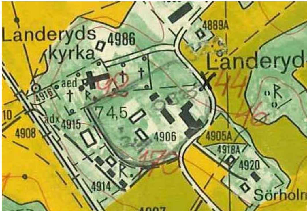
Utsnitt ur ekonomiska kartans blad 085 49, Landeryd, 1982.