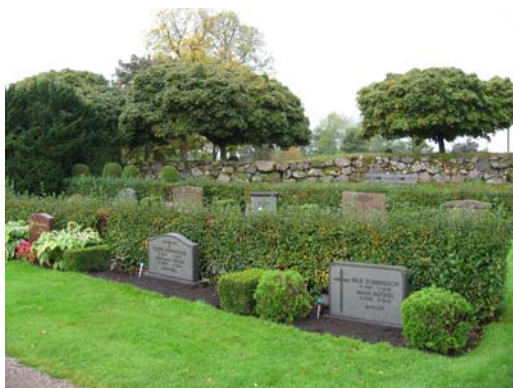
Kvarter D, och den östra muren