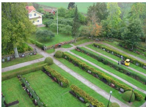
Kvarter 2 och 3 på den gamla delen

Den äldre delen av kyrkogården inramas av en äldre bogårdsmur och omges av en trädkrans. Det är här de äldre gravvårdarna återfinns. Kyrkogårdens båda delar påminner om varandra i och med att de båda karaktäriseras av rygghäckar. Det som främst skiljer de båda åt är kvarteret längst åt öster, kvarter L. Det är uppbyggt i terrasser med låga kvaderhuggna murar.