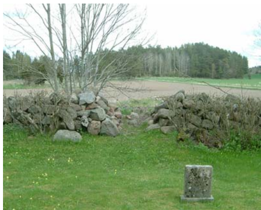
Av östra porten återstår endast en enkel öppning i muren. Ingen väg leder längre åt detta håll.