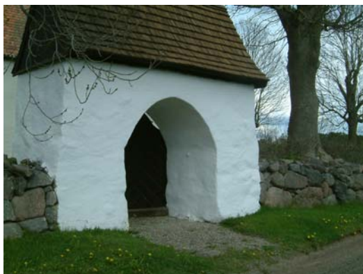
Södra porten med dess bevarade mäktiga stiglucka.