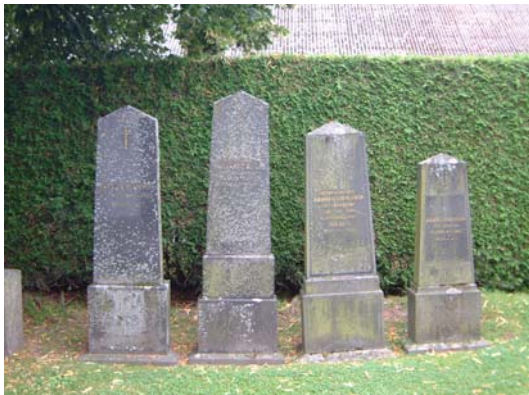
Gravårdar i svart granit 1896-1925.