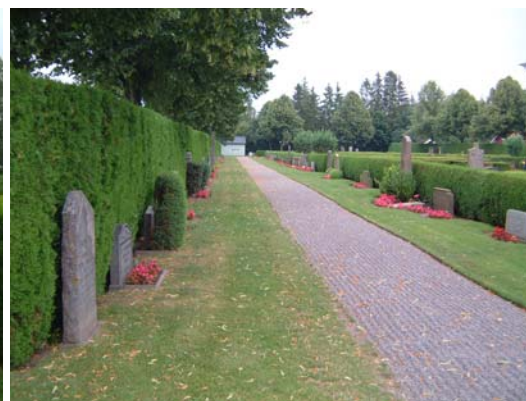
Kvarter A, norra delen från väster.