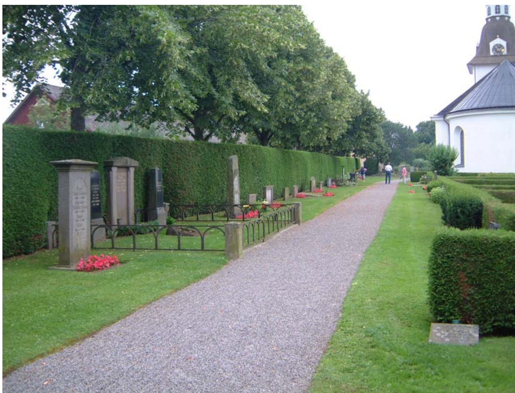
Kvarter C från öster.

Blandad karaktär. Kvarteret är mycket oregelbundet med en lång utlöpare utmed södra muren och korta rader med gravar söder om kyrkan. Många gravvårdar är sentida, låga och breda, men det finns ett relativt varierat bestånd av gravvårdar, varav två stora omgärdade familjegravar. ”Tiondeboden” ligger i kvarteret.