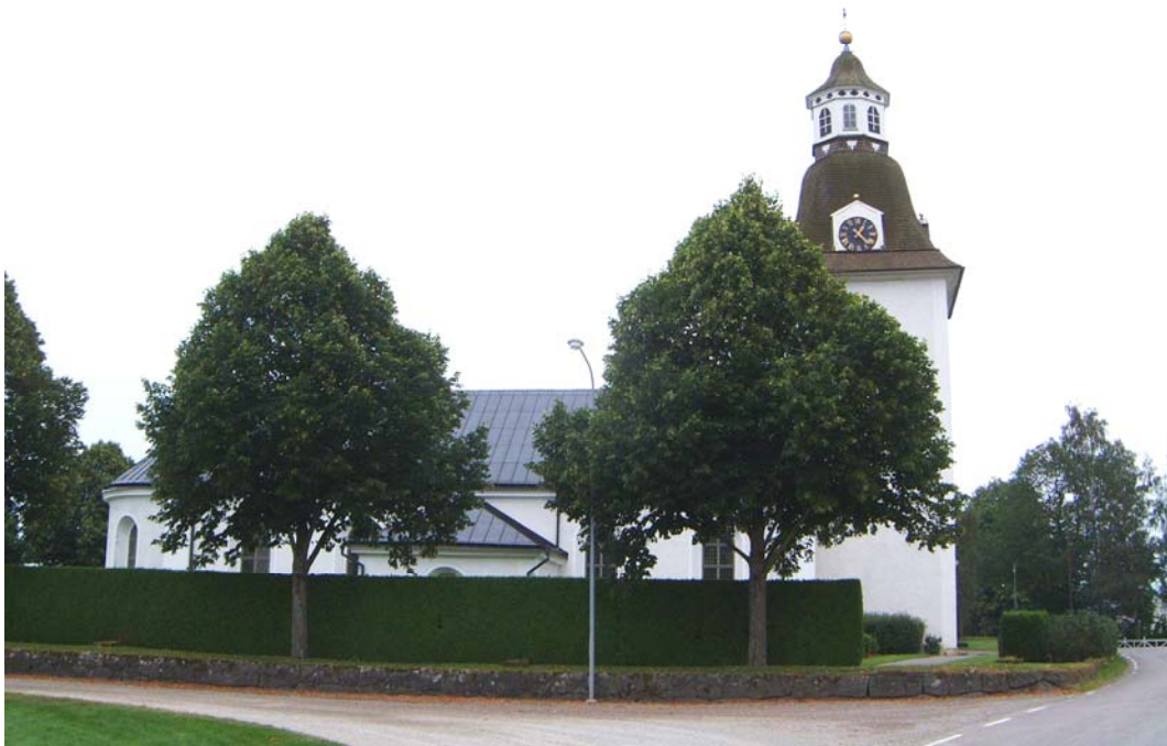
Kyrkogården från norr.

Kyrkogården får sin speciella karaktär av de höga tujahäckarna, som går i nord/sydlig riktning i kvarter B öster om kyrkan och den höga tujahäcken vid kyrkogårdsmuren. Häckarna delar in kyrkogården rumsligt och bidrar till ett relativt strikt helhetsintryck. Intrycket blir speciellt märkbart på den stora del av kyrkogården som ligger öster om kyrkan. I trädkransen ingår relativt unga lindar. De har ersatt de träd man kan se på äldre fotografier. På flera ställen står gravstenarna i grupper och kan ge intryck av att det rör sig om familjegravar utan att det är fallet.