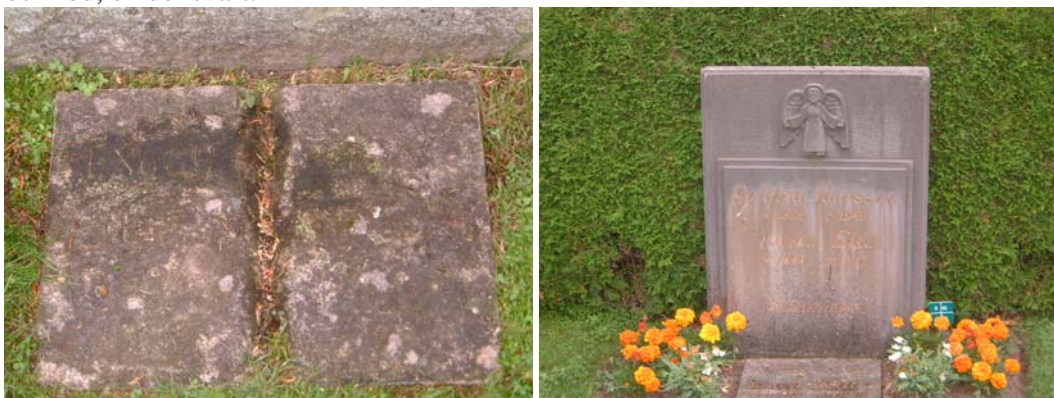
Två gravvårdar i kalksten: en s k uppslagen bok från 1881 och en gravvård från 1949.

I kvarterets centrala del är det främst låga och breda gravvårdar. I östra delen finns några högre vårdar från omkring 1900 och en vård i form av en uppslagen bok. Gravläggningar från omkring 1900-2001, i huvudsak 1960-1990-tal. Här märks även särskilt två gravvårdar i kalksten från 1950-talet. Huvudsakligt material är granit - grå och röd, en del svart.