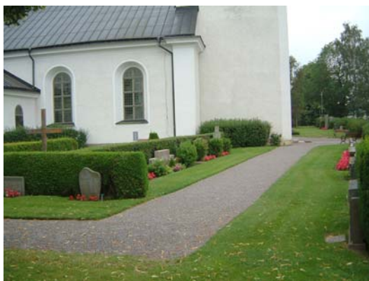
Kvarter A, västra delen från norr.

Kvarteret är mycket oregelbundet med en lång utlöpare utmed norra muren och en rad gravar norr om kvarter B. Många gravvårdar är sentida, låg och breda, men det finns ett relativt varierat bestånd av gravvårdar.