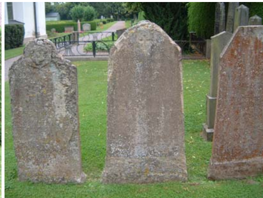
Kalkstensvårdar 1600-tal, 1849 och 1850.