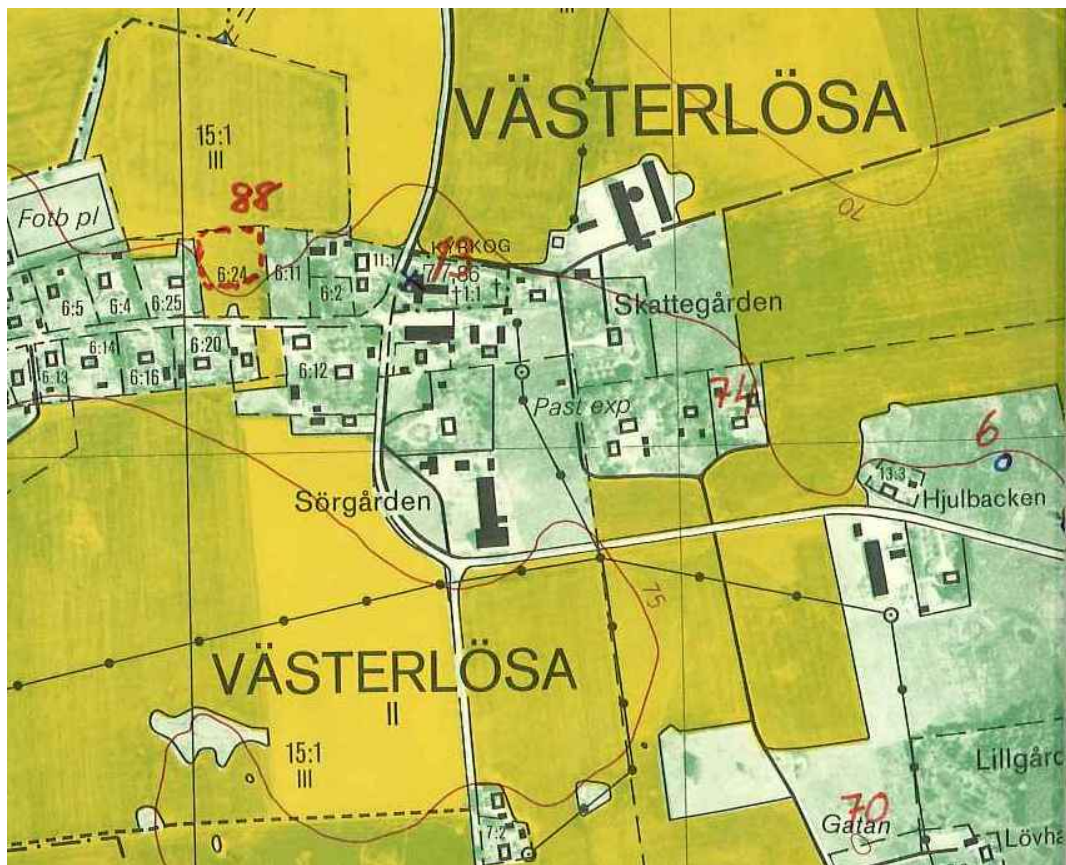
Utsnitt ur ekonomiska kartans blad 085 54 Västerlösa, 1982. RAÄ:s fornlämningsnummer 13 står i fornlämningsregistret upptaget som en runsten. Senare uppgifter visar att det är en del av ett förkristet gravmonument.