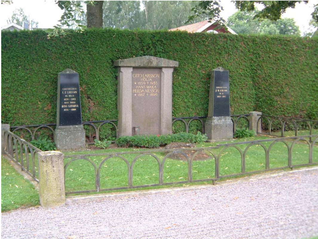
Gravvårdar med årtal från 1887-1933. Troligen är staketet tidigast från 1930-talet.