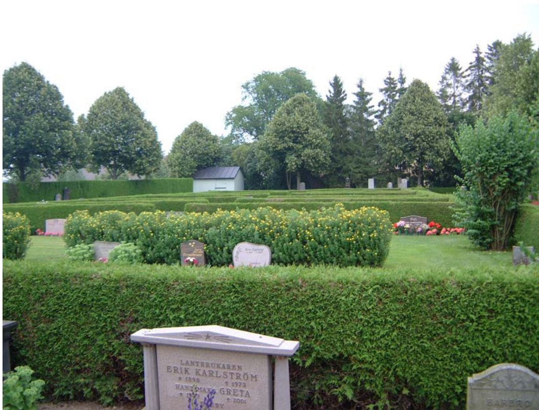
Kvarter B från väster.

Tujahäckar i norr och söder och en mindre tujahäck och mur i öster.