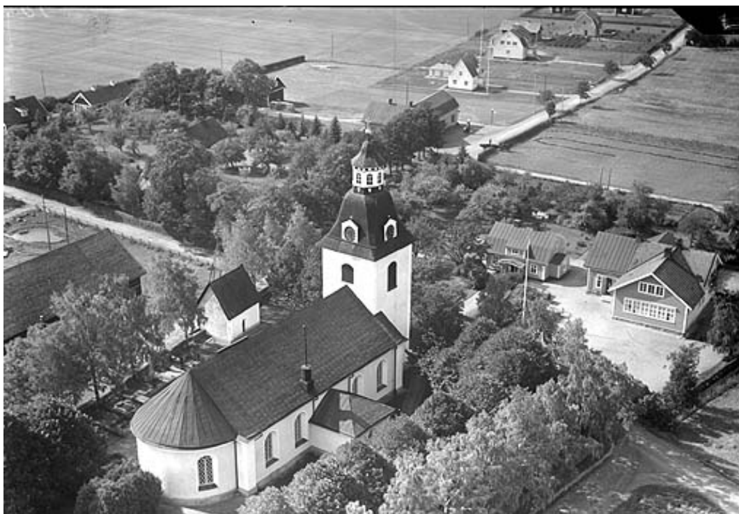
Flygfoto från 1935. Fotografiet visar en tät trädkrans runt kyrkogården och troligen är "tiondeboden" putsad.

En odaterad tidningsartikel talar om att man önskade utföra en utvidgning av kyrkogården som ett statskommunalt reservarbete.