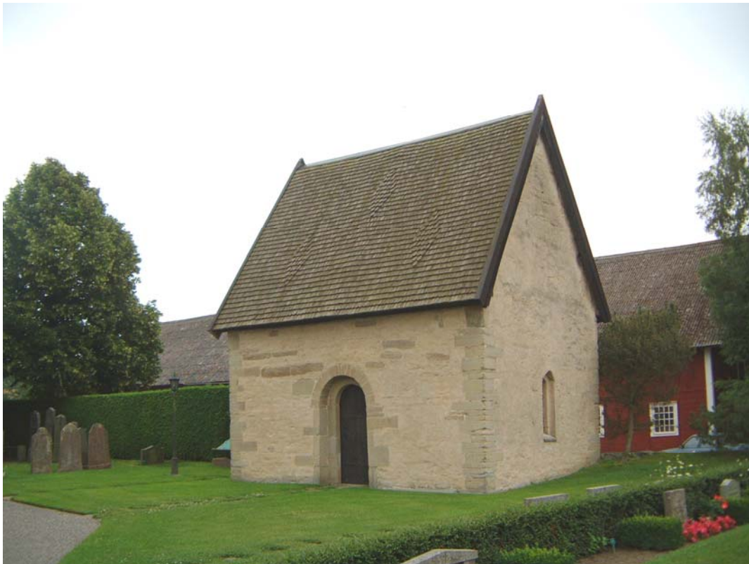
Den eventuella tiondeboden, ombyggd till gravkapell på 1950-talet, från nordväst.