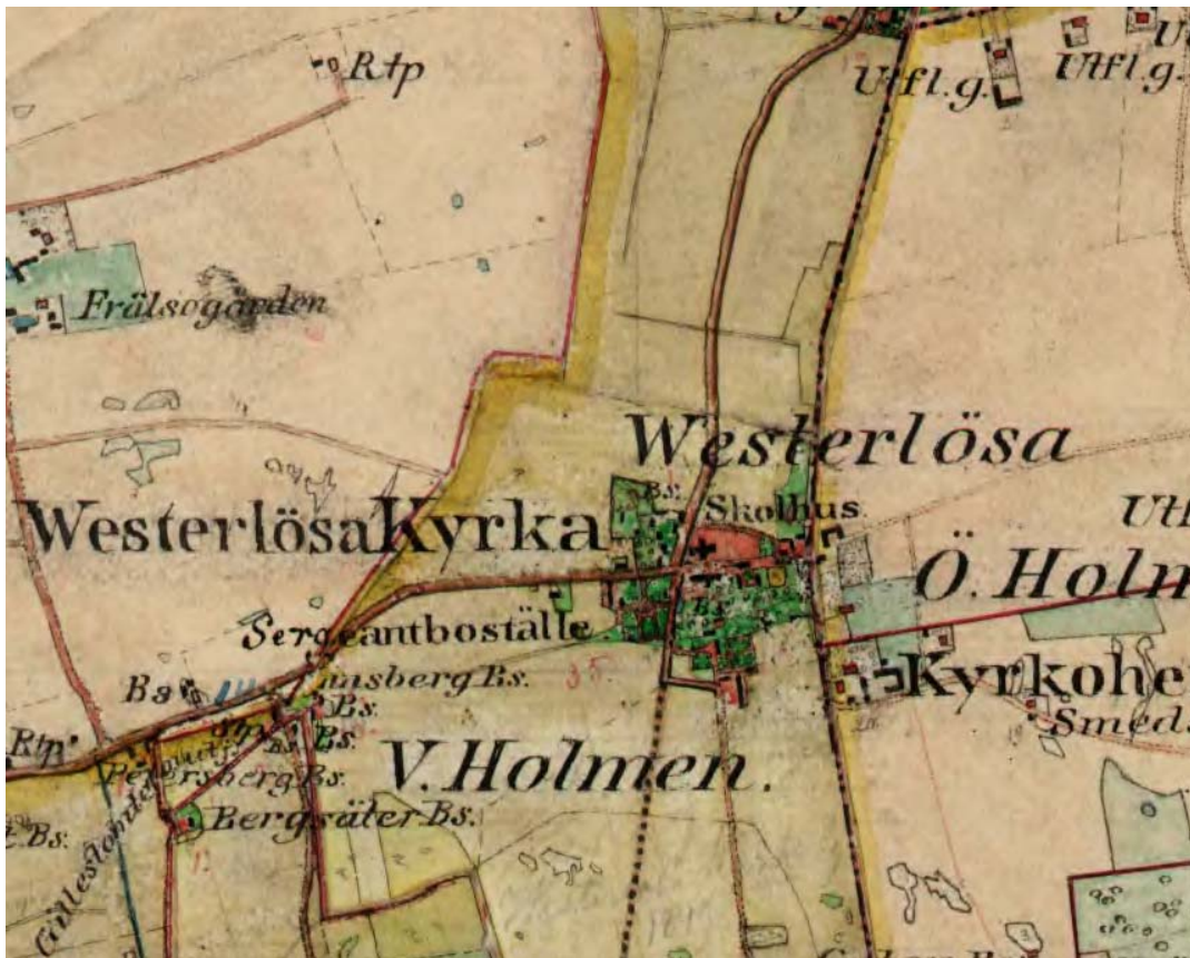
Utsnitt ur häradsekonomiska kartan 1868-77, Lagerlunda.